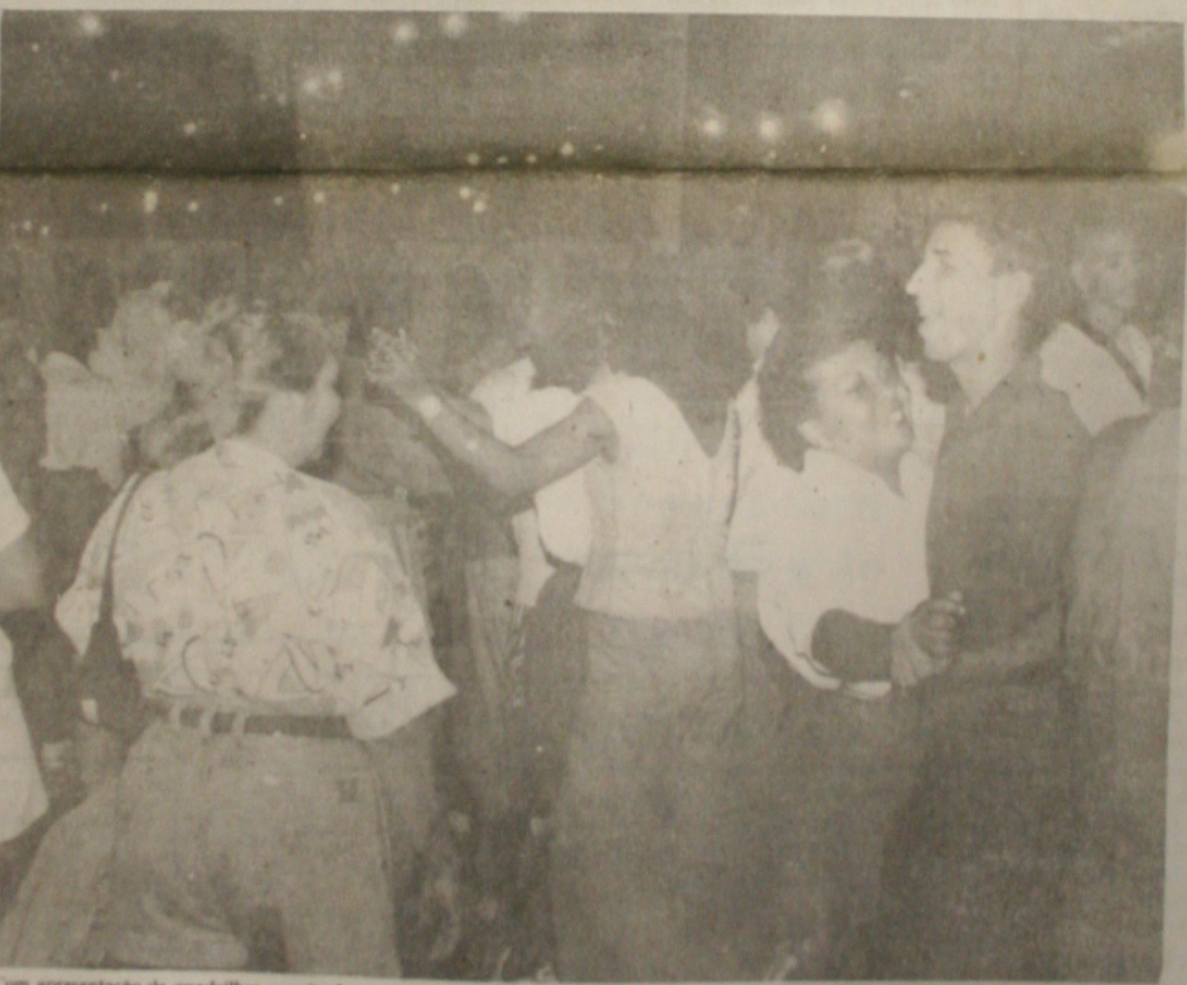
Com apresentação de quadrilhas e muito forró, o Forrocaju atraiu milhares de pessoas ontem

O presidente Fernando Henrique Cardoso vai expor hoje, durante a quarta reunião ministerial, as diretrizes do governo para a desindexação da economia, que começa em 1º de julho, primeiro aniversário do Plano Real. Cardoso quer que os ministros da área econômica expliquem ao Congresso as novas medidas. Fernando Henrique fará um pronunciamento em cadeia de rádio de televisão, na próxima semana, para apresentar um balanço do primeiro ano do real e esclarecer à população a próxima etapa do plano. O encontro de Cardoso com seus ministros começa às 8h30 na Granja do Torto.