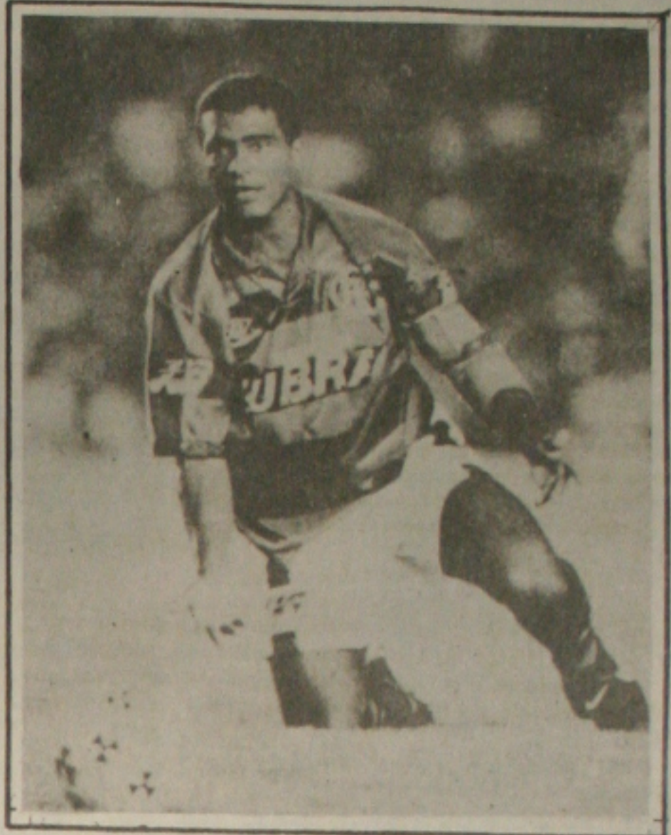
Romário estará presente domingo no Batistão.

Por outro lado, ao tempo em que tem como certa a presença de Romário no Batistão, o presidente Motinha está ultimando os detalhes, para a realização da partida. A venda de ingressos, com preços promocionais, será encerrada hoje e o presidente acredita que domingo não deve haver ingressos para venda nas bilheteiras do estádio. Ontem Motinha se reuniu com membros da Polícia Civil, quando tratou dos detalhes da segurança e acesso ao estádio e hoje a reunião será com o comandante do policiamento da capital, quando será definida a forma de segurança a ser exercida por membros da PM, dentro e fora do estádio.