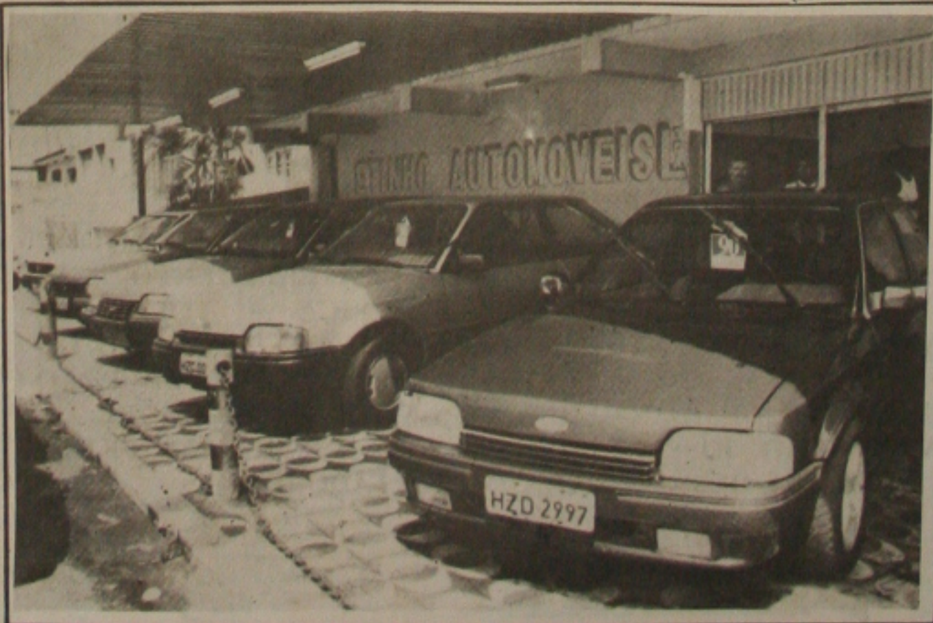
O preço do carro usado é desvalorizado com as promoções do zero-quilômetro.