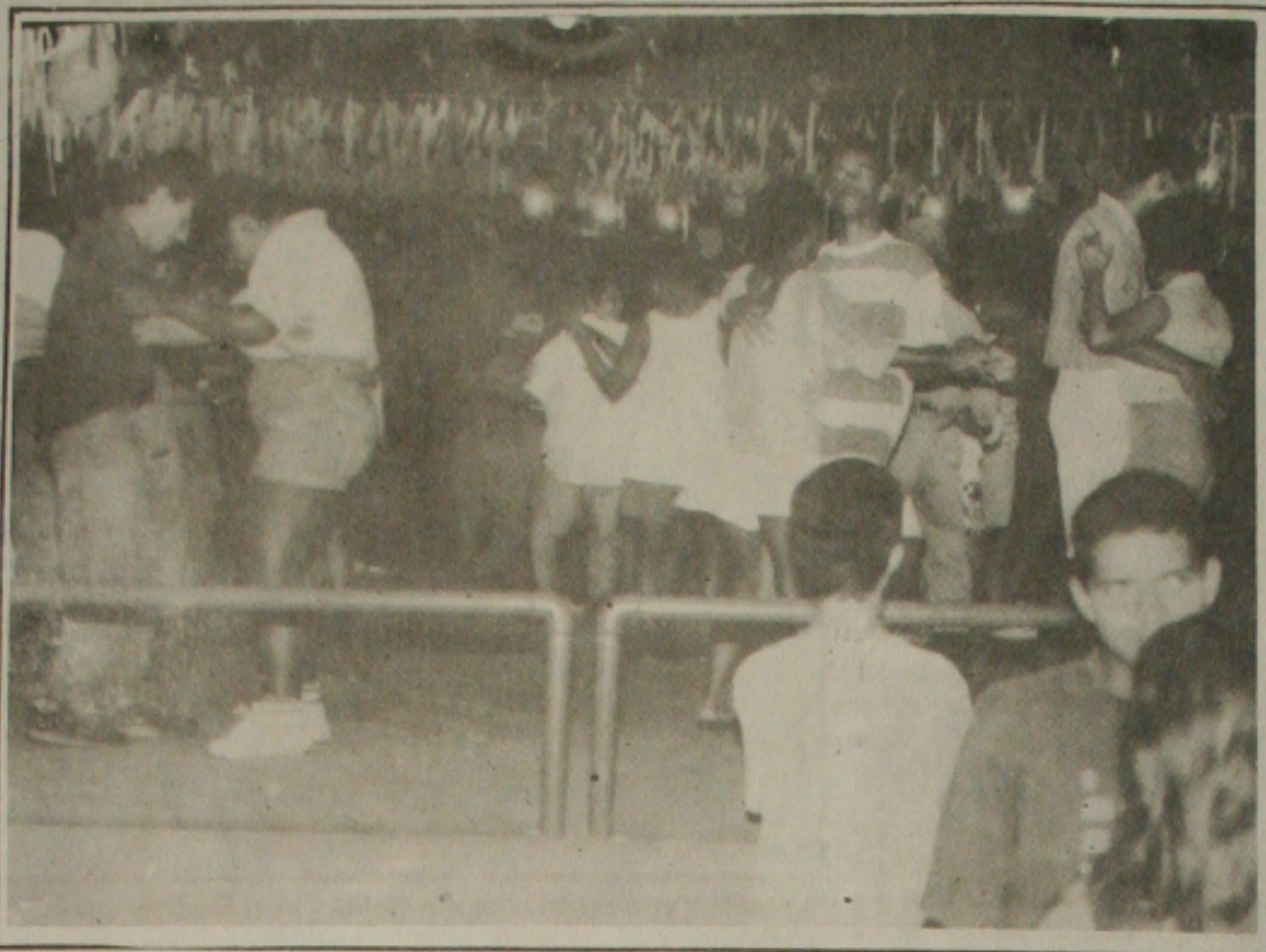
Os festejos de São Pedro reunirão hoje milhares de sergipanos e turistas.

16:00 às 19 horas - Gerusa - Cavalcada p/ Cidade; 21:00 às 23 horas - Forró Cuscuz com Leite; 23 às 01 hora - Luiz Paulo; 01:00 horas às 03 horas - Nando Cordel; 03 às 05 horas - Luiza Lu; 05 às 07 horas da manhã - Jorge Ducci; 07 às 09 horas da manhã - Lourival do Acordeon e Café da Manhã (Comunhão do Forró); 09 às 11 horas da manhã - Trio Asa Branca - Encerramento.