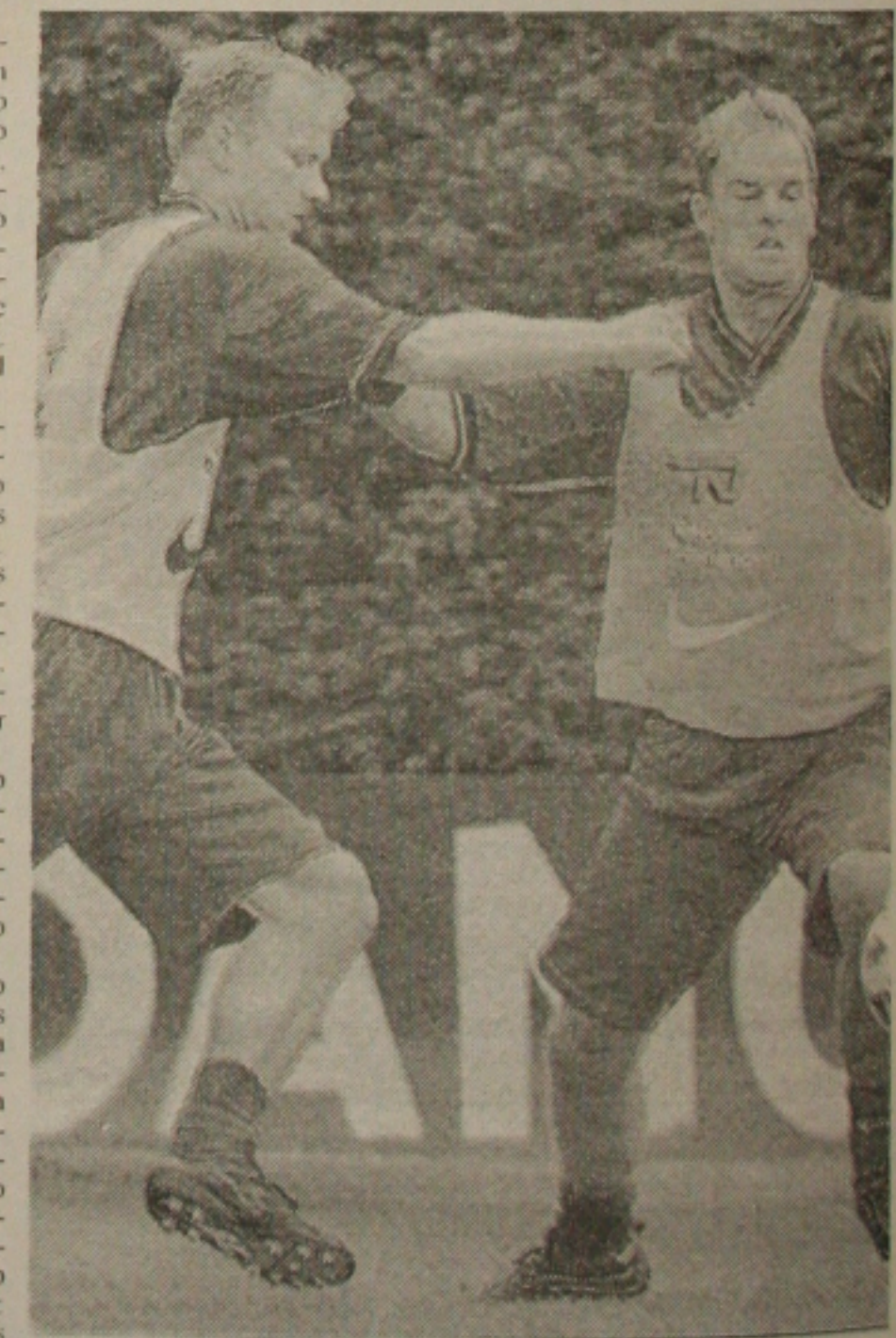
Os gêmeos De Boer, Frank e Ronald, esperanças da Holanda

A negra - Este será o terceiro encontro entre Holanda e Argentina em uma Copa do Mundo. Na primeira vez, em 1974, o Carrossel Holandês eliminou os sul-americanos nas oitavas-de-final com uma goleada por 4 a 0. Quatro anos depois, na decisão da Copa do Mundo disputada na Argentina, o time da casa se vingou vencendo os europeus por 3 a 1 na prorrogação. Foi o primeiro título mundial conquistado pelos argentinos. A Holanda ainda busca sua glória.