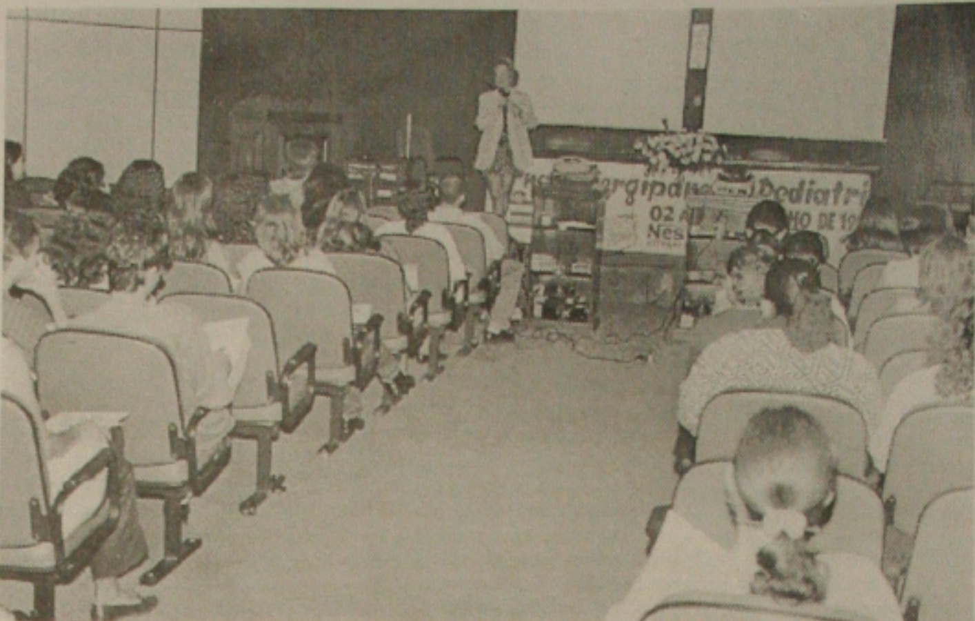
A Jornada de Pediatria que acontece no auditório do São Lucas, reúne profissionais até hoje

A vítima que reside na Avenida B, 16, no Conjunto João Alves, afirmou que não sabe os motivos que levaram o policial a tentar tirar sua vida. Ele disse ainda a polícia que se encontrava no hospital, que retornava para sua residência, quando foi alvejado pelos disparos.