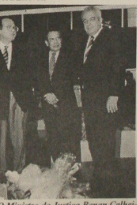
O Ministro da Justiça Renan Calheiros, Luiz Antônio Teixeira (Secretário de Estado da Justiça e da Cidadania) e Mauro Durante (Presidente do Sebrae), durante exposição de trabalhos de presidiários realizada no Ministério da Justiça (DF).