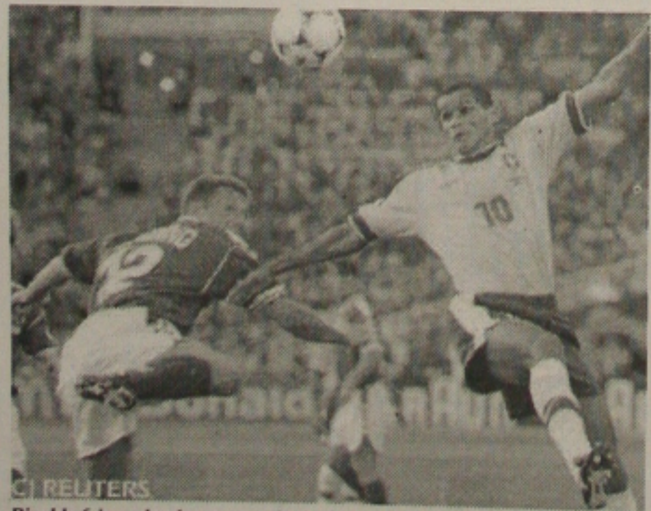
Rivaldo foi um dos destaques principalmente pelos gols contra a Dinamarca

ser artilheiro da equipe, mas disse ter certeza de que fará pelo menos mais um gol no Mundial. "O meu gol mais importante será na final", disse, cheio de otimismo. Para Rivaldo, a seleção está subindo de produção jogo a jogo. "Nós estamos passando pelos obstáculos, crescendo aos poucos: hoje deu para sentir a determinação de todos os jogadores em campo, o coração na ponta da chuteira", afirmou.