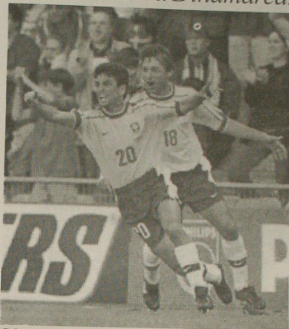
Bebeto um dos melhores em campo, comemora o 1º gol do Brasil