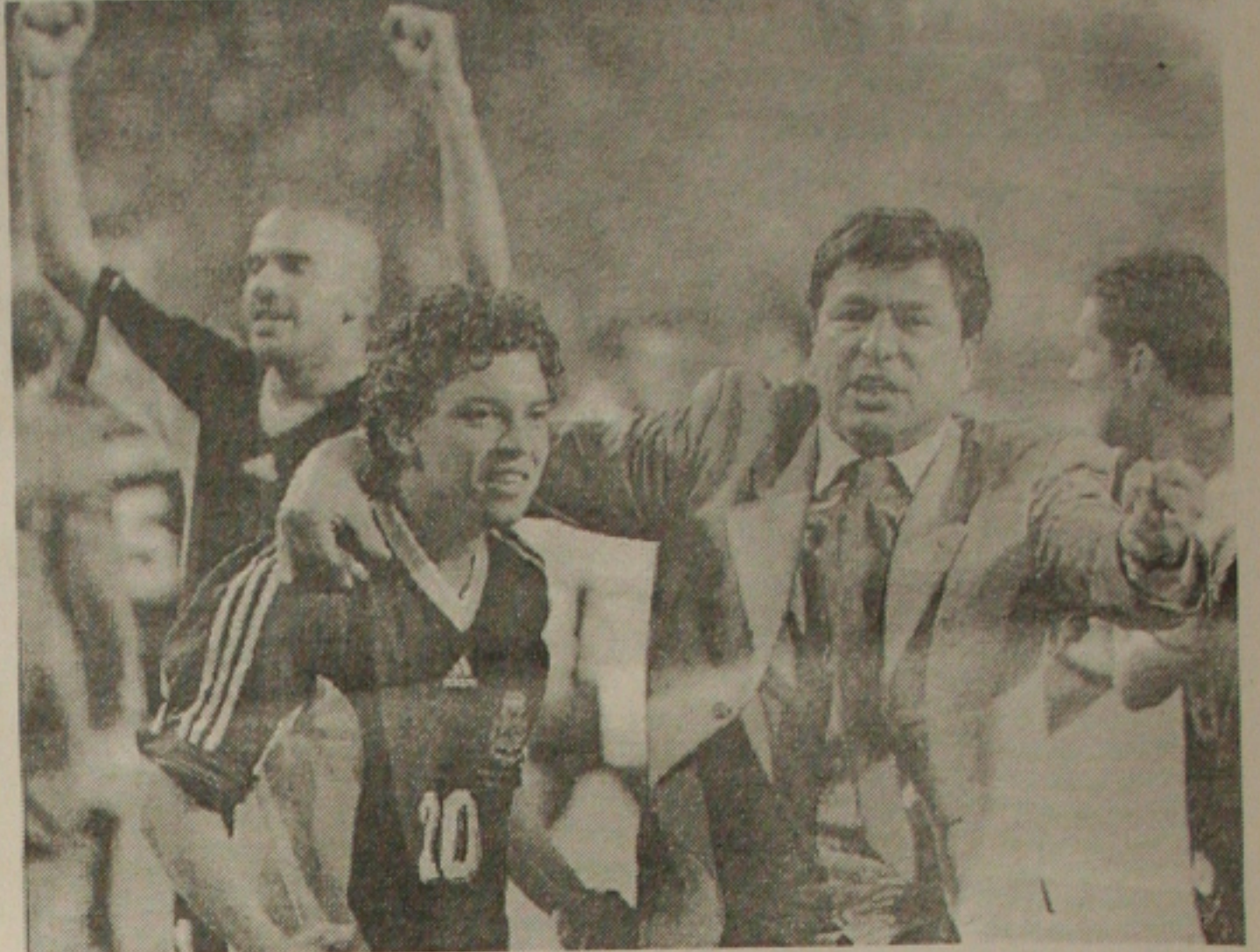
Passarela acredita no poder de criação do craque Ortega

Holanda - Van der Sar, Frank De Boer, Stam e Numan, Jonk, Seedorf, Davids, Ronald De Boer e Cocu; Bergkamp e Overmars. Técnico - Guus Hiddink.