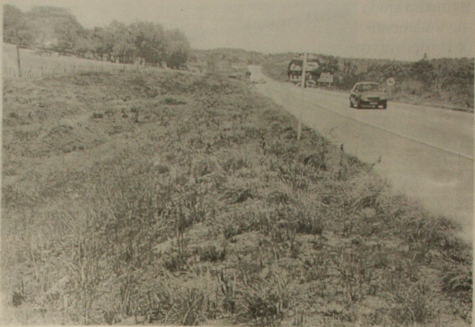
Os trabalhadores vítimas da seca vão trabalhar ainda este mês na limpeza dessa rodovia

Os municípios cortados pela rodovia 235, como Areia Branca, Itabaiana, Ribeirópolis, Frei Paulo e Carira, e todos aqueles que estiverem próximos a ela serão atendidos. Mendonça, observa que todo o trabalho de recrutamento está a critério das comissões municipais. "Ao DNER cabe apenas a fiscalização dos trabalhos e a liberação dos recursos", explica