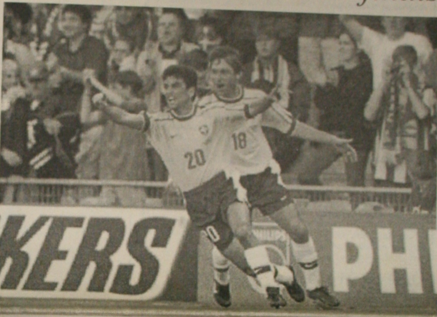
Bebeto comemora o primeiro gol brasileiro, que abriu o caminho para a vitória sobre a Dinamarca

po. Numa rápida cobrança de falta, os dinamarqueses surpreenderam a defesa brasileira. Jorgensen recebeu livre quase na pequena área e chutou sem chance de defesa para Taffarel. O primeiro gol dos brasileiros saiu através de Bebeto, enquanto Rivaldo marcou outros dois gols. Laudrup fez o segundo gol para a Dinamarca. Nas semifinais, o Brasil enfrentará, na terça-feira (07), em Marselha, o vencedor de Holanda e Argentina, que jogam hoje. Cafu, recebeu seu segundo cartão amarelo, está fora da próxima partida. (Cobertura da Copa - Caderno B)