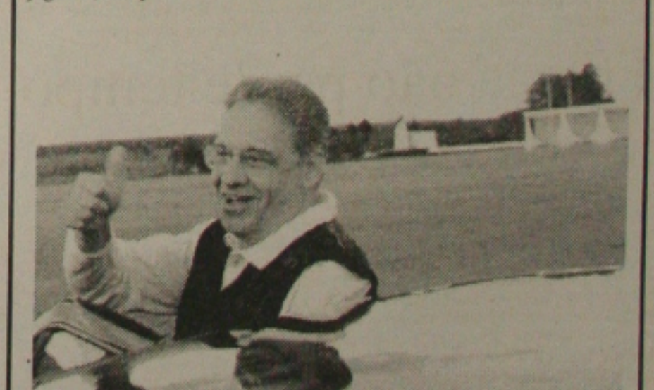
Sorridente, o Presidente Fernando Henrique elogia a vitória do Brasil