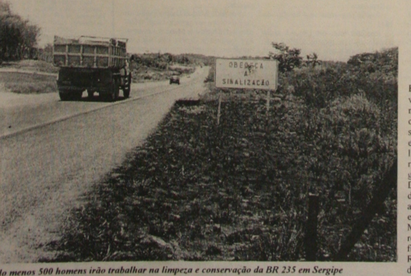
Pelo menos 500 homens irão trabalhar na limpeza e conservação da BR 235 em Sergipe