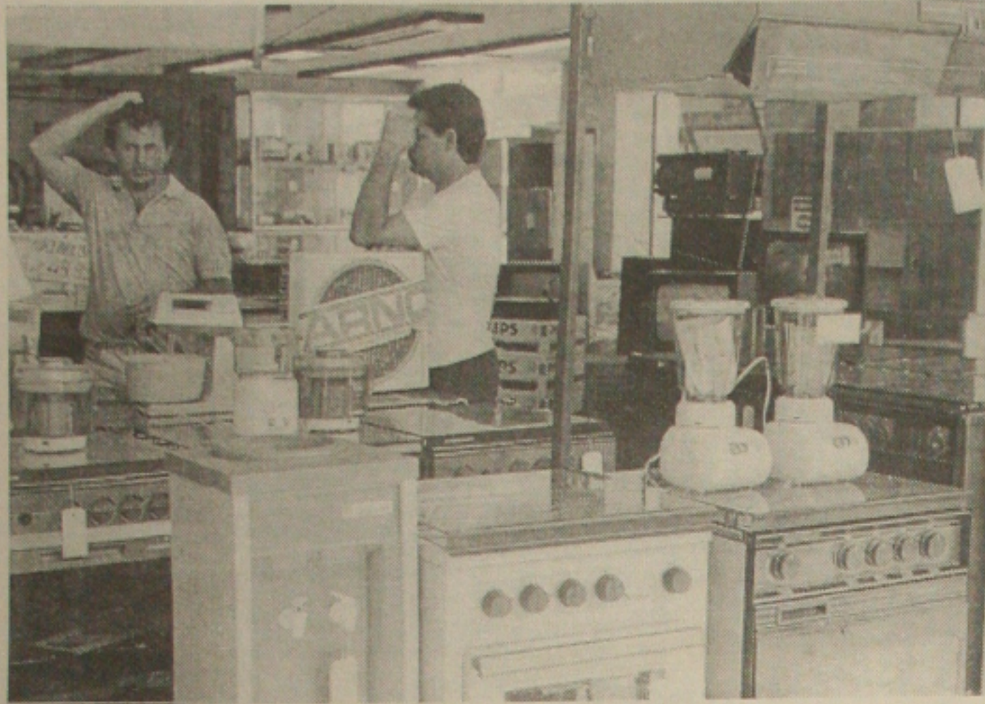
Carvalho diz que a redução do IOF vai ajudar na recuperação das vendas