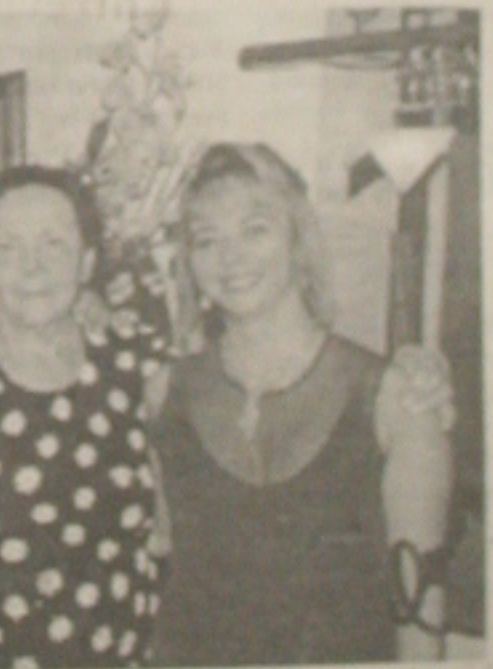
Os parabéns da próxima segunda-feira são para minha queridíssima mama, que vai mudar de idade.