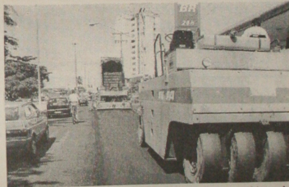
A parceria com o Governo do Estado tem ajudado a prefeitura de Aracaju recuperar vias públicas

A artéria é uma das principais da zona sul e se integrará com a Avenida Canal 5, do Conjunto Augusto Franco. O objetivo do investimento é melhorar o tráfego de veículos e pessoas cada vez mais constante naquela área habitacional e estudantil.