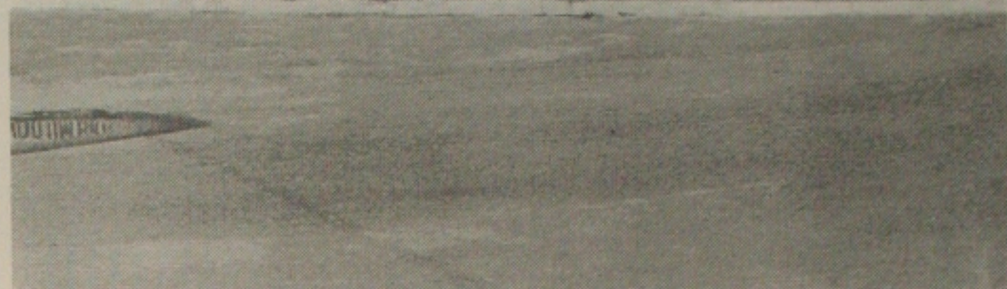
A paralisação dos funcionários da Embrapa na semana passada forçou o fechamento do acordo coletivo