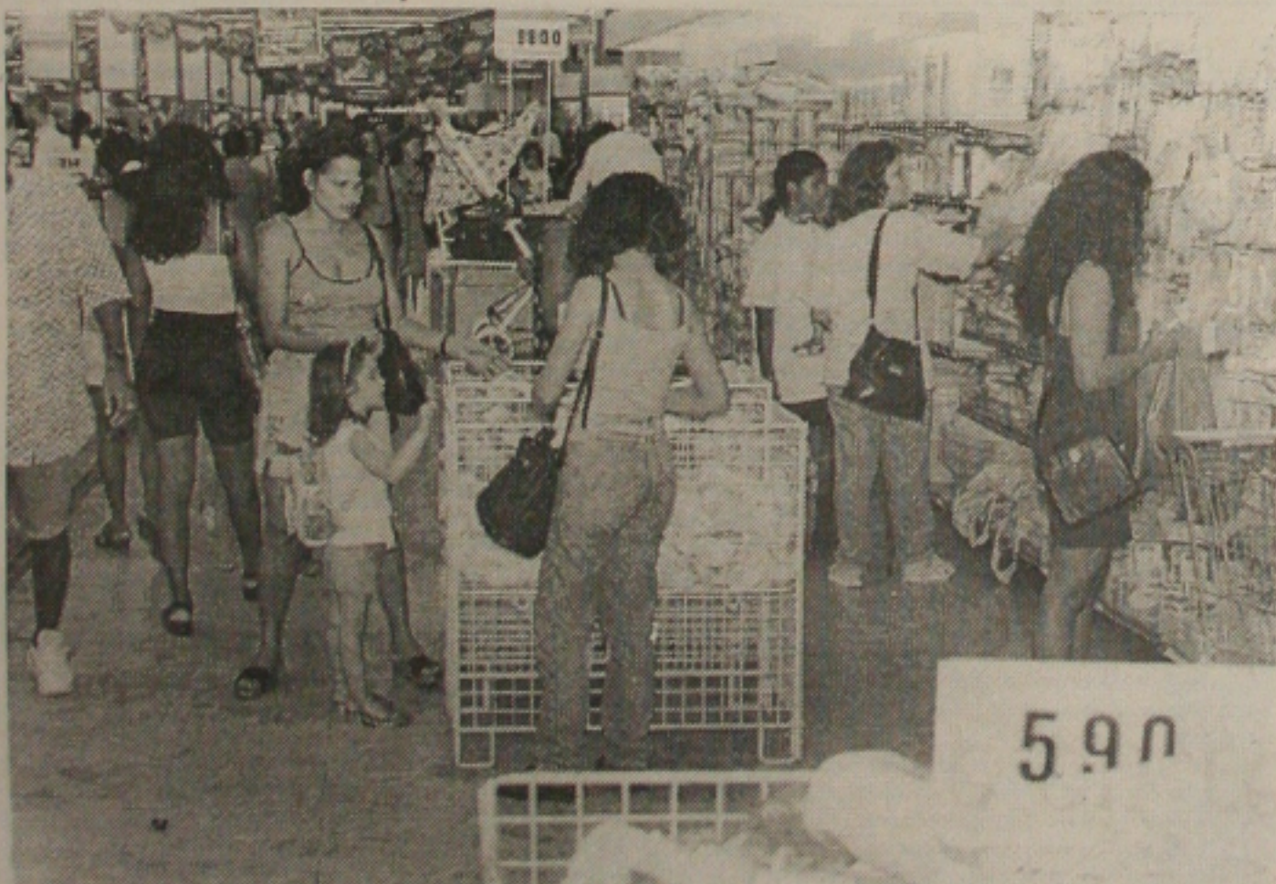
Com a redução do IOF, os lojistas esperam um aquecimento nas vendas nos próximos meses