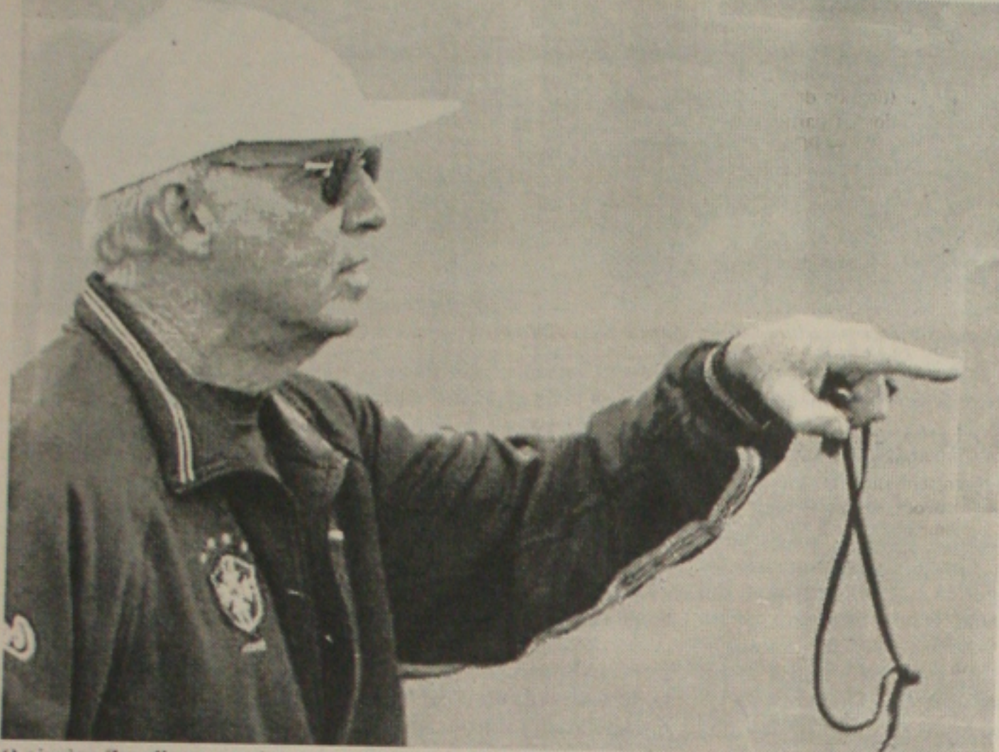
O técnico Zagallo traça planos para vencer a França.