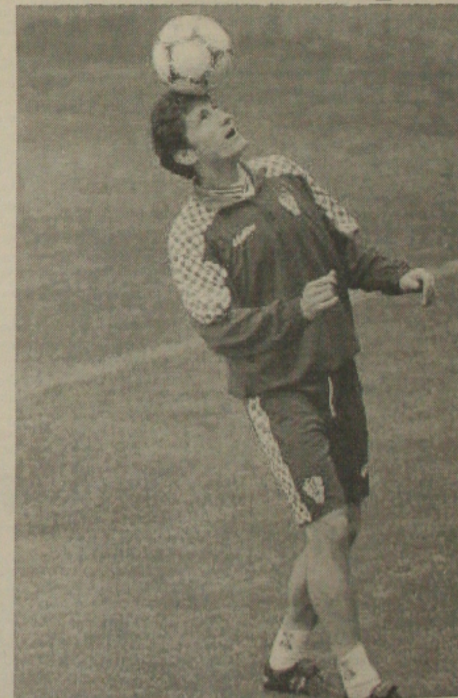
Com cinco gols até agora, Suker quer mais um para se isolar na artilharia

O croata assegura que sua atuação no Mundial francês não significa nenhum tipo de reivindicação de seu valor. "Quem sempre confiou em mim sabia que posso marcar gols. Sempre confiei em minhas qualidades, porque amo o futebol e, graças a Deus, pude demonstrar o que sei fazer", indicou. Suker prefere ver a França como campeã da Copa do Mundo, neste domingo. "Desta forma, a Croácia teria sido eliminada pela melhor seleção do Mundo", justificou o atacante croata.