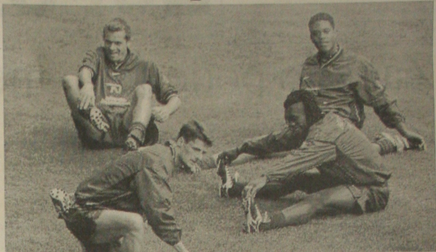
Holandeses fazem o último treino para o jogo desta tarde contra a Croácia

O ídolo brasileiro disse que tem pena do Maradona, "porque não soube viver fora do futebol". "Como é que eu, que sempre procurei manter a seriedade do esporte, vou valorizar as declarações de quem só foi bom no campo?", questionou.