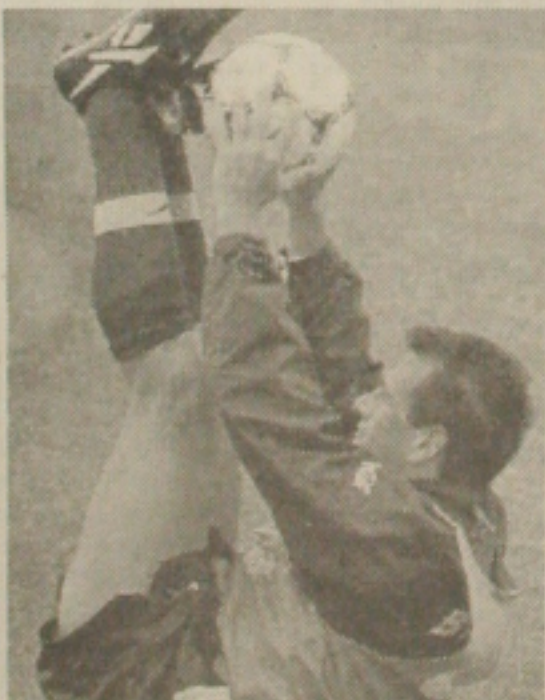
Domingo marca a despedida de Dunga da Seleção

Segundo o capitão, Zagallo contava os jogadores "com sua incrível vontade de vencer". "Ele nos passa muita segurança e aí fica difícil de errar", contou.