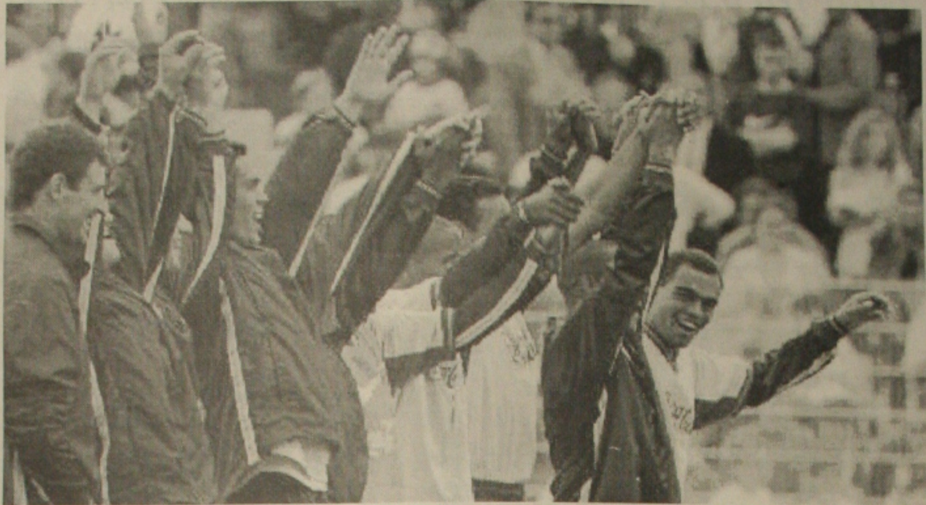
O adeus dos brasileiros à cidade que os acolheu por quase dois meses

Jogadores e torcedores agradecem o carinho dos moradores