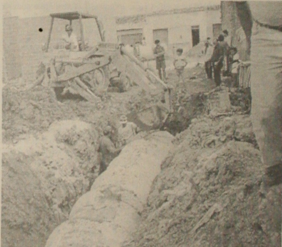
Itabaiana ganha drenagem e pavimentação

Ele afirma que Itabaiana nos últimos seis meses se transformou no maior canteiro de obras do interior de Sergipe e, de acordo com suas declarações, o mais importante é que surgiram empregos para a população. As empresas que estão na área de engenharia recrutaram a maioria dos empregados na própria cidade, reduzindo, inclusive o custo com a mão-de-obra.