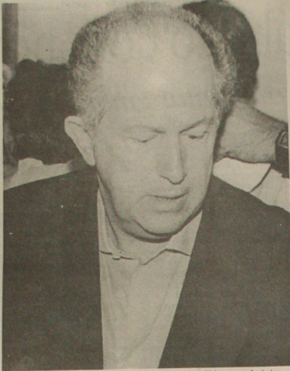
Albano: retorna a Aracaju com problemas políticos e administrativos para resolver.