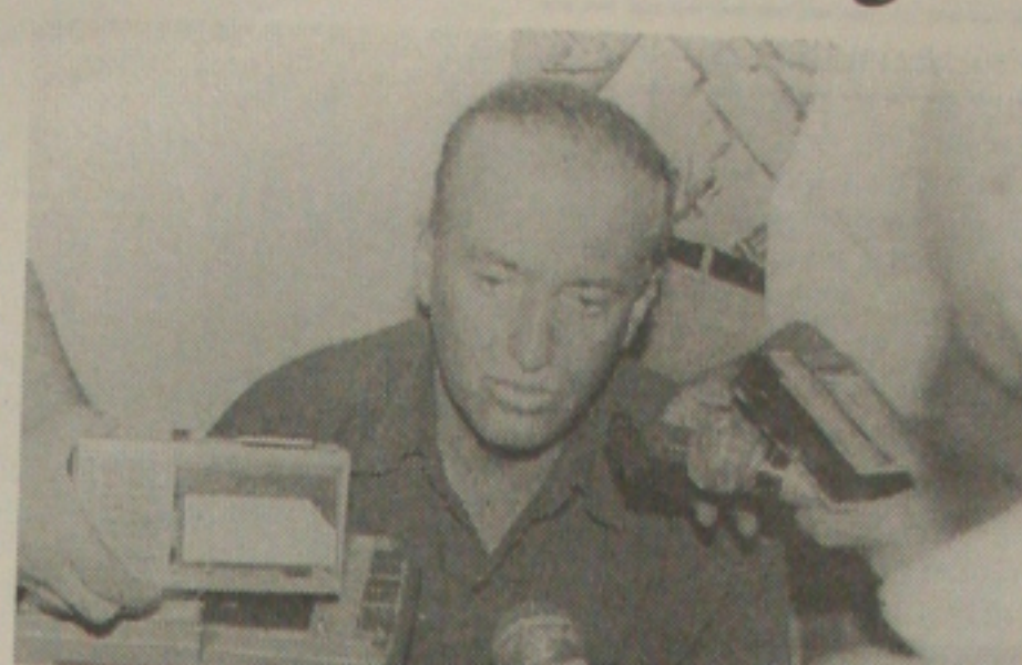
Valadares: 10 minutos na TV

co e dos demais candidatos a deputado estadual e federal do PSDB está orçada em R$ 5 milhões, valor este registrado como teto máximo de recursos a serem usados na campanha no Tribunal Regional Eleitoral.