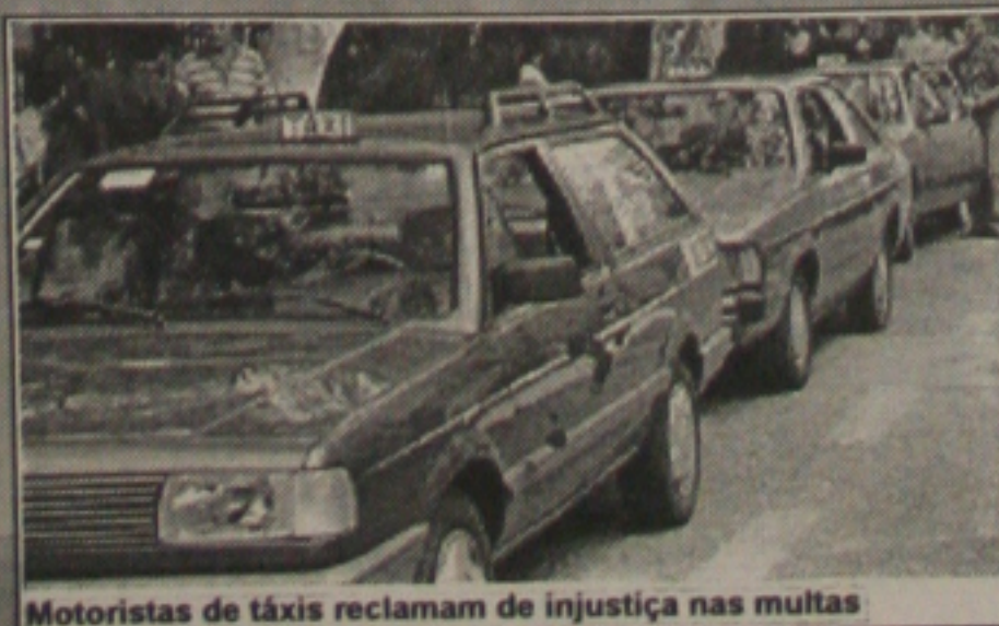
Motoristas de táxis reclamam de injustiça nas multas