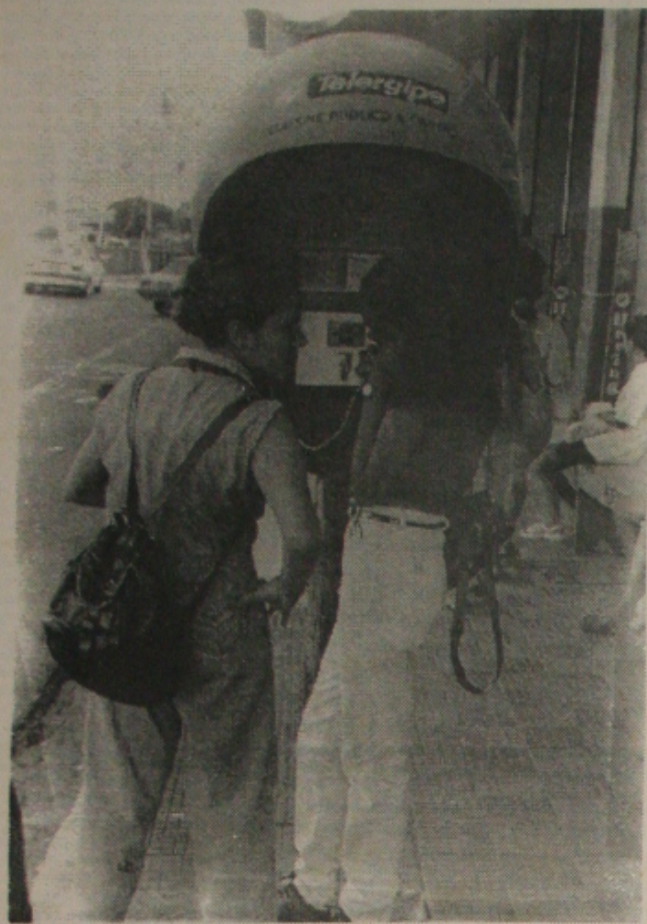
Embora essencial à população, os orelhões continuam sendo alvo do vandalismo