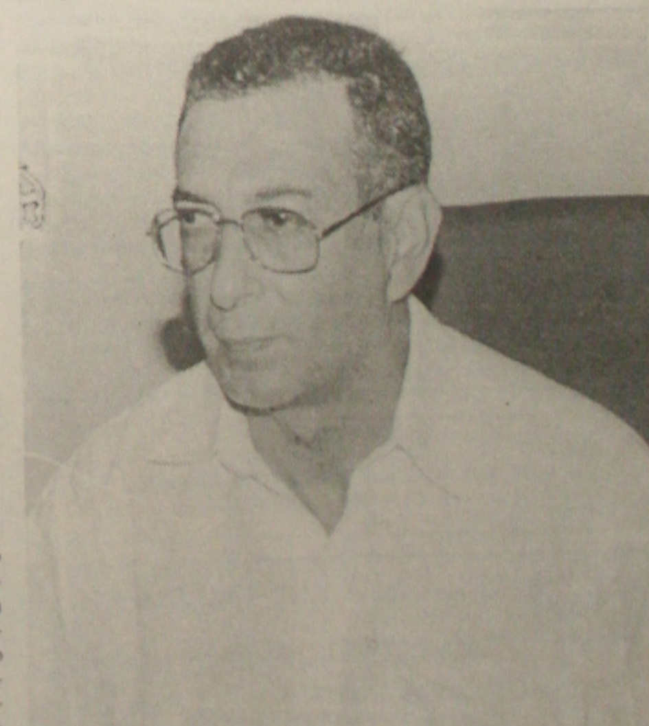
Aragão: ligações serão bloqueadas para o 0900

Os serviços 900 estaduais continuarão sem bloqueio, mas a cobrança relativa às ligações efetuadas a partir de hoje, não será feita pela Telergipe. As empresas responsáveis por outros serviços cobrados através de conta telefônica, deverão obter expressa autorização do usuário antes de encaminhar a cobrança para inclusão em conta telefônica.