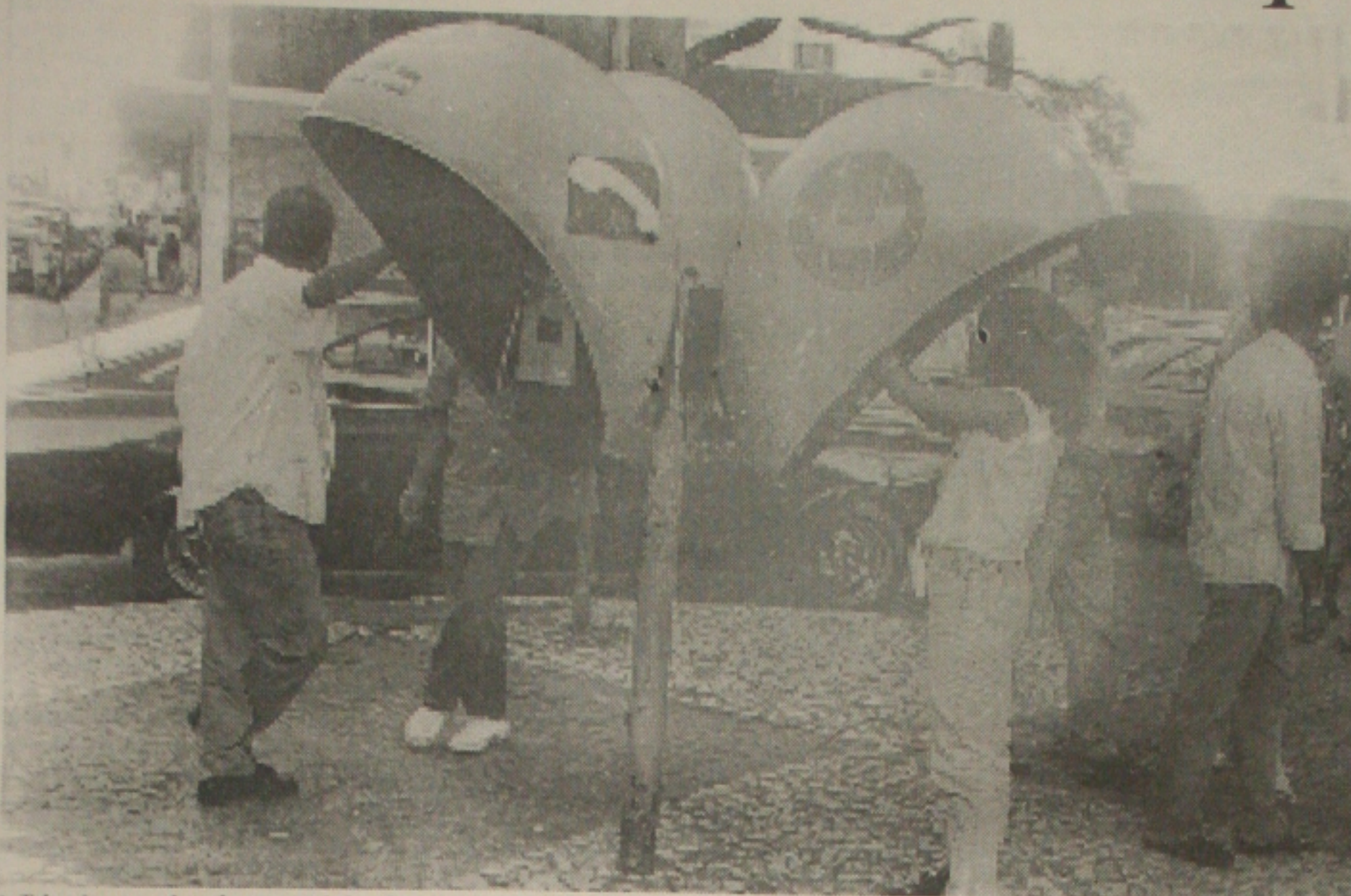
A Telergipe a cada mês tem prejuízo de mais de R$ 500 mil com a depredação de orelhões

Para se ter uma idéia do vandalismo - diz Aragão - até no calçadão da Rua João Pessoa, os vândalos têm agido. Contou que eles agem de forma violenta, sem