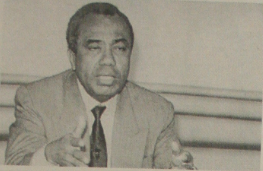
João Alves: 8 minutos na TV