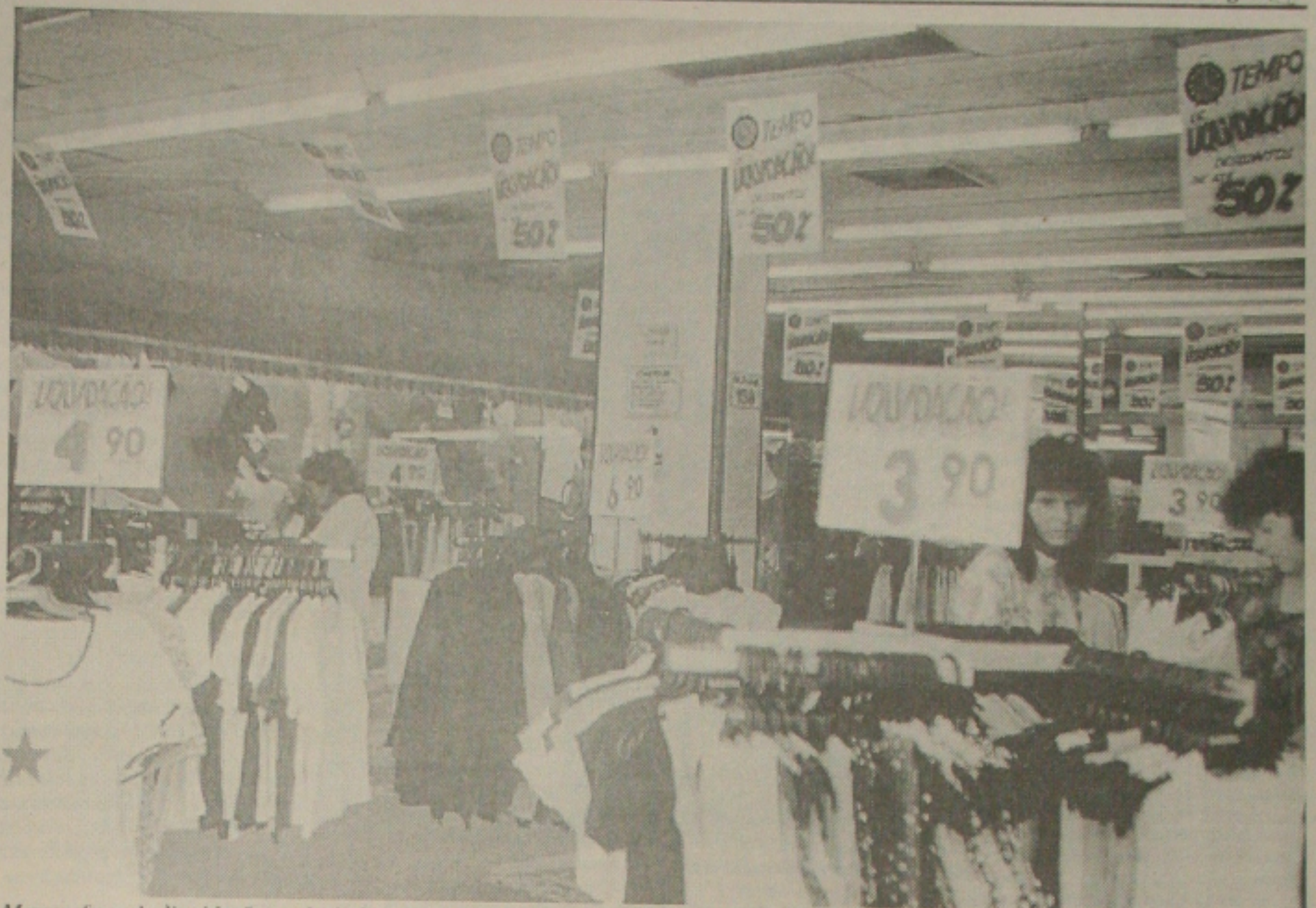
Mesmo fazendo liquidação, reduzindo preços, os comerciantes têm prejuízos com o "calote"