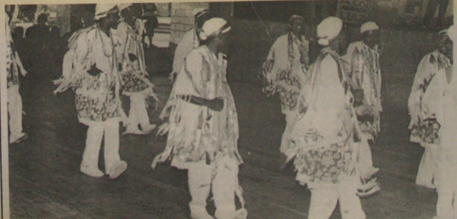
A programação da Semana do Folclore será encerrada hoje, no Gonzagão, no Conjunto Augusto Franco, promovida pelo governo do Estado. (Página 5A)

A Bolsa de Valores de São Paulo fechou ontem em baixa de 2,85% e a do Rio, em queda de 3,78%, depois do pior pregão desde a crise de outubro do ano passado. A Bolsa de Nova York, que chegou a despencar 283 pontos no seu pior momento, fechou em queda de 77 pontos (-0,90%), em 8.533 pontos. Após perder quase 10%, o C-bond desvalorizou 7,37% às 17h00, cotado a 56,562 centavos de dólar. Na Venezuela, o epicentro da "hora", a Bolsa de Caracas fechou em forte queda, com persistentes rumores de que o governo vai desvalorizar o bolívar. O índice geral do mercado caiu 291,88 pontos (-8,4%) e fechou em 3.168,76 pontos. É o mais baixo nível de fechamento desde 27 de março de 1996. (Página 8A)