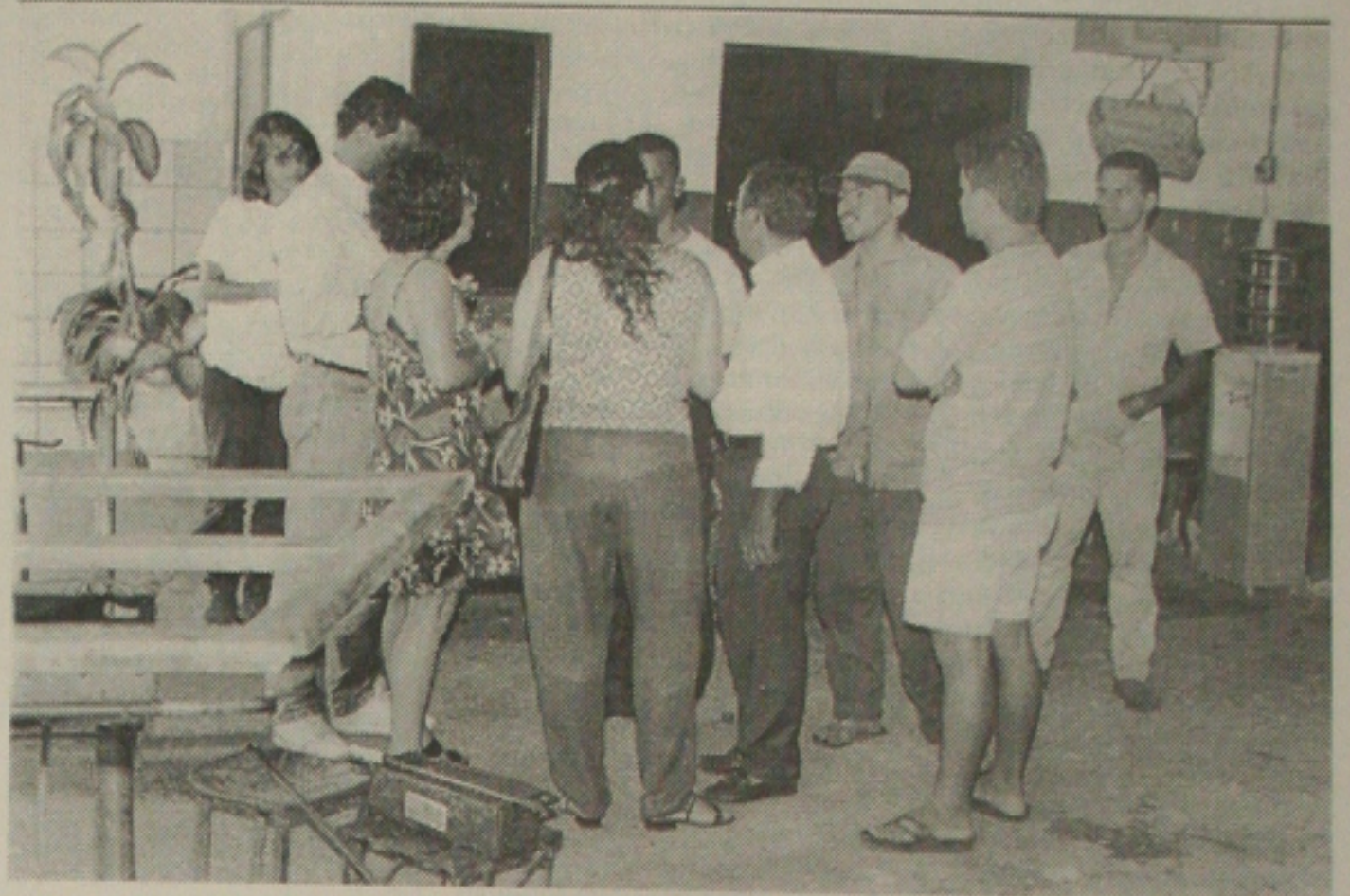
Barraqueiros instalados ao lado da Avenida Otoniel Dórea são destruídos pela Prefeitura