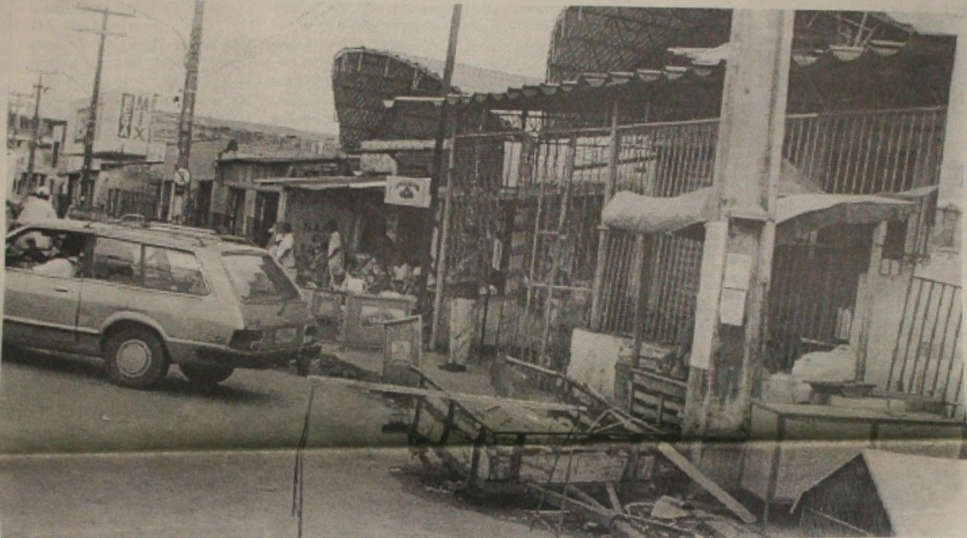
A retirada dos barraqueiros que comercializam até animais é necessária para a conclusão das obras do mercado