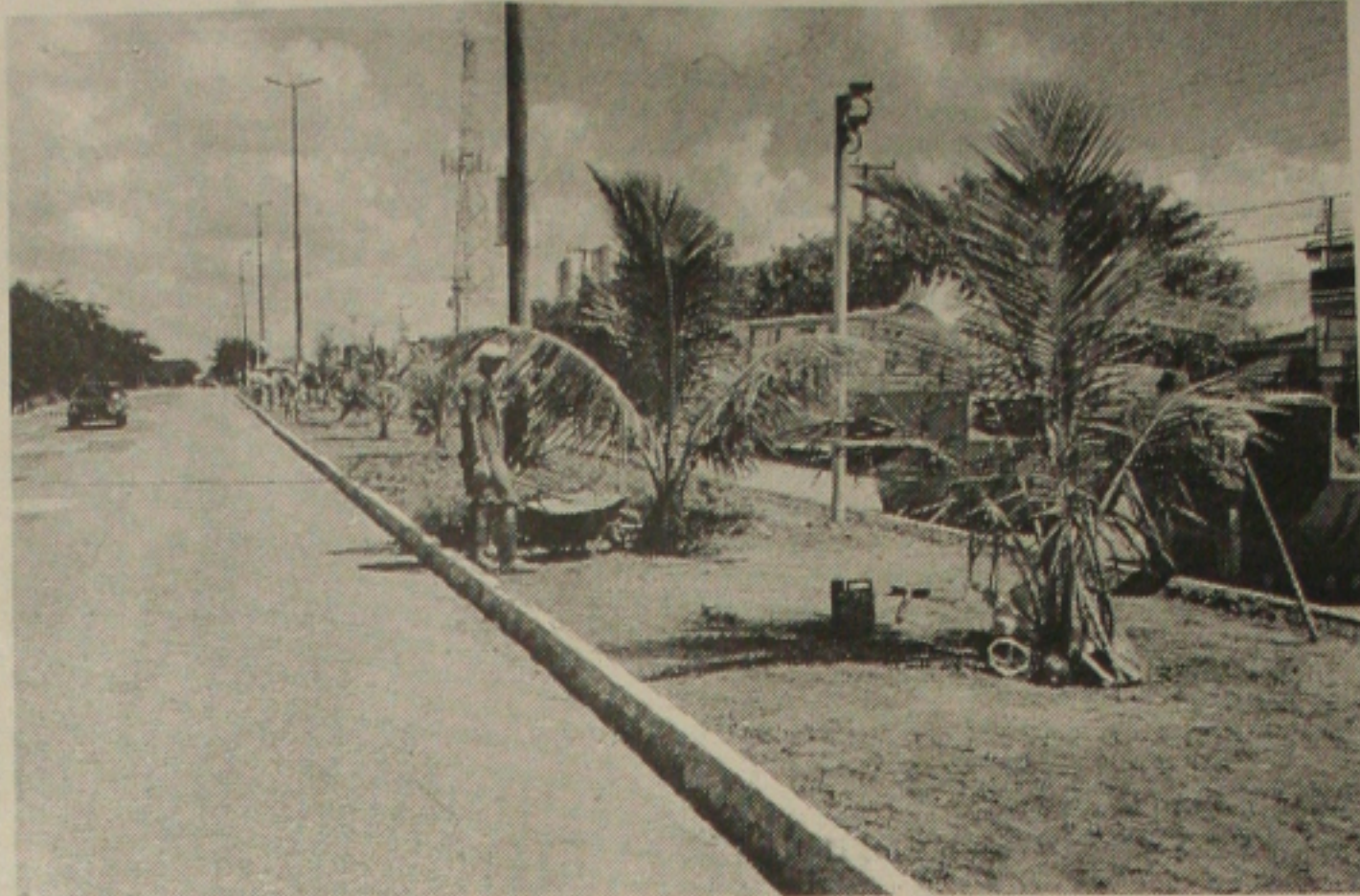
Parceria da Prefeitura de Aracaju e Governo do Estado recupera Avenida Tancredo Neves

Vieira disse que o Matadouro teve sua obra iniciada na administração passada, e não foi terminado. "A construção foi feita pelo Projeto Nordeste e não estava em condições precárias. O promotor que disse isso nunca esteve no local, que eu tenho conhecimento", afirmou o prefeito. Ele disse ainda que devem estar confundindo o matadouro de agora com o outro que havia na cidade e foi fechado pelo promotor Paulo Moura, por estar em total precariedade.