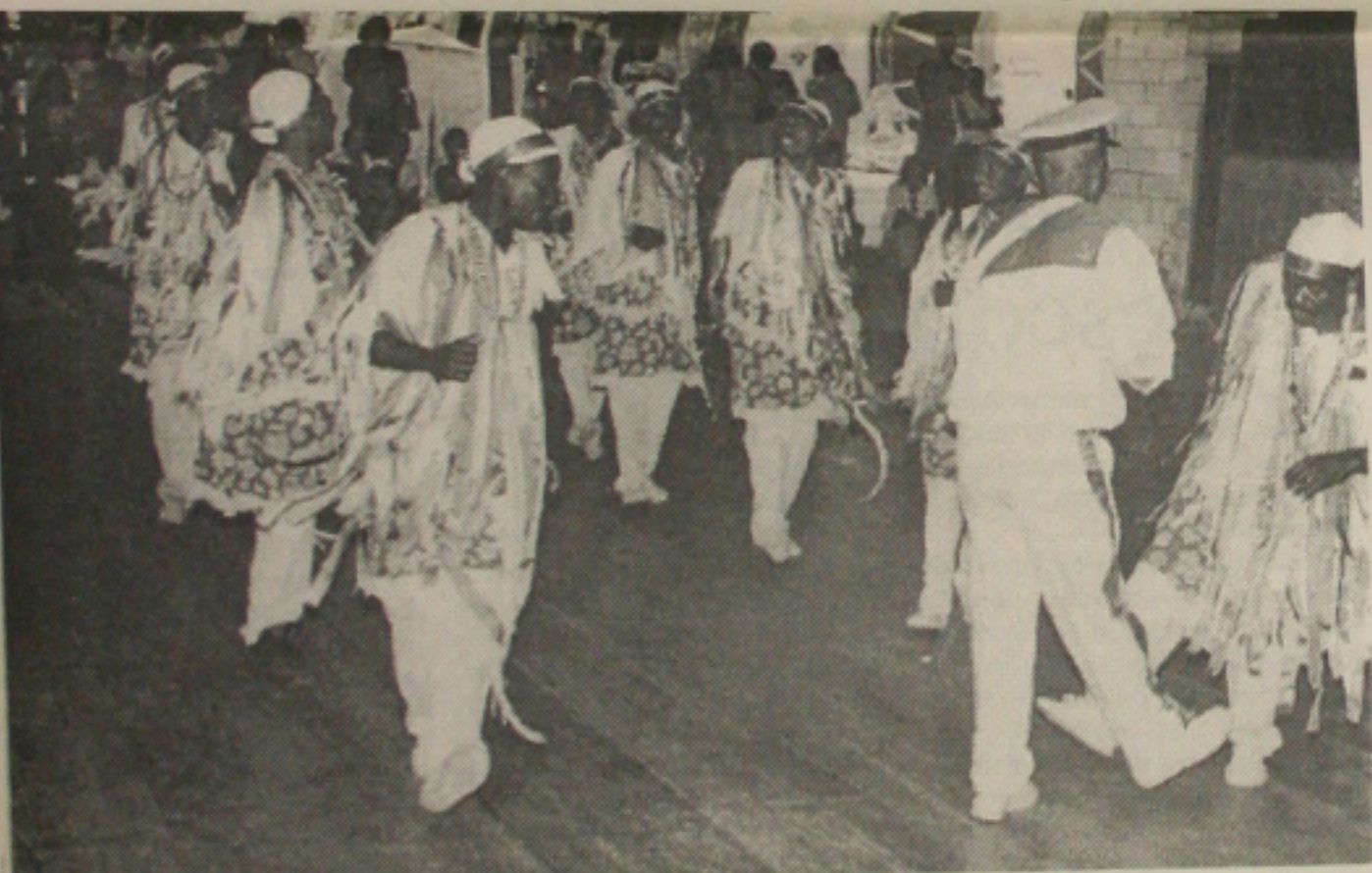
Semana do Folclore resgata as tradições do sergipano com grande exposição no Gonzagão

O mês de julho bateu recorde no que concerne ao embarque e desembarque de passageiros no aeroporto de Aracaju. As estatísticas indicam um número de 27 mil passageiros somente no mês passado, enquanto que a média que vinha sendo mantida era de 22 mil passageiros.