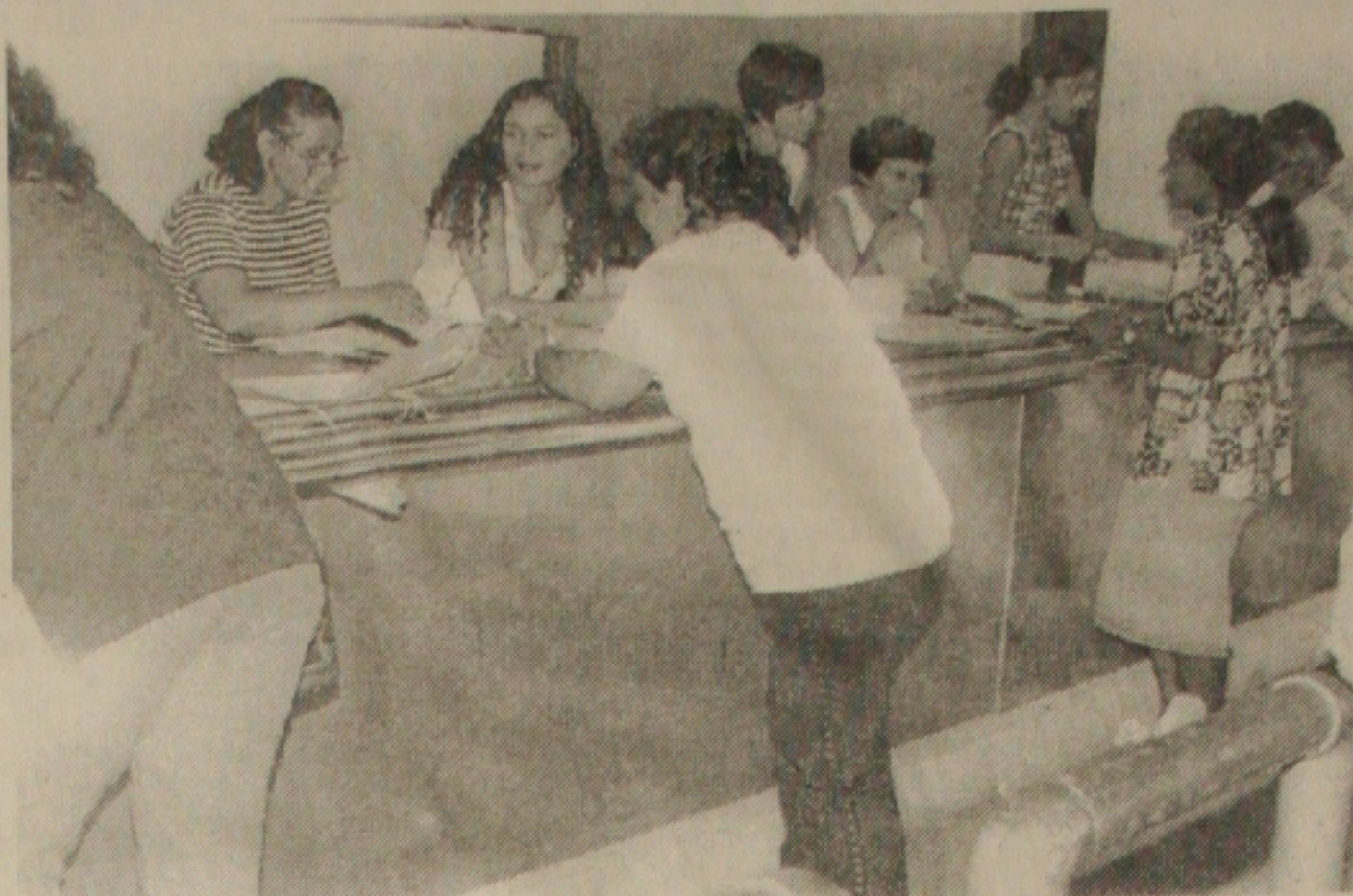
A Universidade Federal de Sergipe até ontem já tinha mais de 10 mil inscritos para o vestibular 99

- Este ano, cerca de 13 mil candidatos deverão estar concorrendo as vagas nos cursos da Universidade Federal de Sergipe (UFS). É bom lembrar que os candidatos deverão chegar cedo ao local das provas, para não ficarem de fora. Os portões serão abertos às 7 horas e fecharão impreterivelmente às 8 - explica o coordenador do concurso vestibular da UFS.