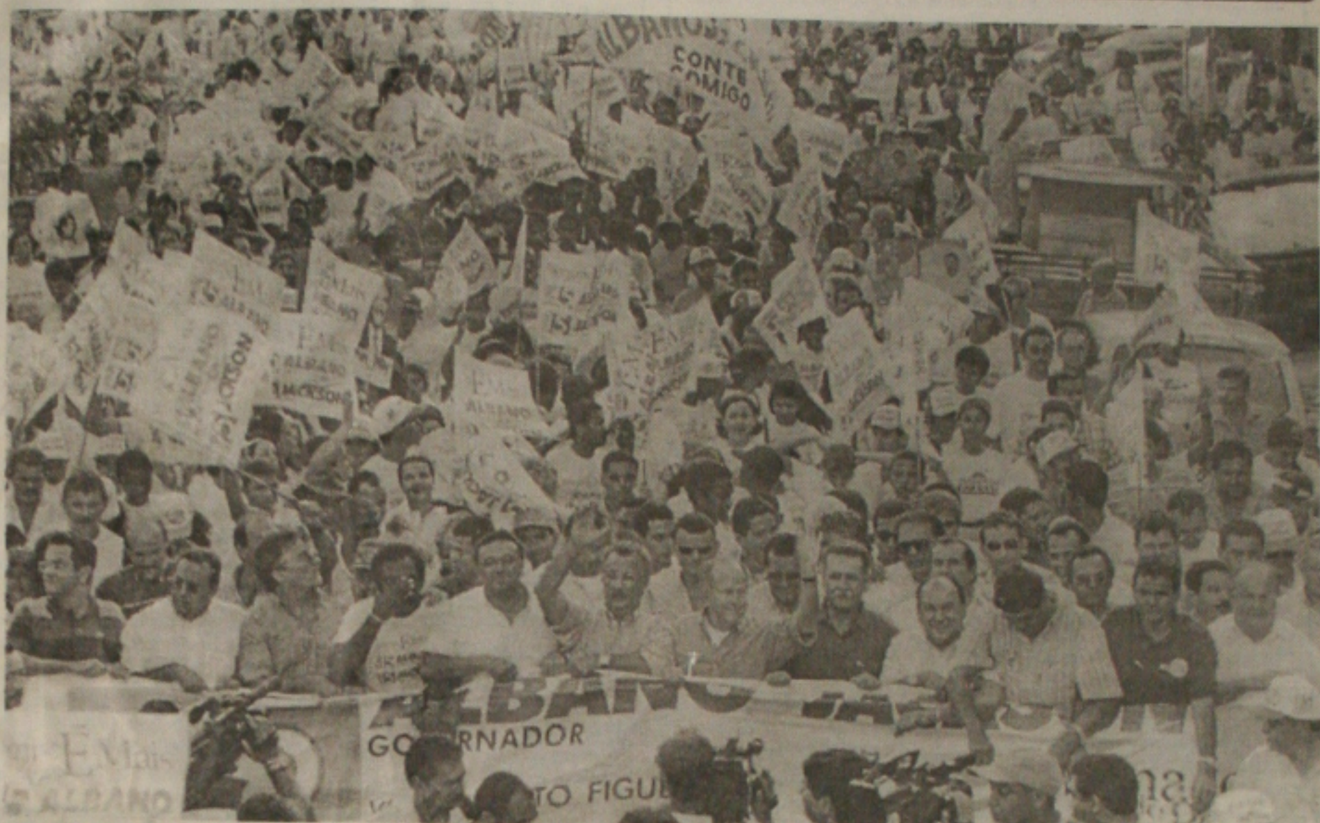
Cerca de 40 mil pessoas, segundo cálculos dos organizadores, participaram ontem à tarde da passeata em apoio aos candidatos da coligação União por Sergipe. (Página 3A)

tropolitanas em que o órgão faz a pesquisa (São Paulo, Rio de Janeiro, Porto Alegre, Belo Horizonte, Salvador e Recife). A Região Metropolitana de São Paulo pode ser apontada como a principal responsável por resultados tão negativos. A Grande São Paulo congrega 45% da população das seis regiões e gerou um quadro extremamente desfavorável em julho, com desemprego médio de 8,95%, puxado pela indústria de transformação, setor no qual o desemprego alcançou 10,50%, a segunda taxa mais alta da série histórica. (Página 8A)