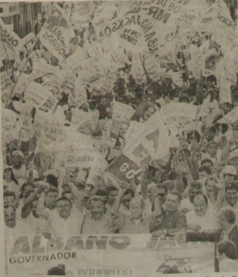
Multidão participa de passeata da coligação "União Por Sergipe"