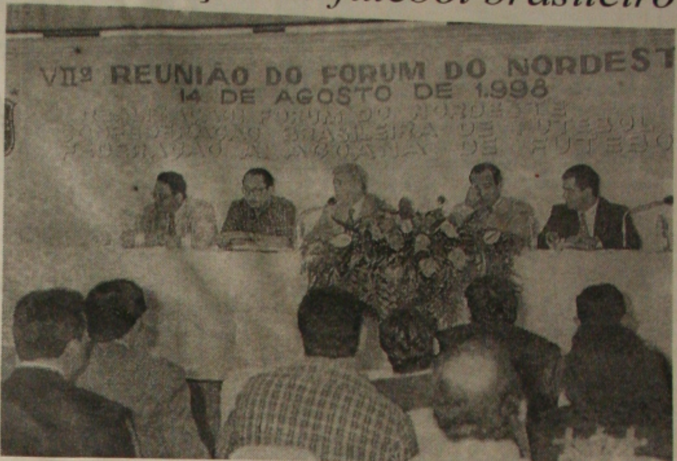
No fórum realizado em Maceió, Teixeira já falava sobre modificações no futebol brasileiro

Com a presença de praticamente todas as personalidades que militam no futebol, além de convidados, como o técnico Zagallo, o Fórum de Debates prossegue hoje com a discussão de seus 12 temas. Domingo, será entregue um relatório final ao presidente da CBF, que disse ainda não ter um prazo para colocar as alterações em prática. "Existem contratos vigentes e a transição precisa ser equilibrada", disse Farah quer tudo valendo até, no máximo, o ano 2000.