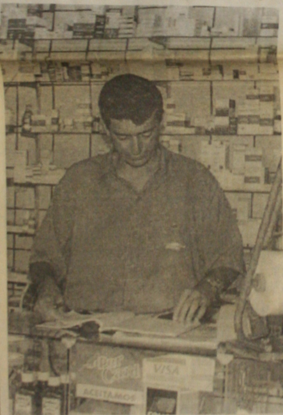
A maioria das farmácias do Estado funciona sem profissionais especializados