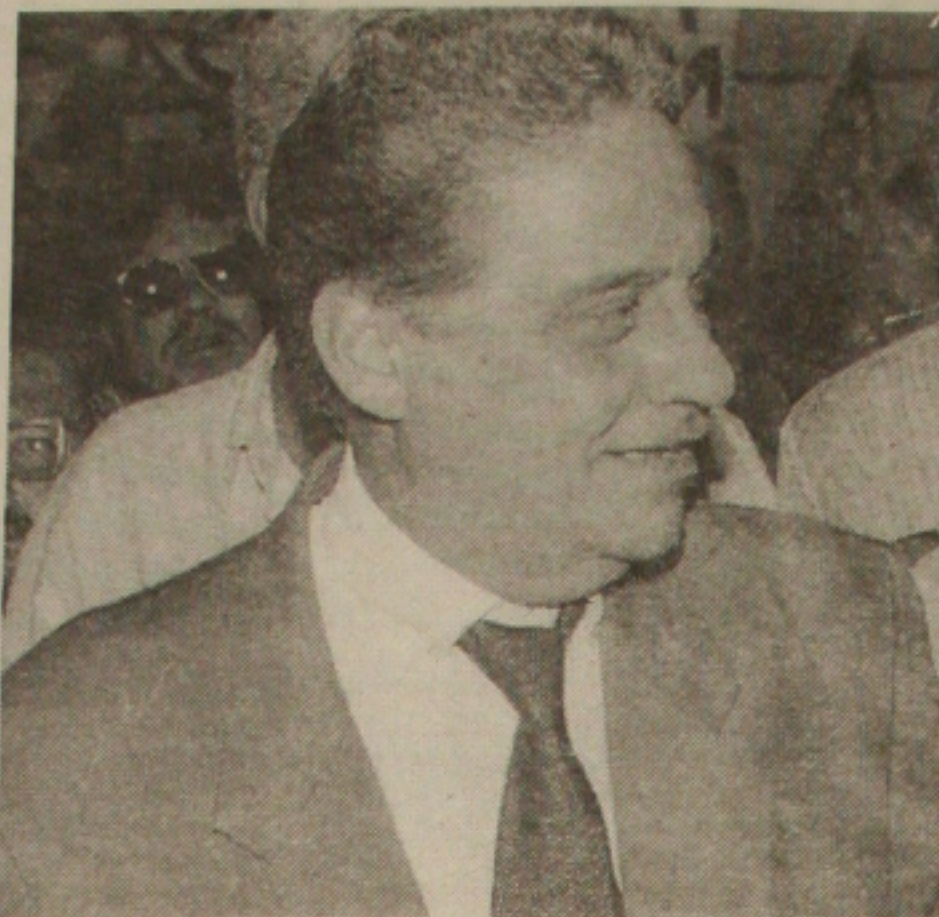
Fernando Henrique Cardoso terá de enfrentar protestos de sindicalistas e militantes de partidos de esquerda

Quebradeira - "Ou o governo entende que é preciso estancar as importações de coisas supérfluas e investir na produção nacional ou vai quebrar esse país", disse Lula, ontem, ao participar da comemoração pelos 15 anos da CUT. O comando da campanha de Lula ainda não tem pronta uma fórmula para explicar, no programa de TV, como a turbulência internacional afeta o cotidiano da população. "A palavra não é suficiente, vamos trabalhar com imagens e a questão da crise será tocada, daqui para a frente, em todos os programas", assegurou Ozéas Duarte, coordenador de Comunicação do PT. Publicitários, economistas e dirigentes do PT reuniram-se ontem com Lula, durante cinco horas, para definir estratégias.