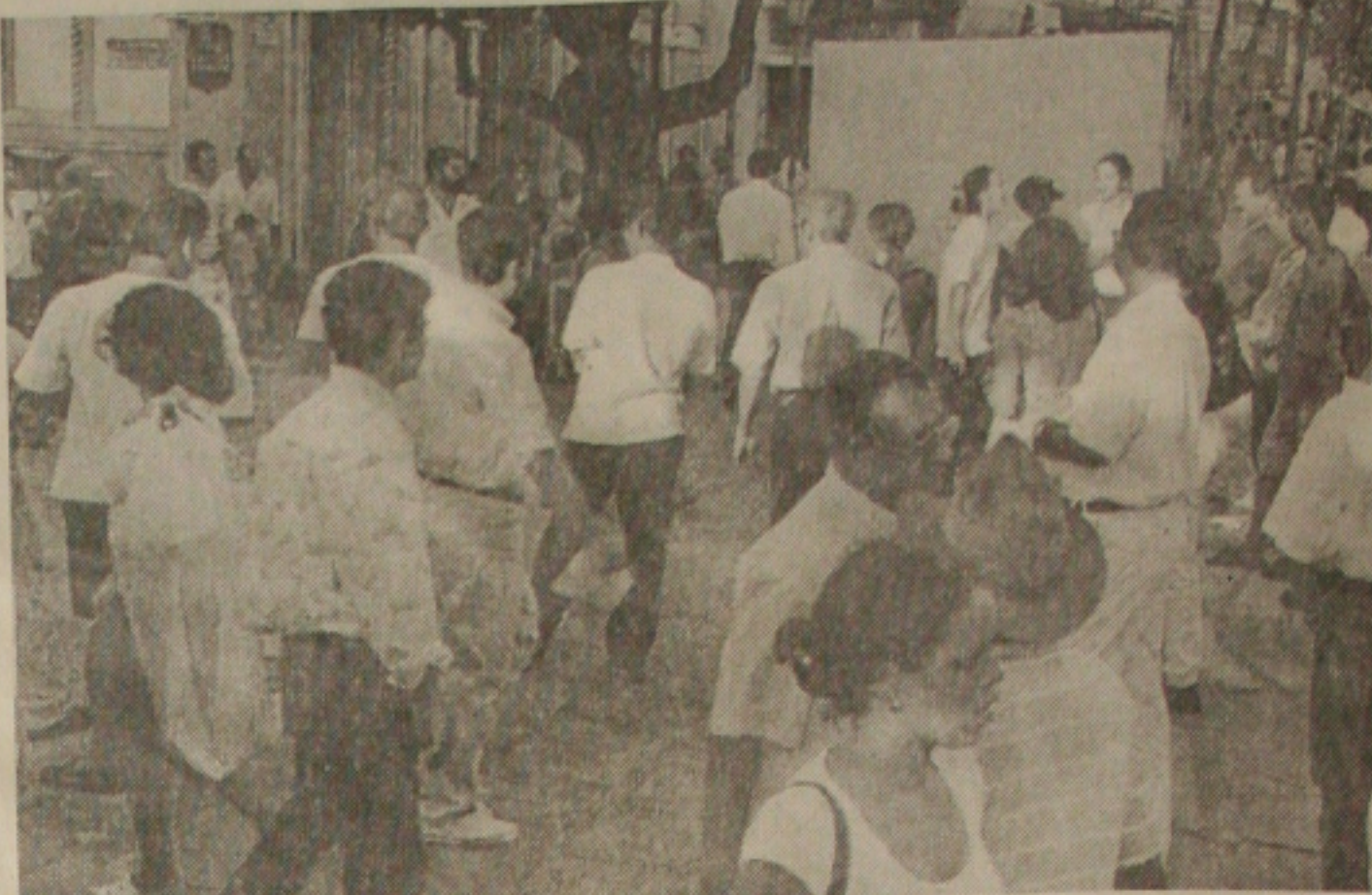
Bancários realizaram manifestação ontem à tarde, para marcar o início da campanha salarial