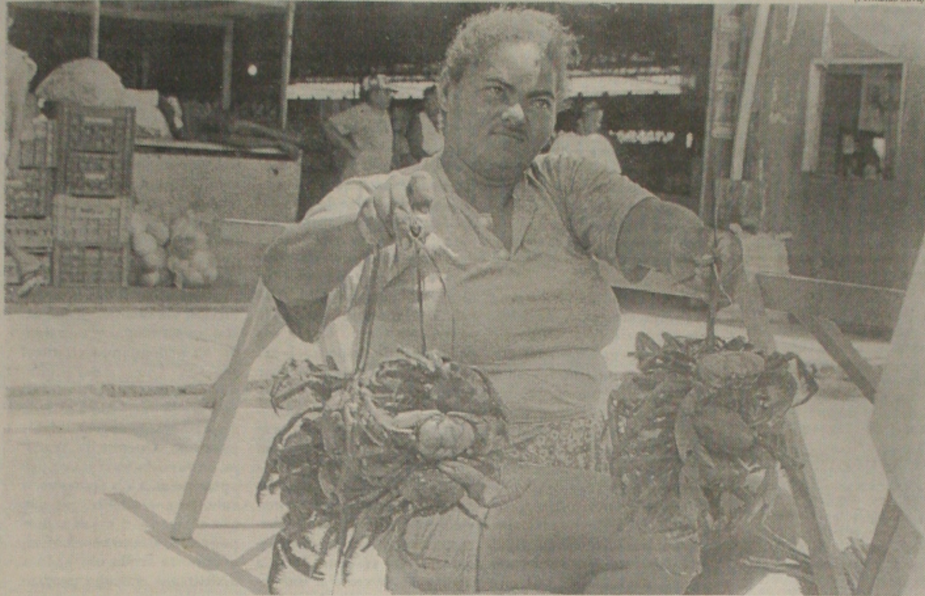
Enquanto nos mercados, a corda de caranguejos custa em média R$ 2,00, na orla o produto virou artigo de luxo

O presidente Fernando Henrique Cardoso descartou em entrevista coletiva que concedeu ontem, antes do comício eleitoral em Macapá, a edição de um pacote com novas medidas na área econômica. Ele disse que as medidas estão sendo tomadas e continuarão a ser feitas na medida da necessidade. "Não se trata de pacote, mas de manter a defesa do real e da economia e, evidentemente, havendo, como houve, uma fuga de capitais, nós tínhamos de tomar e tomamos medidas." O presidente ressaltou que a condução da política econômica não será feita aos sobressaltos. "As medidas foram tomadas com competência pelo Banco Central (BC), com o meu apoio político", frisou. Fernando Henrique reiterou que a função de presidente é mais importante do que a condição de candidato. "Sou o presidente do Brasil e tomarei as medidas necessárias, populares ou impopulares, do a quem doer, para defender o interesse nacional". Ele reafirmou que vai continuar atuando "com tranquilidade, com firmeza" e que não vai transformar as questões do País em questões eleitorais. O presidente negou que à noite iria se encontrar com o ministro da Fazenda, Pedro Malan. "Não tenho nada marcado com o Malan para hoje", afirmou.