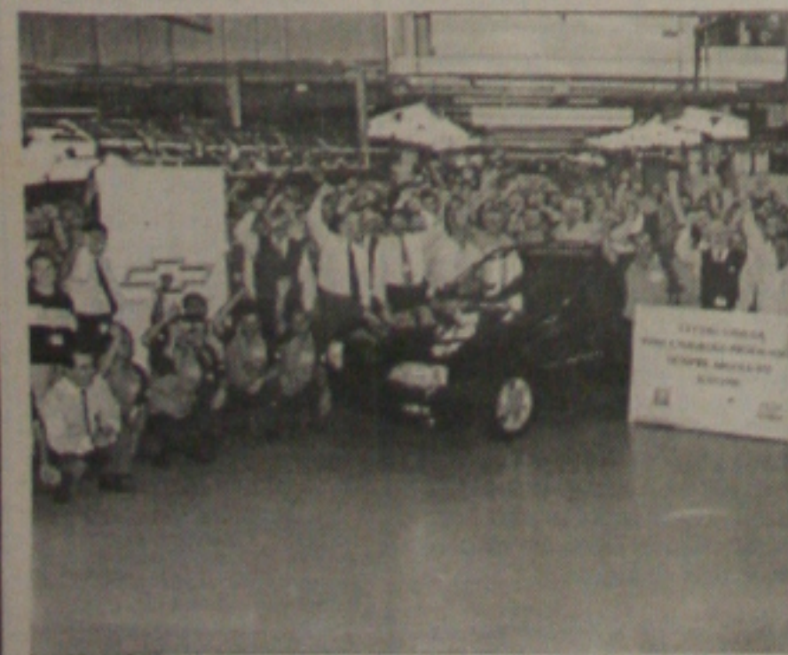
Diretoria e funcionários e o último Omega nacional - um CD.

neral Motors do Brasil em São Caetano do Sul, na região do ABCD paulista. Ao todo foram comercializadas 93.282 unidades desde julho de 1992 no País.