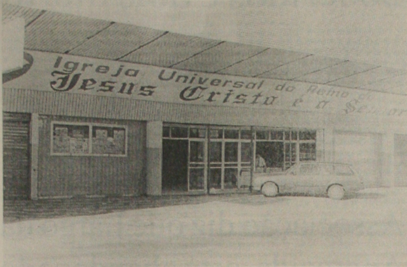
A tragédia de Osasco (SP) pode levar a Defesa Civil a vistoriar o prédio da IURD, no Siqueira Campos

O novo instituto ocupa dois andares, ficando o segundo para a parte criminalística e uma sala especial para reuniões. O primeiro andar ficou reservado para uma Agência do Banese, Balcão de Informação, duas Salas de Espera com cadeiras e ar-condicionado, Sala Especial para Idosos, Gestantes e Deficientes, Sala de Expediente de Carteiros; Sala de Lavagem de Mãos toda azulada; Sala de Assistência Social, Seções para Tomada de Impressão Digital e de Arquivo Criminal, Coordenação de Postos Avançados e de Pesquisa; Arquivo Datiloscópico e duas Bateiras de Sanitários (masculino e feminino).