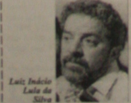
Luiz Inácio Lula da Silva

(Do candidato do PT à Presidência, Luiz Inácio Lula da Silva, ao criticar as intenções do governo em aumentar impostos para equilibrar o déficit público do país. GAZETA - 2300)