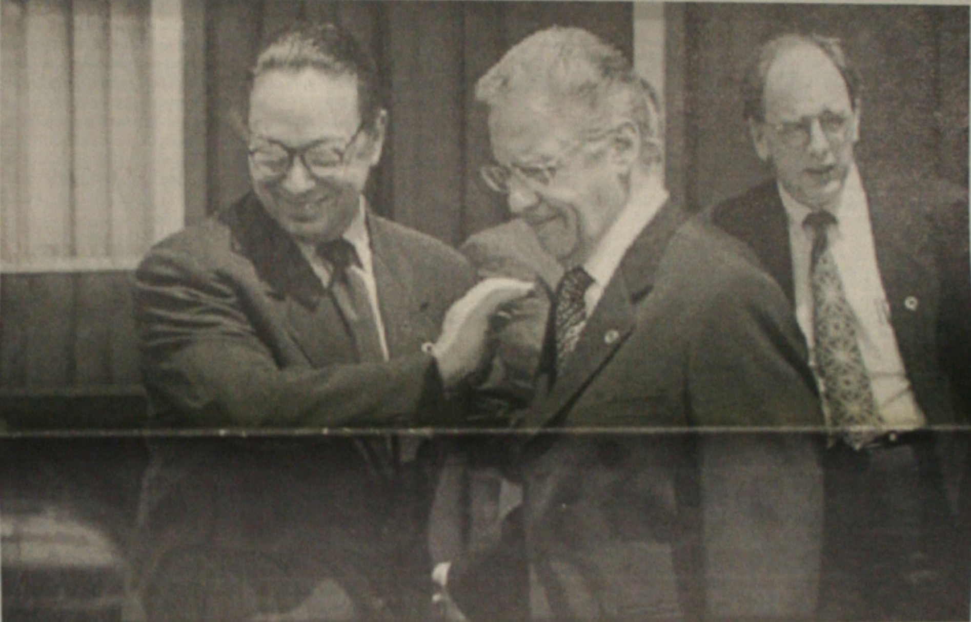
O ministro Pedro Malan (D) cumprimenta FHC à saída da solenidade de entrega do prêmio Qualidade do Governo Federal

Pela primeira vez desde o agravamento da crise financeira internacional, o presidente Fernando Henrique Cardoso deixou claro ontem que um futuro aumento nos impostos será a alternativa para sanear as contas públicas, se não for feito um rápido processo de corte nas despesas. O ajuste fiscal proposto pelo presidente passa pela conclusão das reformas administrativa, previdenciária e da legislação trabalhista, tarefas que devem ser enfrentadas logo após as eleições presidenciais do dia 4. "Se não formos capazes de reduzir as despesas na velocidade e volume necessários, como estamos propondo, talvez sejamos obrigados a uma discussão aberta sobre aumento de impostos", disse o presidente. Fernando Henrique aproveitou a solenidade de entrega do Prêmio Qualidade do Governo Federal a setores destacados do serviço público para marcar a posição do governo diante do agravamento da crise e preparar Congresso, governadores, prefeitos e a sociedade para a dureza do ajuste. "É meu dever apresentar ao povo brasileiro uma visão sobre o que precisa ser feito", afirmou o presidente. (Página 8A)