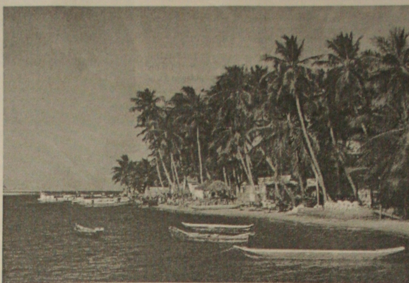
No domingo, os participantes do curso registraram as belezas naturais de praias e povoado de Mangue Seco