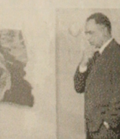
General Cardoso explica caso das fitas

De acordo com o ministro-chefe da Casa Militar em agosto a Subse-