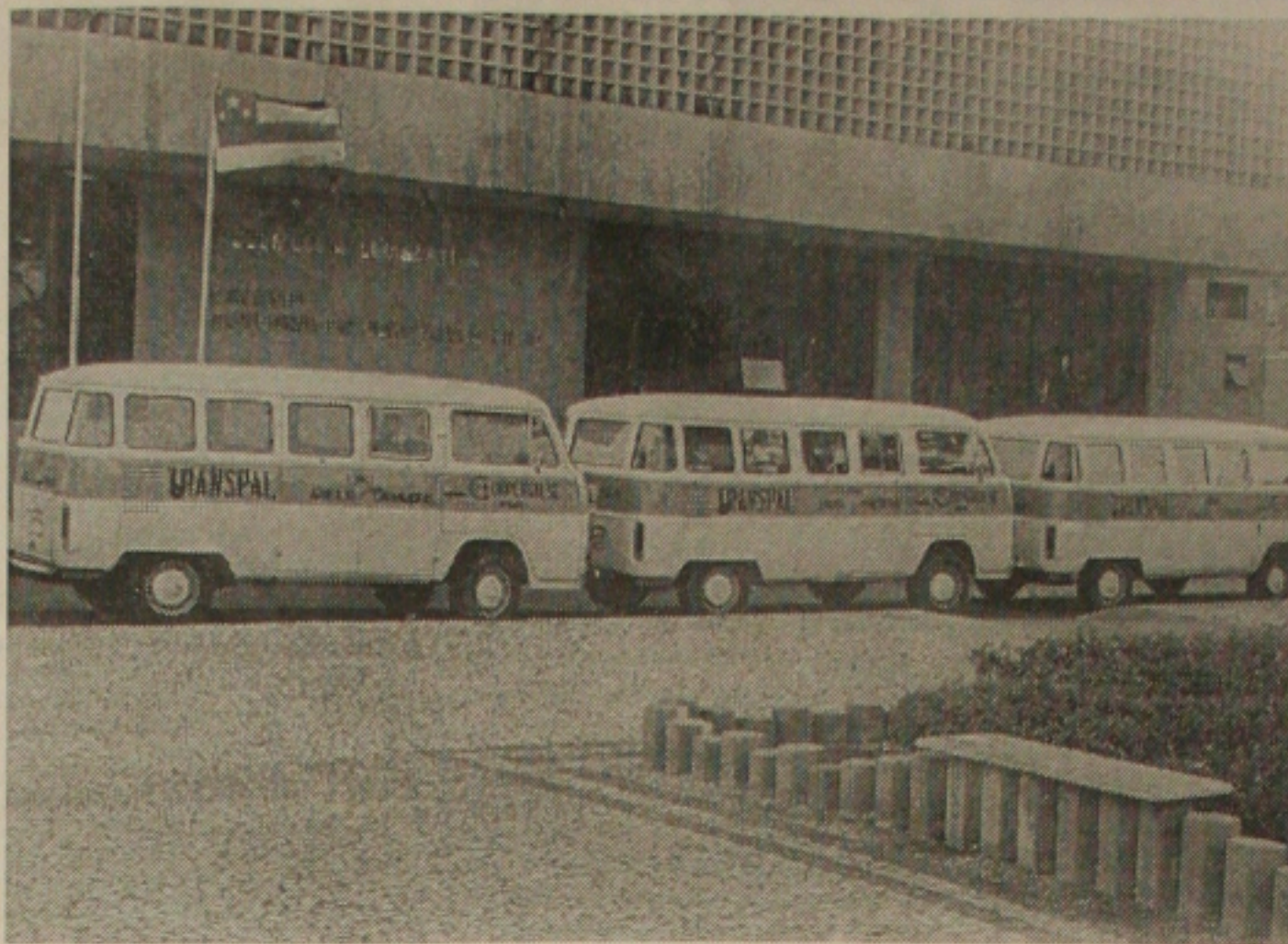
A SMTT garante que intensificará a fiscalização ao transporte clandestino em Aracaju