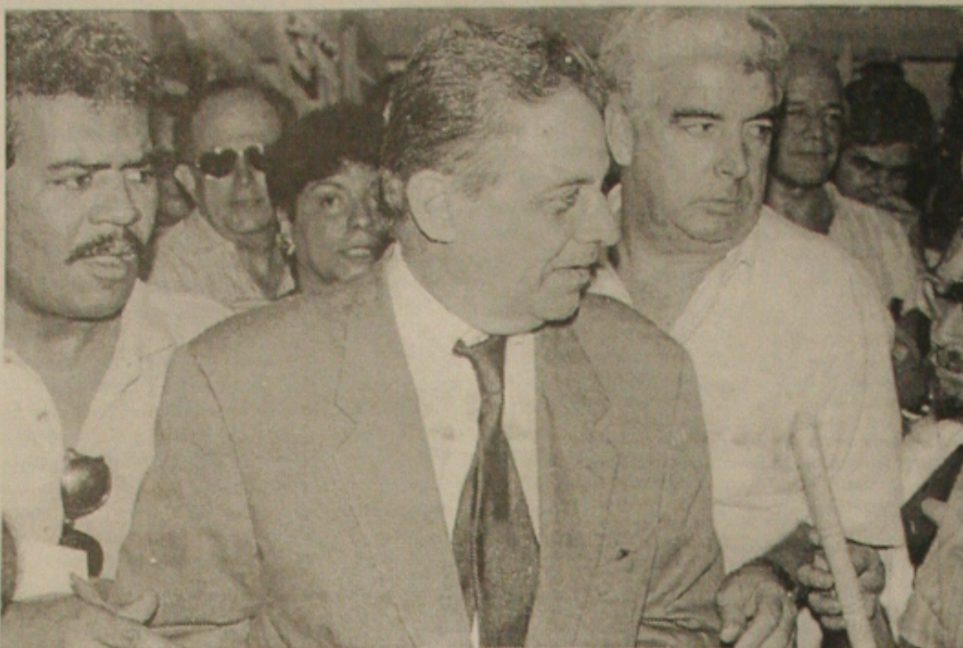
FHC é desafiado pelo PT a responder acusações em CPI

O governo federal, adiantou Arnaldo Madeira, realmente não descarta o envio de uma nova PEC. "Ainda não esgotamos todas as possibilidades", acrescentou. "Temos como alternativa as propostas que estão tramitando no Senado", lembrou o líder governista, referindo-se às PECs 26/97 e 17/98 de autoria dos senadores Wilson Kleinubing (PFL-SC) e Coutinho Jorge (PSDB-PA), respectivamente, que também propõem a prorrogação da CPMF.