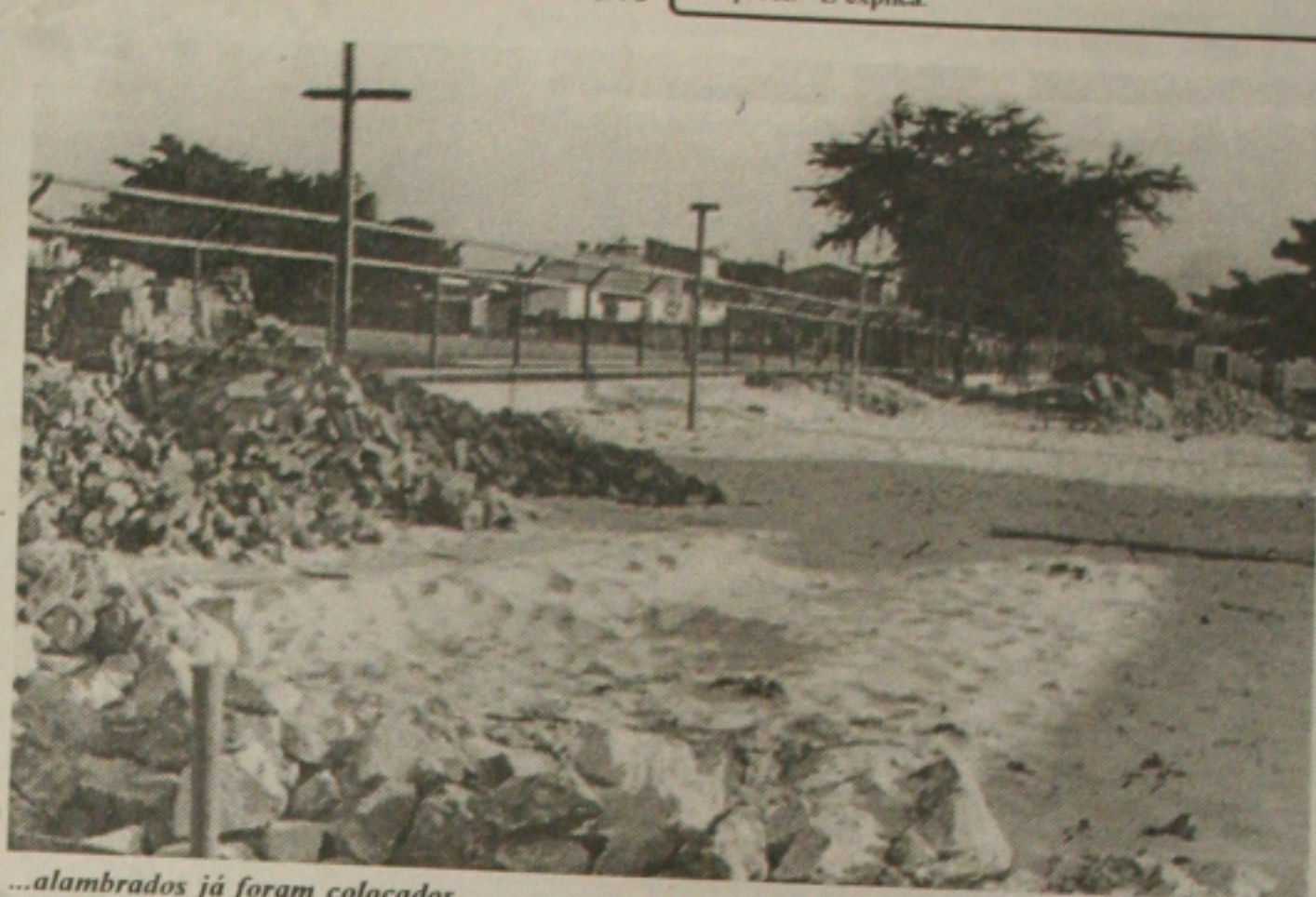
...alambrados já foram colocados...