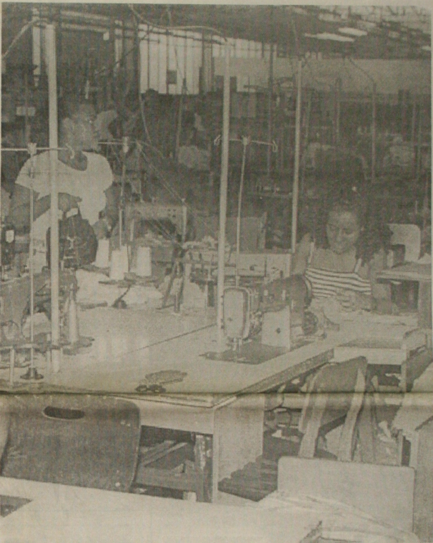
Só este ano, mais de mil postos de trabalho foram extintos na indústria têxtil de Sergipe