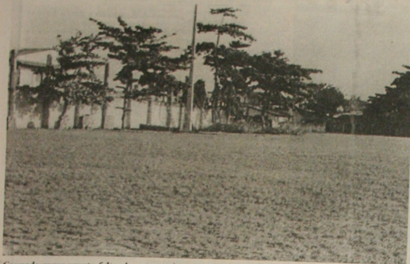
Gramado quase pronto faltando espaço da casa...

Aracaju, quinta-feira 12 de novembro de 1998