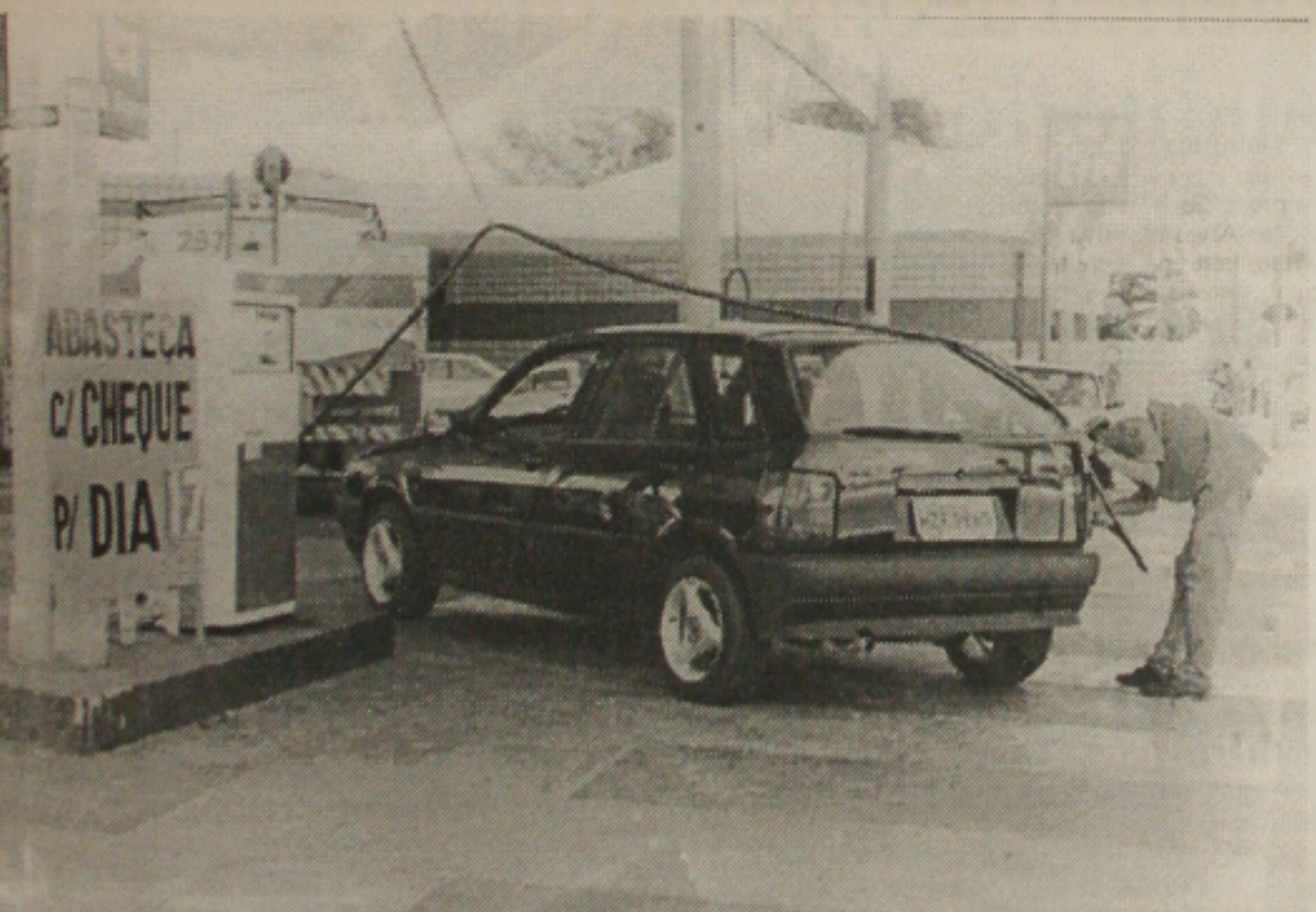
A redução de 20% no preço do combustível em São Paulo é considerada absurda por sindicalista