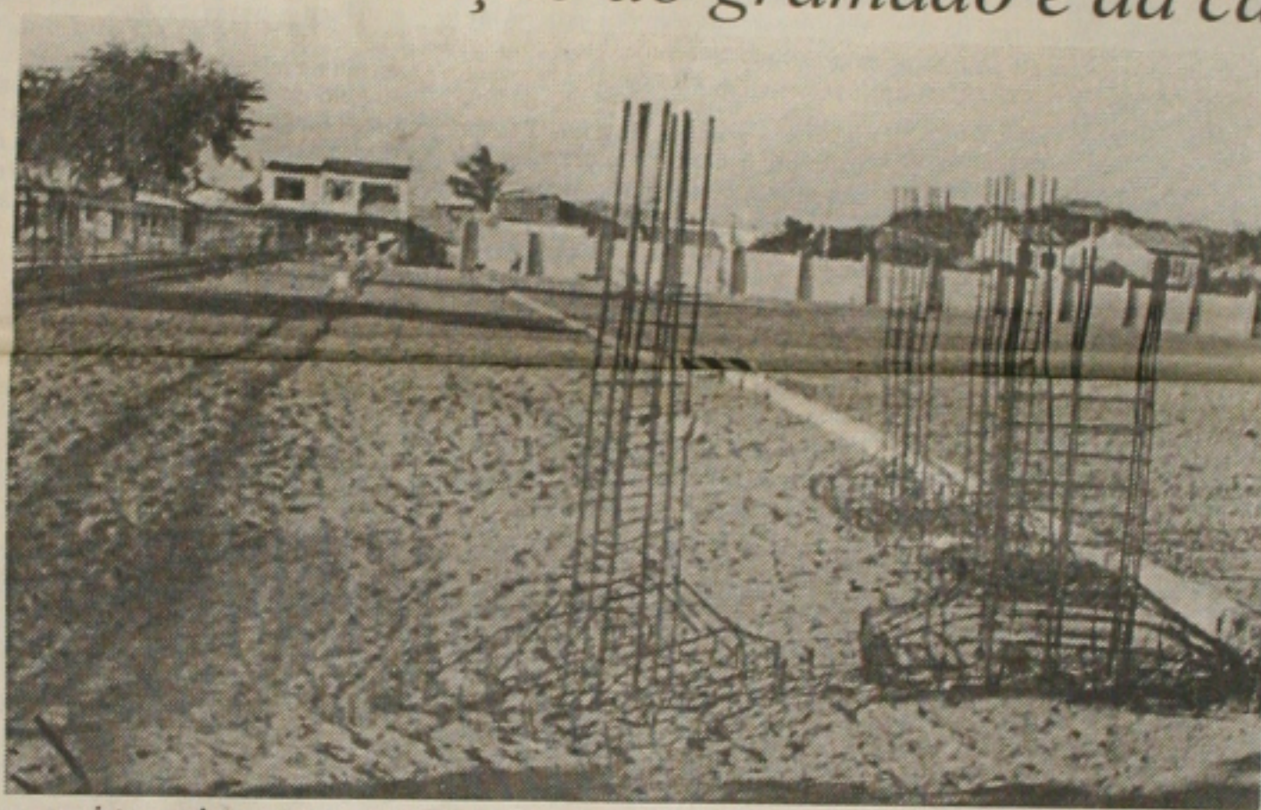
...e a pista praticamente pronta.

Ainda a construção de 12 lojas de 18 metros quadrados cada, para fins comerciais, e mais alguns salões que abrigarão algumas Federações e outros servirão para reuniões, festividades, encontros da comunidade ali residente. Nos fundos de gol, além dos muros de 7 metros de altura, serão colocados ainda alambrados, justamente para evitar a saída constante da bola e as casas recebam os impactos. Tudo foi projetado para evitar danos aos moradores e cause bem-estar a todos, notadamente os desportistas. Conforme o presidente da Fundesp, o Estádio está sendo construído não só com a finalidade da prática do futebol (atividade fim), mas atender aos comunitários em suas festividades e reuniões numa parceria importante.