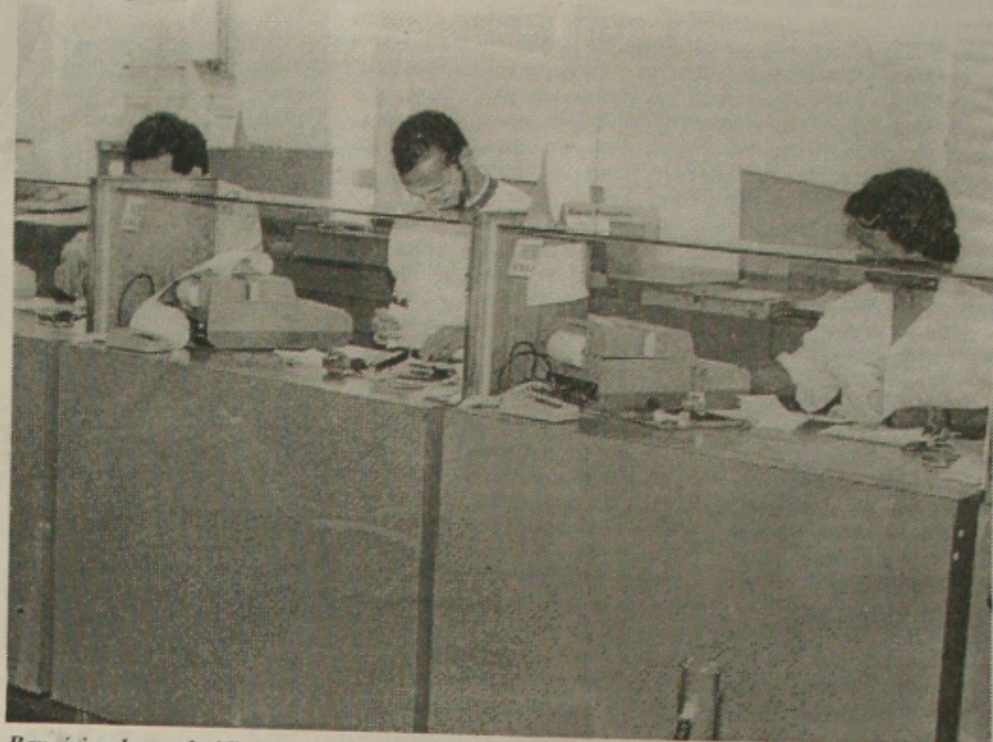
Bancários devem decidir hoje à noite em assembleia-geral se paralisam ou não no dia 18

Souza fez questão de ressaltar que a assembleia geral não deixa de fora os bancos federais que adotam as mesmas medidas dos privados. Pessoas sujeitas a demissões, transferências como no caso do fechamento do Cesc (Centro de Processamento de Serviços e Documentos do Banco do Brasil) - quando 300 pessoas estarão logo desempregadas atingindo indiretamente mais de mil.