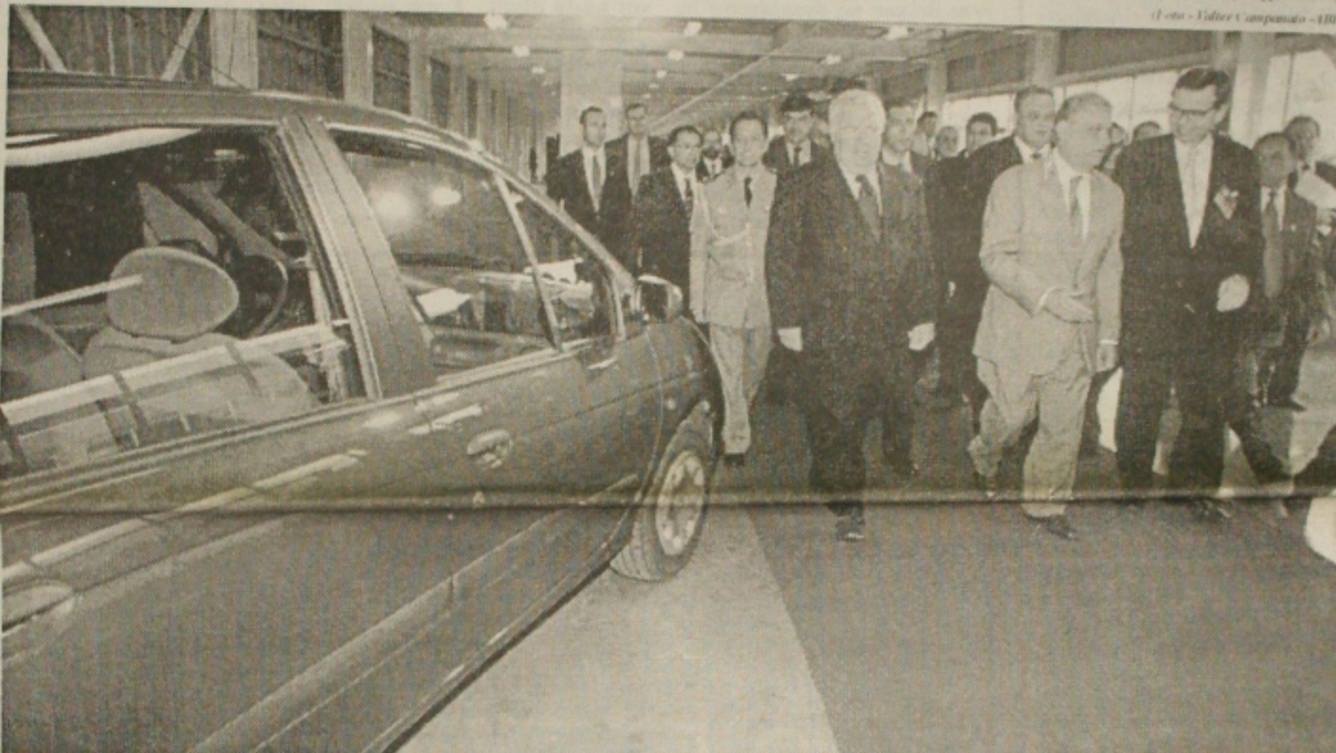
FHC, acompanhado do governador Jaime Lerner e diretores da Renault visita a fábrica inaugurada ontem no Paraná