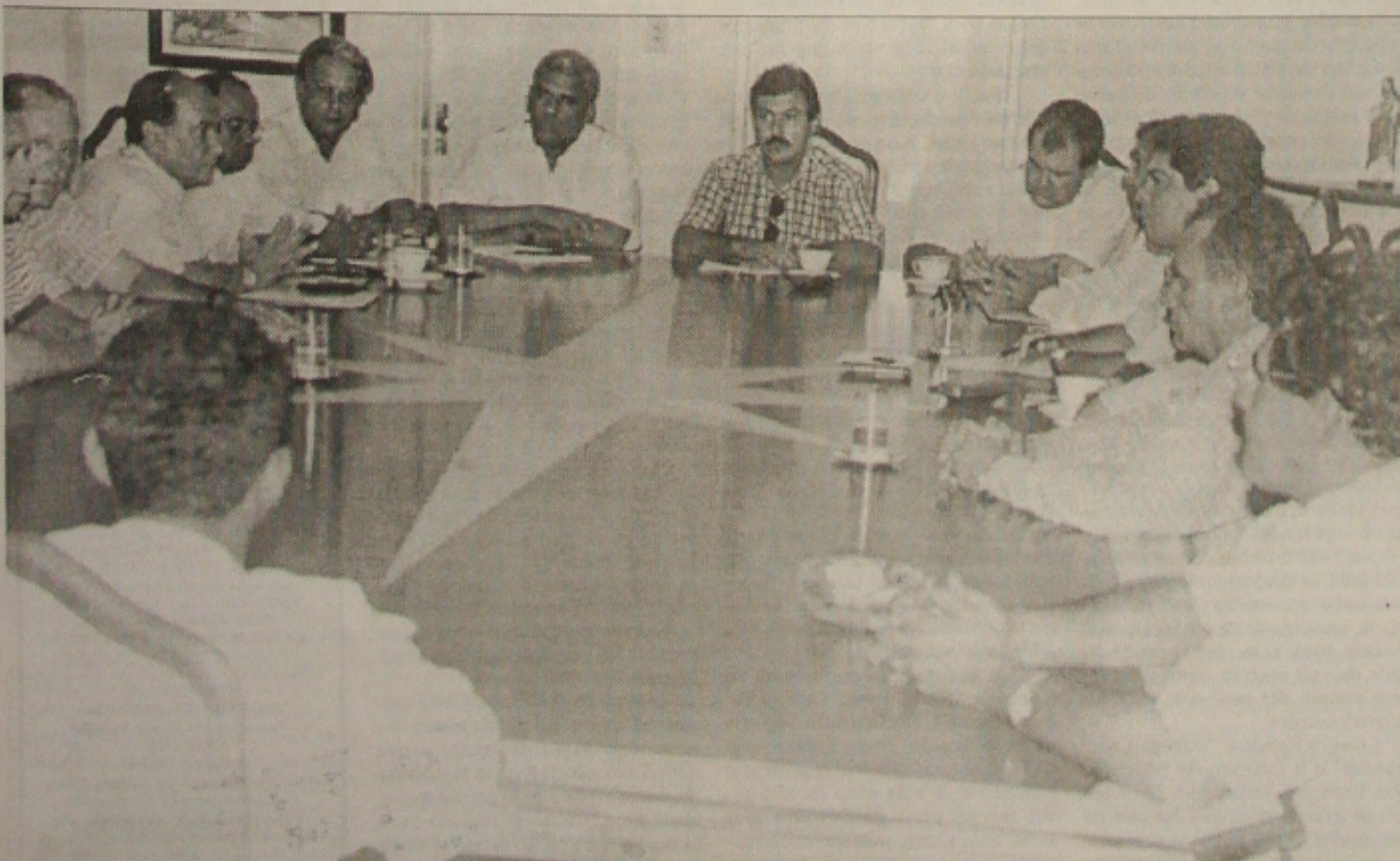
Reunião realizada ontem à tarde na Câmara dos Vereadores para tentar resolver o problema dos garis