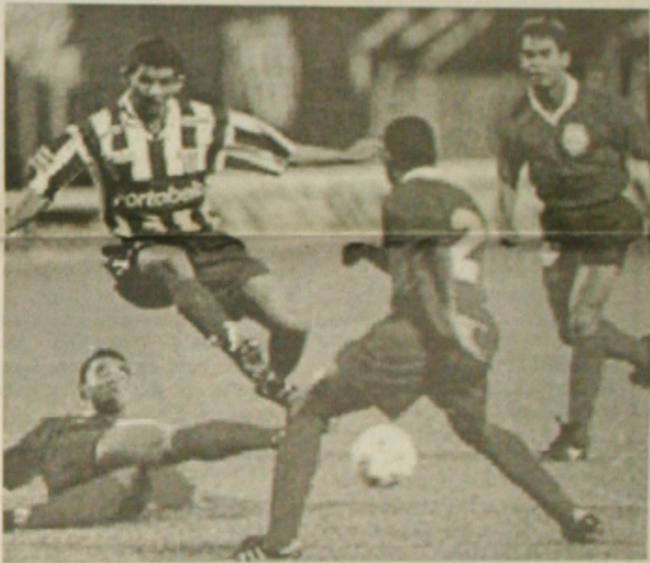
A defesa do Anapolina barrou o ataque do Avai na Ressacada e pretende fazer o mesmo com o Itabaiana amanhã