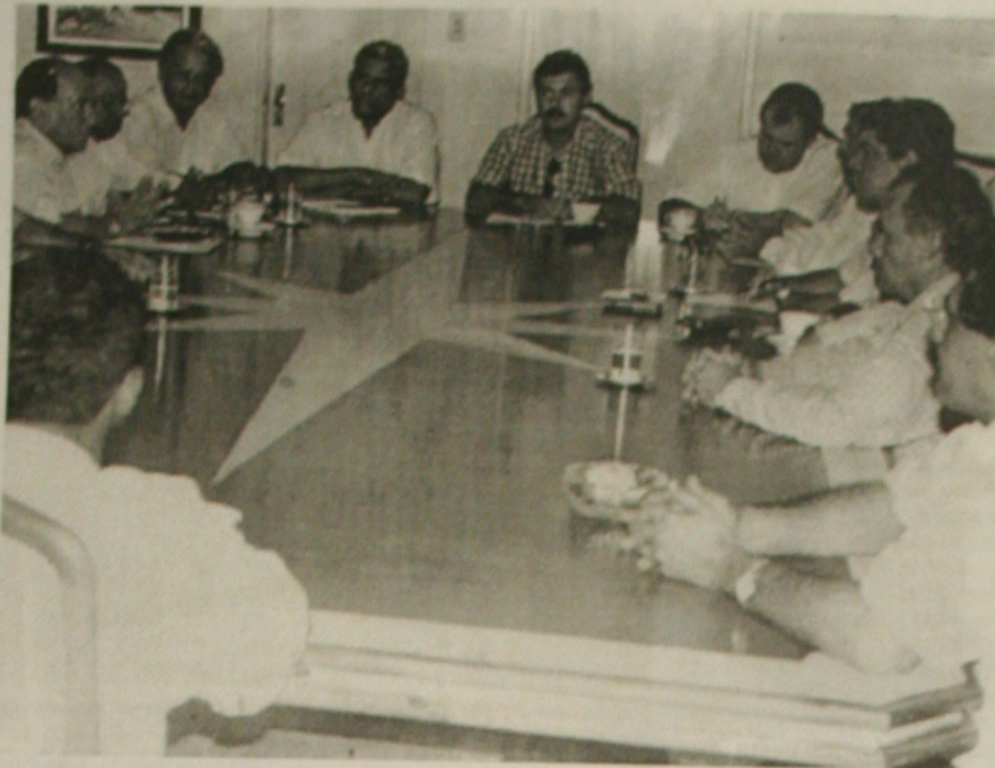
Vereadores, representantes da Igreja e Sindicato se reúnem para discutir o problema dos garis