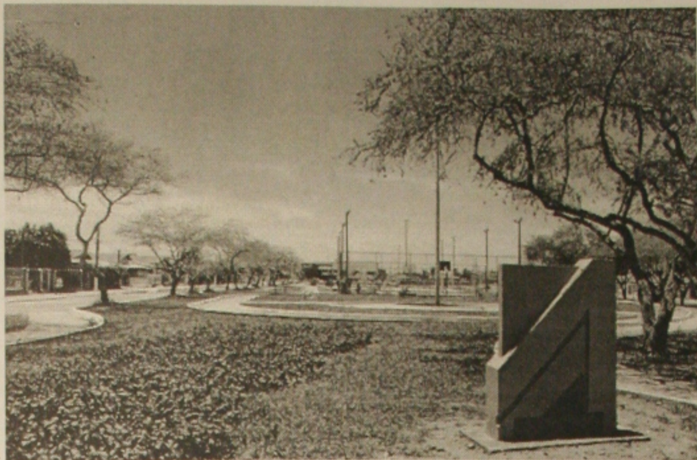
A prefeitura de Aracaju continua recuperando as áreas de lazer em toda a cidade

As carteiras confeccionadas, estão sendo usadas pelos portadores sem nenhum problema, porque o Ipes não tem condições de detectá-las. Os maridos que as receberam, podem usá-las tranquilamente e quem não chegou a receber, espera então, pela correção da redação.