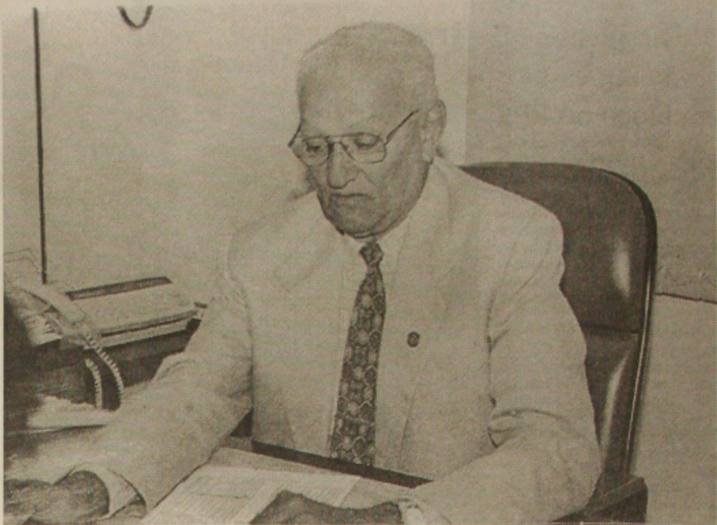
Nascimento diz que o número de aberturas de empresas este ano apresentou uma pequena redução

Recadastramento - Depois do recadastramento das empresas, foi que houve essa baixa. "De uns quatro anos para cá, cerca de 15 mil empresas foram constitui-