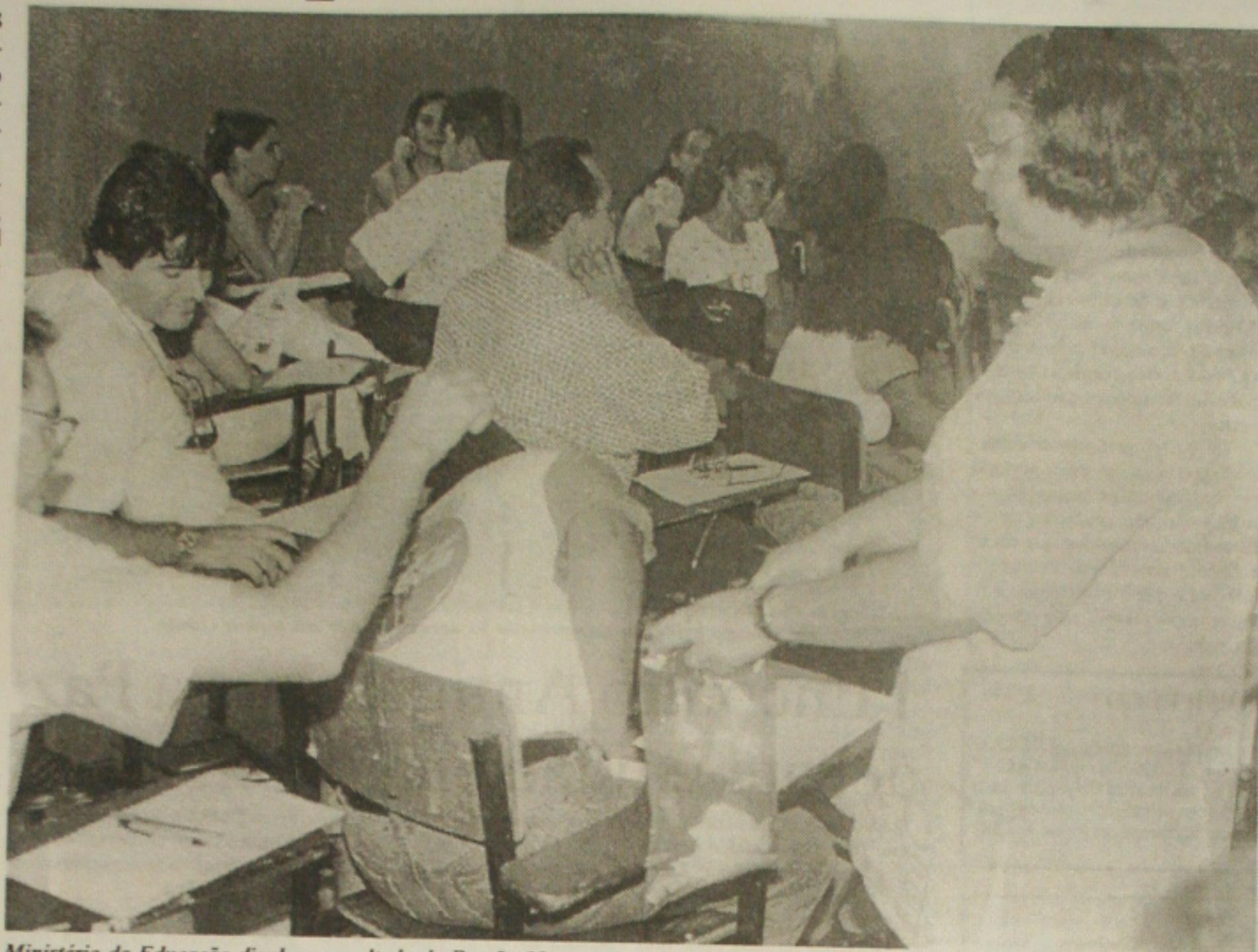
Ministério da Educação divulgou resultado do Provão 98 que mostra melhora no ensino superior das instituições privadas

c) pressionados pelos alunos e pela sociedade, as instituições estão se mobilizando para melhorar as condições de oferta dos cursos;