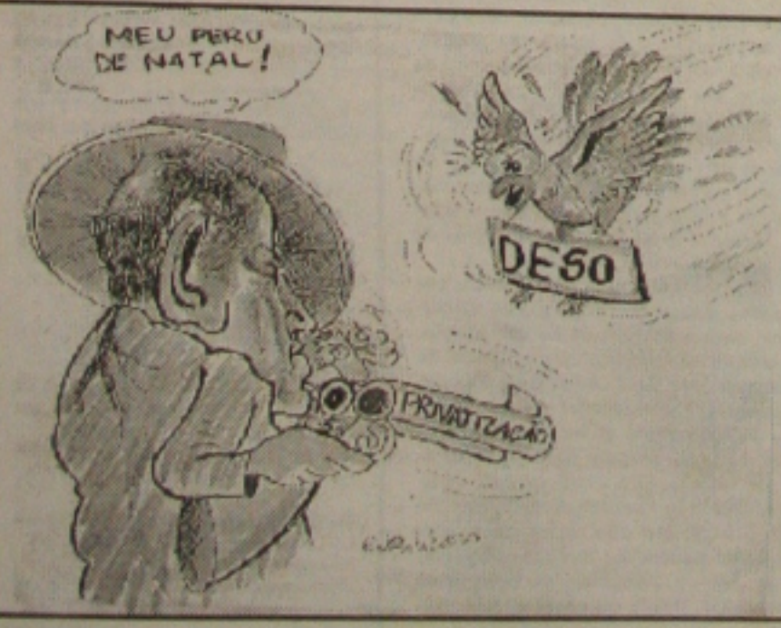
MEU PERU DE NATAL!