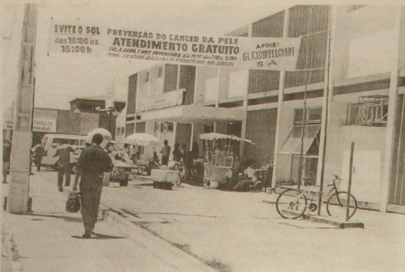
Pacientes com suspeita de câncer de pele foram atendidos ontem gratuitamente no SUS do Siqueira