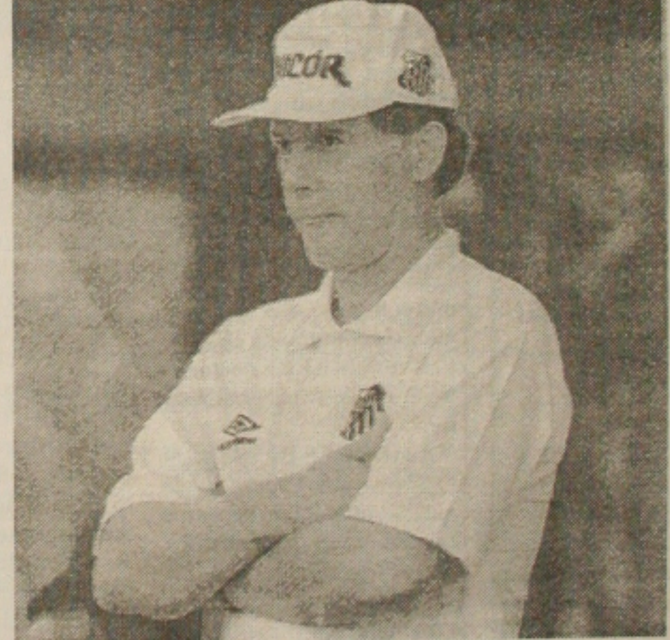
Leão: dever de gratidão com o Santos

se. Antes de vir para o Santos, Leão trabalhou no Japão, Pernambuco, Rio Grande do Sul, Paraná e Minas Gerais. Enquanto nada é decidido em relação ao grupo de jogadores, os dirigentes já fixaram as metas para o próximo ano. A mais ambiciosa é a nova iluminação da Vila Belmiro, que deverá ser inaugurada em janeiro, no primeiro jogo que o Santos disputar em casa. Haverá um investimento em torno de US$ 750 mil para resolver um dos problemas mais sérios do clube. "Depois do novo gramado, vamos fazer o novo sistema de iluminação, já que o atual tem mais de 30 anos e será preciso uma mudança completa, a começar pela cabine de força".