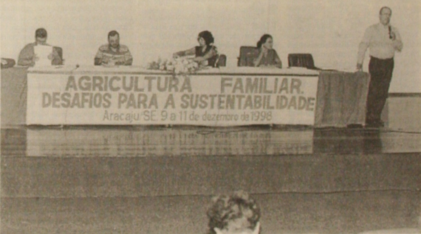
Desafios para a sustentabilidade foi tema principal do Seminário Familiar no CIC