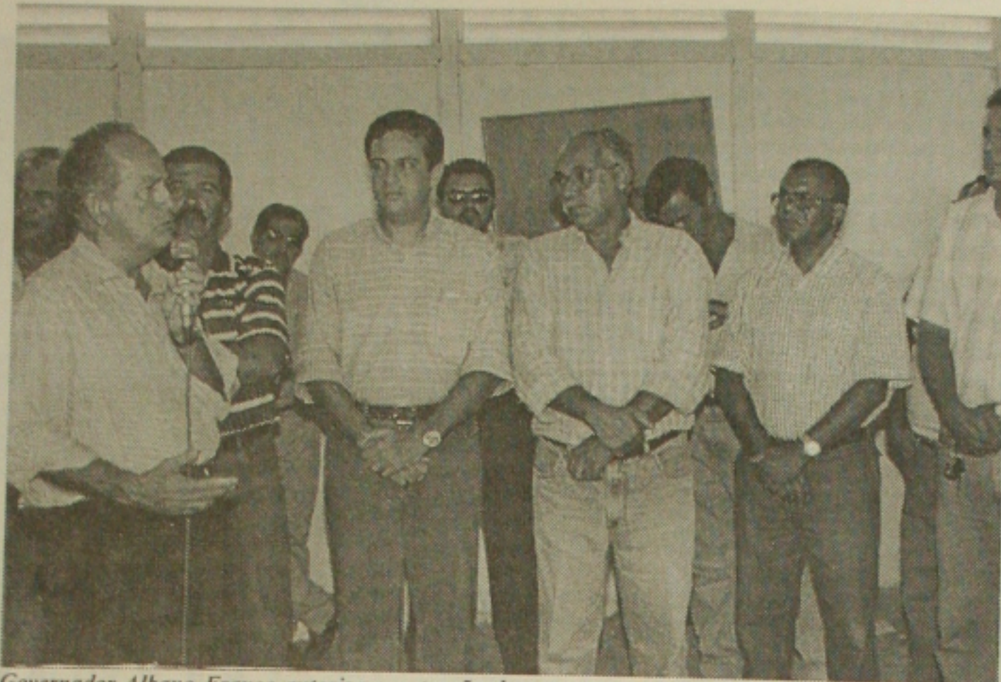
Governador Albano Franco autoriza construção de ponte

Para animar a garotada está prevista apresentação de bandas, corais e ginástica ao ritmo das músicas do Padre Marcelo Rossi. A chegada de Papai Noel (de helicóptero) será por volta das 17:00 horas e logo após a apresentadora infantil Mara Maravilha estará cantando para a garotada. O encerramento será com um show pirotécnico.