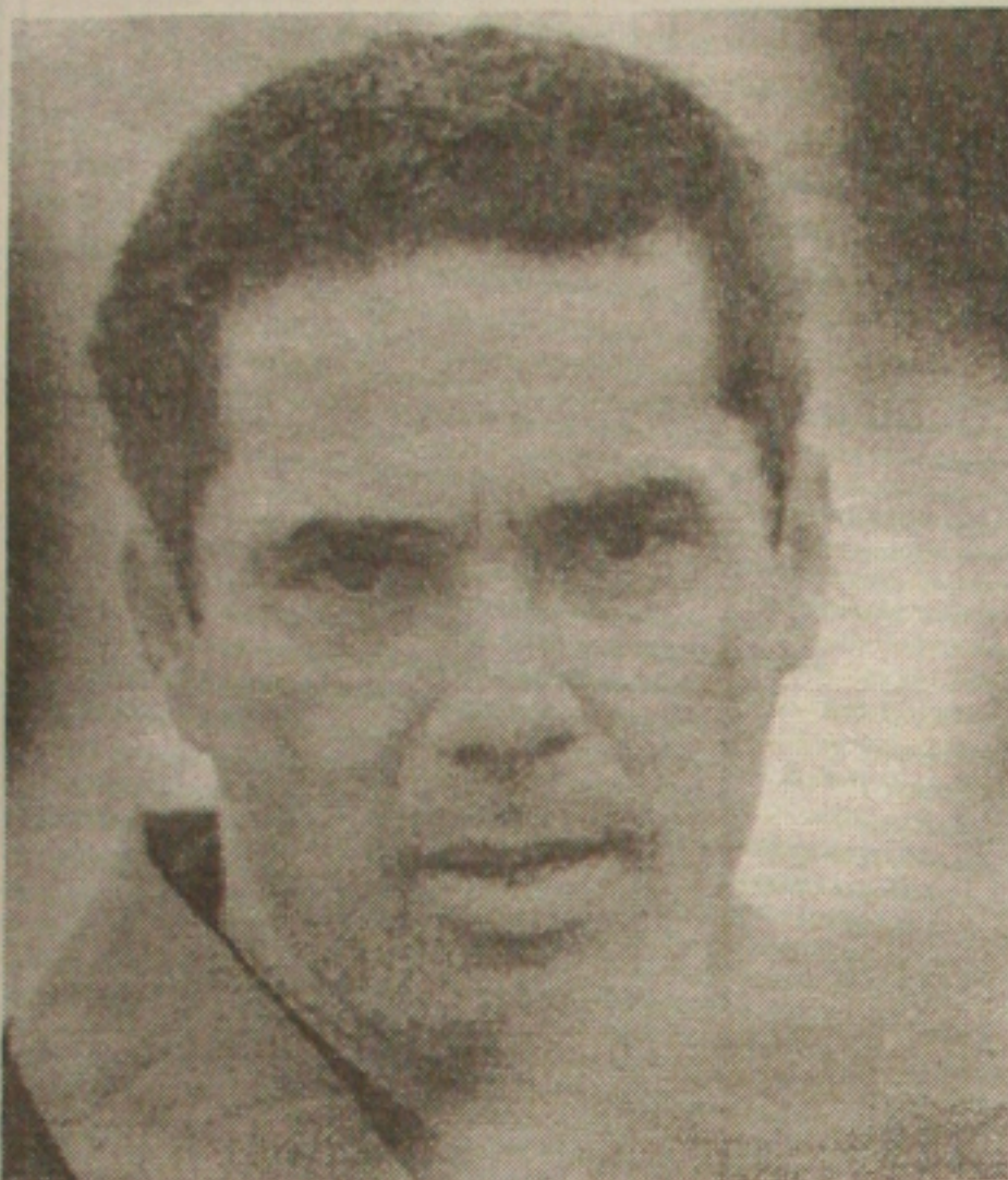
Luxemburgo não abre mão do jogo em São Paulo, de preferência no Pacaembu