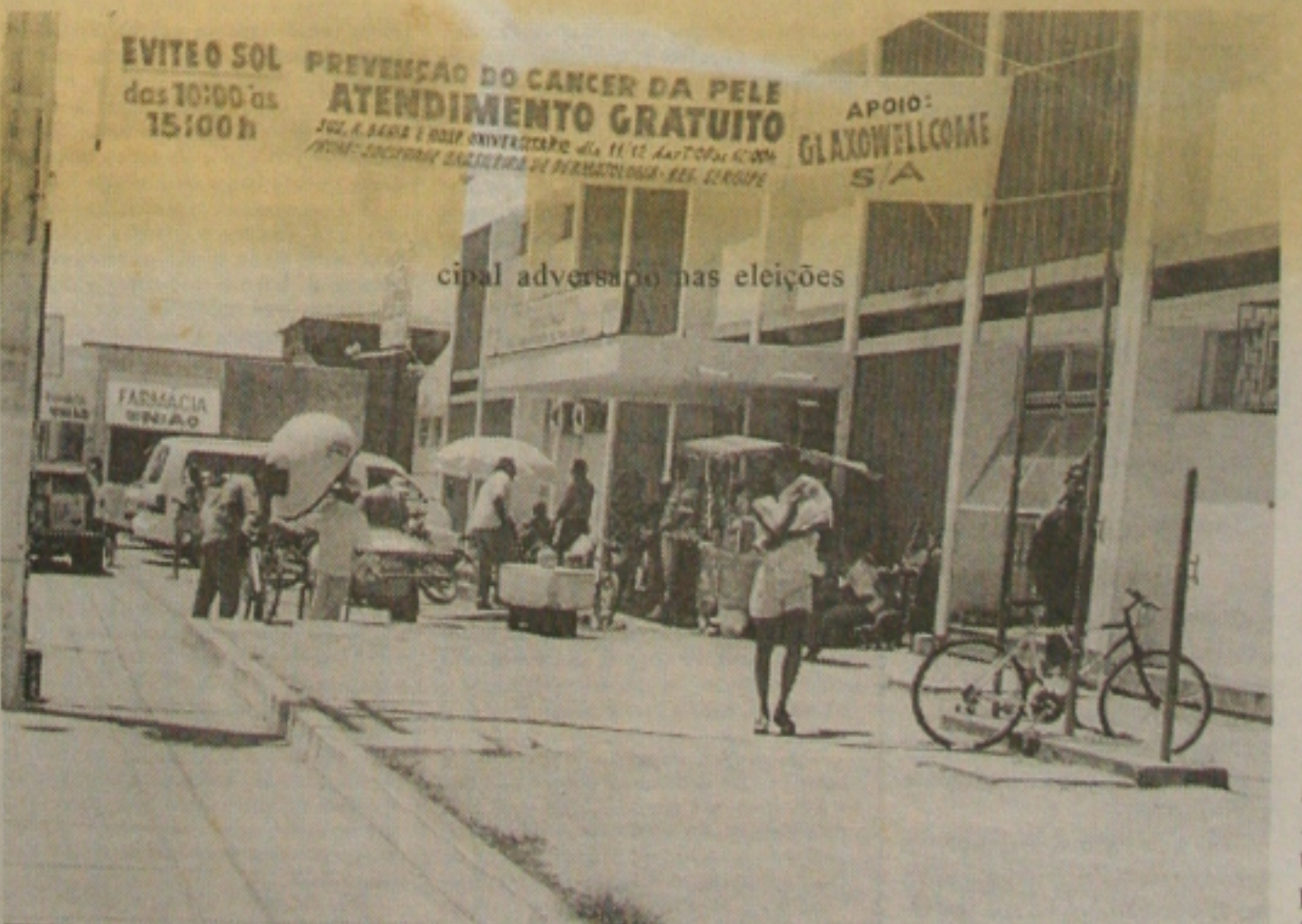
A Sociedade de Dermatologia promoveu ontem o atendimento gratuito para detectar câncer de pele. (Página 6A)

Corte de 400 cargos em comissão, devolução de carros alugados e controle nos gastos com telefone - a conta não pode ultrapassar a R$ 150,00 - e com combustível - cota limite de 30 litros por semana. Estas são algumas das medidas que o prefeito de Lagarto, Jerônimo Reis (PMN), decidiu adotar para equilibrar as finanças do município. Segundo o prefeito, essa foi a forma encontrada para viabilizar a administração, diante da redução na receita do município, que caiu de aproximadamente R$ 1,1 milhão para algo em torno dos R$ 500 mil, ou seja, uma queda de cerca de 50%. "Meus conterrâneos vão entender que queremos uma cidade progressista e será imperativo administrar com mão-de-ferro", argumentou Reis. (Página 7A)