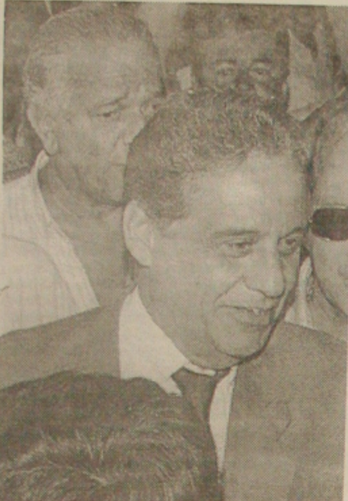
FHC: convite aceito