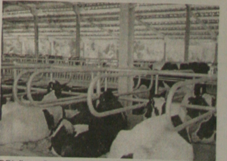
DFA diz que fiscaliza a produção do leite

Na maioria das vezes, as irregularidades ficam por conta da falta de higiene no local. Normalmente são locais que não condizem com o trabalho no estabelecimento comercial. "Mas, temos fiscalizado sempre e volto a dizer, no próximo mês de fevereiro, voltaremos a intensificar as visitas", finaliza o delegado.