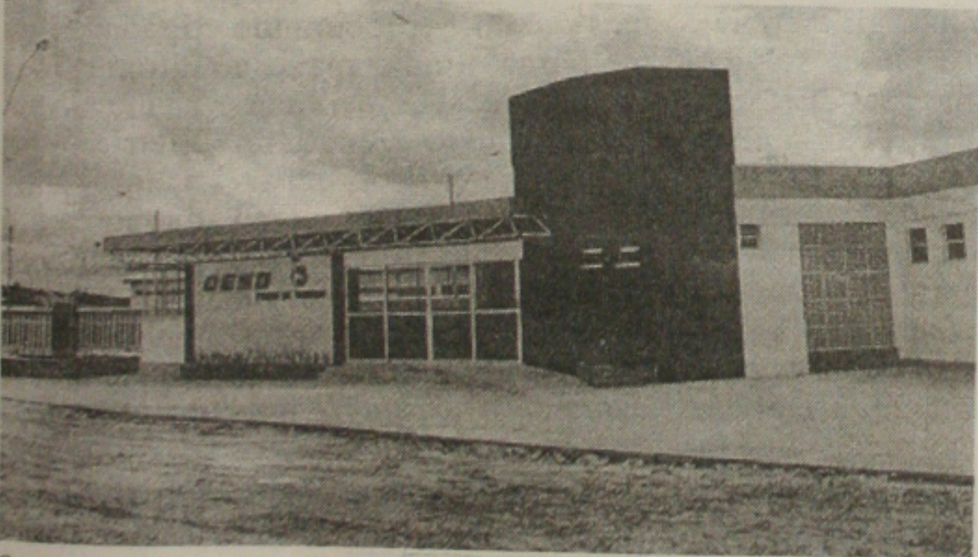
O posto de atendimento de Socorro, atenderá vários conjuntos localizados naquele município

Nos postos de atendimento da capital, os usuários podem pedir ligações, 2ª via de contas, verificação de valores. Enfim, tudo para que o consumidor sintam-se à vontade quando procurar uma unidade da Companhia de Saneamento de Sergipe.