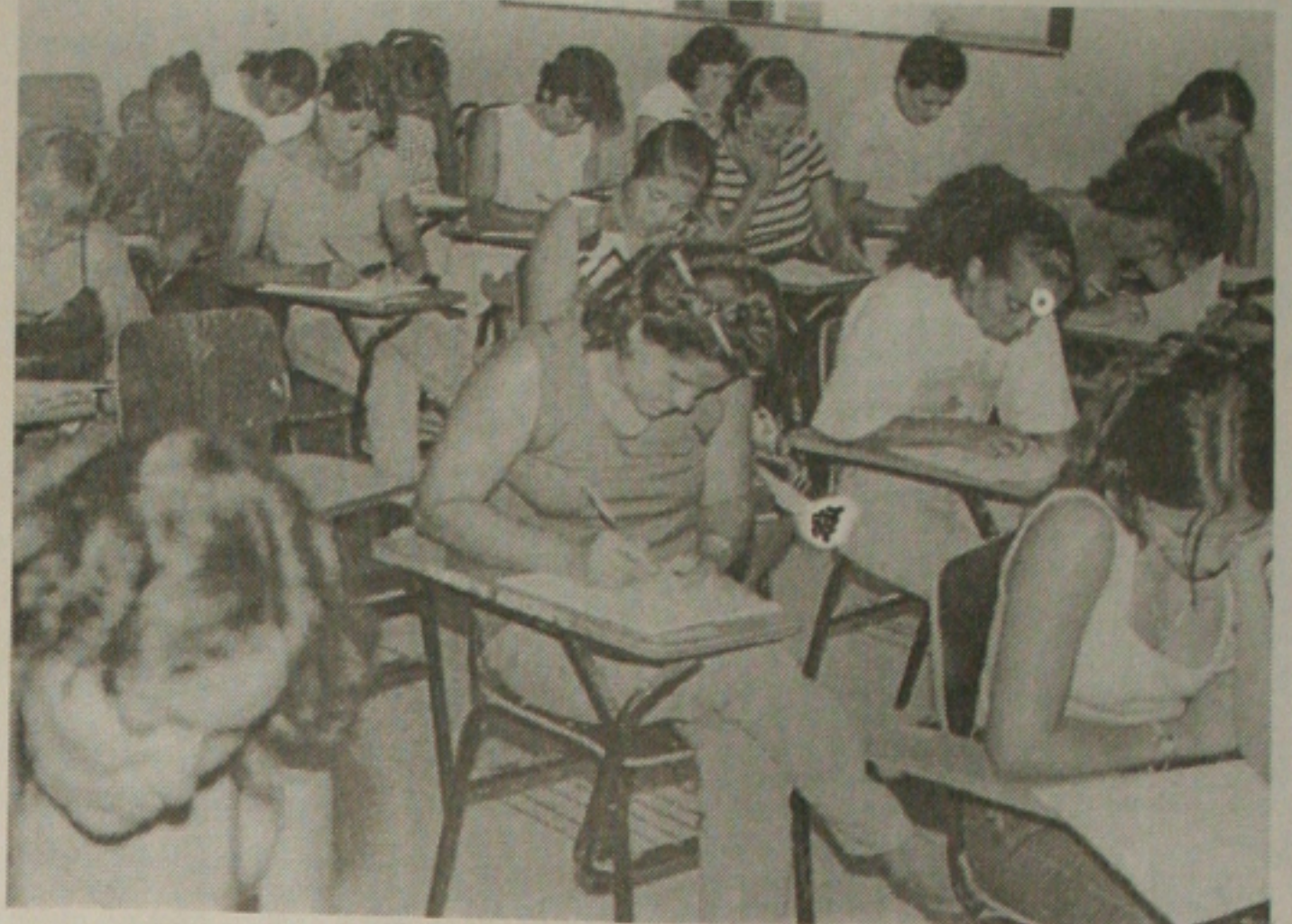
A Universidade Federal de Sergipe anuncia para domingo, a segunda fase das provas do vestibular 99

Torres lembrou, que os candidatos deverão antecipar-se no dia das provas, chegando meia hora antes do início das provas ao local já determinado nos cartões, para evitar tumultos e atropelos que possam vir a prejudicar e que eles tenham à mão os documentos de identificação. "O procedimento é o mesmo da primeira fase, não houve nem haverá mudanças. Desejo a todos boa sorte", concluiu.