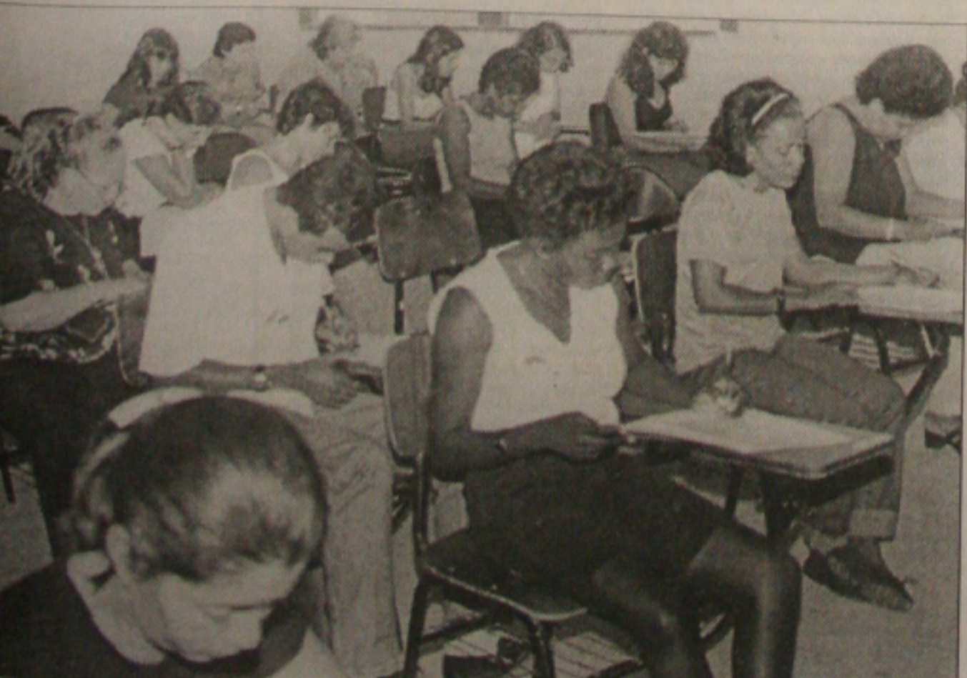
A partir de domingo, os aprovados na primeira fase iniciam a segunda etapa do Vestibular 99