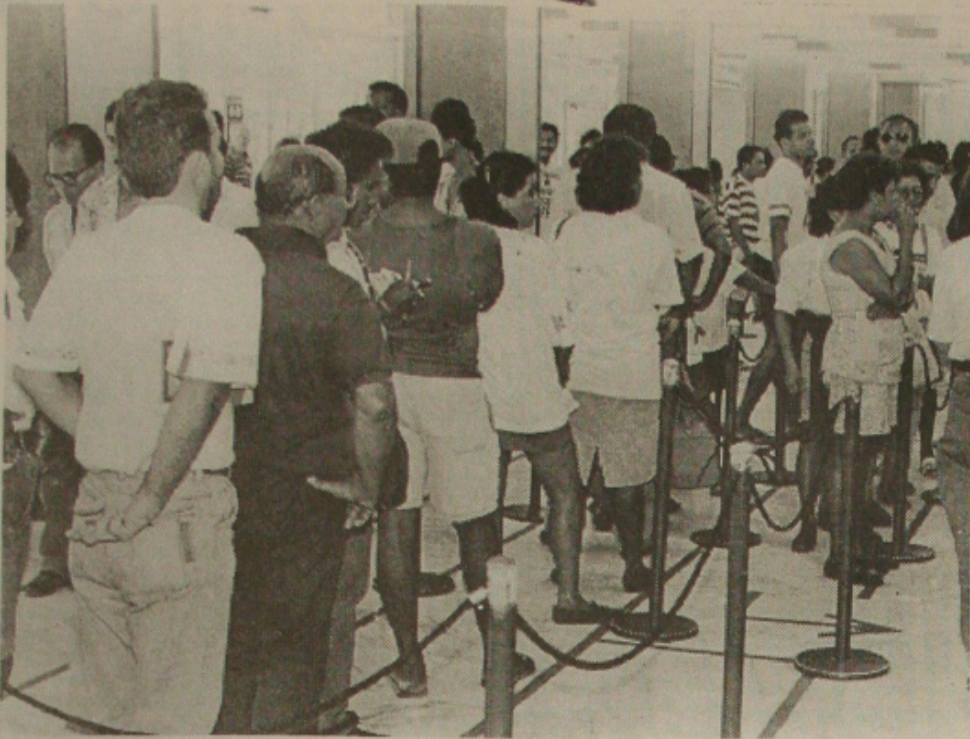
No primeiro expediente do ano de 99, as agências bancárias de Aracaju ficaram superlotadas