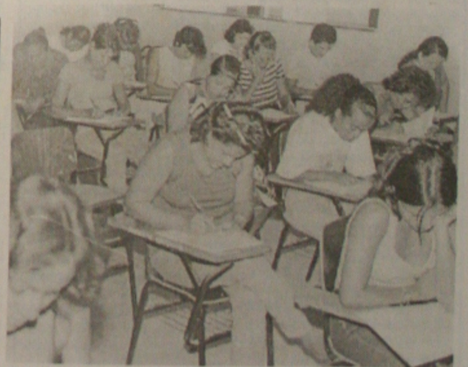
Neste domingo, pouco mais de 8,6 mil candidatos entram na reta final do Vestibular 99 da UFS

penha, mas uma decisão do Conselho Deliberativo do Detran (Departamento Estadual de Trânsito) decidiu anistia-los, por considerar que não houve tempo para os motoristas se familiarizassem com o novo código.