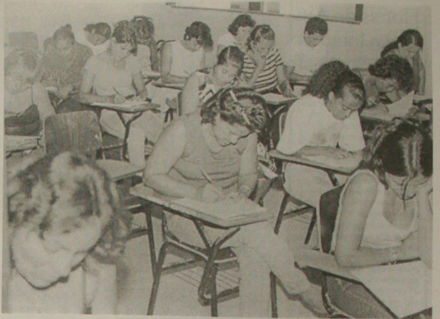
O sonho da universidade começa hoje a se concretizar com a realização da segunda fase das provas

Na primeira fase do Concurso Vestibular, ocorrida no dia 6 de dezembro do ano passado, concorreram 13.529 candidatos, que foram submetidos a realizar as provas de Português, Redação e Literatura Brasileira. Destes, 4.790 foram eliminados.