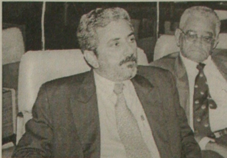
Bosco se diz preocupado com falta de recursos para agricultura e crescimento do desemprego

Costa, o agricultor só enxerga uma alternativa: migrar para as cidades. Ai ele aumenta seus problemas, porque sem uma profissão compatível com as necessidades urbanas, fica desempregado ou subempregado.