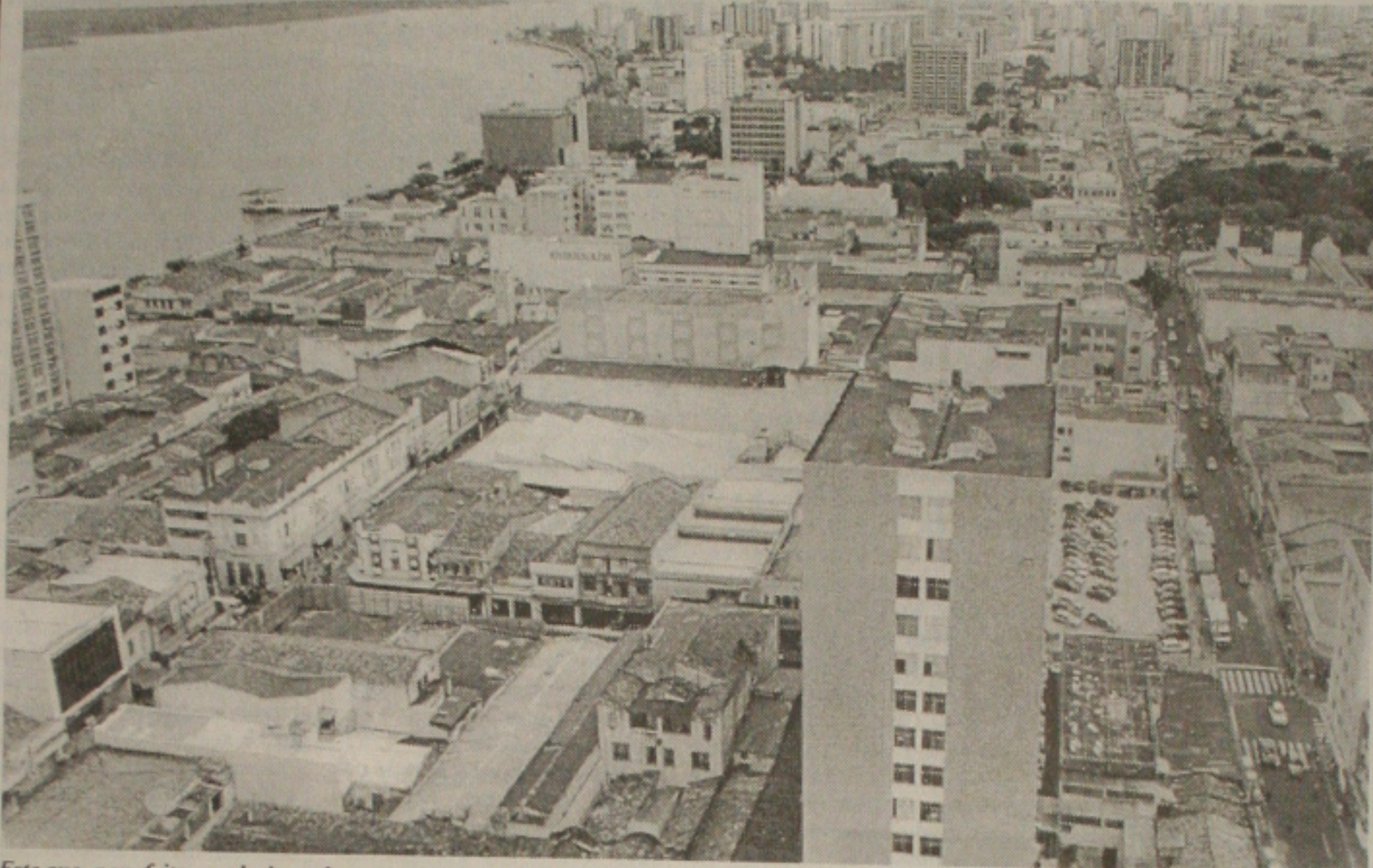
Este ano, a prefeitura reduziu os descontos na planta de valores dos imóveis da capital, para aumentar a receita do IPTU. (Página 6A)