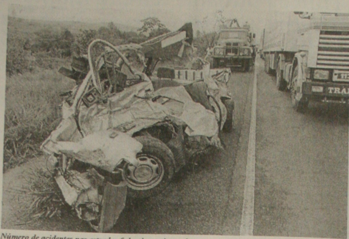
Número de acidentes nas estradas federais continua alto