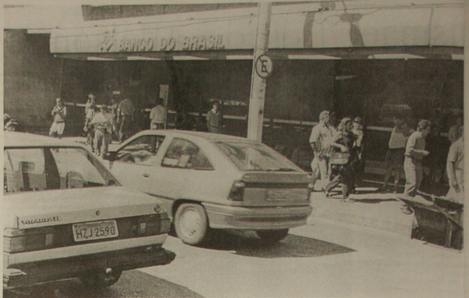
Apesar dos onze assaltos às agências do Banco do Brasil em 98, o número caiu em mais de 29% em relação ao ano anterior