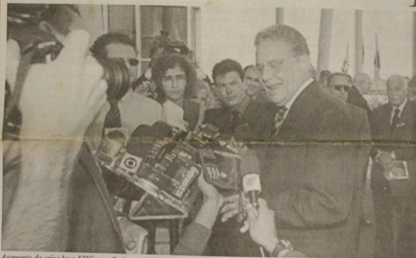
Aumento da crise leva FHC a pedir "tranquilidade" em cadeia de rádio e televisão

Temendo consequências imprevisíveis a equipe econômica do governo tomou uma medida surpreendente ontem. Liberou os preços das operações de câmbio e deixou que a moeda fosse desvalorizada frente ao dólar. O Real sofreu uma forte desvalorização - 7,6% - e passou a valer R$ 1,42 na troca pela moeda americana. Na semana a moeda brasileira acumulou 17,35% de queda. Acusado pela fuga de recursos rumo ao exterior o presidente Fernando Henrique Cardoso (PSDB) ocupou um espaço no rádio e na televisão para criticar o governador de Minas Gerais, Itamar Franco (PMDB), e pedir tranquilidade aos brasileiros. Tenso, atropelando as palavras, FHC disse em cadeia nacional que continuará defendendo o Real e que não permitirá a volta da carestia. "A avaliação equivocada tanto lá fora quanto aqui dentro de que não seríamos capazes de fazer o ajuste fiscal, e as declarações irresponsáveis sobre a moratória fizeram com que brasileiros e estrangeiros tirassem seus capitais daqui". O ministro da Fazenda, Pedro Malan, considerou positiva a reação do mercado. (Página 8A)