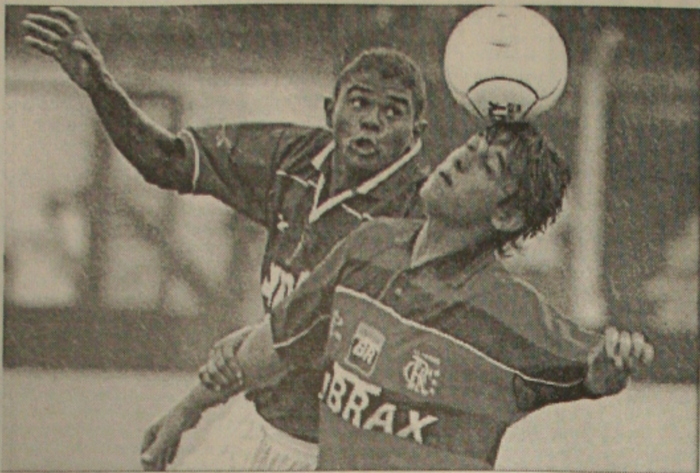
Time de melhor campanha o Palmeiras é um dos favoritos na Copa São Paulo