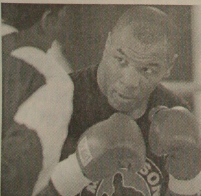
Mike Tyson volta aos ringues para enfrentar...