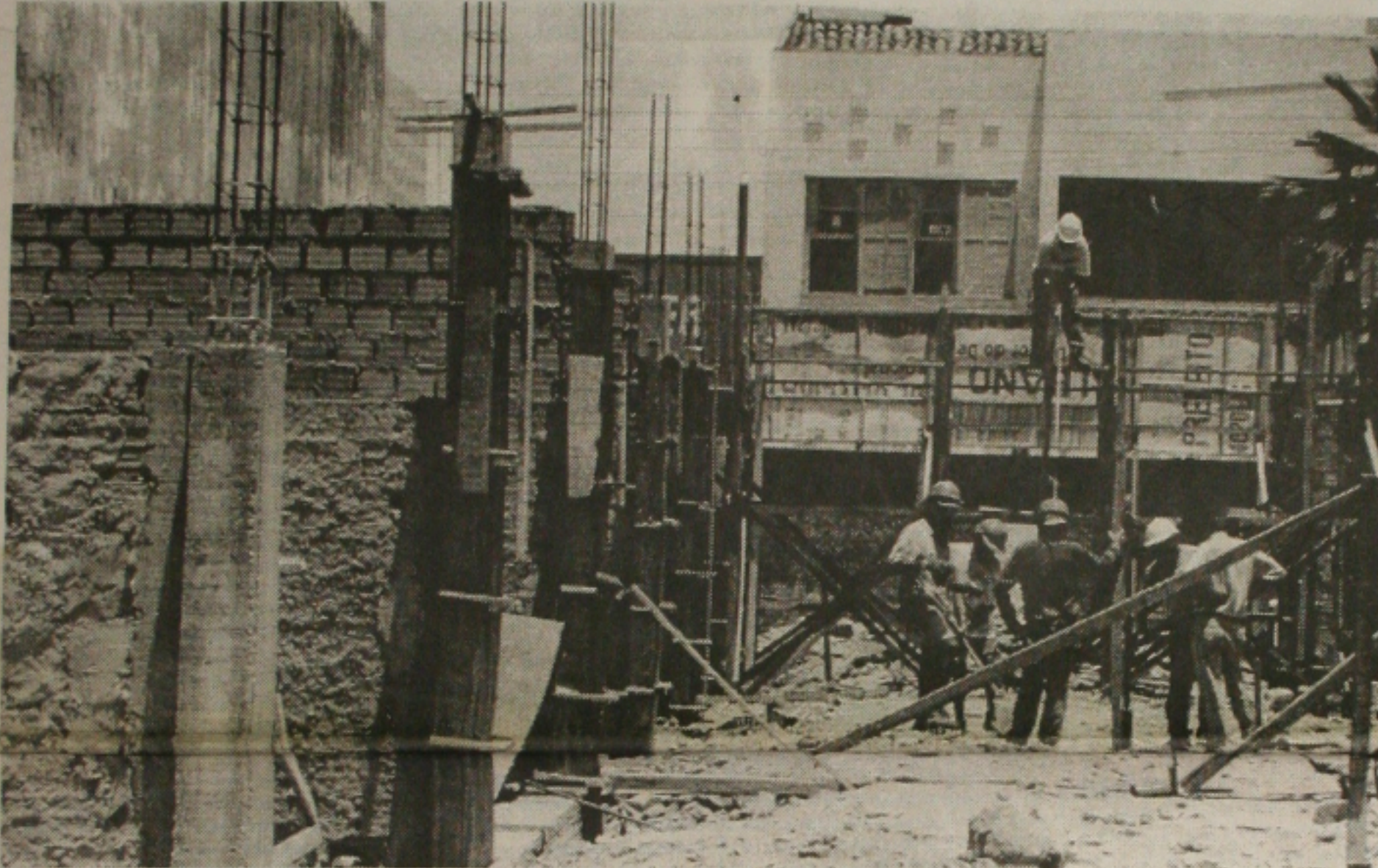
A construção civil, um dos setores que mais empregam tem sido recordista de demissões no País. (Página 6A)

Os governadores de oposição pretendem unificar o discurso para a reunião que o presidente Fernando Henrique Cardoso terá com todos os 27 governadores no próximo dia 26, na Granja do Torto, em Brasília. A intenção é forçar o presidente a discutir questões de interesse dos Estados dentro de uma pauta mínima de assuntos. Entre os pontos considerados consensuais entre os governadores de esquerda estão a renegociação da dívida, o fim das retaliações aos Estados de Minas Gerais e Rio Grande do Sul e uma solução para as perdas geradas pela Lei Kandir. Os go-