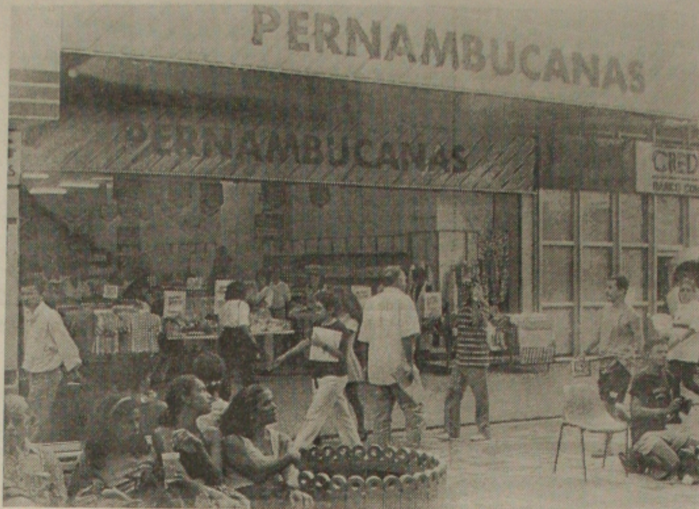
Setores do comércio lideram índice de desemprego