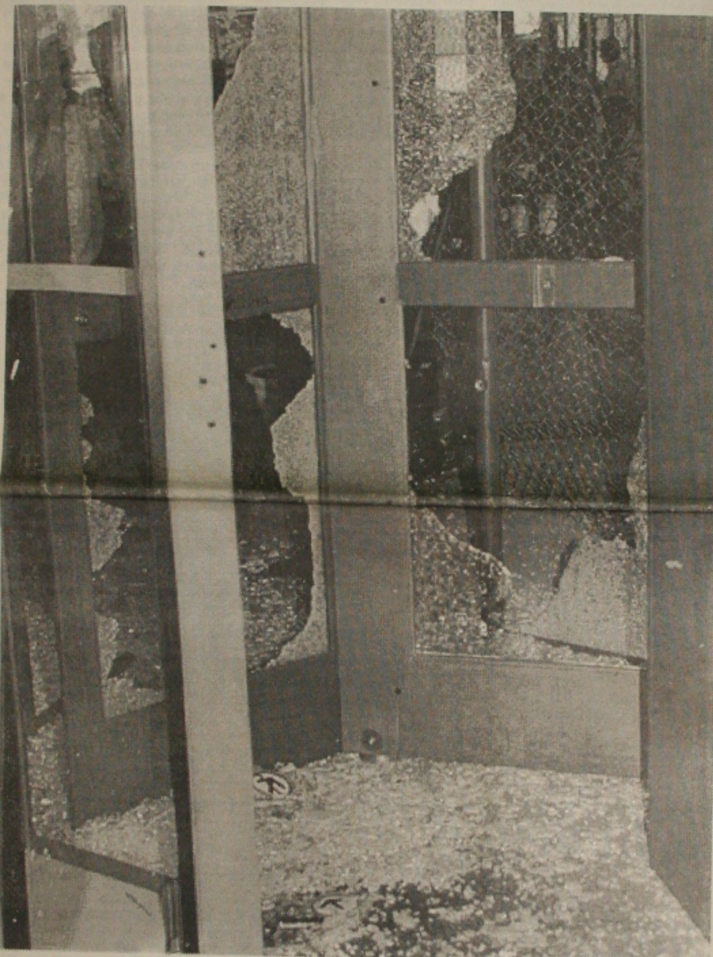
Depois do assalto, os ladrões fizeram diversos disparos com revólveres e pistolas quebrando os vidros da porta giratória