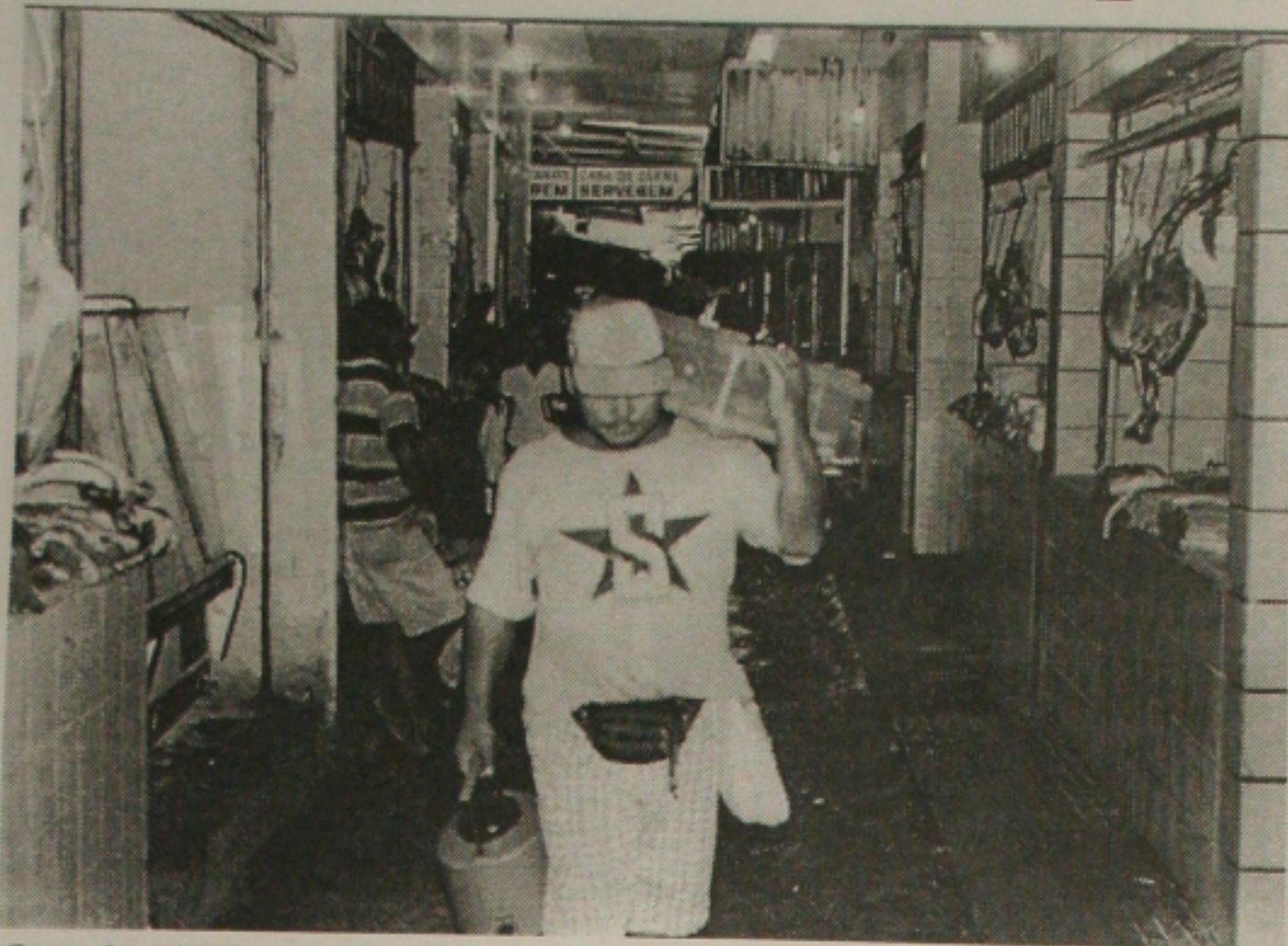
Com a desratização está sendo calculado a diminuição do número de roedores no Mercado Thales Ferraz e centro comercial de Aracaju. Até as mercadorias estão sendo danificadas