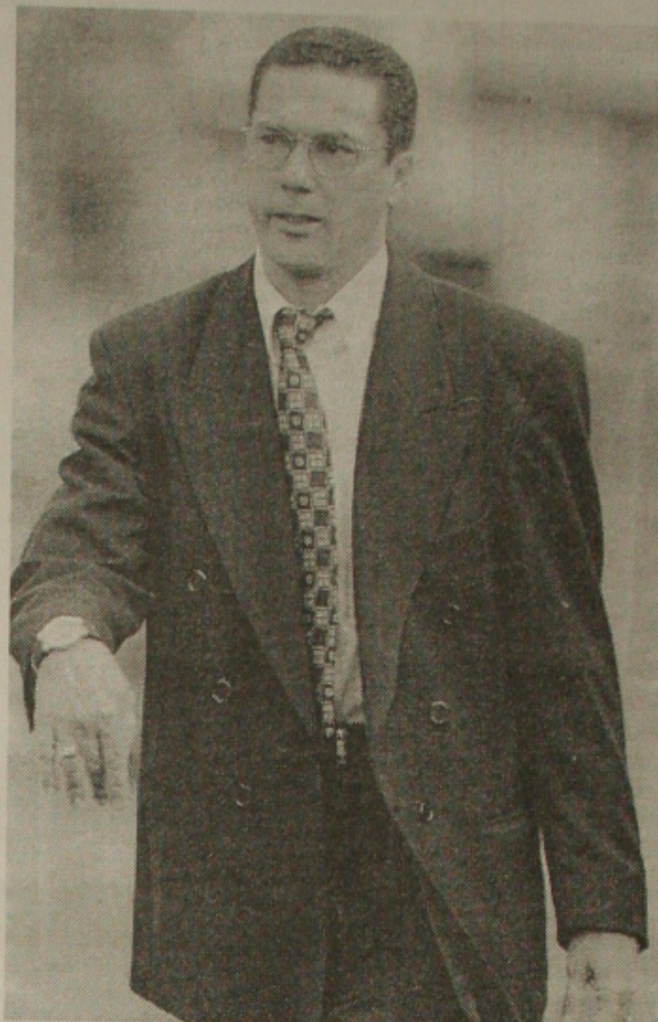
Luxemburgo elogia o futebol de Vasco e Palmeiras