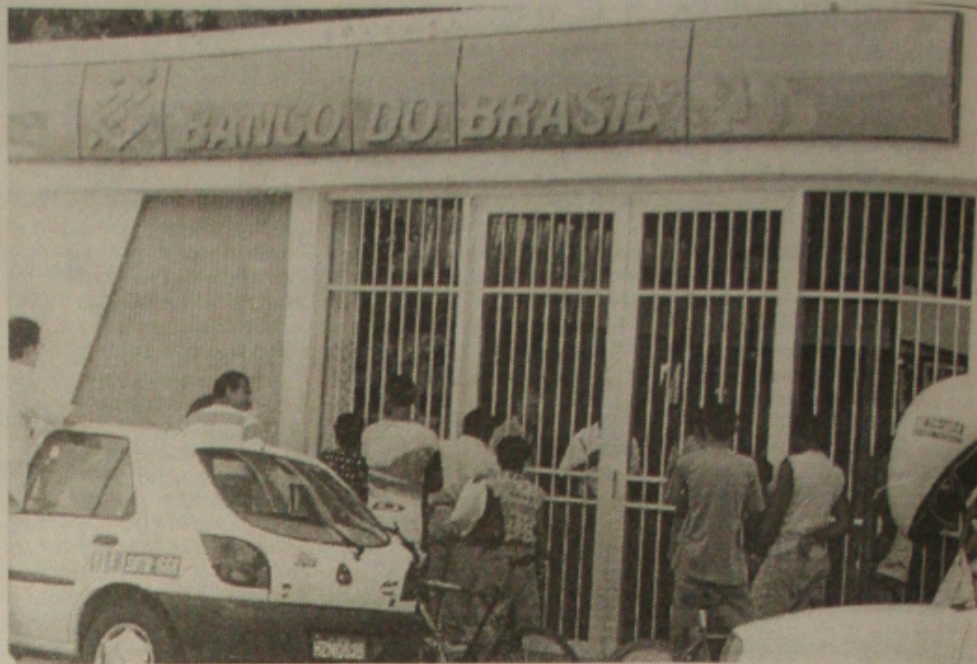
Pela terceira vez ladrões assaltam a agência do Banco do Brasil do Bairro São José

A polícia foi acionada de imediato. Enquanto alguns policiais faziam levantamentos dentro da agência e obtinha informações com os clientes, sobre as características dos bandidos, várias equipes de capturas das delegacias, saíram em perseguição a quadrilha. Até o final da tarde de ontem, o Parati não tinha sido localizado.