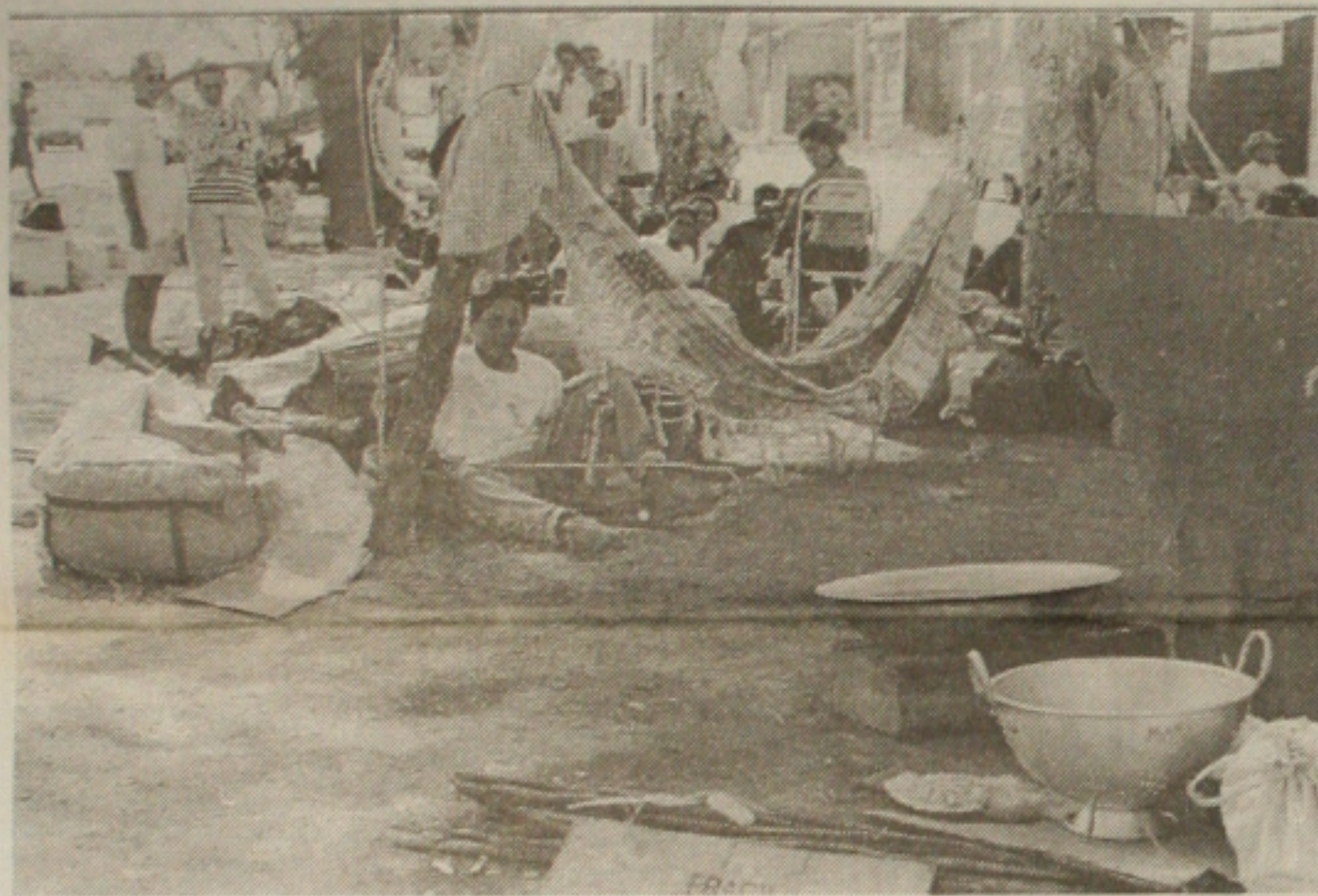
Depois de 13 dias acampados no Incra trabalhadores rurais sem-terra voltam para seus acampamentos

A troca de placas, de HZN-7251/SE para HZL-7251/SE, foi feita por policiais militares e não, pela Gazeta de Sergipe e demais órgãos de comunicação que divulgaram o fato. Quem disse que a placa verdadeira HZN-7251/SE, estava no porta-malas do Santana, foi também a PM. Portanto, se houve alguma descredibilidade na informação, não foi da Gazeta de Sergipe, e sim da Polícia Militar, que na ânsia de localizar o carro, trocou as letras da placa.