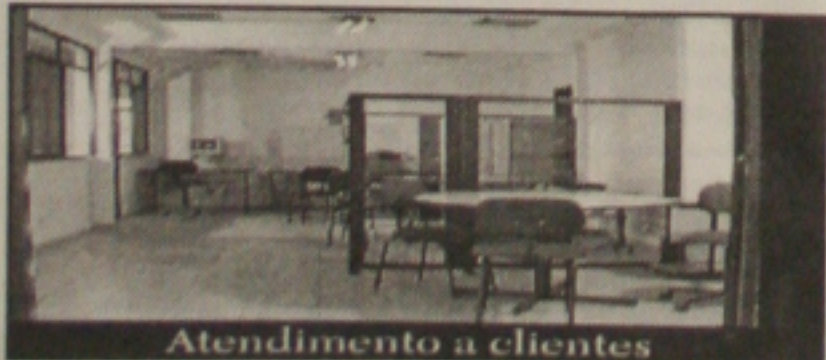
Atendimento a clientes