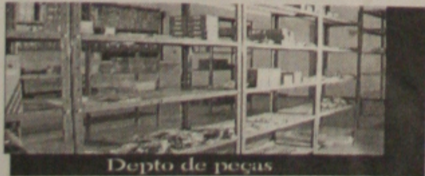
Depto de peças