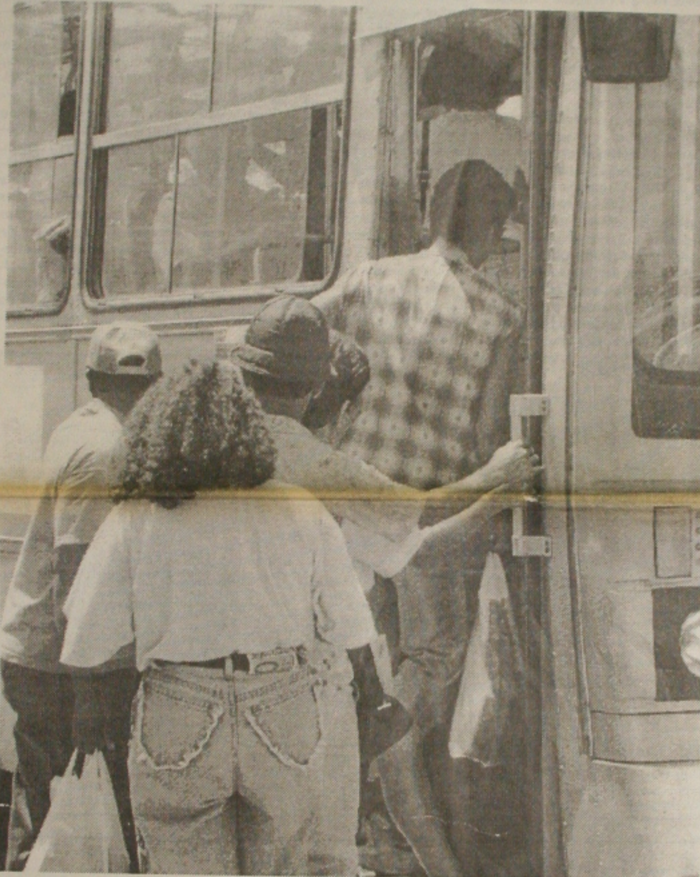
Na próxima semana, o aracajuano deve ficar sem transporte, pois os rodoviários ameaçam entrar em greve

As principais centrais sindicais do País querem o reajuste do salário mínimo para a casa dos R$ 180,00. A proposta foi apresentada ontem, durante reunião com o ministro do Trabalho, Francisco Domelles. Durante o encontro, os sindicalistas reafirmaram a importância do reajuste para a preservação do poder de compra dos trabalhadores. O presidente da Força Sindical, Paulo Pereira da Silva, por exemplo, prometeu lutar para um sa-