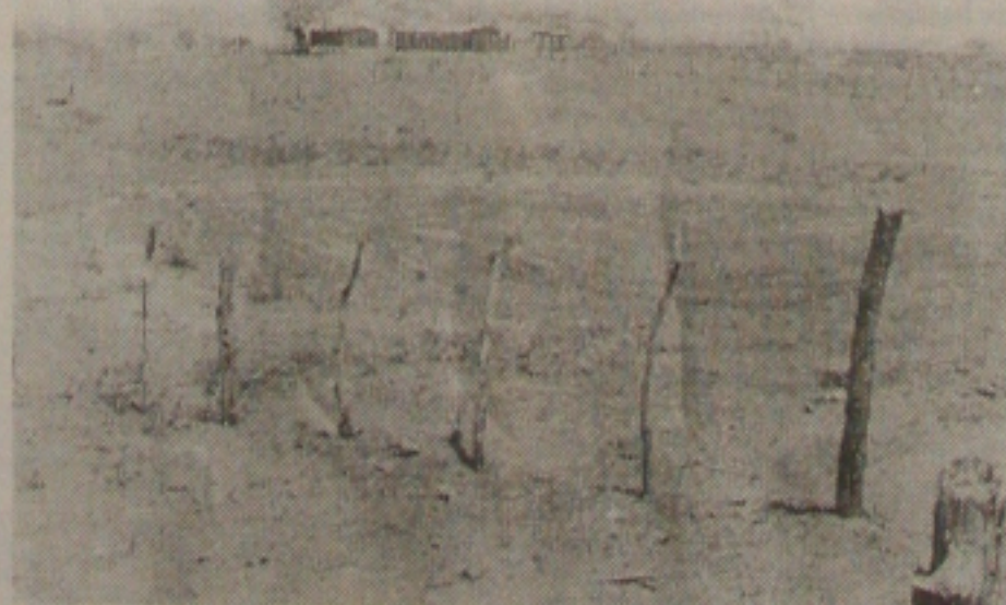
No Alto Sertão, a chuva não caiu e os açudes e aguadas continuam secos