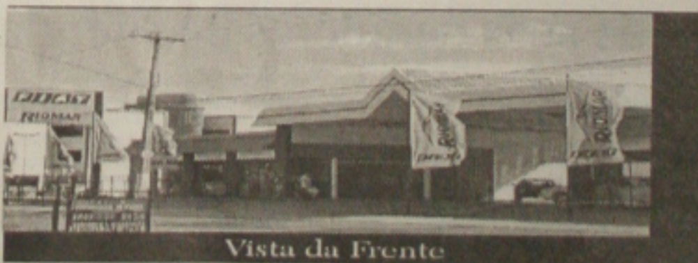
Vista da Frente