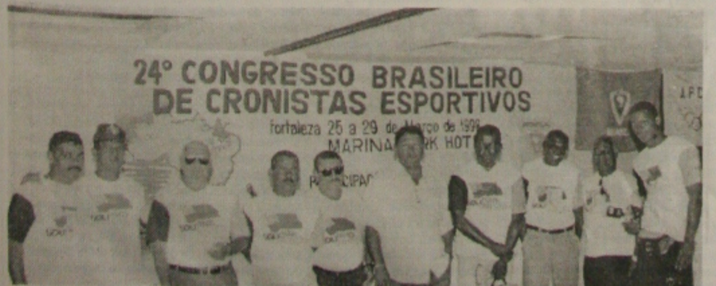
A delegação da ACDS que esteve o ano passado em Fortaleza, se prepara para ir a São Paulo