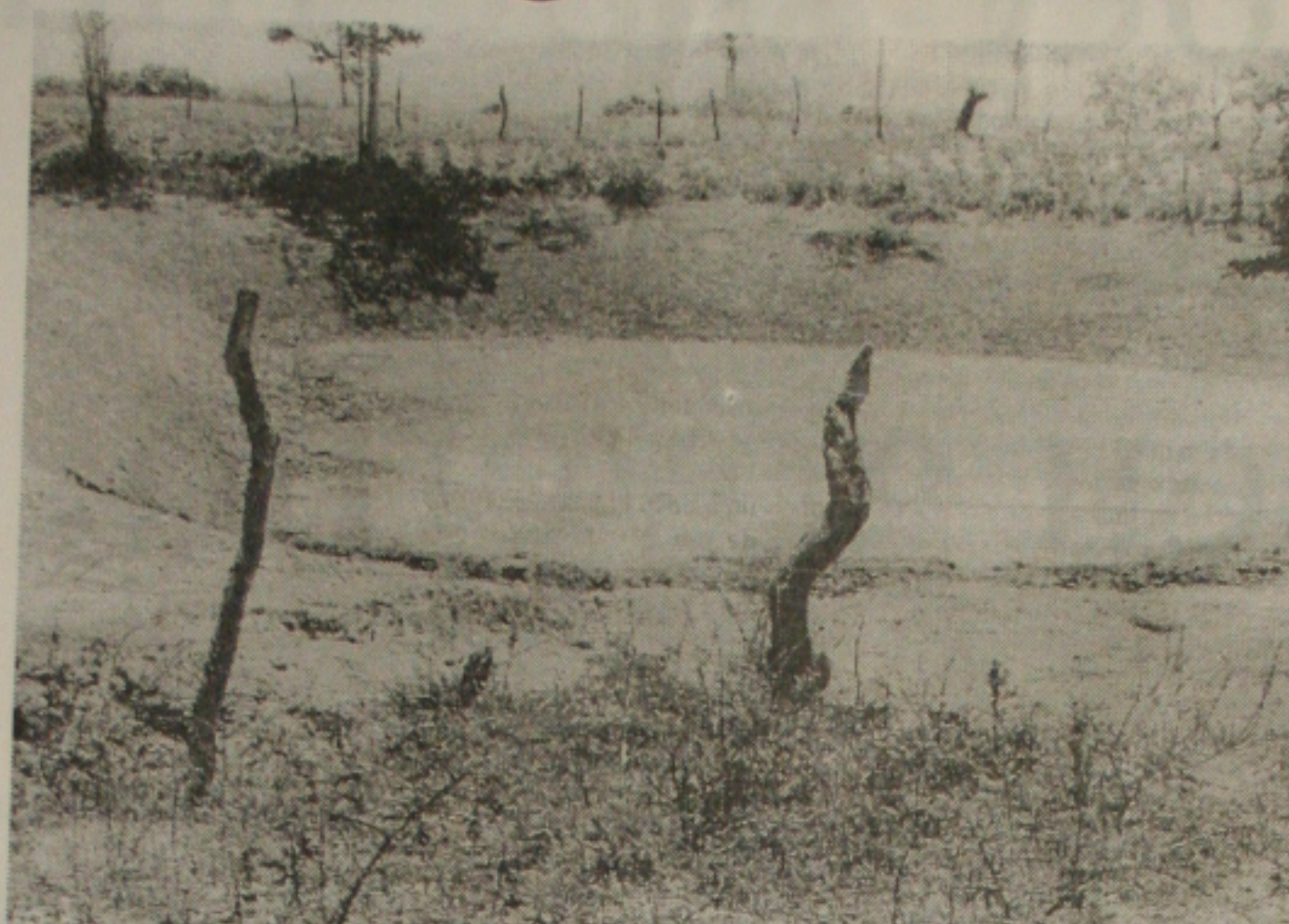
Açudes com pouca água e sem chover no Dia de São José desanimaram os agricultores sergipanos

Costa disse que, a CNB-CUT já enviou ofício a Febraban solicitando o agendamento de uma reunião para discutir o horário de atendimento bancário.