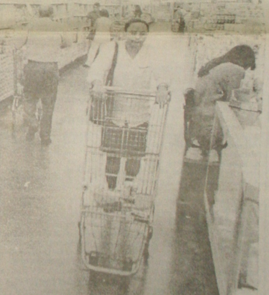
Nos supermercados, as vendas também caíram 5,48% em fevereiro. (Página 6A)

nunciamento aos norte-americanos, confirmou o início dos ataques. Militares iugoslavos afirmaram que sete cidades foram atingidas na primeira onda de ataques aéreos da Otan contra a Iugoslávia, segundo a agência de notícias estatal Tanjung. O exército iugoslavo anunciou que um número incerto de mulheres e crianças foi morto. O exército afirmou que as vítimas eram "refugiados" abrigados temporariamente em