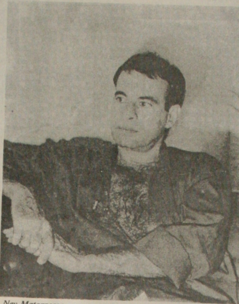
Ney Matogrosso vem cantar para os sergipanos