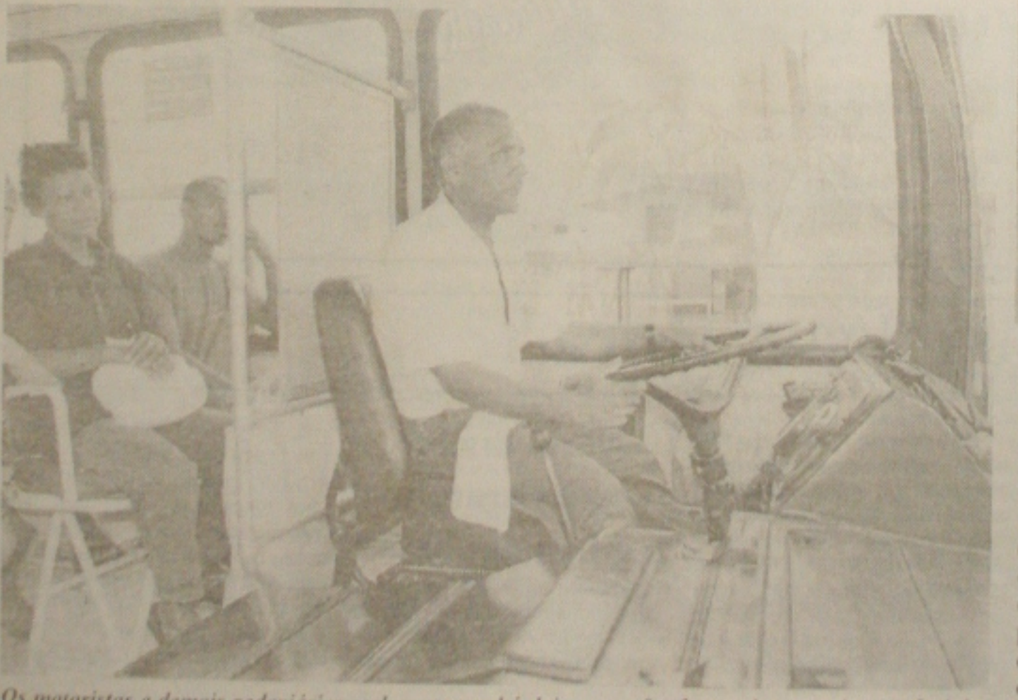
Os motoristas e demais rodoviários reclamam que há dois anos não têm qualquer reajuste salarial e, por isso, decidiram parar