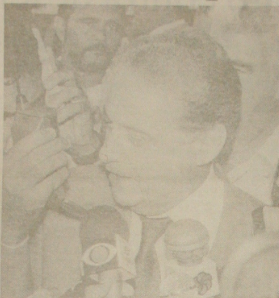
FHC: permanência condicionada

Nota oficial divulgada ontem pela Comissão de Direitos Humanos da Câmara dos Deputados informou que "o inquérito daquela época configurou-se como uma farsa, destinada a acobertar os responsáveis pelo mais grave atentado na história da política brasileira, pois representou risco de vida para 9 mil pessoas que se encontravam no pavilhão do Riocentro para um show musical".