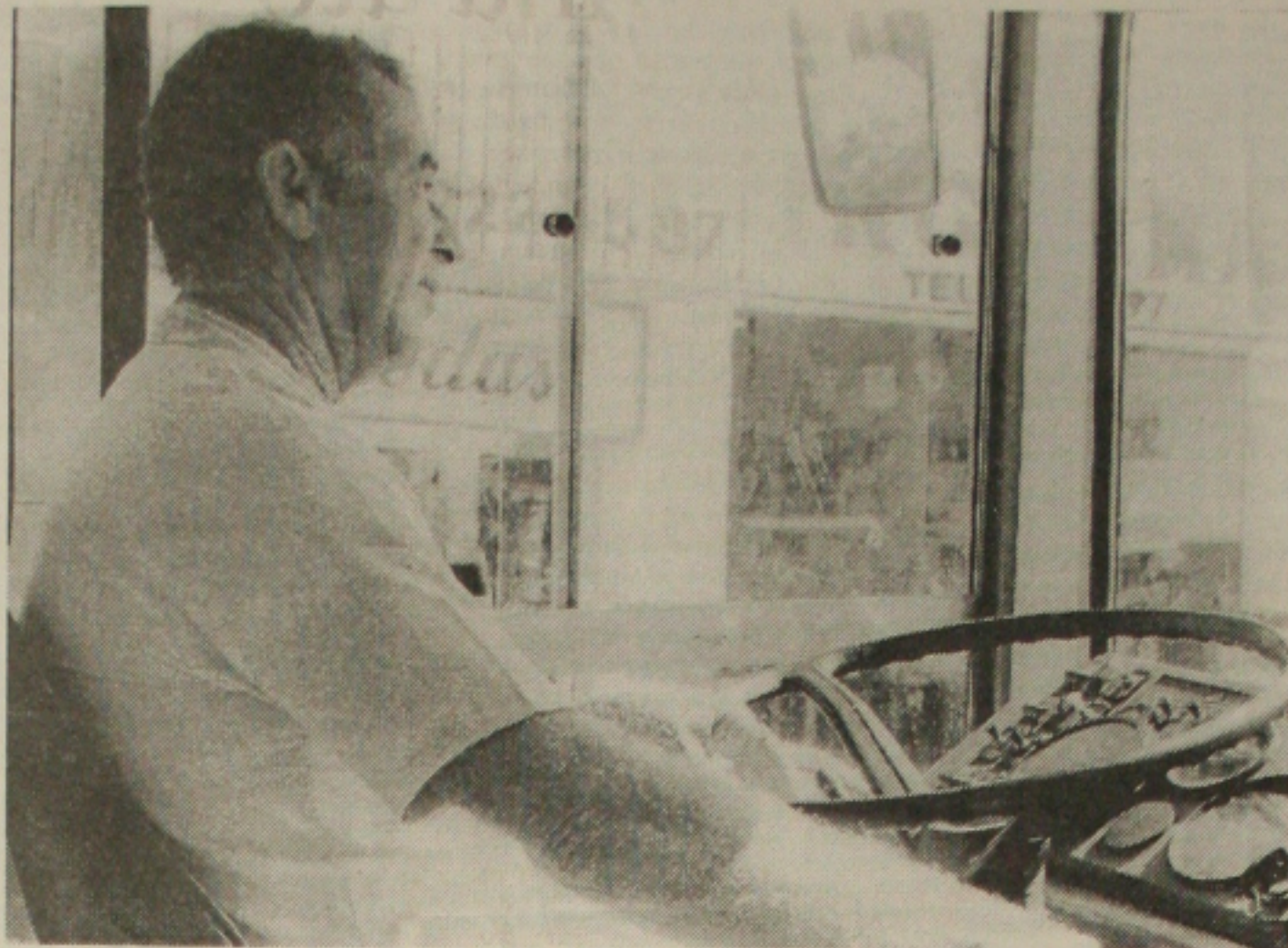
Rodoviários decidem em assembleia-geral que entrarão em greve a partir de segunda-feira