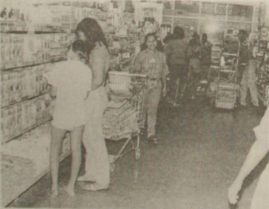
Supermercados registram quedas reais de 5,48%

De acordo com Manoel Barbosa, os supermercadistas têm enfrentado batalhas com os fornecedores para manter preços mais baixos nas mercadorias. "Temos dado continuidade às nossas promoções, oferecemos mercadorias de marcas mais baratas e preços mais acessíveis, para tornar mais fácil a aquisição do alimento pela população", concluiu.