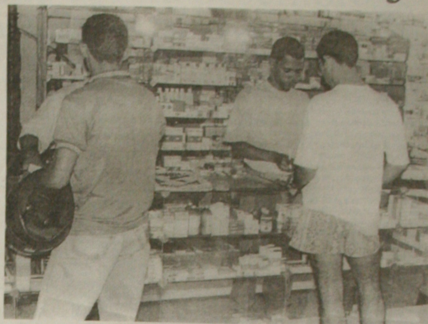
Apesar das promoções feitas pelas farmácias, a venda de remédios está despencando em Aracaju

Com a nova lei, o cliente não vai pensar duas vezes, leva o mais barato. Com isso, força os laboratórios baixarem seus preços, apesar da crise está em todos os setores da economia do País e, a Indústria Farmacêutica tem 75% de produtos importados, o que dificulta mais ainda as vendas de medicamentos.