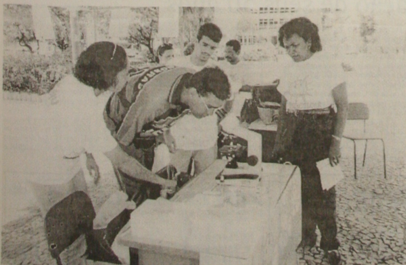
A Secretaria de Saúde do Município realizou ontem campanha para alertar sobre a tuberculose