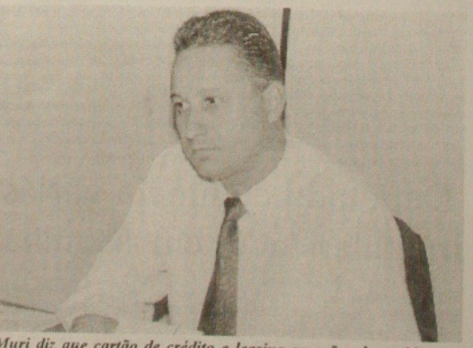
Muri diz que cartão de crédito e leasing campeões de problemas

Em seguida o próprio representante dos bancos em conjunto com o Ministério da Justiça, no caso do leasing, fizeram um acordo de ajustamento de compromisso diminuindo significativamente o valor do dólar. Como exemplo, quem estivesse pagando dois reais por um dólar passaria a pagar bem menos. Muri alertou que esta na verdade foi uma decisão paliativa e ficou acertada uma reunião em