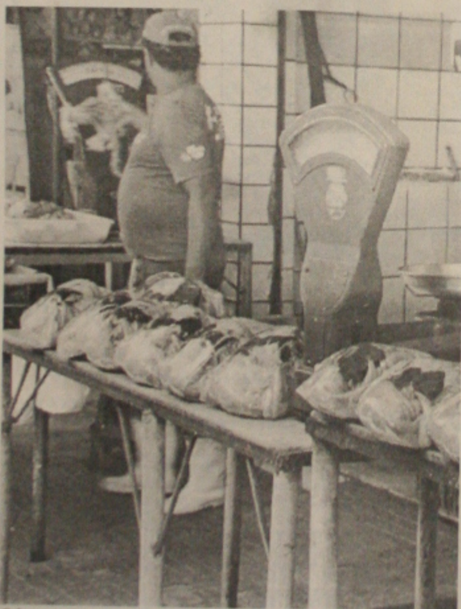
O frango, com menor preço, deverá se constituir na principal opção para os católicos na Semana Santa

Prefeito contesta decisão do Tribunal de Contas do Estado. (Política - Página 3A)