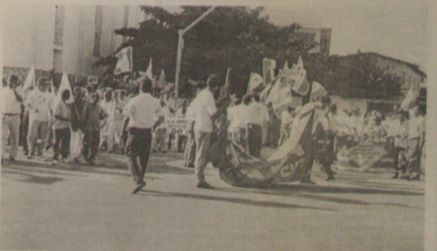
No início da tarde, os manifestantes se concentraram em frente da Igreja do Espírito Santo, de onde saíram em passeata

ruas da cidade, foi encerrada com um ato público na Praça Fausto Cardoso, em frente ao Palácio Olímpio Campos. Além de protestar contra o desemprego e a política econômica federal, o movimento alertou a população sobre o processo de esvaziamento econômico que o Estado vem sofrendo com as transferências ou pura extinção de órgãos federais em Sergipe. (Página 3A)