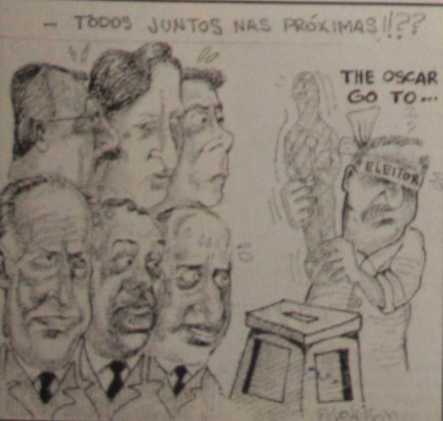
TODOS JUNTOS NAS PRÓXIMAS!!??