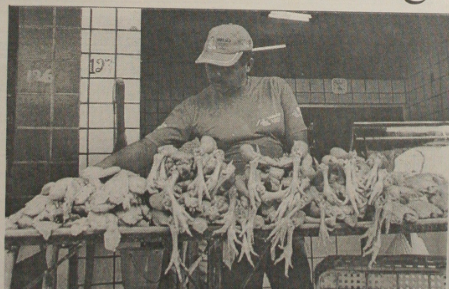
A Igreja autorizou que fiéis podem substituir o pescado pela carne de frango durante a quaresma