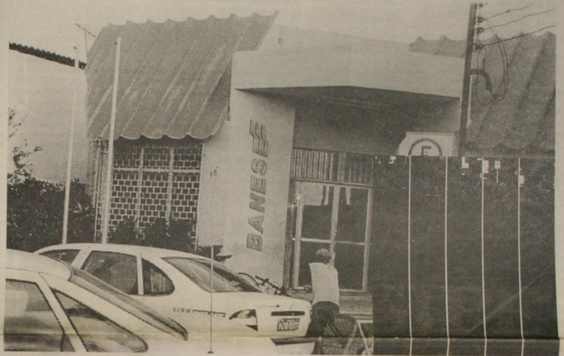
A agência do Banese da Atalaia foi um alvo fácil para os assaltantes, que fugiram num Mondeo preto (detalhe) abandonado logo depois na avenida Santos Dumont

bancário, um outro assaltante dava cobertura ao restante da quadrilha, do lado de fora, em um Mondeo preto, carro que utilizaram para a fuga. O veículo foi abandonado logo depois, nas proximidades do Teimonde, na Avenida Santos Dumont, também na Atalaia. Policiais civis e militares realizaram buscas por toda a área, mas até o final da noite nenhum dos assaltantes havia sido localizado. O sistema interno de vídeo conseguiu gravar todo o assalto. Os bandidos aparecem na fita, que já foi requisitada a direção do banco pela Polícia. A direção do banco não informou o valor da quantia roubada pela quadrilha. (Página 6A)