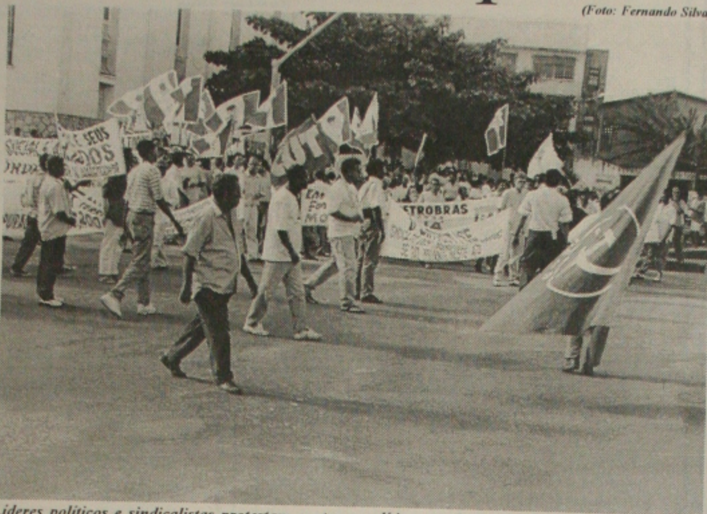
Líderes políticos e sindicalistas protestam contra a política econômica de Fernando Henrique