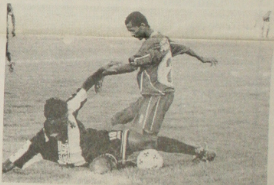
Vasco quer manter o ritmo de vitórias

Contra-ataque - Outra arma do Vasco para o jogo de hoje, além da volta de Nal, serão os contra-ataques. O time vai explorar o fato do Coritiba precisar da vitória para seguir em frente - e poder jogar pelo empate - para apanhar a defesa adversária de surpresa. Ontem pela manhã os