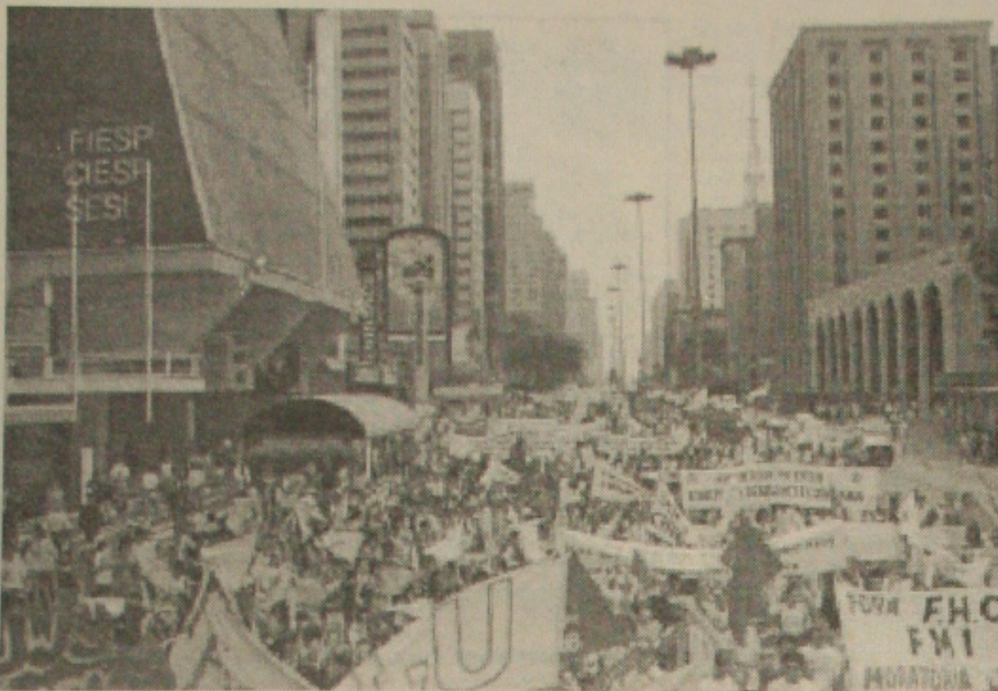
Em São Paulo os manifestantes se concentraram na Avenida Paulista e seguiram para Praça da Sé, onde aconteceu o ato público.