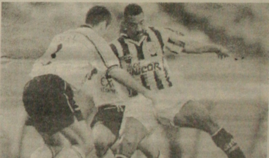
Viola (D) com problema muscular não enfrenta o Rio Branco

Ontem, a CBF recebeu a tabela da Copa das Confederações e a seleção vai de estrear contra a Alemanha, em 24 de julho, em Guadalajara (México). O grupo do Brasil tem Nova Zelândia e Estados Unidos.