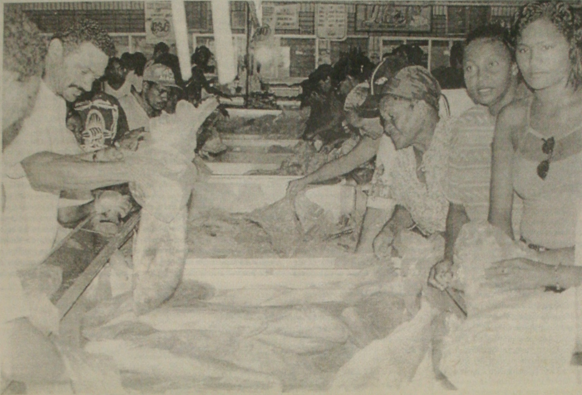
A produção de peixe fresco cresceu este ano 30%, garantindo o abastecimento do mercado local na Semana Santa