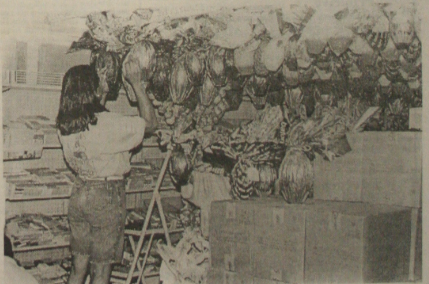
O sergipano manteve a tradição de distribuir Ovos de Páscoa, cujas vendas este ano devem superar as de 98. (Página 4A)