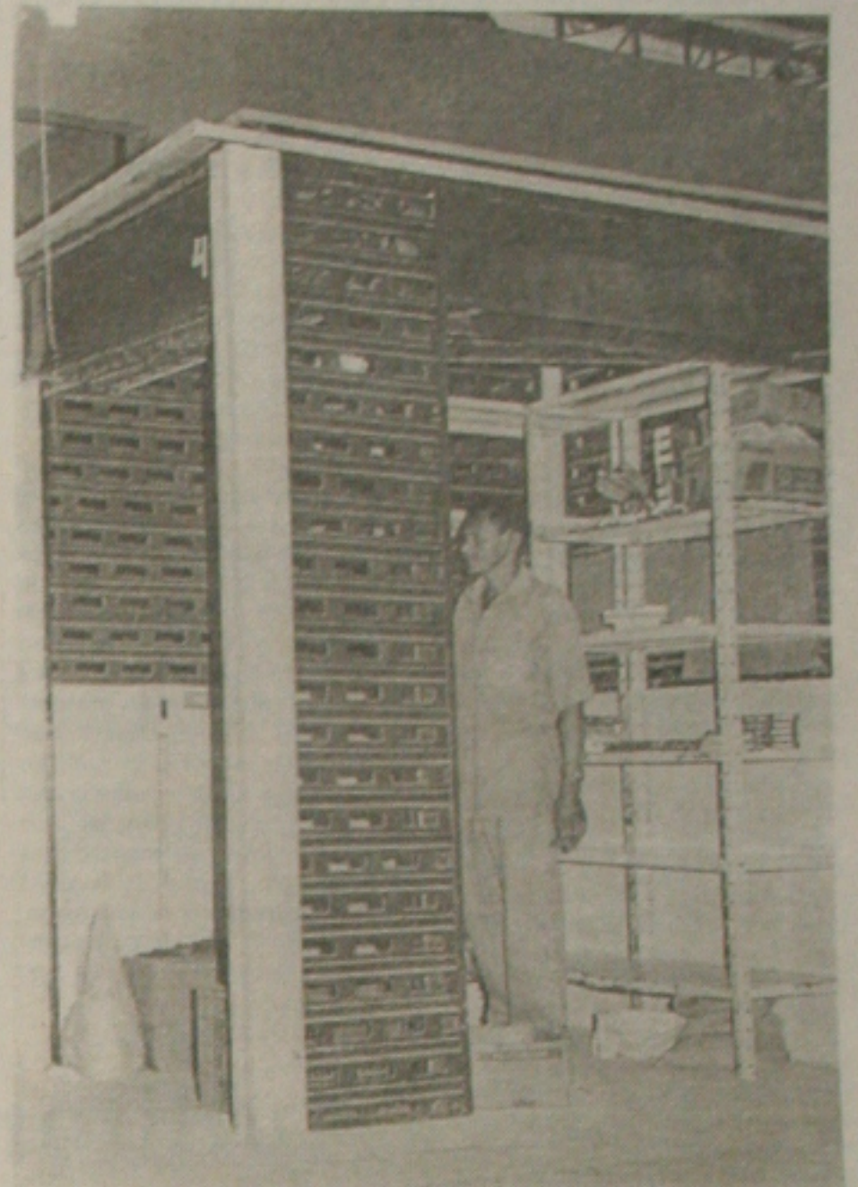
Tamanho dos boxes não agrada a todos os feirantes

A feirante disse não estar entendendo absolutamente nada. "Como uns recebem e outros não. As pessoas a que me refiro, são feirantes antigos e que fizeram o cadastro. Tudo está uma verdadeira bagunça".