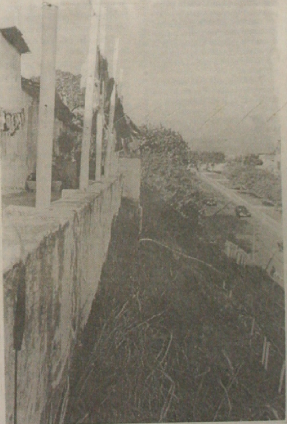
Apesar do alerta da Defesa Civil, várias famílias insistem em morar em áreas de risco na capital. (Página 2B)