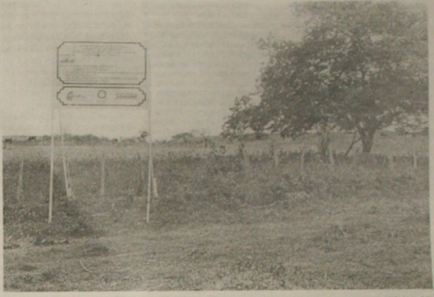
A construção do Distrito Industrial de Maruim ficou na promessa: até agora só existe o terreno. (Página - 3B)