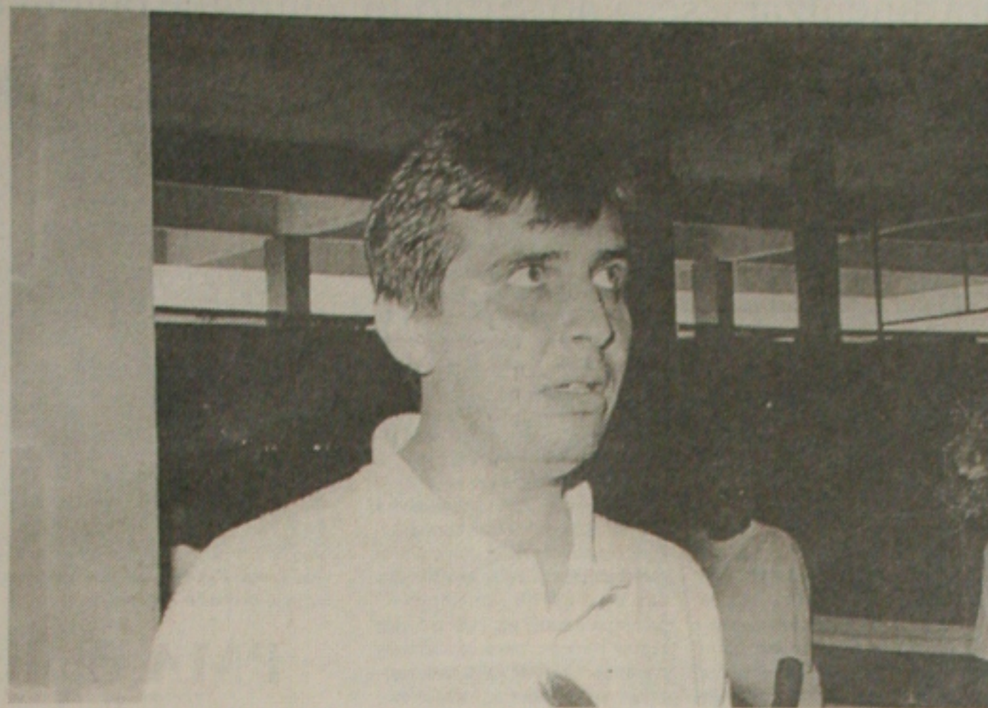
Assessor da Emsurb tenta justificar os conflitos

O assessor foi inquirido quando ao dia da transferência desses feirantes, ou no último sábado, considerando que isso representou em prejuízos para a categoria. O assessor destacou que a escolha do sábado e, ainda no domingo, foi porque seriam utilizados caminhões, tratores e que esses dias, o fluxo de transeuntes é menor, bem como de veículos.