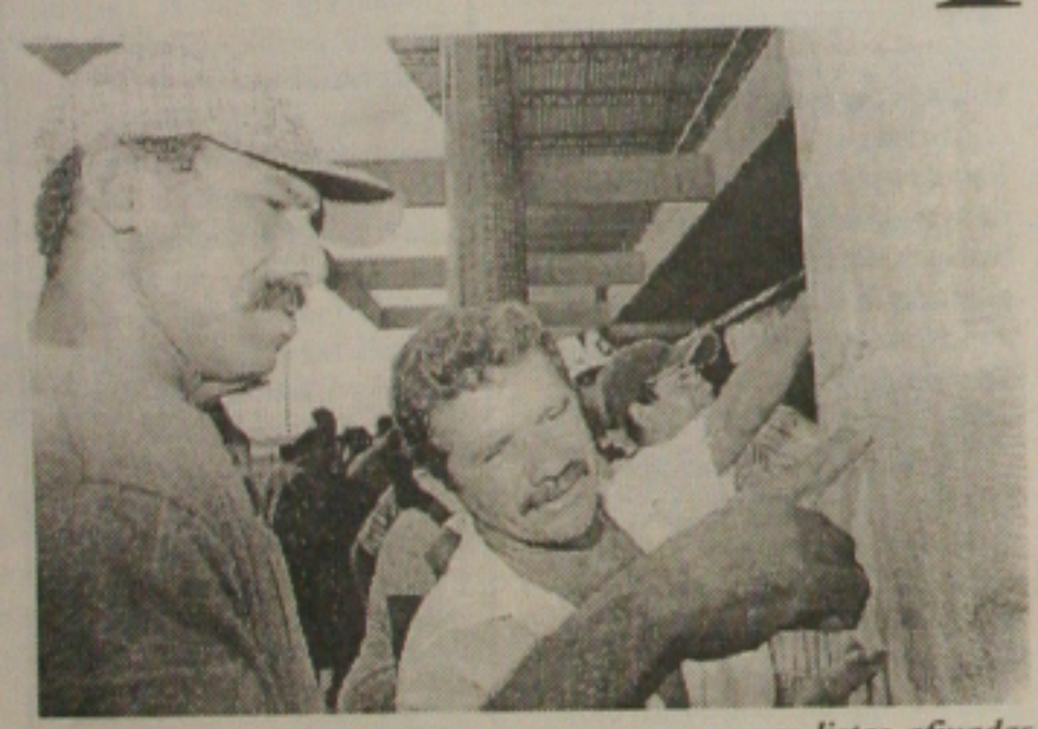
Ontem, feirantes procuravam por seus nomes nas listas afixadas pela prefeitura no novo mercado municipal