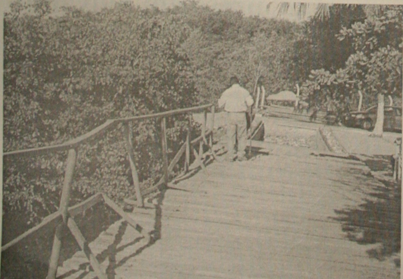
Pier que servia para apreciação do rio e para pescarias está em ruínas