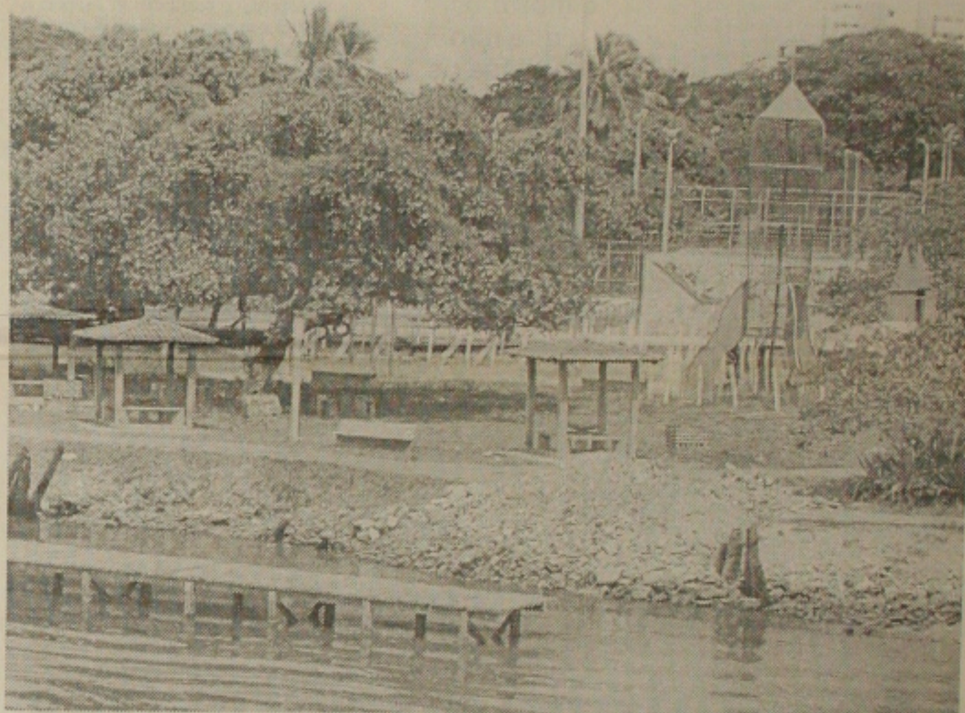
...Atualmente o desprezo das áreas de lazer é o que mais impressiona à comunidade