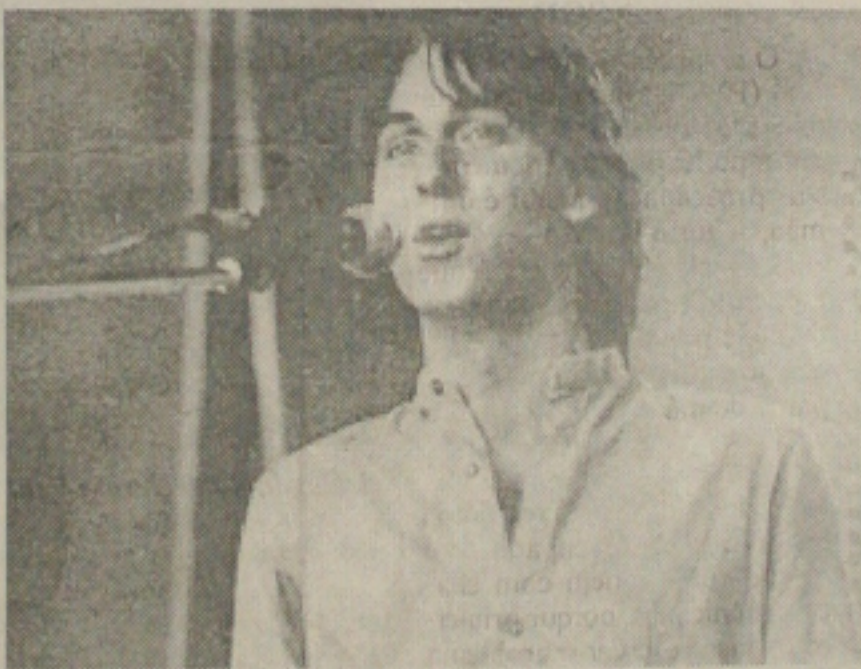
Mingo Santana, cantor e compositor, fará show no Teatro Atheneu

A noite de Aracaju, aos poucos, vai melhorando. O american bar do Del Mar Hotel tem excelente música nas noites de sábado. O mesmo acontece no Hotel Parque dos Coqueiros, nas sextas-feiras e sábados. O La Ventana oferece boas noites dançantes, assim como o Café Brasil. Estilos diferentes, mas com música e cantores de ótimo nível. Brevemente o Teimonde terá sua boate, o mesmo acontecendo no restaurante Sushi Mori. O Catavento foi reaberto e a partir do dia 3 de julho terá a presença do trio Suzana Walois, Djalma e Pedrinho, sempre às sextas-feiras. São boas opções de lazer para quem reclamava que em Aracaju não havia locais onde os casais pudessem dançar. Para os mais jovens e descontraídos, a boate do Augustu's e Tequila Café agradam bastante. Além desses locais, há bares com música ao vivo, como o Habeas Corpus. É só fazer a escolha e se distrair!