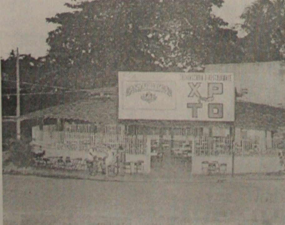
Márcia esteve pela última vez, dia 19 no restaurante XPTO