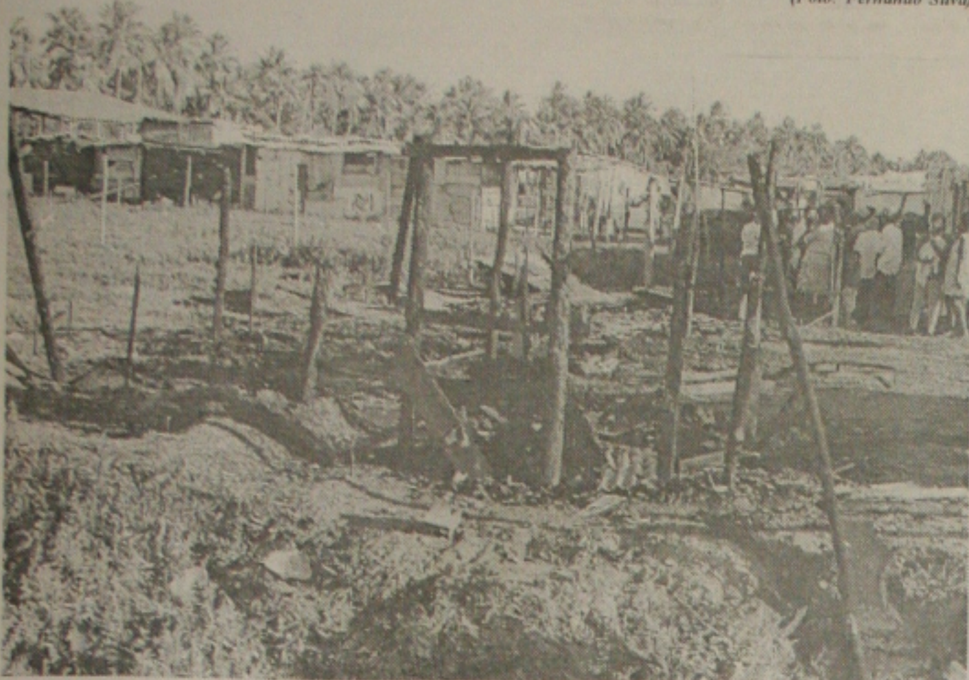
Restos de um dos barracos queimados da Terra Dura

Nem mesmo o quadro ab soluto de pobreza e miserabilidade consegue impedir que ações delituosas ocorram na Terra Dura, um local marcado pela falta de condições de vida.