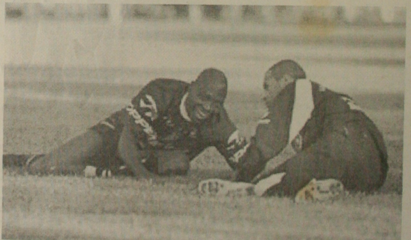
Rincón pode ser o ponto de equilíbrio do Corinthians