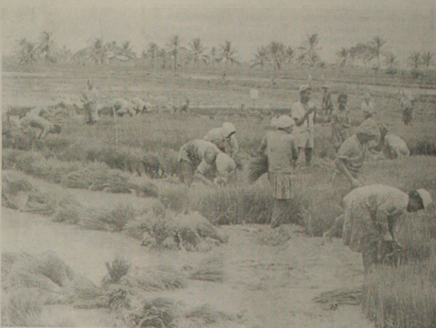
Os perímetros irrigados da Codevasf no Baixo São Francisco beneficiam hoje 1,4 mil produtores

O superintendente ressalta a importância da somação da bancada federal de Sergipe para que o orçamento da Codevasf seja defendido, de forma a atender os 27 municípios situados na Bacia do São Francisco e, ainda, para que a ação seja cada vez mais ampliada. "Para isso são necessários recursos", alerta.