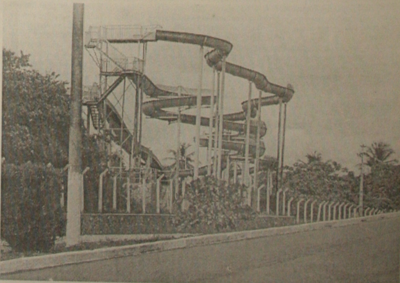
Toboáguia, o grande atrativo apresenta muitos furos nas fibras