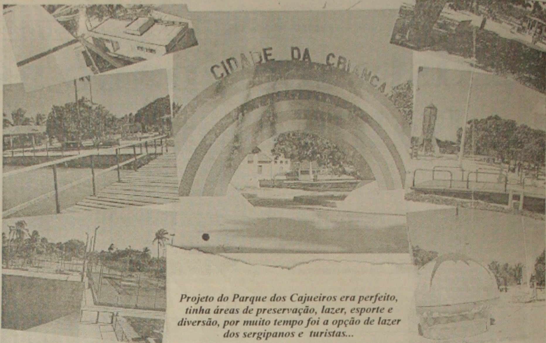
Projeto do Parque dos Cajueiros era perfeito, tinha áreas de preservação, lazer, esporte e diversão, por muito tempo foi a opção de lazer dos sergipanos e turistas...

Além da execução de todo o projeto, o Parque será palco de inovações como a criação de um santuário ecológico com verbas da Fundesp, onde serão estabelecidas normas para a pesca e conservação do meio ambiente.