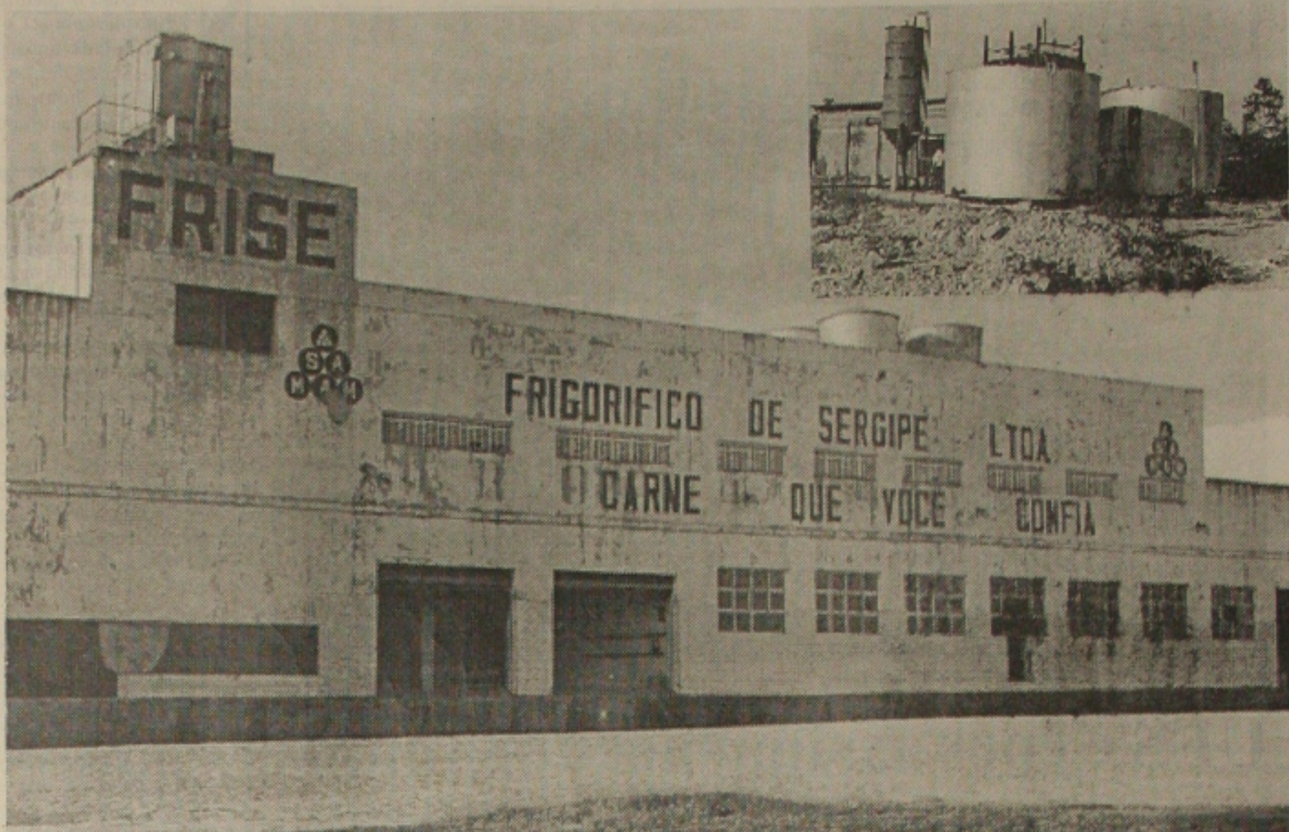
Frise é acusado de voltar a exalar mau cheiro, vazamento de sangria. No detalhe, equipamento que foi comprado para acabar com o problema

Segundo ele, na semana passada o equipamento teve uma peça danificada e causou entupimento em uma das válvulas que suga o odor e a direção do frigorífico foi obrigada a liberar os gases para que a peça fosse desentupida e o tempo de recuperação durou apenas um dia. "O odor deve ter sido causado por isso, mas hoje já está tudo normal. Não vejo motivo para tantas reclamações", afirmou.