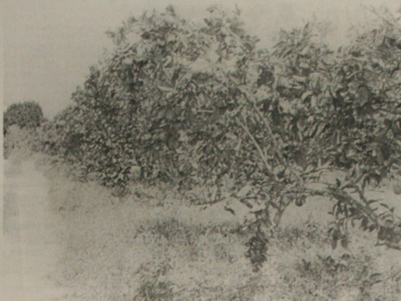
Laranjais sergipanos podem ser só recordação em fotografia

"Os clientes da QAD podem, a partir de agora, capitalizar os investimentos feitos no MFG/PRO ao implementar esta solução para a web. Já os novos clientes, vão ter o suporte da Internet em suas aplicações", garante Pam Lopker.