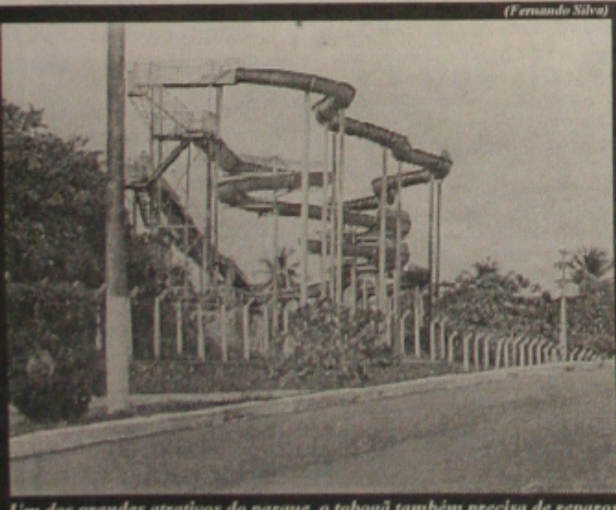
Um dos grandes atrativos do parque, o tobogã também precisa de reparos

PARQUE A Fundesp já iniciou o projeto de restauração de toda estrutura física do Parque dos Cajueiros, às margens da Rodovia Paulo Barreto de Menezes, que dá acesso à Praia de Atalaia. O parque, que era administrado e explorado pela Burler Turismo, foi devolvido ao Estado sem qualquer condição de uso. A maioria dos equipamentos de lazer está total ou parcialmente danificada, como o tobogã que integra o parque náutico. A reforma deverá custar cerca de R$ 1 milhão. (Página 2B)