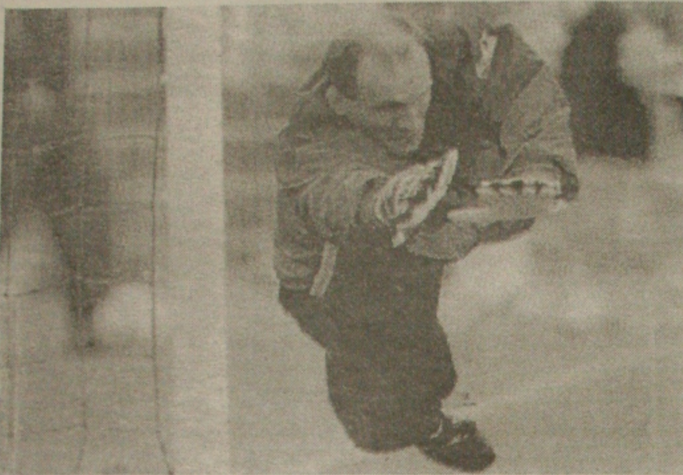
Dez meses depois de empolgar o Brasil, defendendo pênaltis na Copa do Mundo, Taffarel está de volta à Seleção Brasileira.

Passado do goleiro tetracampeão do mundo influenciou na escolha do treinador