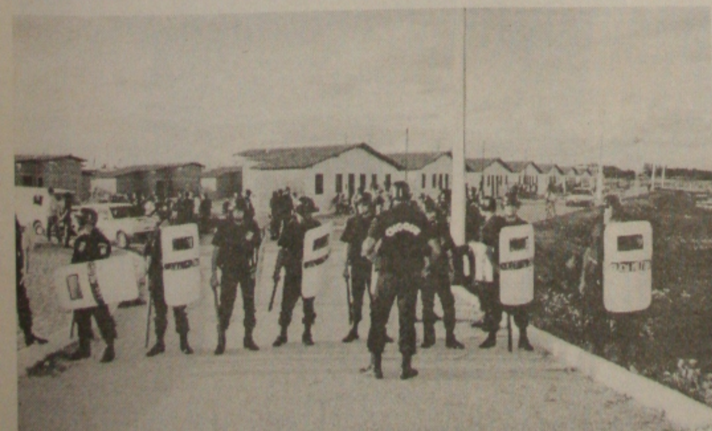
Choque fecha entrada de conjunto para evitar tumultos