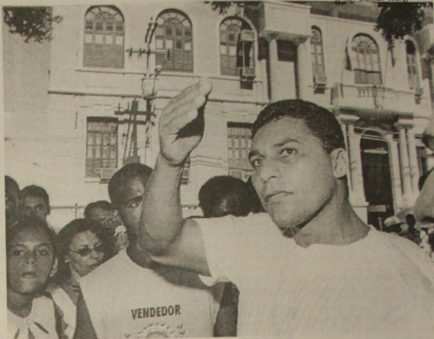
Ambulantes promovem manifestação na prefeitura de Aracaju, para condenar ação do prefeito

Na semana passada, assaltantes usaram o mesmo método para levar R$ 80 mil de uma agência do Bradesco, em Pinheiros, na zona oeste. Eles seqüestraram a filha de 5 anos da gerente da agência e a obrigaram a levá-los até o banco para retirar o dinheiro. A gerente dominada pelos ladrões também morava na Freguesia do O, na zona norte.