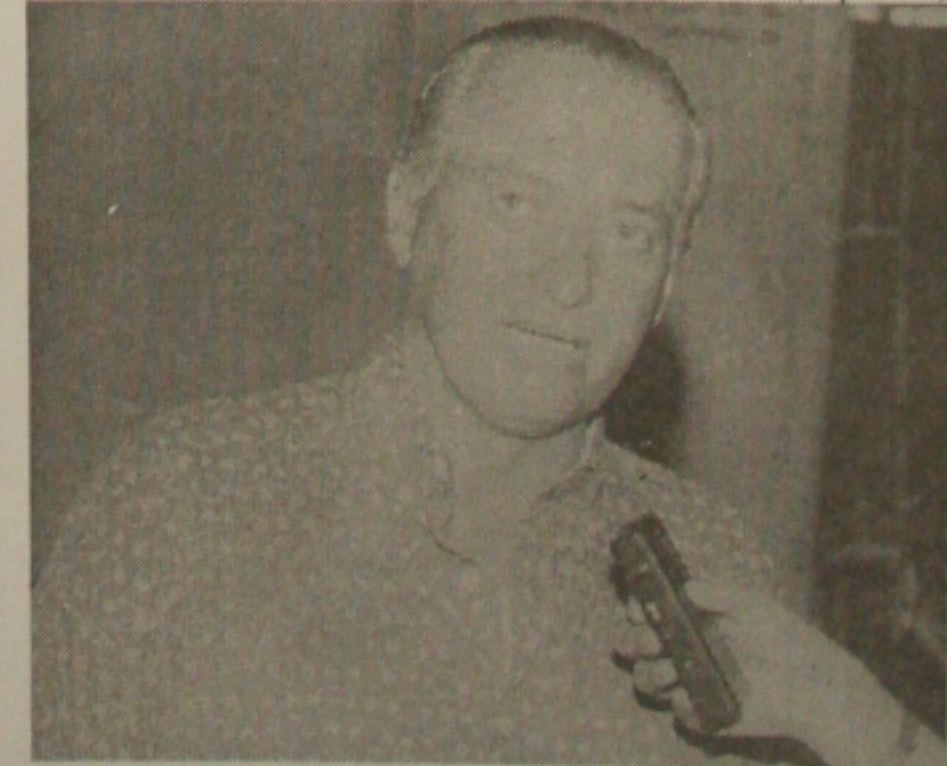
Valadares: "vamos caminhar com nossos próprios pés"