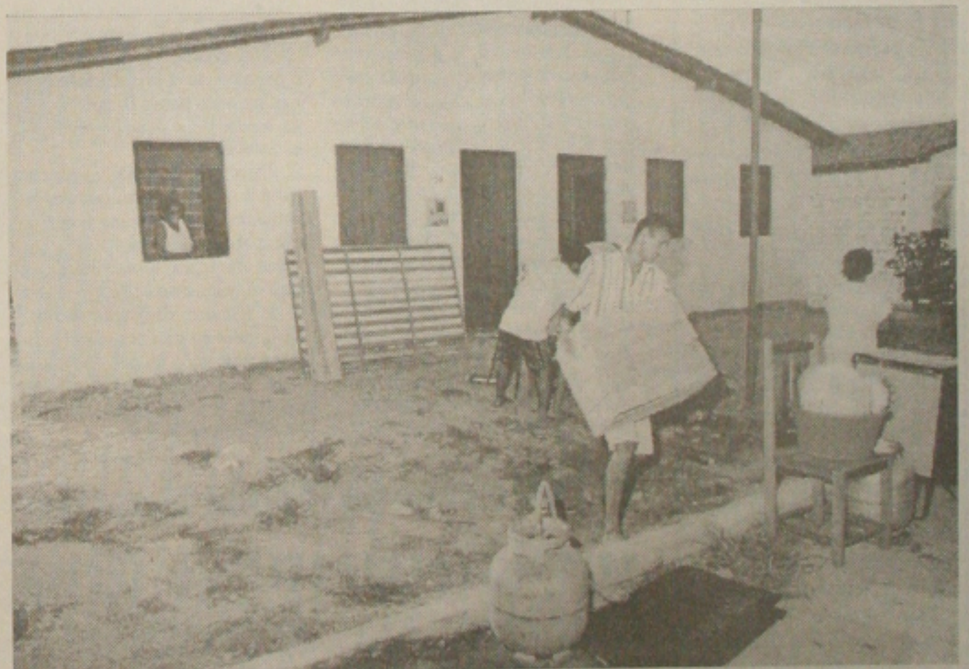
Invasor arruma móveis na calçada a espera do cominhão de mudanças