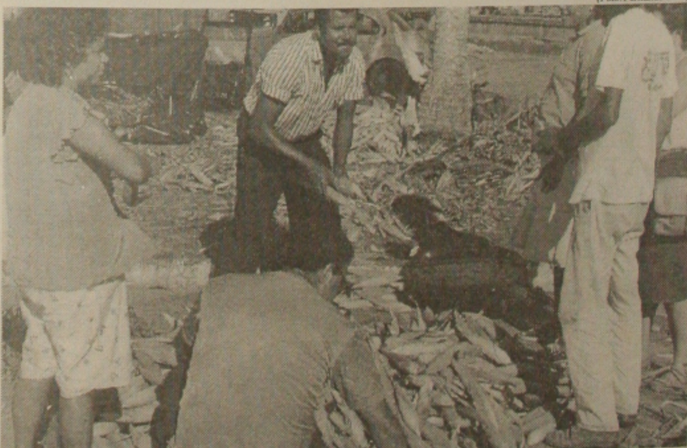
A venda de milho verde ainda é considerada fraca pelos feirantes da Ceasa