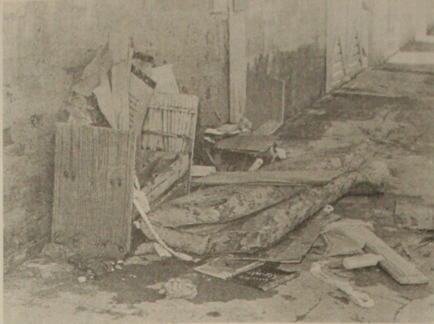
Restos dos móveis de moradores do conjunto JK no Sol Nascente.