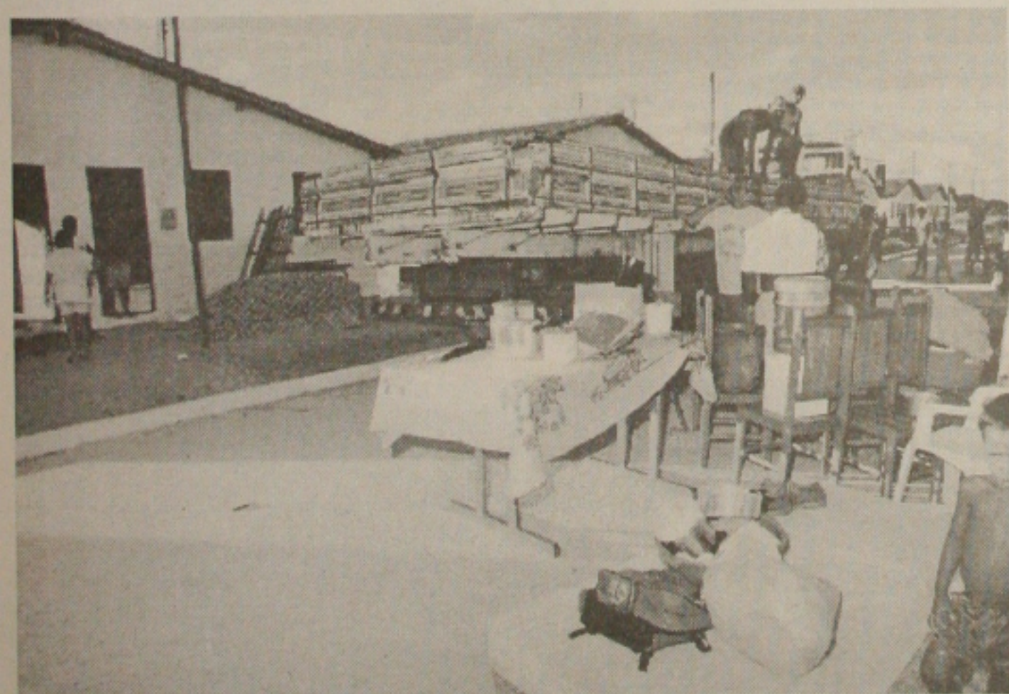
Móveis foram colocados para fora das casas para iniciar a mudança