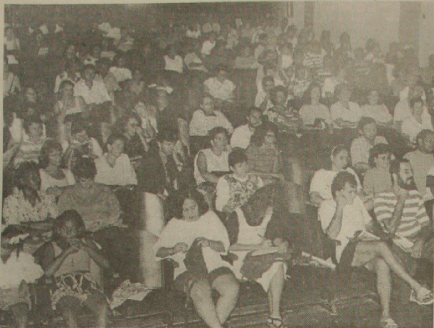
Professores do Estado reunidos em assembleia-geral decidem pela greve a partir de quinta-feira

Categoria aprova em assembleia-geral a paralisação dos trabalhos a partir da próxima quinta-feira