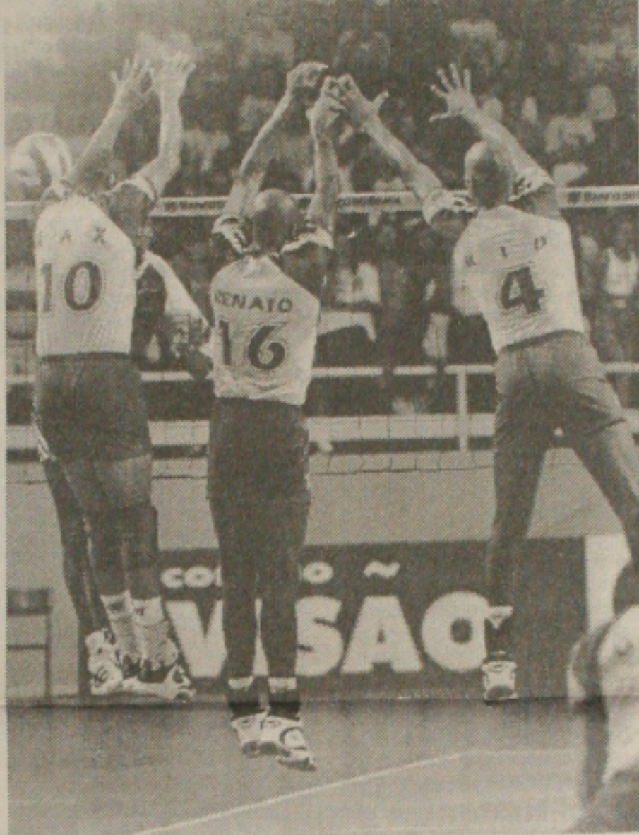
A Seleção Brasileira deu um show de voleibol e venceu a terceira partida do Desafio Internacional contra Cuba

A presença da juventude sergipana ontem à noite no Constância Vieira, foi o grande destaque da vitória da seleção brasileira de voleibol, contra Cuba, na terceira partida do Desafio Internacional. O Brasil deu um banho de voleibol e venceu por 3x1, parciais de 25x22, 19x25, 25x18 e 25x21. Foi a segunda vitória brasileira, contra uma da seleção de Cuba.