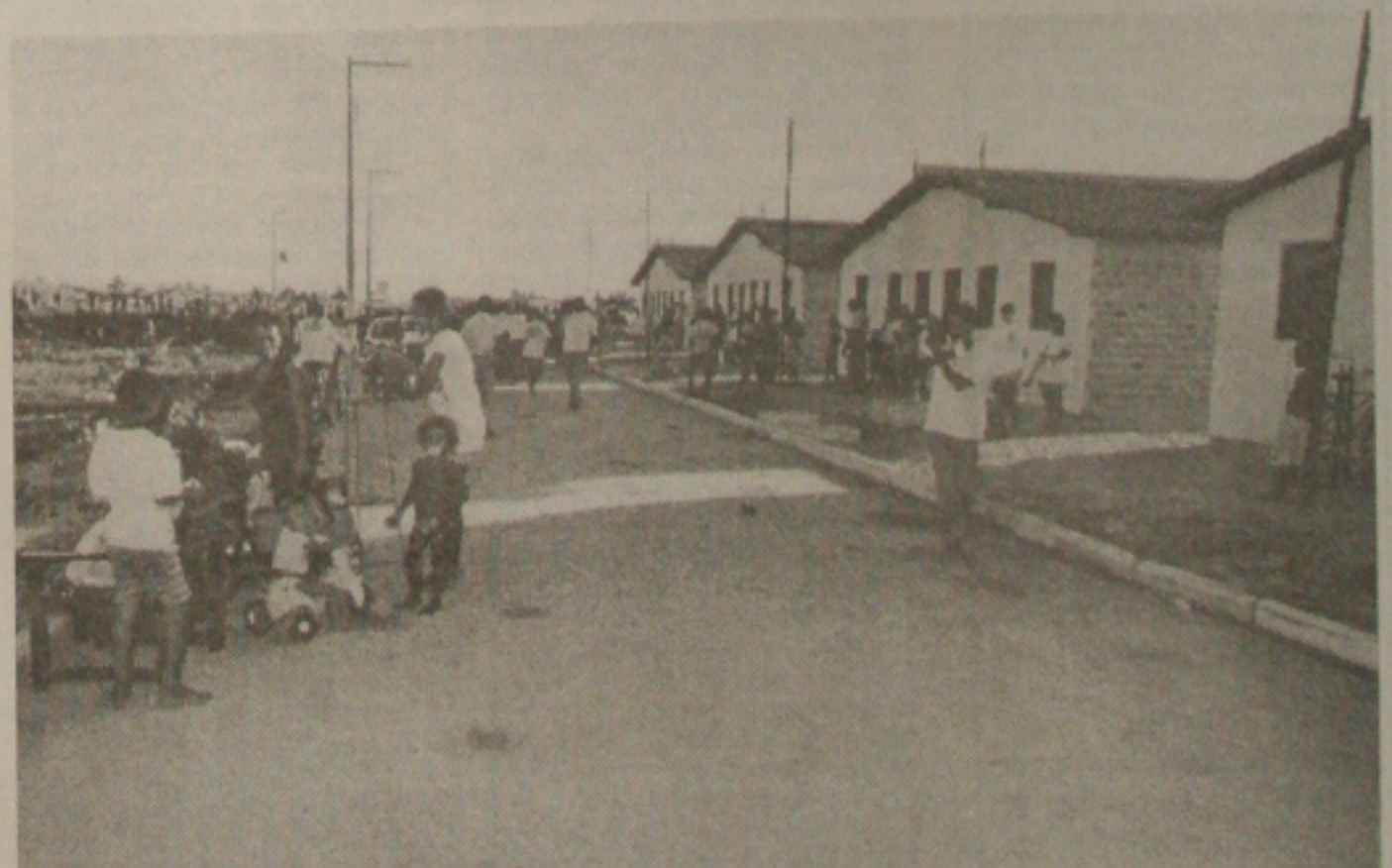
Retirada das famílias chamou atenção da população de Pirambu