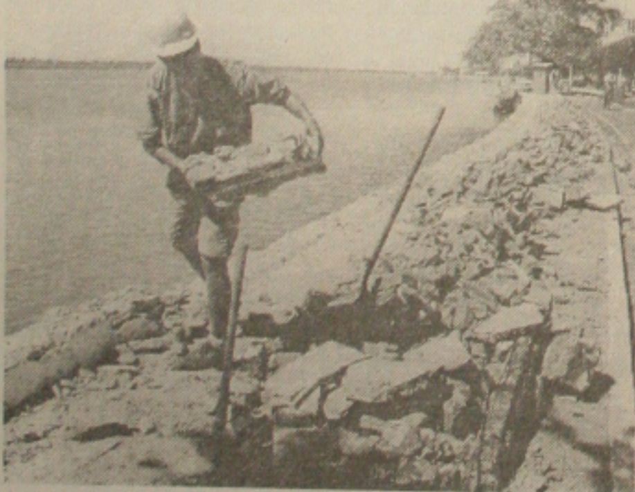
Avenida Ivo do Prado é o início da revitalização do centro

Amaral afirmou que dentro de mais duas semanas todos os buracos da cidade serão fechados pelas equipes da Emurb. "Temos um cronograma a seguir e estamos seguindo a risca para que dentro do prazo estipulado concluamos todo o processo de recuperação das ruas", observou.