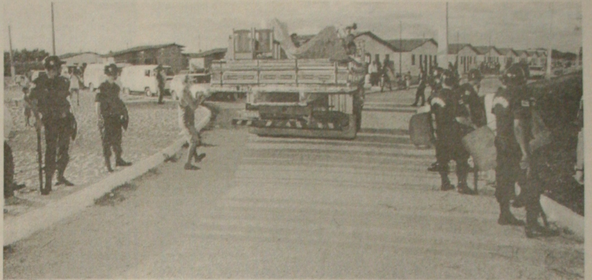
Polícia de Choque que foi acionada pela Justiça organizou a retirada dos bens das famílias

“O governo é sensível ao problema habitacional da população e vem priorizando a construção de casas na capital e interior”