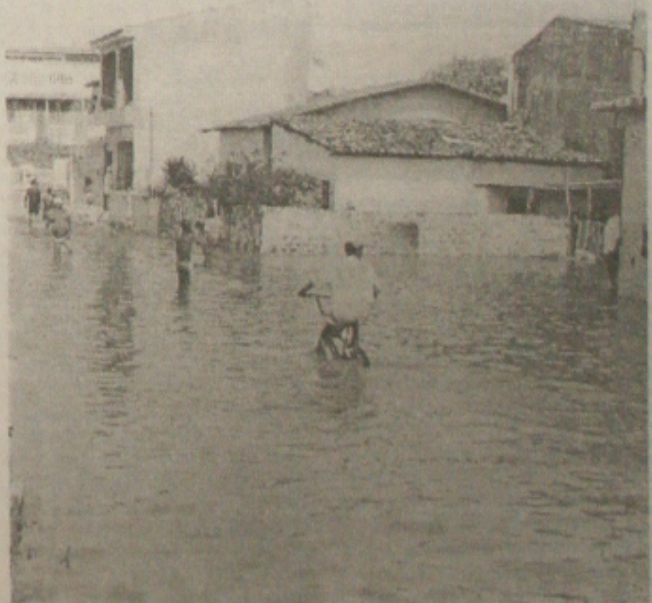
Com as chuvas, o Poxim transbordou e deixou o J.K. ilhado