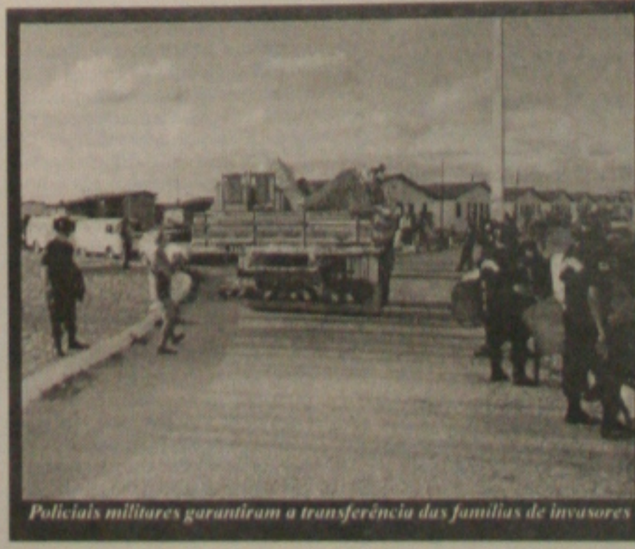
Policiais militares garantiram a transferência das famílias de invasores