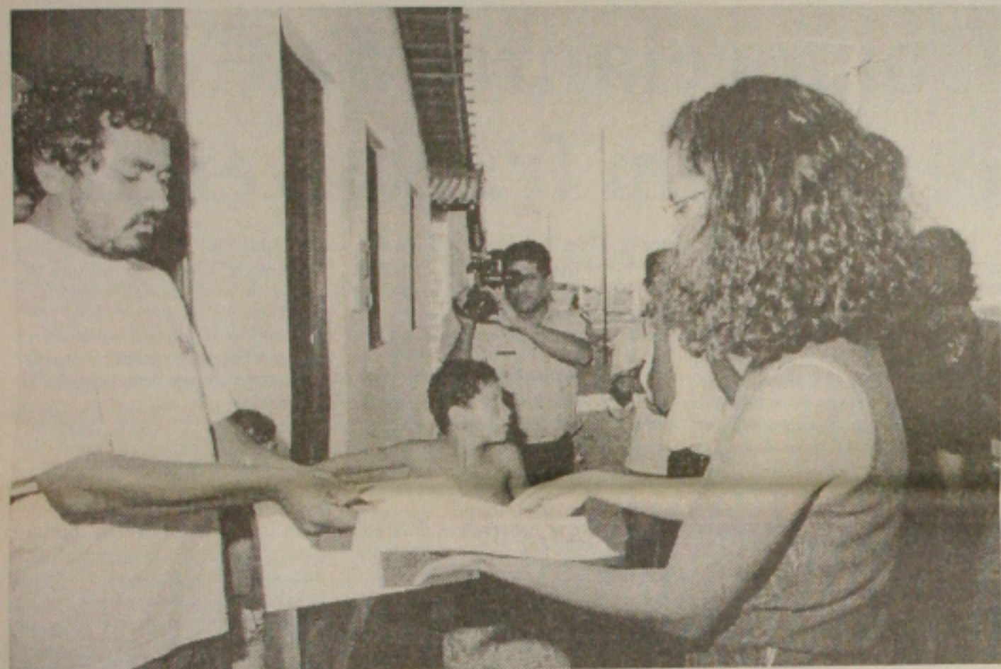
Oficial de Justiça entrega termo a um dos ocupantes