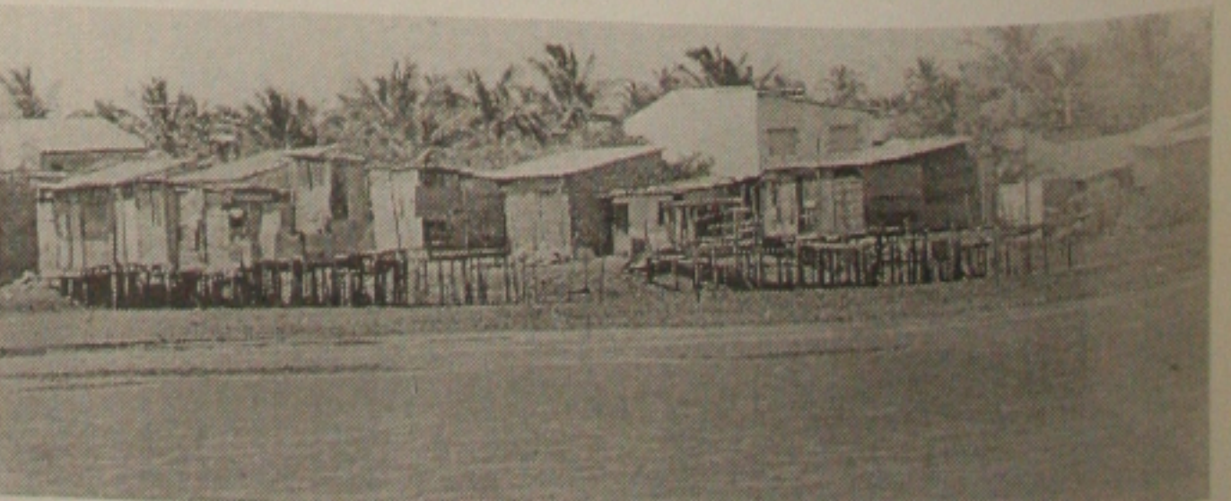
Barracos sob palafitas começam a invadir todo o manguezal da Coroa do Meio

Além disso, o Presidente explicou que as ações dos referidos órgãos estão sendo voltadas exclusivamente para as casas em construção nesses locais, mesmo porque, conforme ajuda, quanto mais rápido impedir o surgimento de novas casas, mais cedo será concluído o processo de extermínio total dessas invasões em nossa Capital.