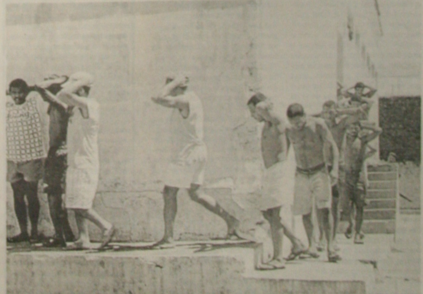
...que serão adotadas para evitar que outros presidiários sejam mortos no presídio de Aracaju