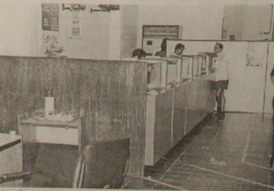
A agência foi assaltada no mês passado por quatro homens