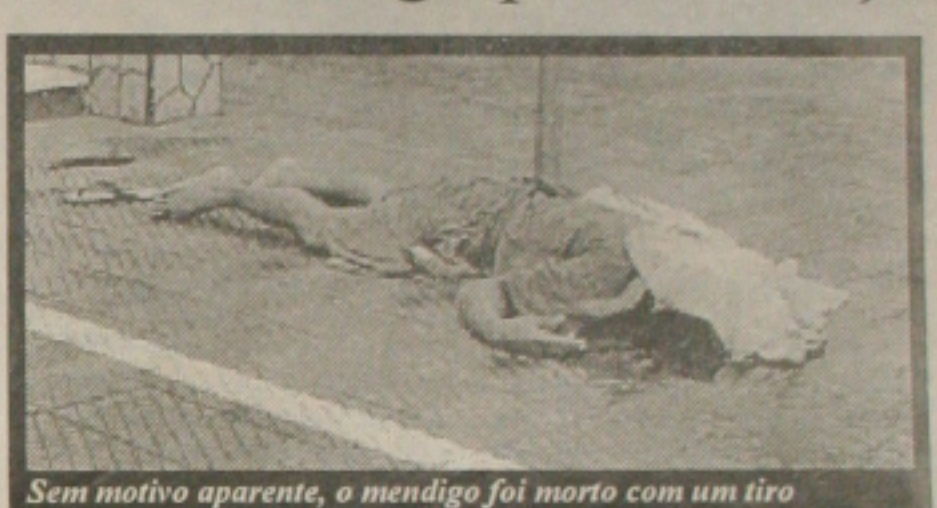
Sem motivo aparente, o mendigo foi morto com um tiro

VIOLÊNCIA Dois homens, em uma moto vermelha, assassinaram no início da tarde de ontem um mendigo, na Avenida Hermes Fontes, uma das principais vias de escoamento da Zona Sul da capital. O crime aconteceu por volta das 14h30, quando a vítima estava sentada na escadaria da casa 201. Segundo a única testemunha do crime, o menor E.S., os assassinos chegaram e, sem qualquer motivo aparente, dispararam três tiros, dos quais apenas um atingiu o mendigo na boca. (Página 4B)