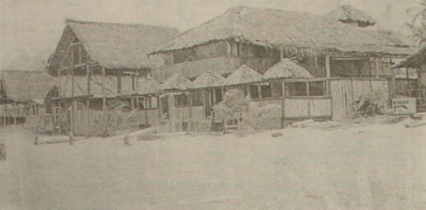
Barraqueiros da praia de Aruana ergueram residências no local concedido ao comércio

Na opinião do prefeito, barracos tiram a estética da orla e sustentam a moradia de muitos comerciantes