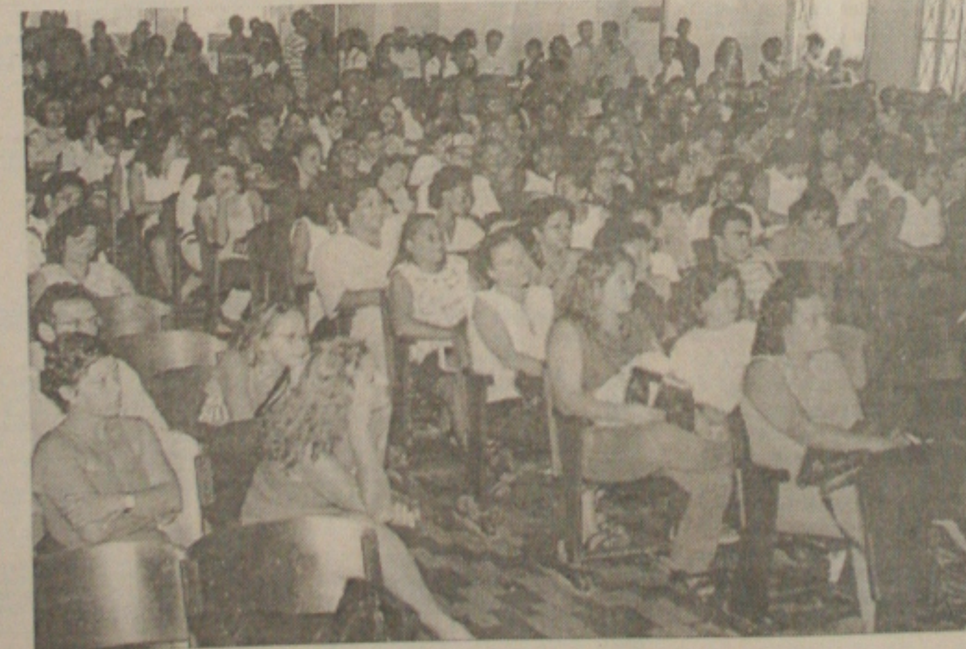
Professores lotaram o auditório do Instituto Histórico e Geográfico de Sergipe