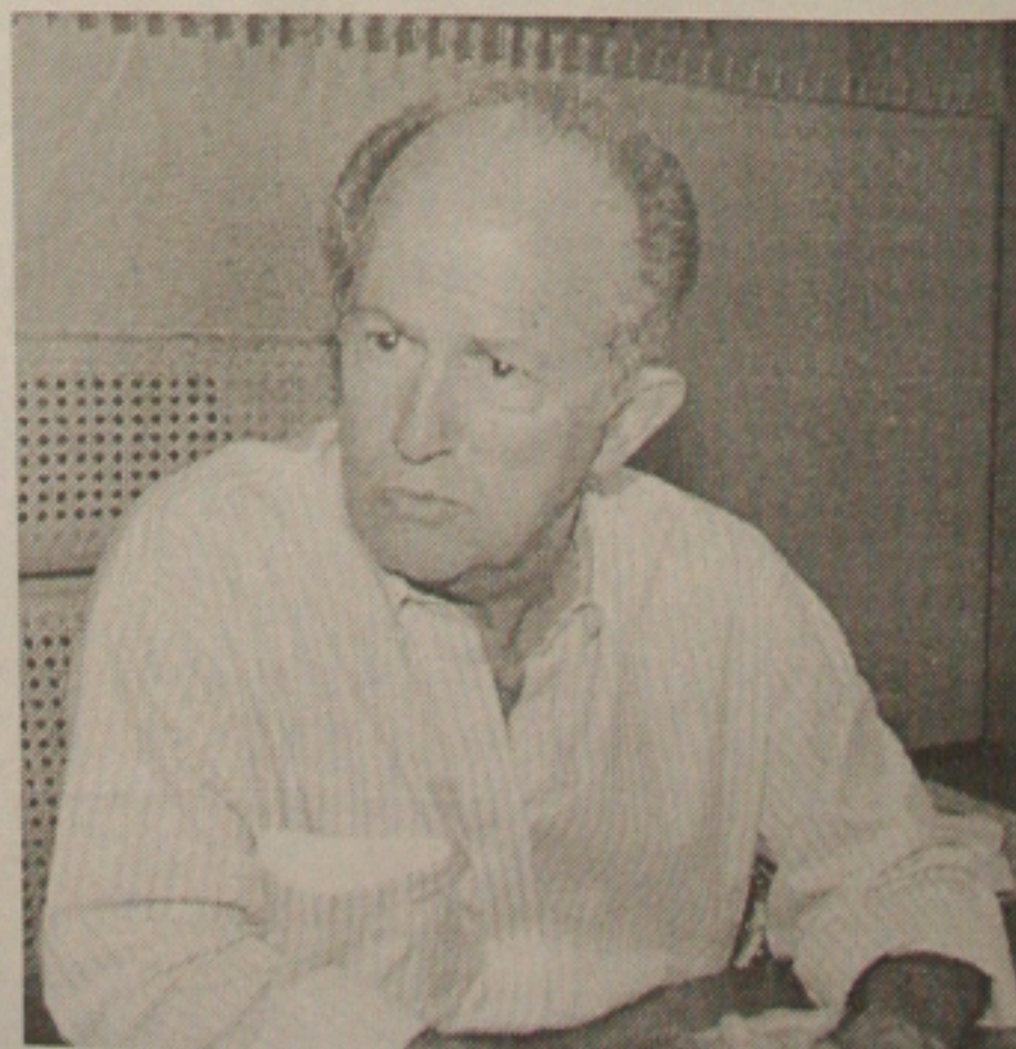
O governador Albano Franco diz que em sua família prevalece democracia

O programa, que será desenvolvido até novembro deste ano, terá 11 mesas redondas que vão explorar os temas: questões estratégicas; reestruturação da administração municipal; política industrial; questão agrária; setor terciário; emprego; educação, ciência e tecnologia; infra-estrutura — energia, transporte, saneamento e água; meio ambiente; saúde; e segurança pública. O público alvo do Pensar Sergipe são representantes institucionais dos órgãos públicos e da sociedade civil organizada — parlamentares, secretários de Estado, empresários, comerciantes, professores, juristas, economistas, representantes dos trabalhadores etc.