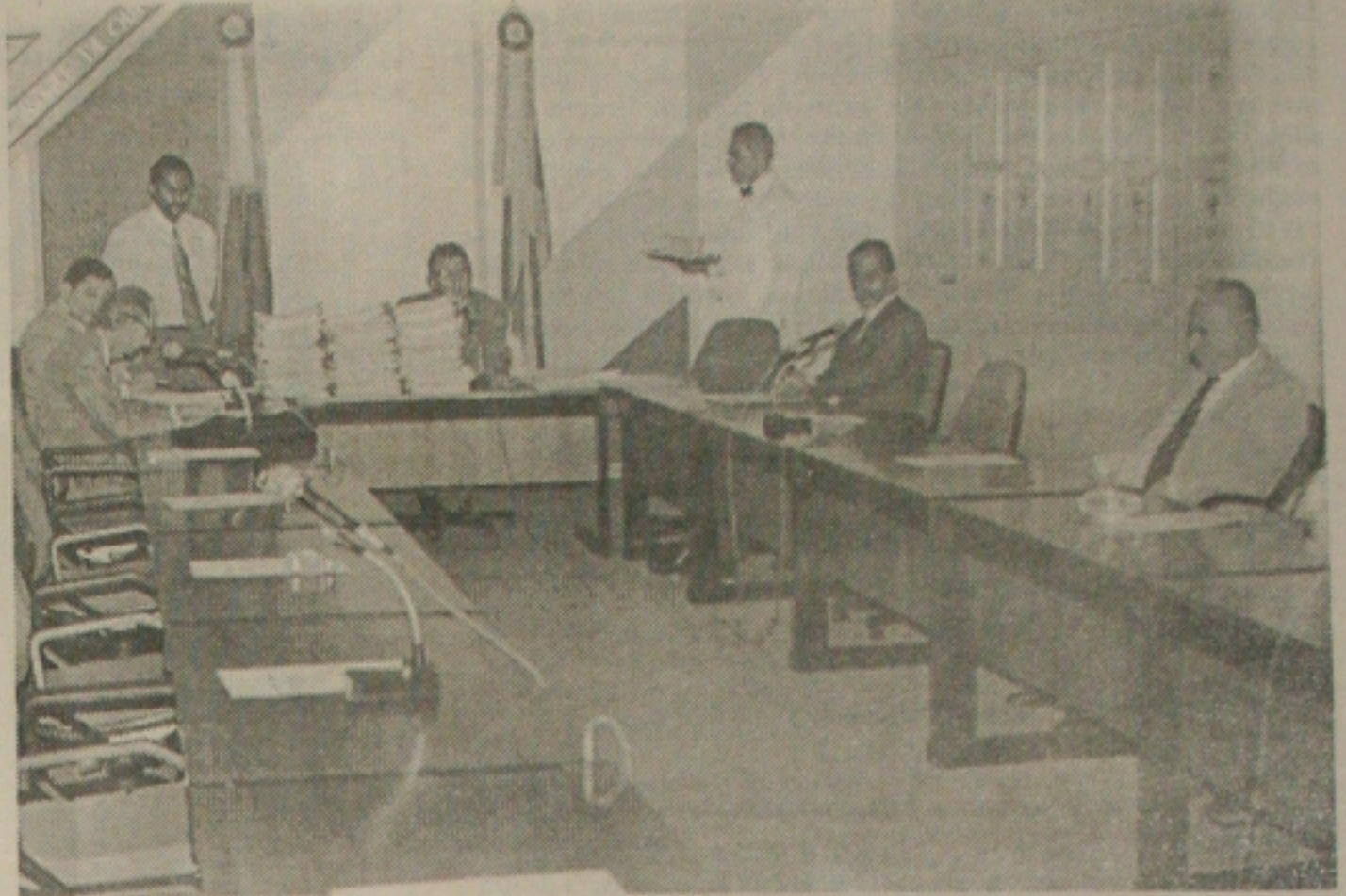
Apenas seis procuradores comparecem à reunião do colegiado, não havendo quorum para sua realização