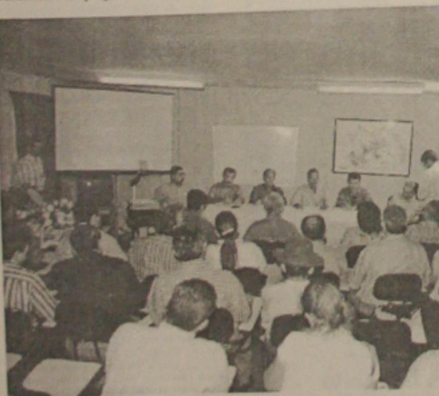
Governador e deputados recebem explicações sobre o Platô