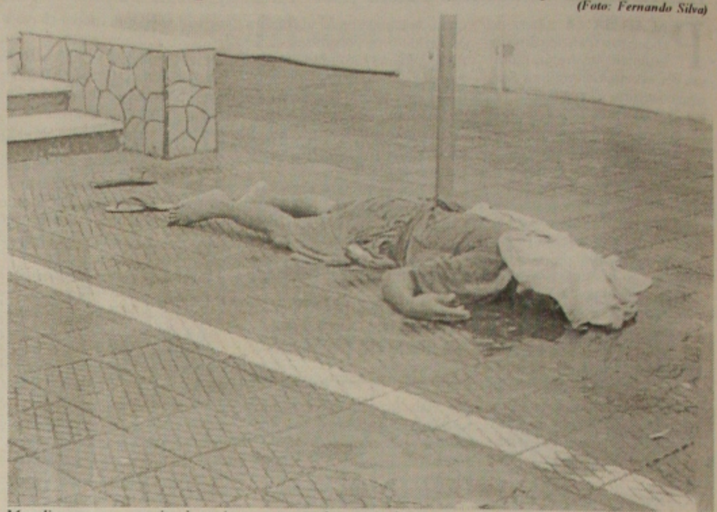
Mendigo morre com tiro à queima-roupa na boca por dois homens que ocupavam uma moto

O menor disse ainda que os assassinos chegaram em uma motocicleta vermelha, da qual não conseguiu decorar a placa. "Ele estava sentado, nas escadas da casa, quando os caras passaram e atiraram, fugindo em alta velocidade