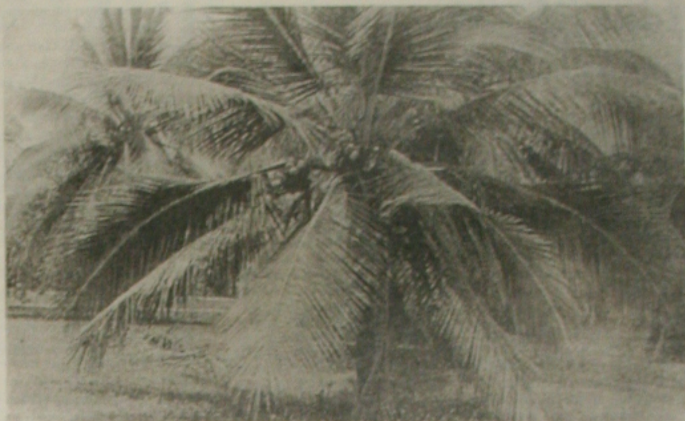
De acordo com a pesquisa da Embrapa, Pacatuba mantém o recorde em produção de cocos em Sergipe

Dentre os problemas relatados estão o aparecimento de pragas e doenças, a inexistência de linhas de crédito específicas, o difícil acesso às instituições financeiras e os baixos preços pagos pelo coco.