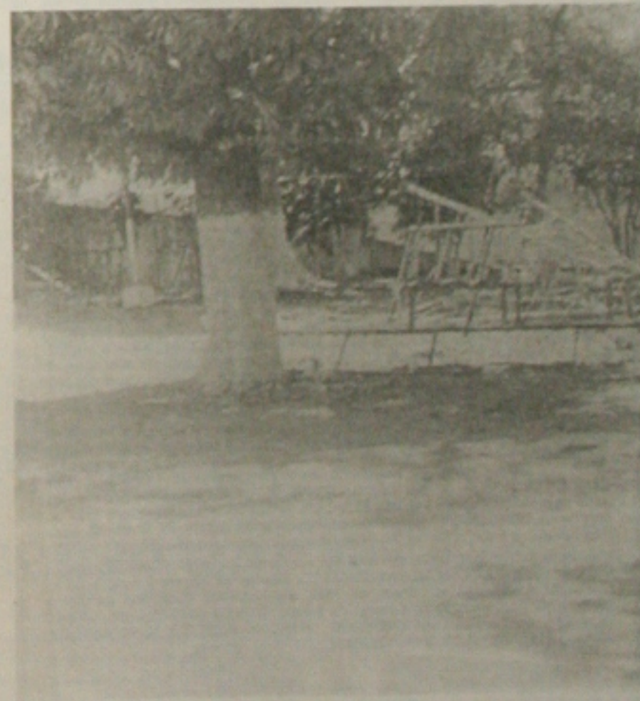
Além da Igreja Schramm está com as obras paralisadas