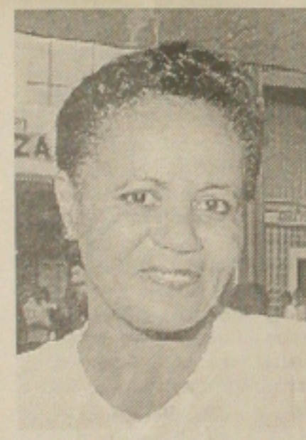
Alaide: "Minha sogra é ótima. Eu a adoro"

Pelo que a reportagem pôde constatar, a ideia de que sogra "nem morta", faz parte mesmo de muita conversa fiada. Pelo menos a maioria entrevistada, tem na sogra como uma segunda mãe, mantendo um relacionamento de respeito e carinho. Por outro lado, a minoria, preferia que a figura não existisse. A vê como um empecilho; uma bruxa sem vassoura, capaz de lançar maldições para destruir a vida de qualquer um e trazer o filho ou a filha de volta para o seio materno.