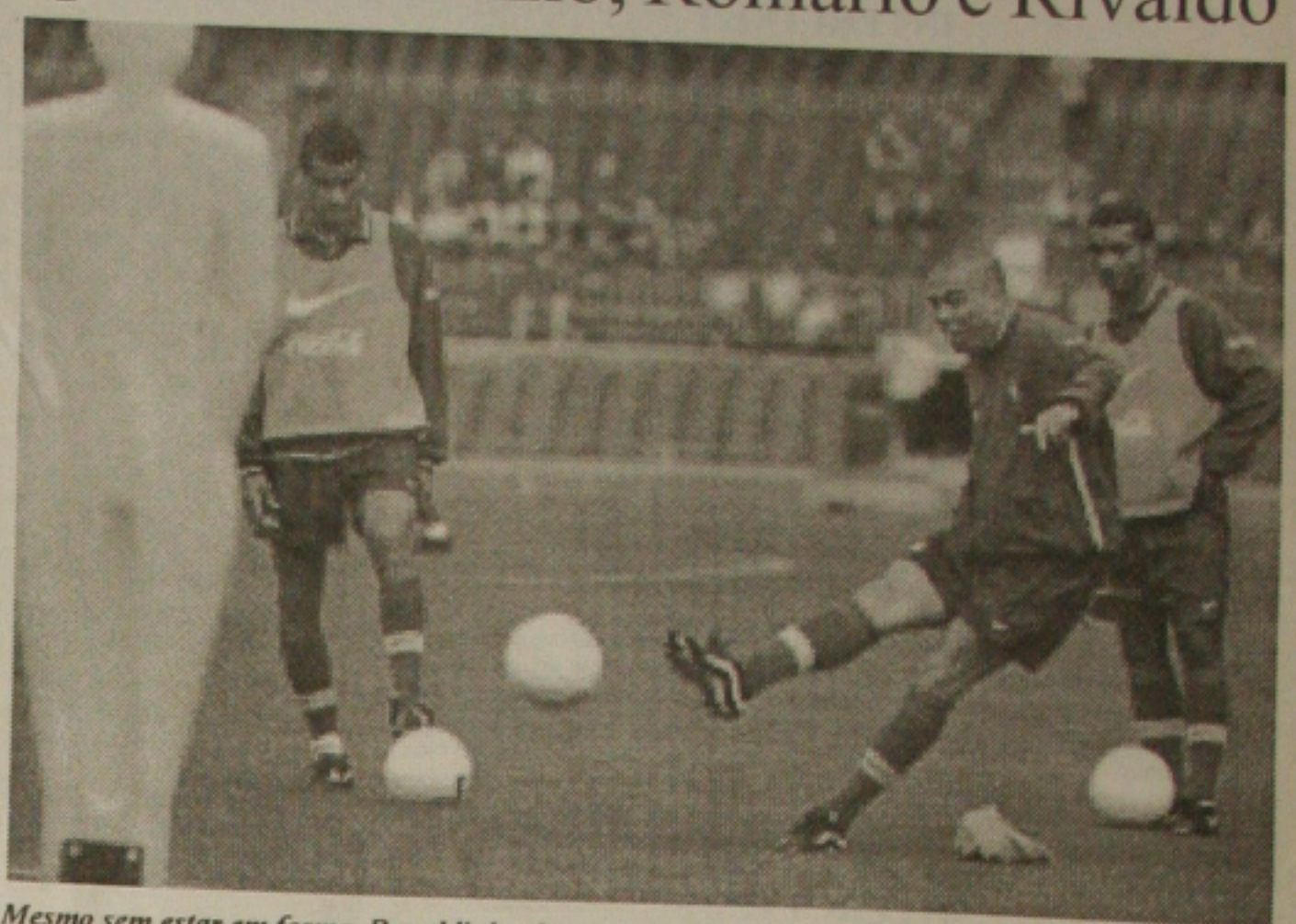
Mesmo sem estar em forma, Ronaldinho desperta a atenção dos adversários