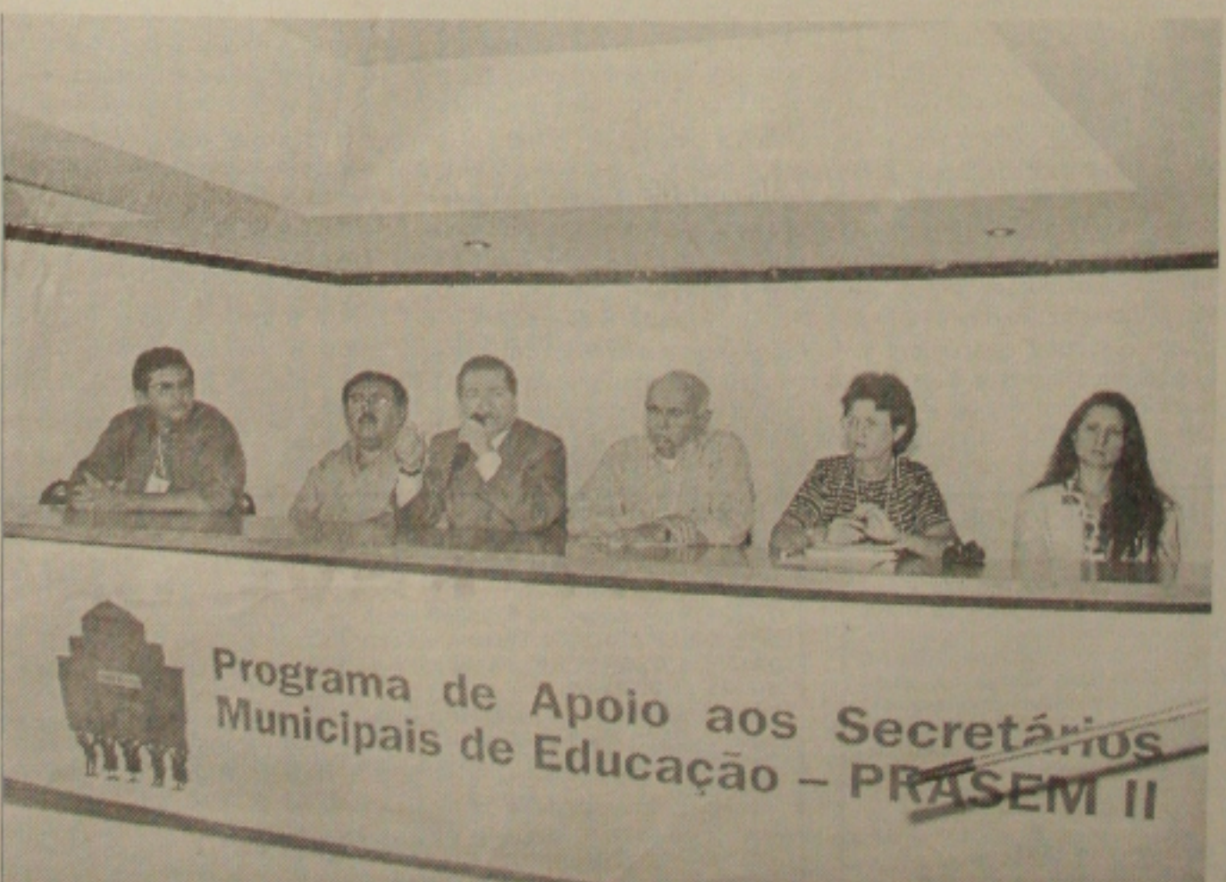
Secretário de Educação abre o II Prasem