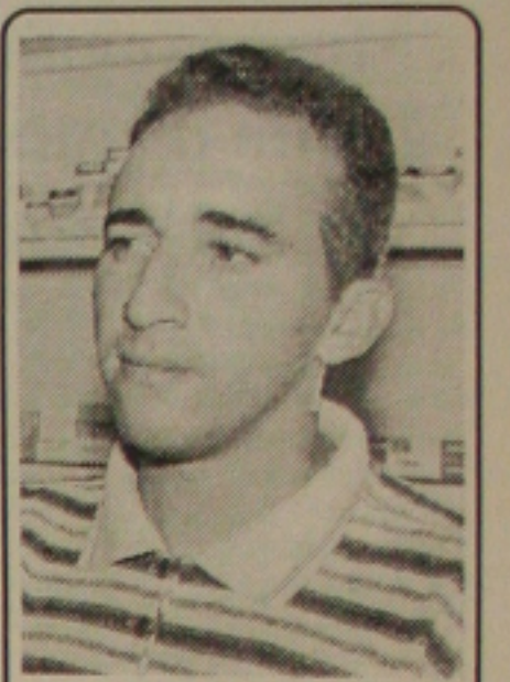
Gerente de farmácia confirma o fracasso das vendas do Viagra