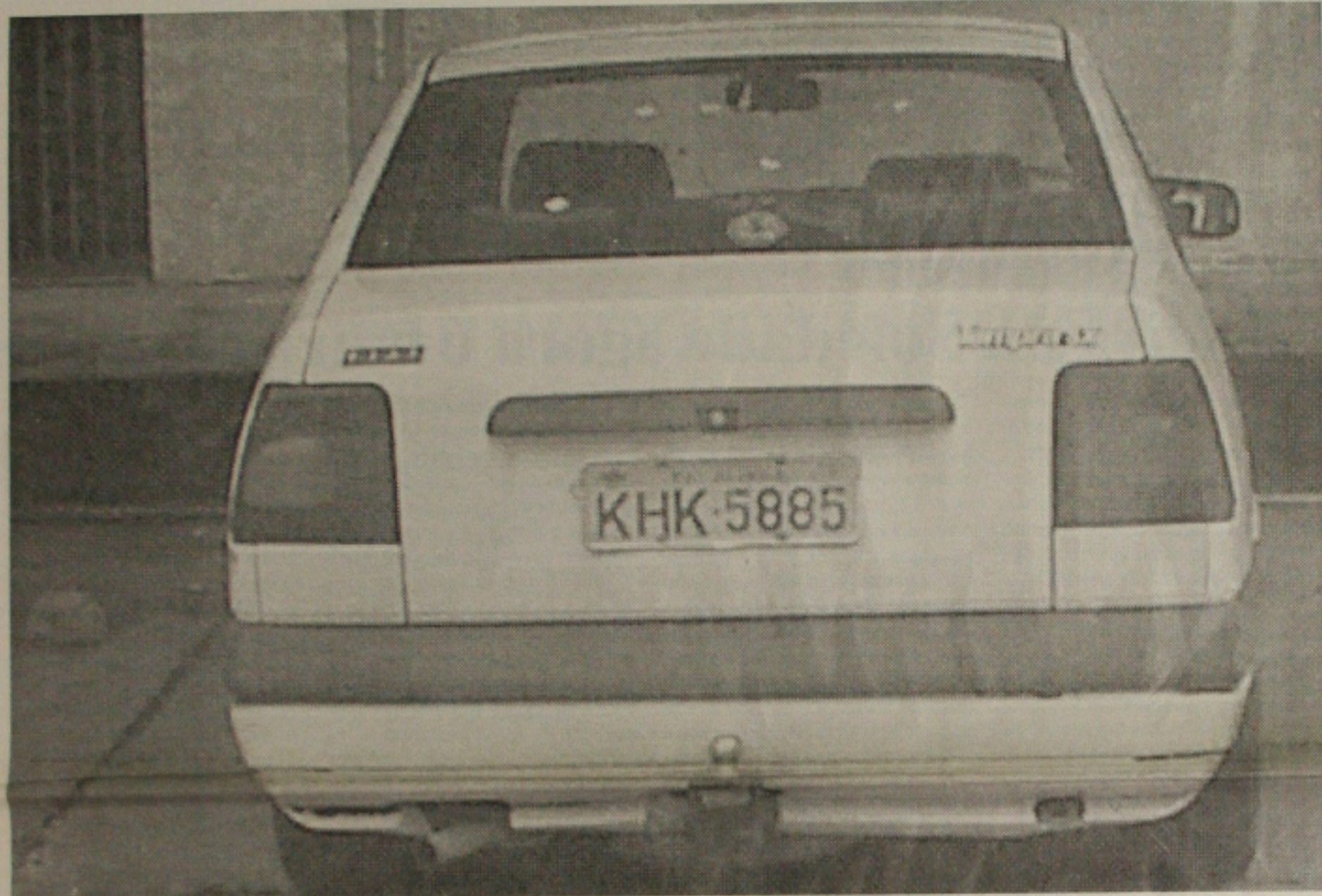
O Tempa apreendido em poder dos dois assaltantes era usado na perseguição de caminhoneiros que circulam por alguns estados do Nordeste