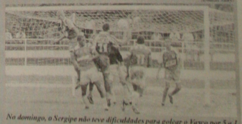
No domingo, o Sergipe não teve dificuldades para golpear o Vasco por 3 a 1