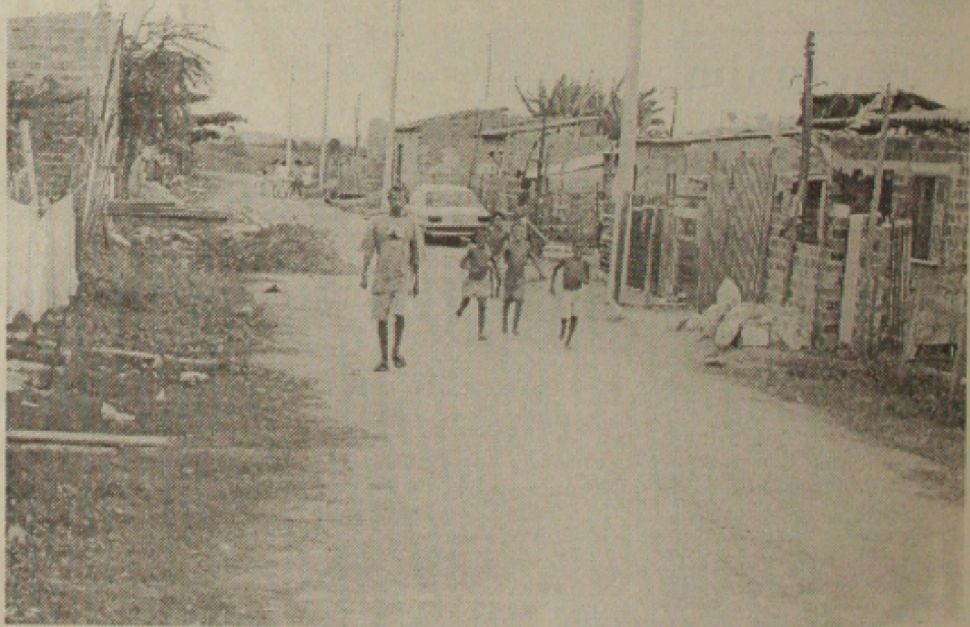
Moradores já não convivem com o mau cheiro da antiga lixeira; as reclamações são outras: o descaso