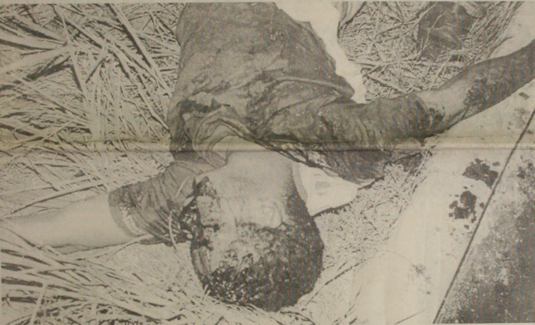
O assaltante, após rolar no acostamento, acabou atingido por um tiro na nuca, morrendo no local

Vítima era um dos assaltantes e foi atingida com um tiro na nuca por comparsa