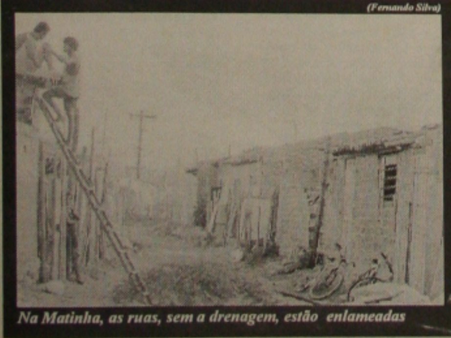
Na Matinha, as ruas, sem a drenagem, estão enlameadas