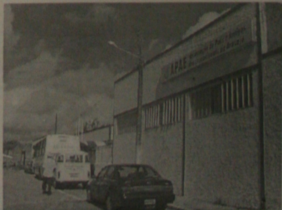
O prédio da APAE, no Bairro Industrial, amanheceu ontem arrombado

Em decorrência do local ter sido descaracterizado pelos funcionários, os peritos do Instituto de Criminalística pouco puderam fazer para identificar os arrombadores. Segundo informações da polícia, os ladrões ao entrarem no prédio, localizaram as chaves das salas, indo até o setor administrativo, de onde levaram os objetos. O caso será apurado pela 3ª DP.