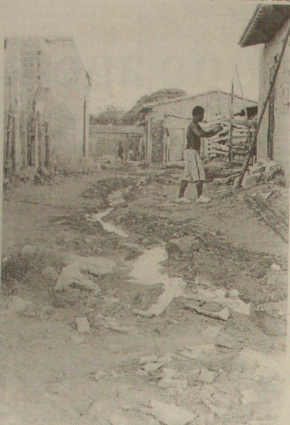
Córrego entre as casas transforma-se em lagoa quando chove

Invasão da Matinha - Os 150 dias determinados pelo Governo do Estado como tempo de conclusão das obras de drenagem, terraplenagem e pavimentação da Matinha estão agora estacionados. Motivo falta de recursos financeiros para dar conclusão aquela que seria considerada uma das grandes obras do governo numa área invadida e completamente irregular.