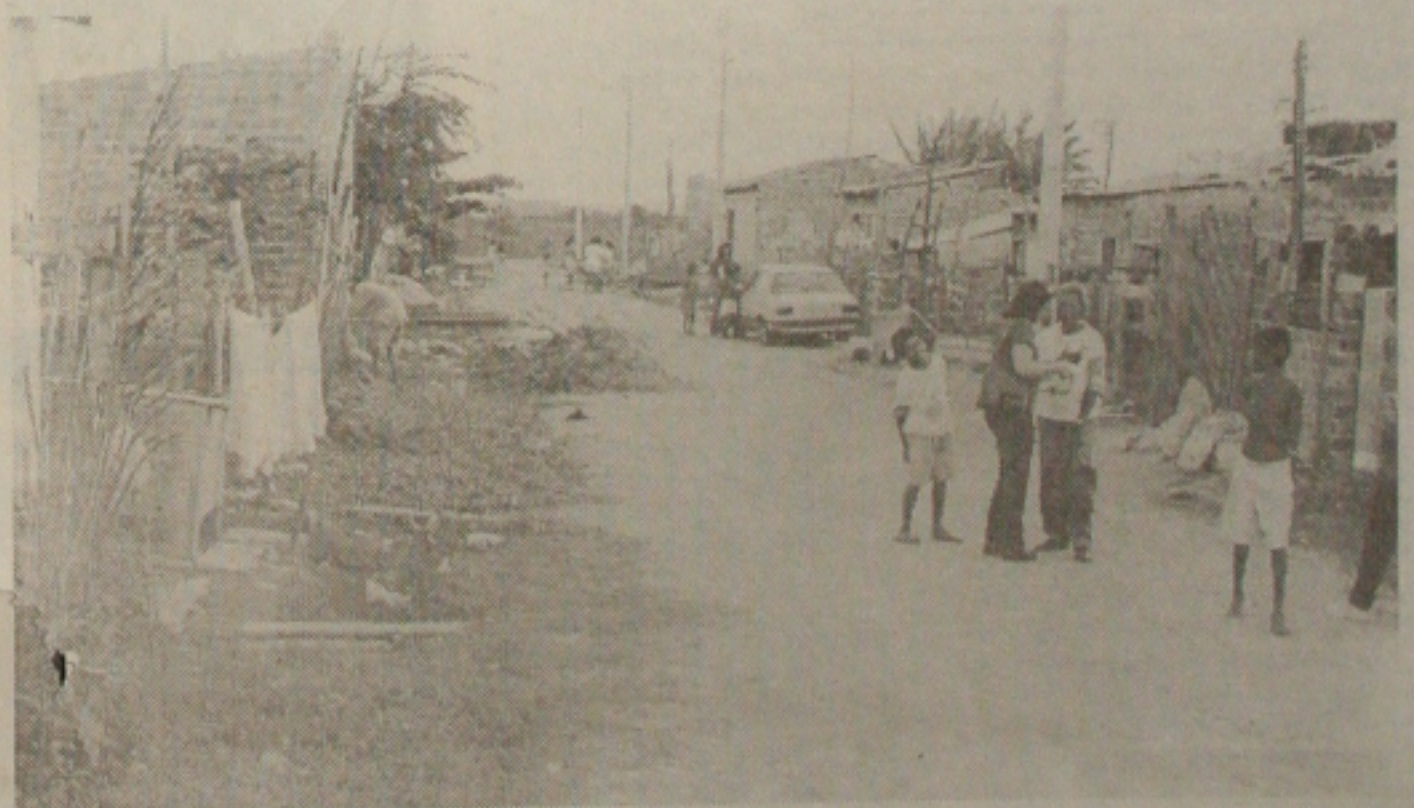
O bairro Senhor do Bonfim, que surgiu a partir da extinção da Lixeira da Soledade, é um dos mais carentes da capital. (Página 2B)

A assessoria de comunicação social da Companhia de Obras Públicas e Habitação (Cehop) confirmou ontem a determinação de fazer cumprir hoje a ação de reintegração de posse das casas do povoado Terra Dura. Os moradores perderam os barracos em decorrência das chuvas. (Página 6A)