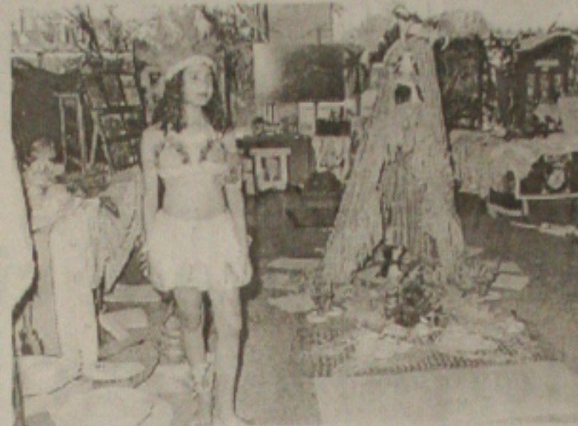
Japaratuba trouxe a figura da índia como representante