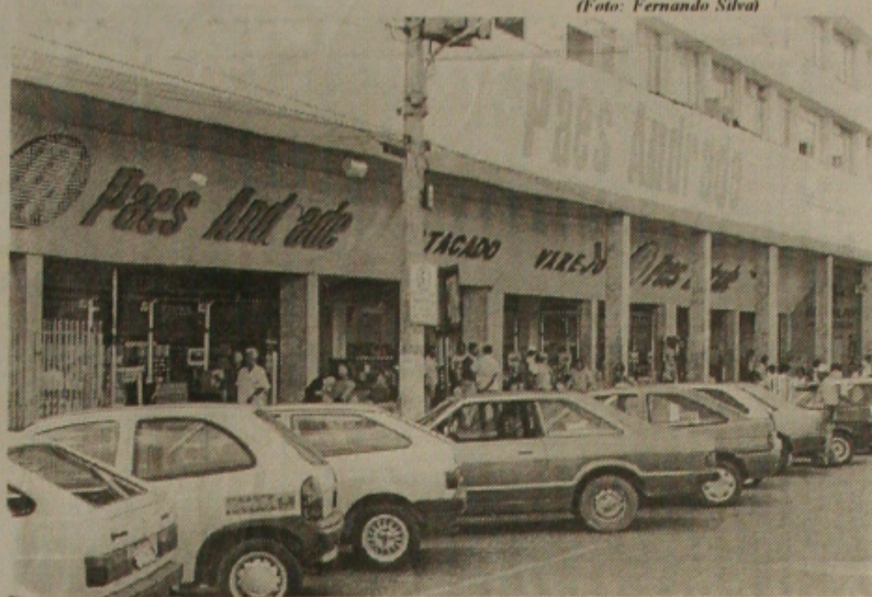
Armarinho Paes Andrade já está no mercado há 35 anos

mento em torno de 30 dias, mas que tudo está sendo resolvido na medida do possível, buscando honrar os compromissos assumidos. Ele ressaltou que existe uma preocupação por parte dos proprietários em manter o estabelecimento funcionando, até porque, existe um nome a ser zelado, como também uma preocupação com os funcioná-