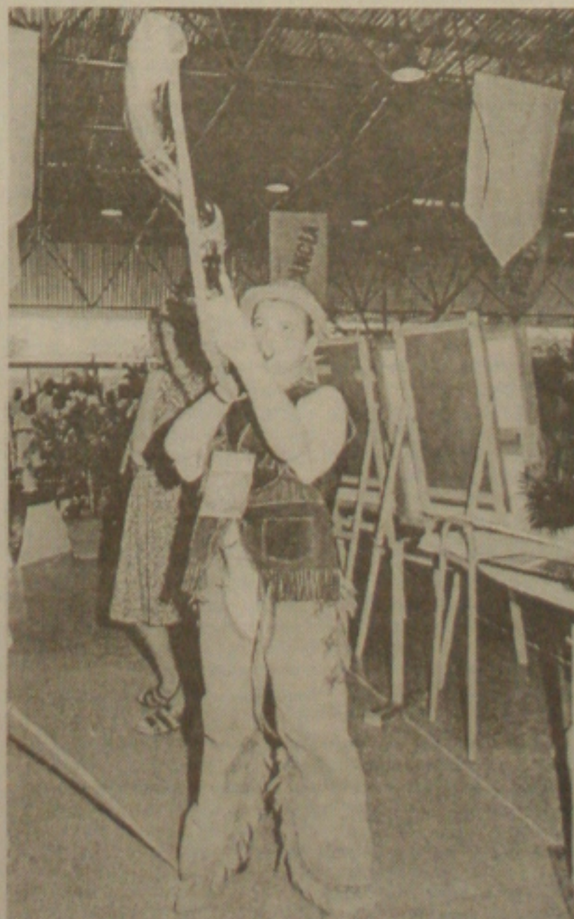
O estudante toca o berrante, na abertura da Feira dos Municípios

O Sergipe conquistou ontem à tarde no Estádio Sabino Ribeiro o título de Campeão Sergipano de Futebol Profissional de 1999, ao golear o Confiança por 4x1 de virada. Foi o 30º título na história do time rubro, que fez a melhor campanha. Não fez um bom primeiro turno, mas se recuperou, conquistando as três fases do campeonato, somando 66 pontos ganhos. (Página 1C)