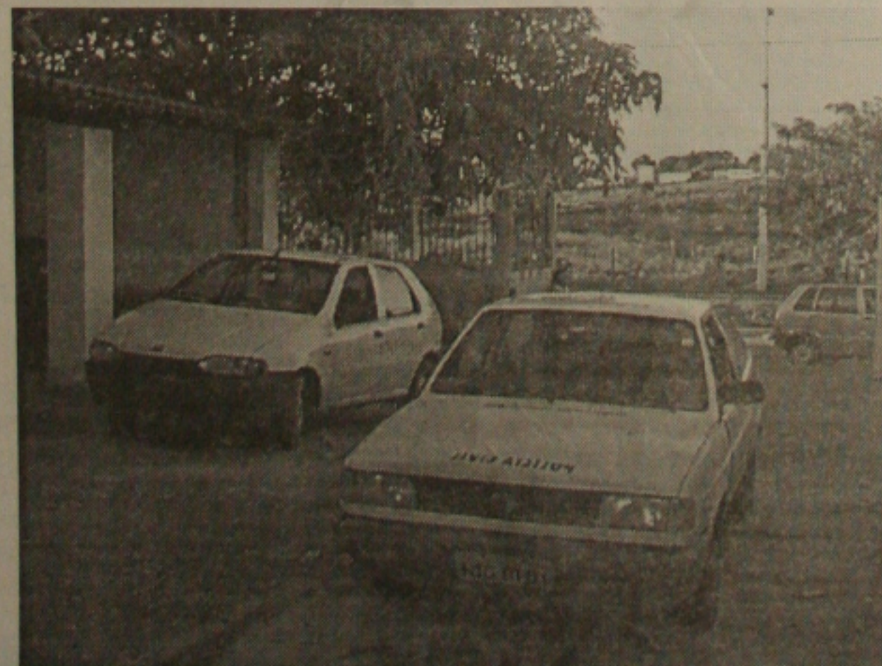
Desde ontem que as viaturas da Polícia Civil estão sem combustível por falta de pagamento

Dos carros alocados, 25 deles foram incorporados à frota da Polícia Militar. Dez estão em Aracaju e 40 viaturas no interior, que estão praticamente paradas porque a SSP deve mais de R$ 30 mil de combustíveis. Algumas prefeituras têm contribuído com o fornecimento de combustíveis.