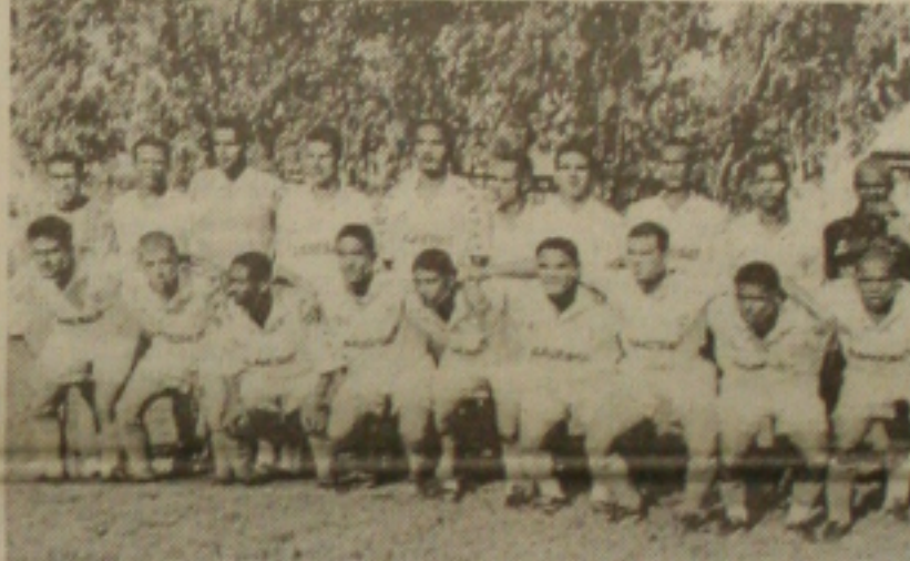
Com a melhor campanha do campeonato, o Sergipe mereceu a conquista do título