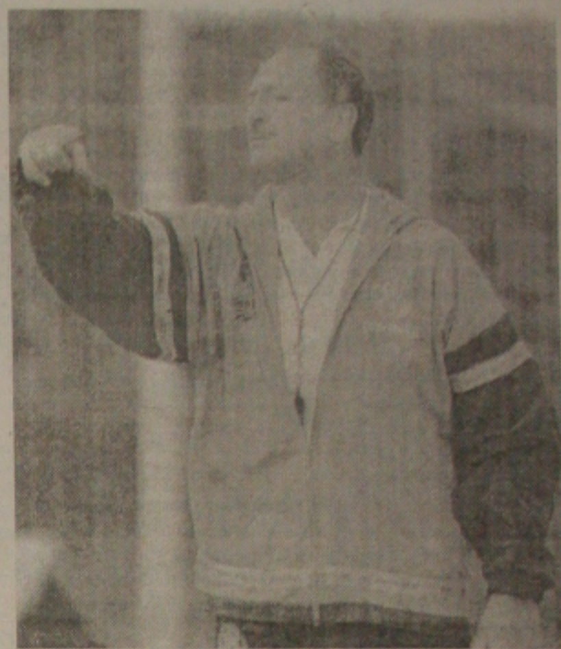
Scolari quer uma vitória hoje a qualquer custo