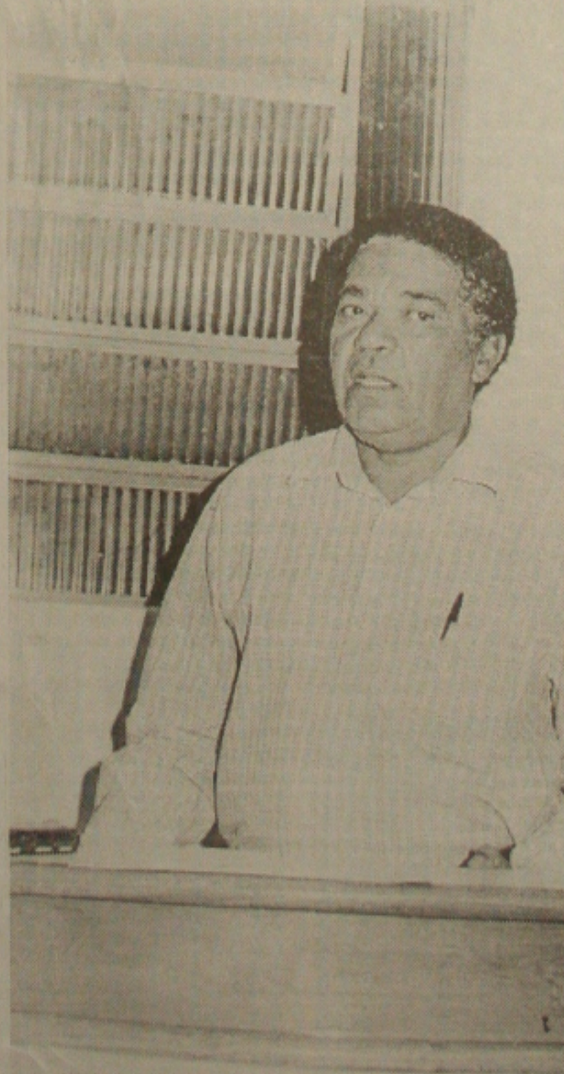
Santos denuncia o descompromisso do governo com Maruim