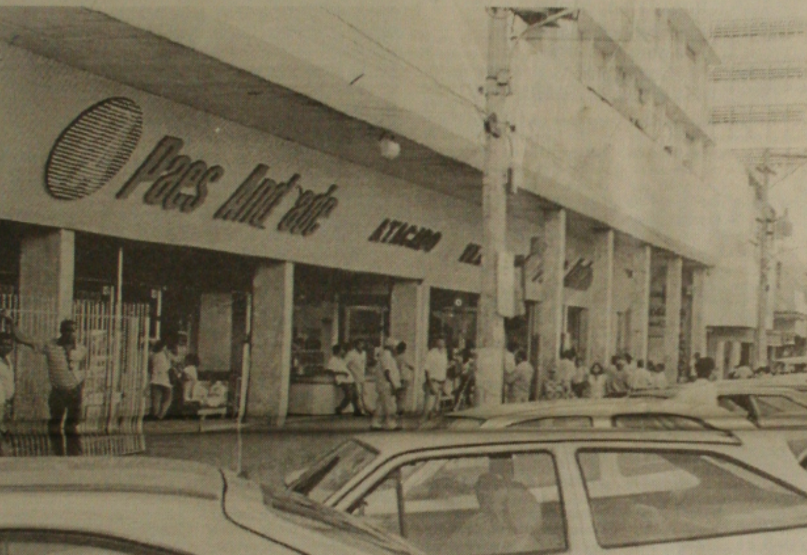
As atividades do setor de atacado, próximo ao mercado, devem ser transferidas para outra loja do grupo

Ex-presidiário é morto a tiros quando voltava para casa por homens em uma moto