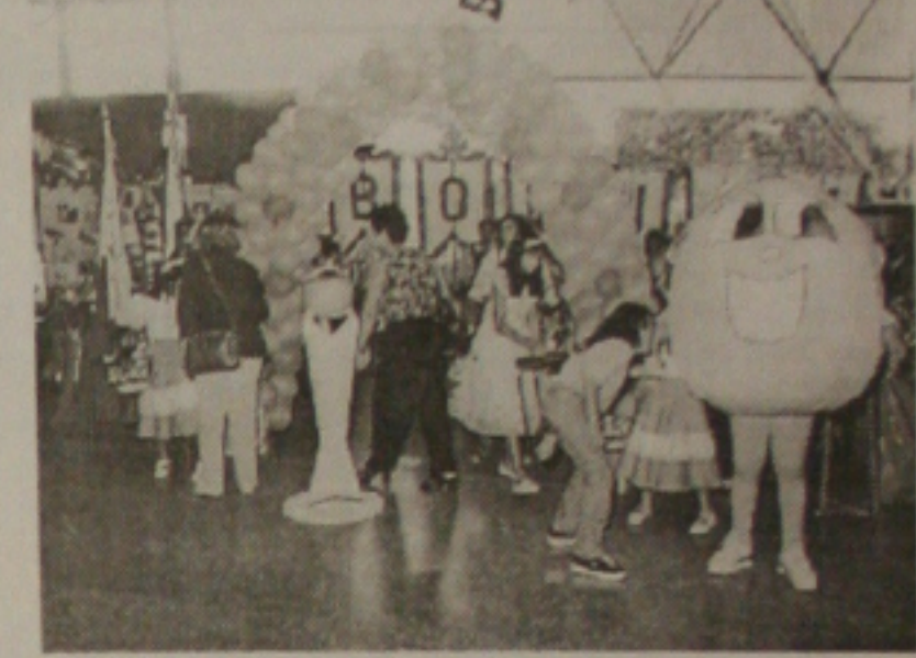
Laranja mostra a riqueza da cidade de Boquim