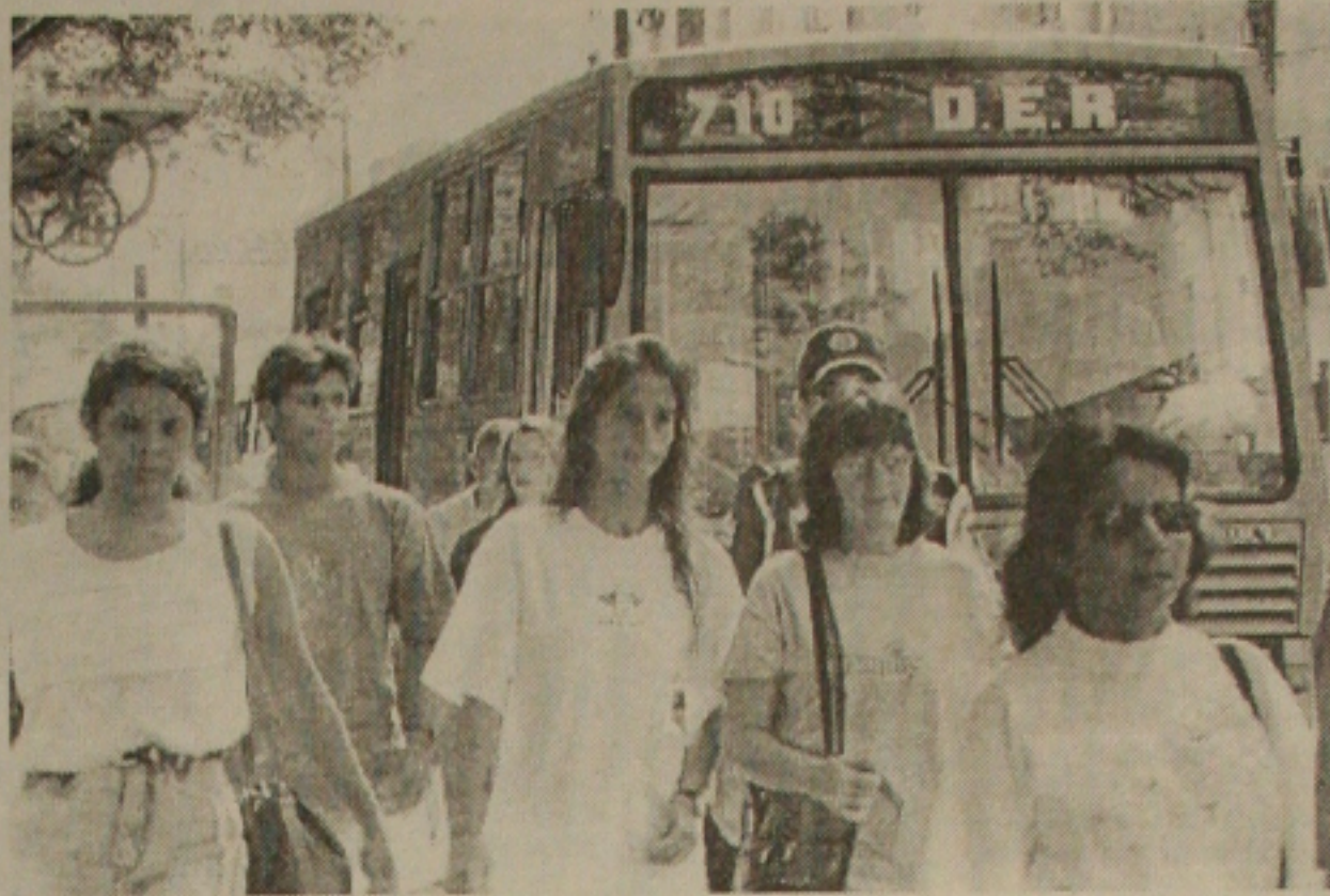
Usuários pagam mais por kombis e carros de passeio