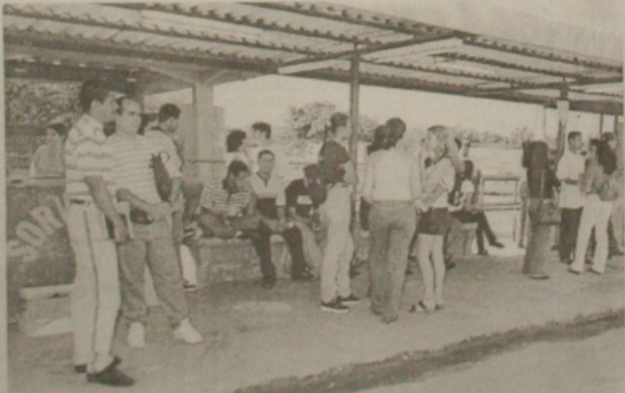
Estudantes aguardando o coletivo ficam irritados com a demora

"Tem sido um 'inferno' esperar ônibus nos pontos do campus, a superlotação é inevitável em horários de pico"