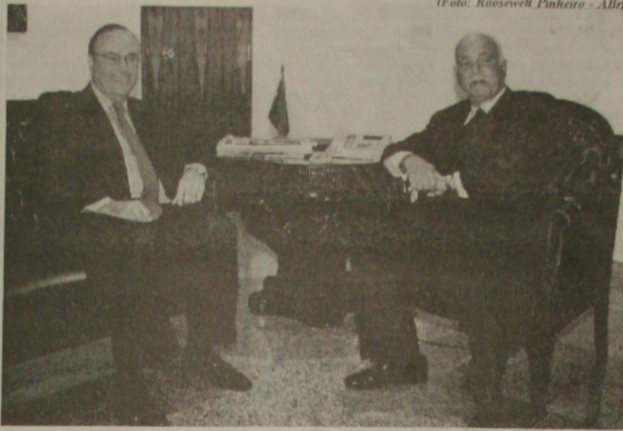
O presidente do Senado, ACM cumprimenta o presidente da Câmara, Michel Temer

Serra classificou também como "abusos disfarçados" o uso do índice médio dos reajustes. "O índice não pondera o preço porque muitos medicamentos têm aumento pequeno e outro muito grandes", completou.