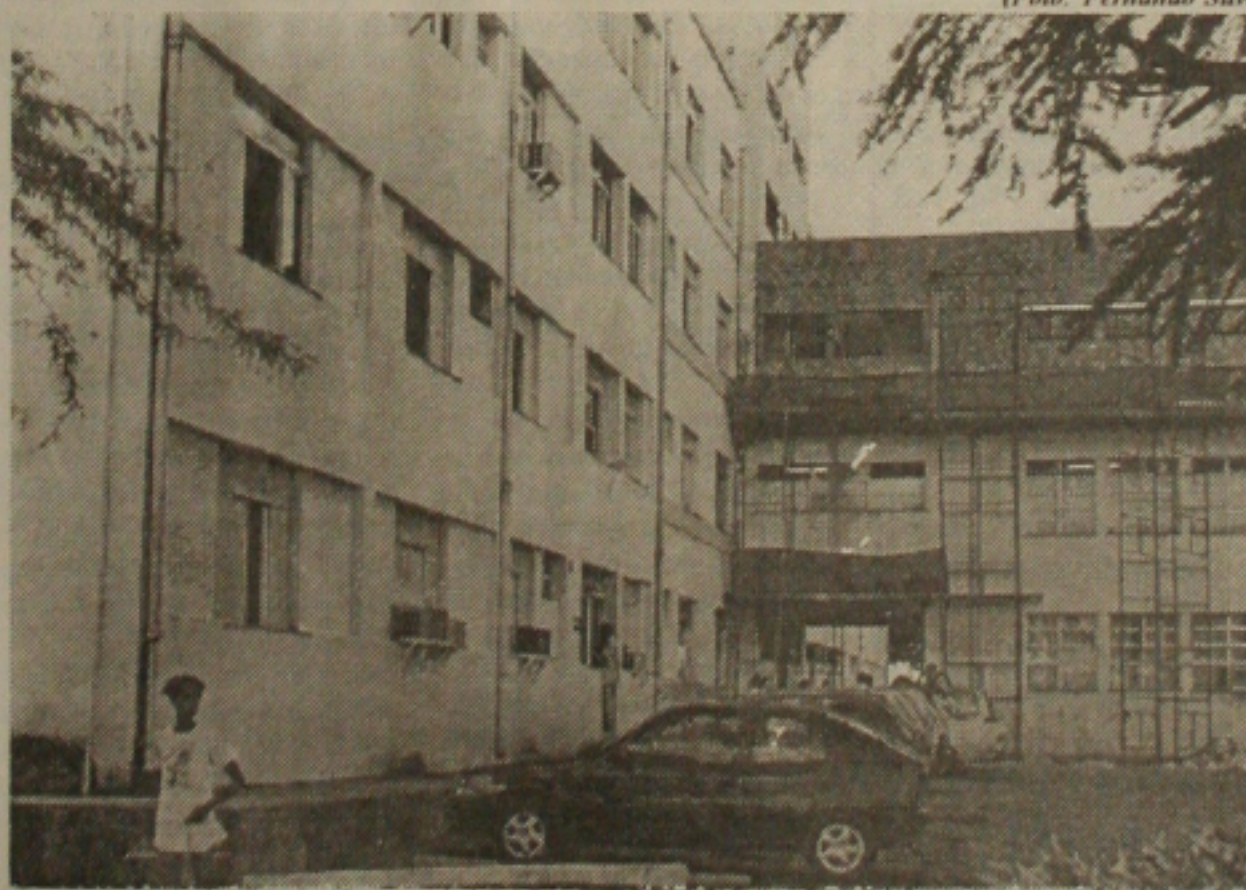
HU suspendeu cirurgias por falta de medicamentos

Com a suspensão dos atendimentos, cinco médicos residentes, nove anestesiologistas e 19 cirurgiões, deixaram de atender pacientes não só de Aracaju, mas também dos estados de Bahia e Alagoas, que diariamente procuram o HU, tanto para pequenas e médias cirurgias, como para outras áreas médicas. "O HU atende não só sergipanos como pacientes vindo dos estados da Bahia e Alagoas", finalizou Soares.