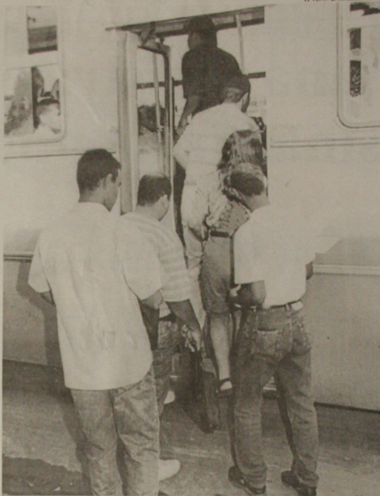
Depois de esperarem horas, estudantes tomam o ônibus no Campus