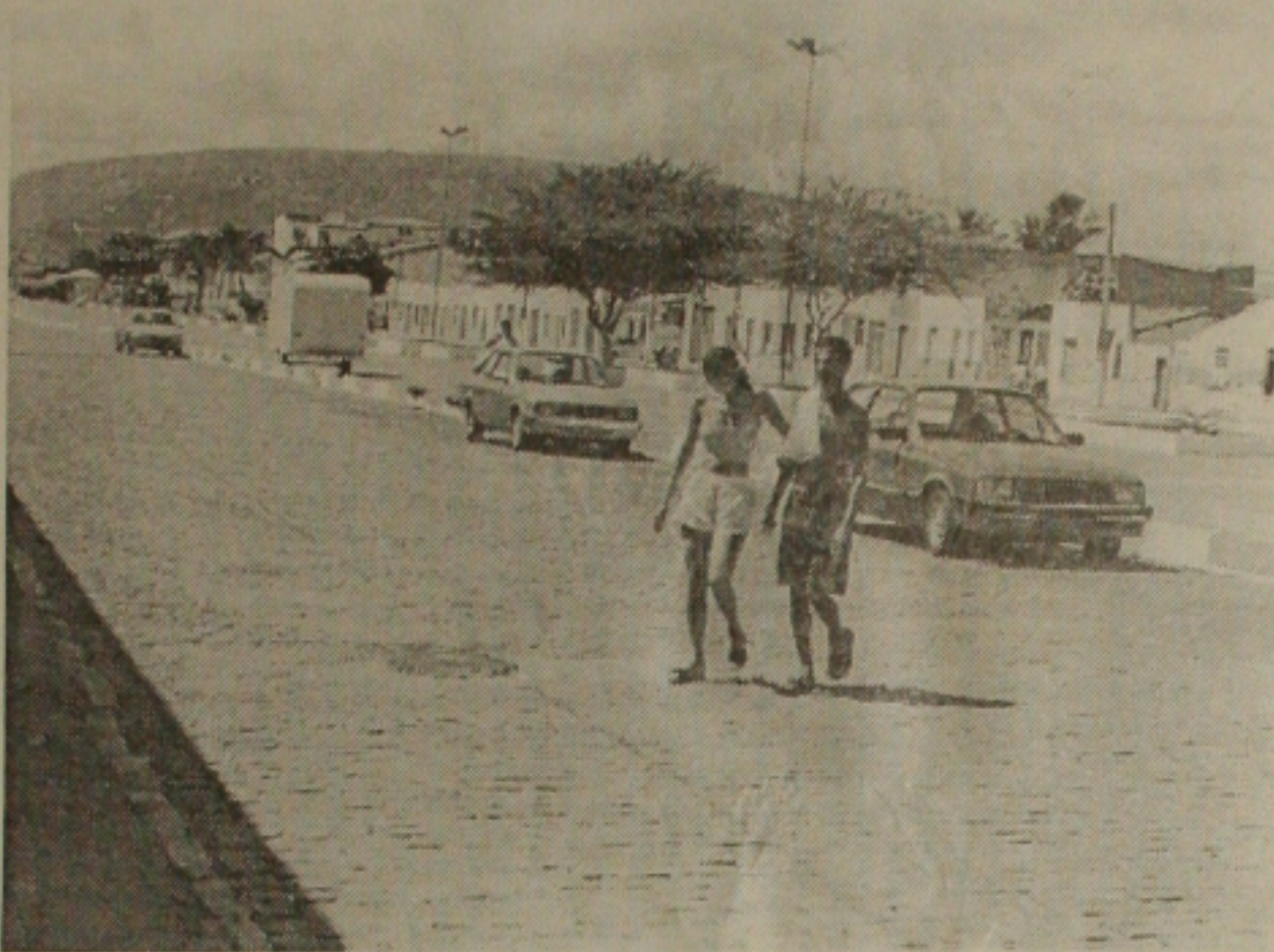
Itabaiana registrou ontem o vigésimo assassinato num período de 90 dias.

"Quem tem boca diz o que quer", rebateu o prefeito. O exame de DNA foi realizado no Instituto de Patologia Clínica Hermes Pardini, em Belo Horizonte. A polícia de Pernambuco tem agora dois casos para resolver: o do próprio menino seqüestrado e o da ossada, que agora está sem identificação.