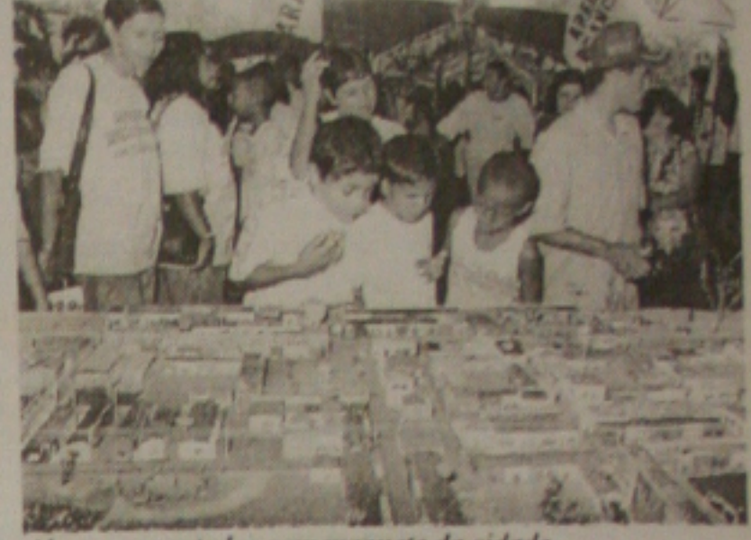
Alunos encantados com maquete da cidade