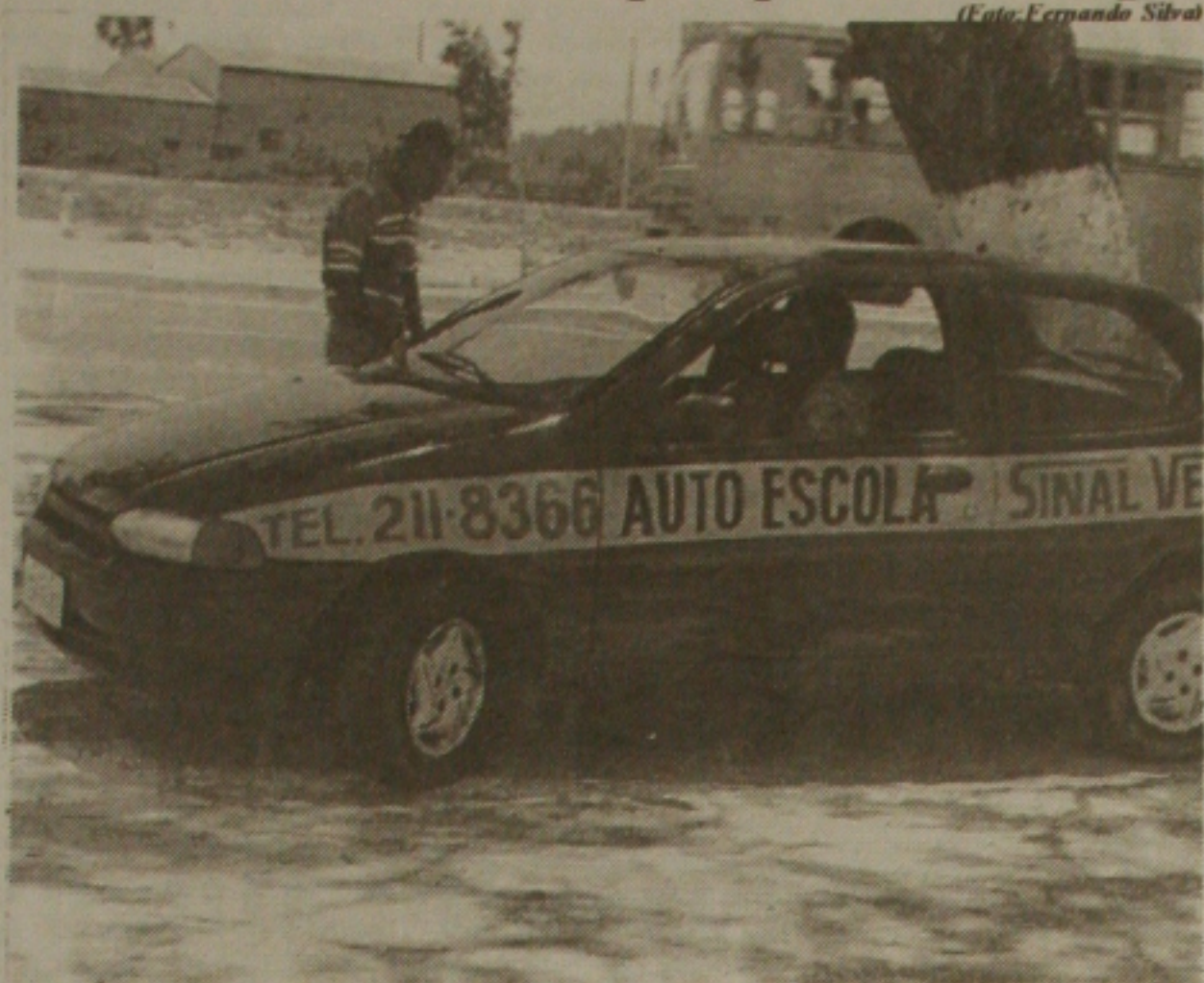
Irregularidades no curso de direção do Detran

O evento inicia com a apresentação da Secbanda e, em seguida, o desfile militar com o Exército Brasileiro, Marinha do Brasil, Polícia Rodoviária Federal, Polícia Militar de Sergipe e Corpo de Bombeiros