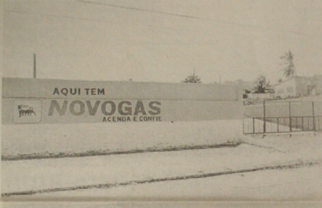
Depósito na Avenida Edézio Vieira de Melo