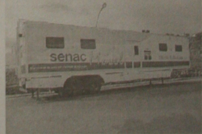
Senac Móvel estará nas ruas de Aracaju a partir de hoje