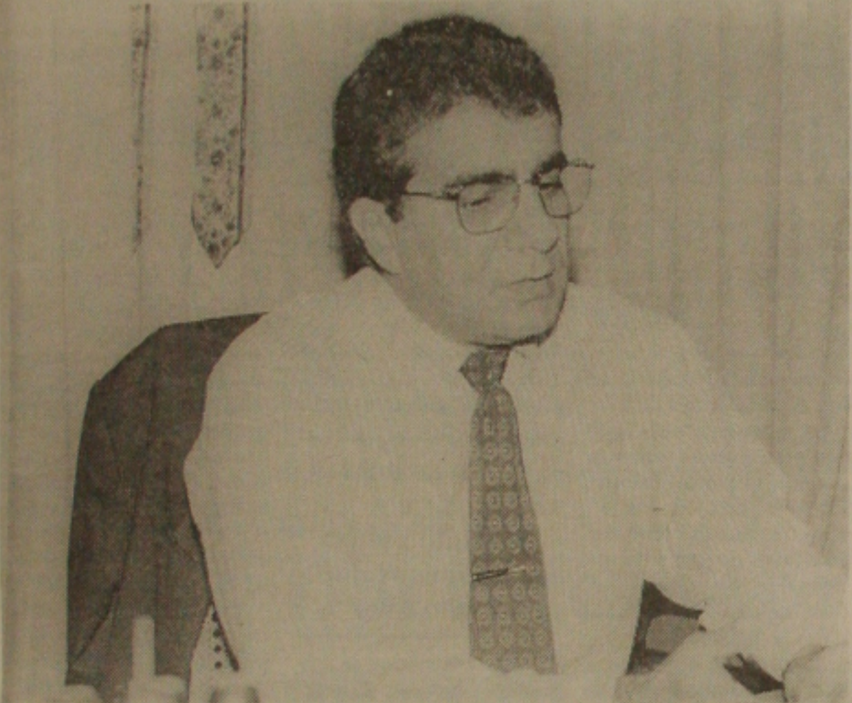
Passos investiga o assalto ocorrido no centro de Aracaju contra um comerciante