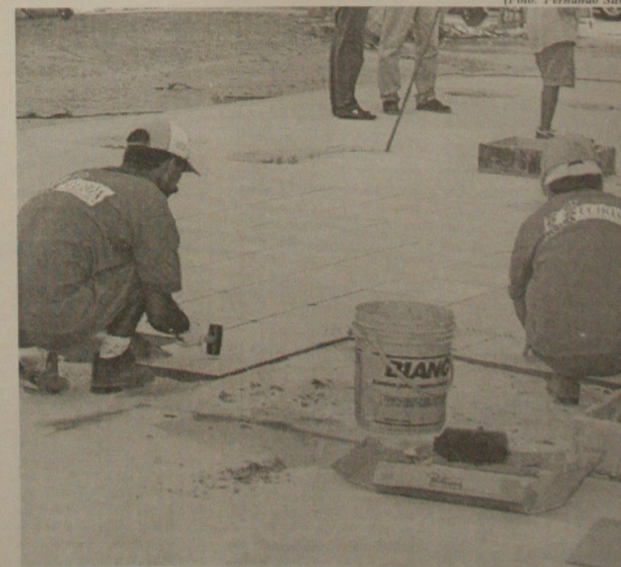
Lajotas dão dimensão das obras da revitalização do centro comercial

tro comercial e histórico de Aracaju monopolizava as melhores estruturas de comércio e serviços. Hoje, perder progressivamente para novas estruturas comerciais de maior porte e etilizadas como shoppings centers e galerias comerciais em diversos bairros. Com o início das obras o projeto já começa a modificar o panorama da região. Aliado a isto, a PMA já estuda a criação de benefícios fiscais e isenção de taxas para que o uso residencial da região seja estimulado, evitando o vazio noturno e otimizando a utilização da rede de infraestrutura disponível no local. Há ainda a proposta de concessão aos proprietários de imóveis de interesse histórico e arquitetônico, que não devem ser demolidos, da venda do potencial construtivo inerente ao seu terreno para terceiros. "O centro da capital mantém uma forte ligação com a identidade sócio cultural dos aracajuanos, representando sucessivas acumulações de vivência, tradições e, principalmente, cidadania. Por esta razão, merece os investimentos públicos que têm sido alocados que terão benefícios para o comércio, para o turismo, promovendo geração de novos empregos e, sobretudo, uma melhor qualidade de vida para os aracajuanos", finaliza o prefeito João Gama.