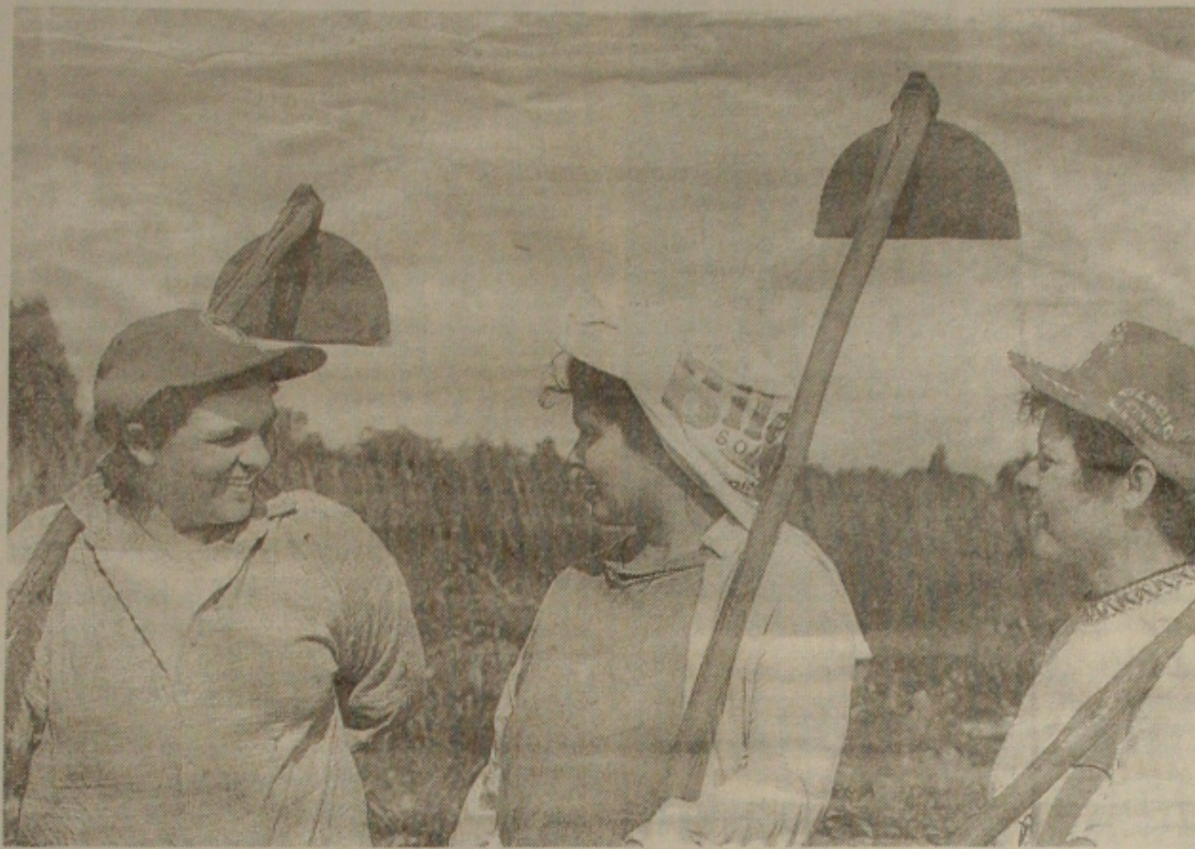
Pequenos produtores também terão apoio do BB

O BB diz que está examinando a adoção das medidas judiciais necessárias para evitar que estudos e informações