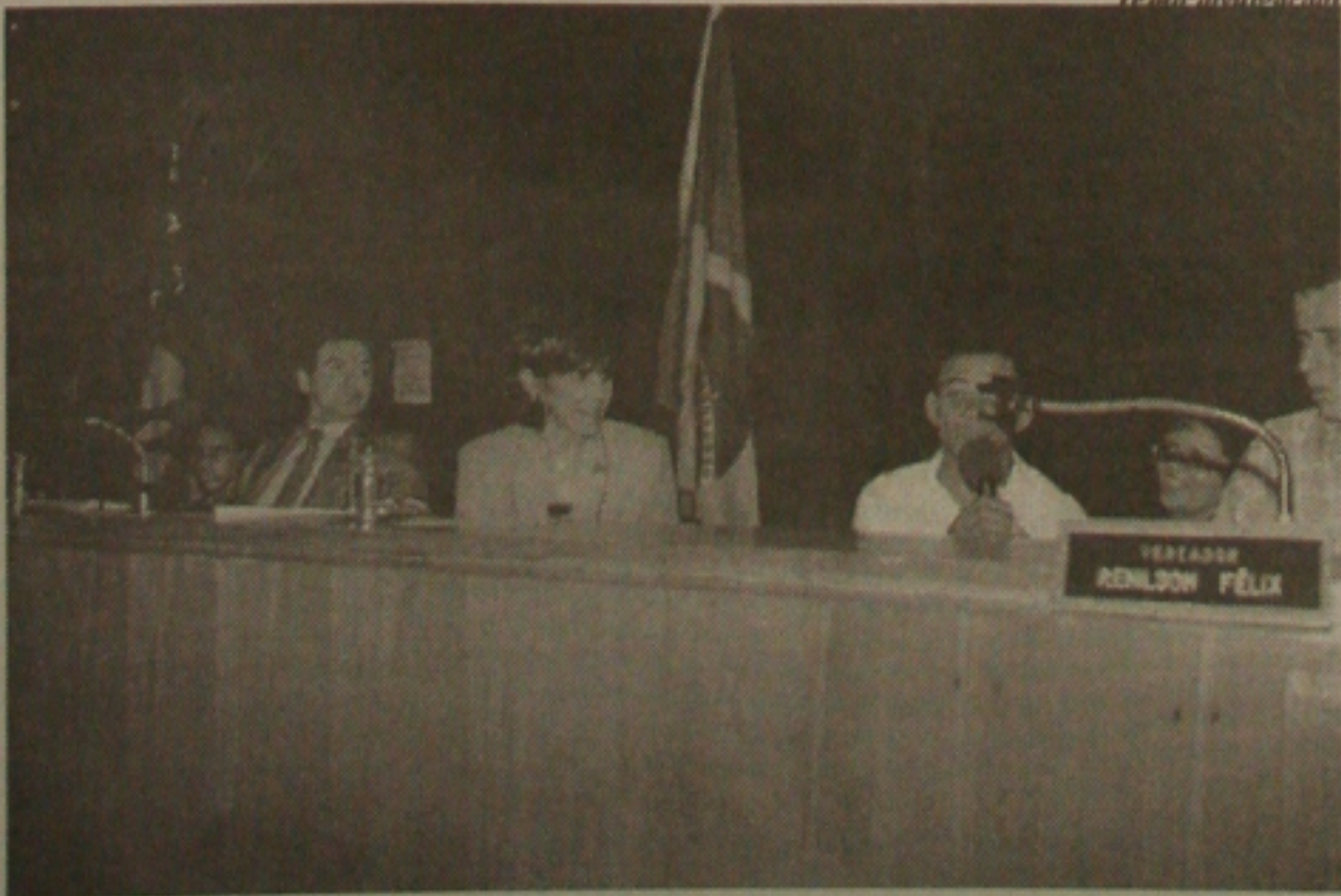
Excepcional faz apelo aos vereadores

Seis funcionários do Departamento Estadual de Trânsito (Detran), estão participando de forma irregular do Curso de Reciclagem de Diretor-Geral e Ensino, que está sendo promovido à distância, pela Associação Brasileira dos Detrans (Abdetran), em convênio com o Detran, que teve início no último dia 15 deste mês, e que tem como objetivos