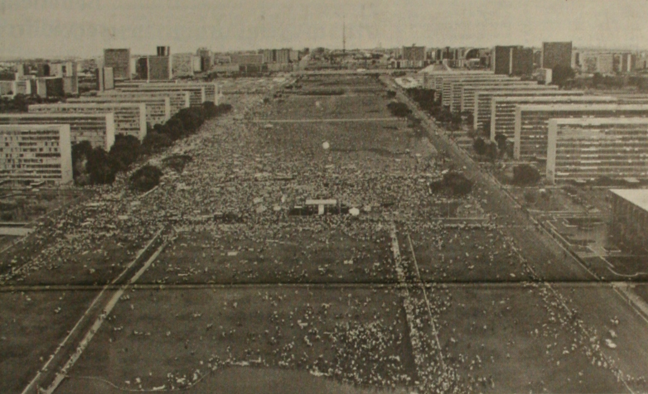
Marcha dos 100 Mil reuniu ontem na Esplanada dos Ministérios milhares de sindicalistas de todo país no maior protesto contra o governo FHC

Os pronunciamentos dos políticos hoje no encerramento da Marcha dos Cem Mil procuraram marcar o ato como o início de um movimento mais amplo, que poderia mudar o País. O rumo, para o líder nacional do Movimento dos Trabalhadores Rurais Sem Terra (MST) João Pedro Stédile, é uma greve geral, em 8 de outubro, quando um outro movimento, a Marcha pelo País (em curso), chegar a Brasília. A greve geral somaria um fim mais amplo, a mudança do governo. (Página 8A)