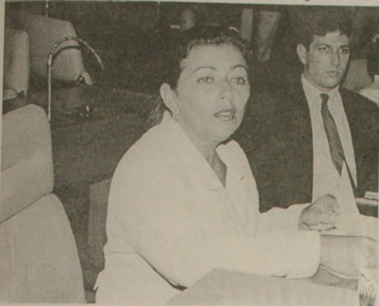
Susana cobra ação firme contra FHC, Telemar e Embratel

Governo tira vários órgãos, despreza os nordestinos e pressão tem que continuar