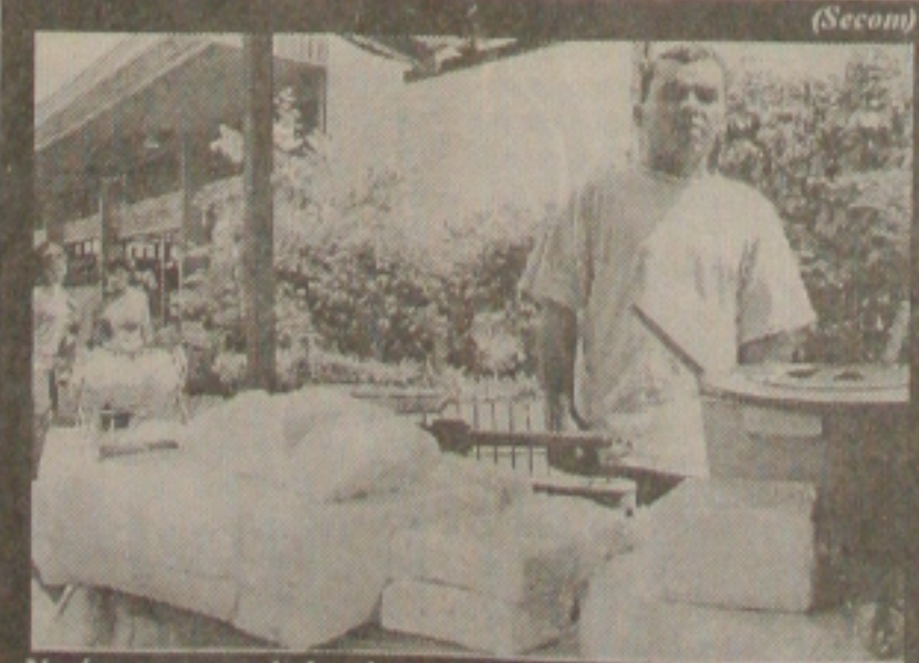
Na área externa do hotel, produtores expuseram o queijo produzido em Sergipe