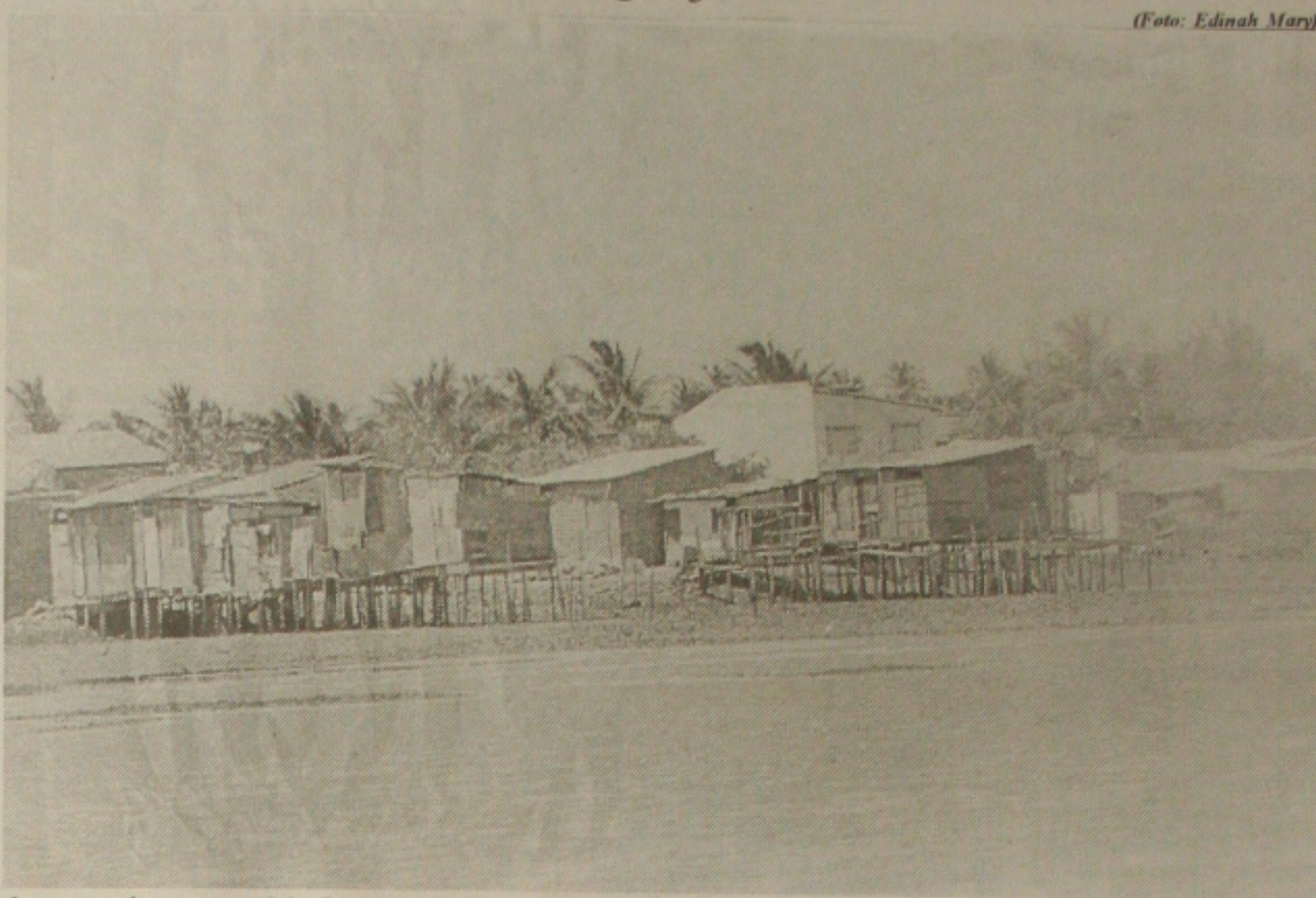
Invasores do manguezal da Coroa do Meio pagarão multa

"Esse projeto é mais uma enganação do prefeito."