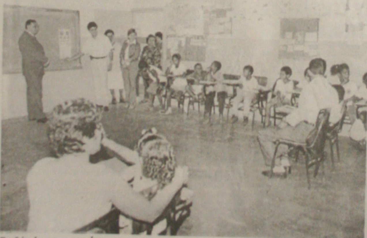
Prefeito lança campanha