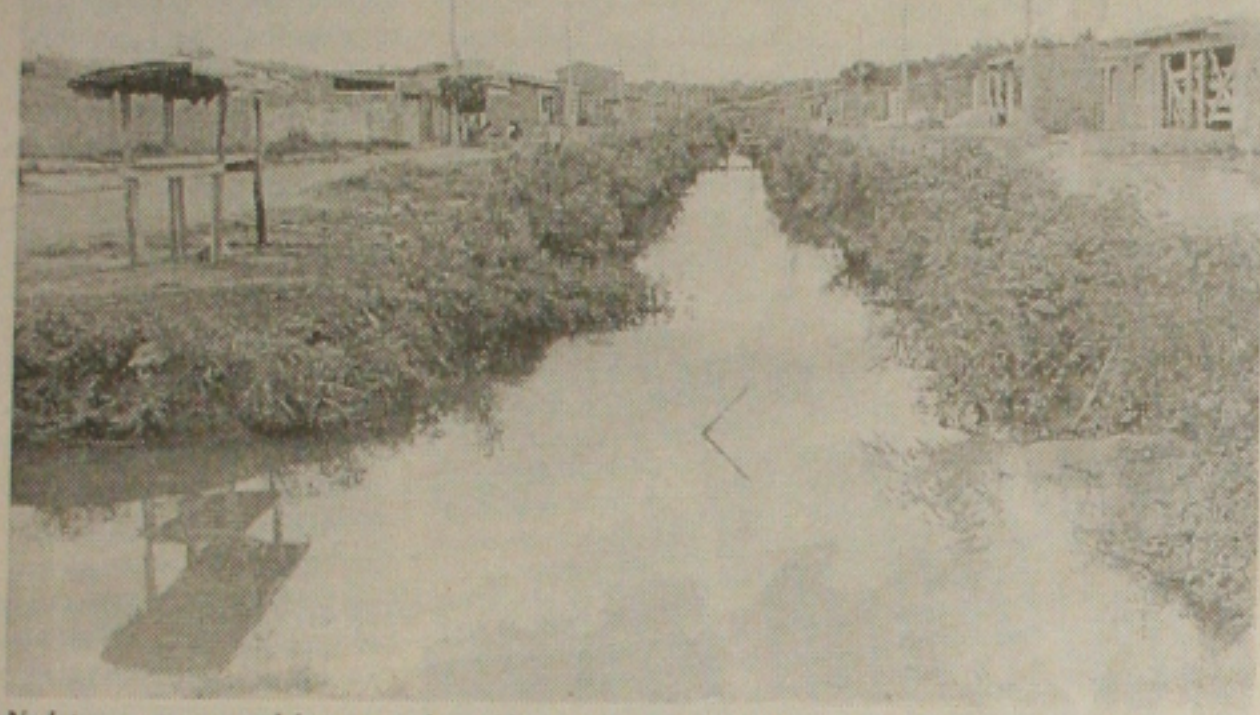
No loteamento, o canal é um poço de problemas para a comunidade, que não sabe mais a quem recorrer