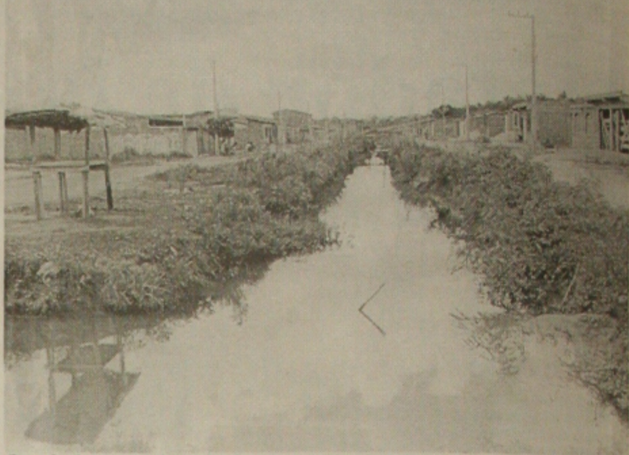
Quando chove o canal transborda, cria um acúmulo de lama e mau cheiro