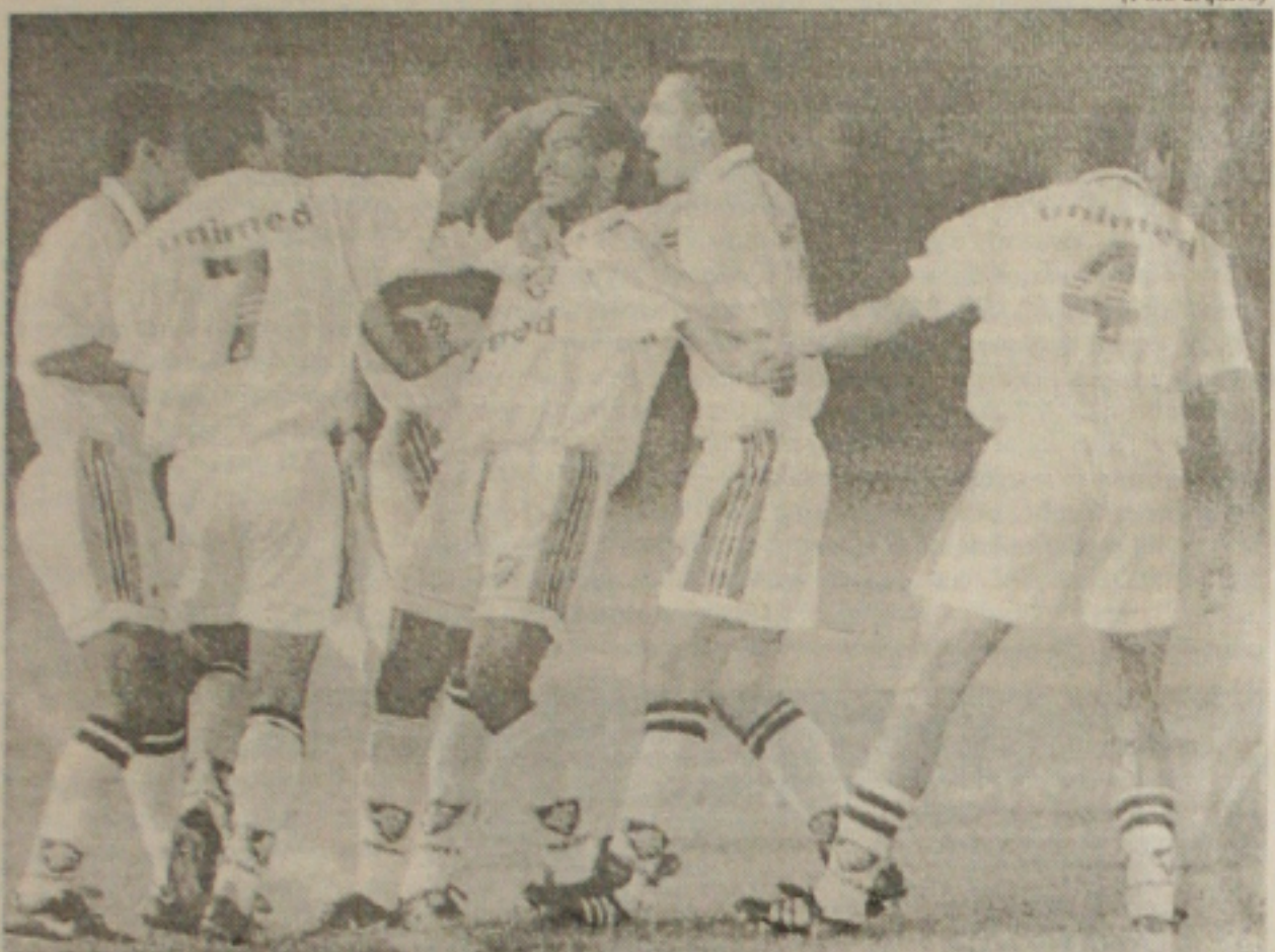
Tricolores vibram com decisão do Tribunal de Justiça da CBF. A Série C continua neste domingo

TJD da FSF dá ganho de causa ao Flu-RJ e ameniza a bagunça que tomou conta da Série C