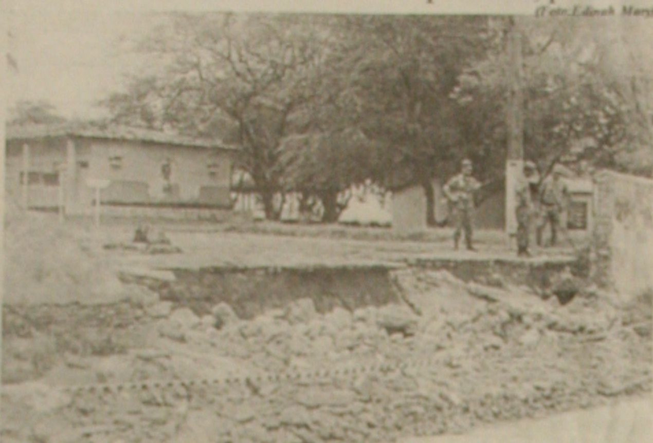
Muro do 28° BC não resistiu às chuvas constantes e caiu

Desabamento não causou danos pessoais, porém foi suficiente para deixar em alerta população vizinha