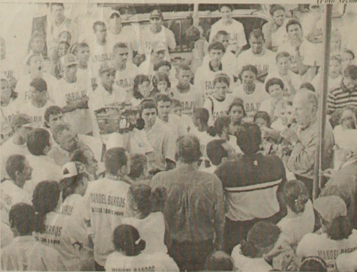
O governador decidiu informar pessoalmente aos manifestantes a posição do governo