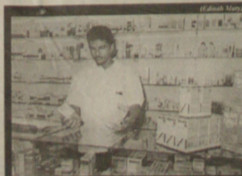
Desde ontem, as farmácias estão sendo fiscalizadas pela Vigilância Sanitária