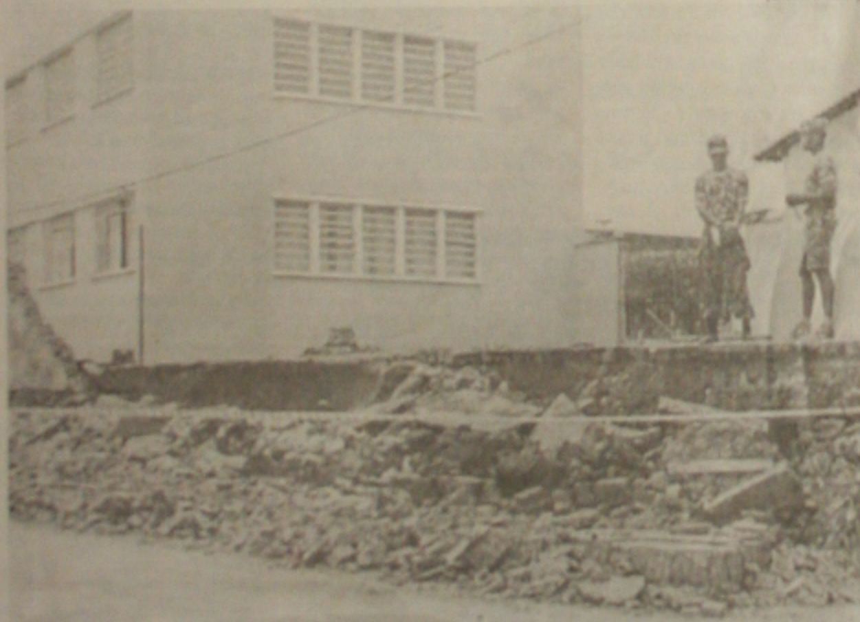
Uma infiltração pode ter comprometido ainda mais o muro do 28º BC, que na terça não resistiu às chuvas e caiu