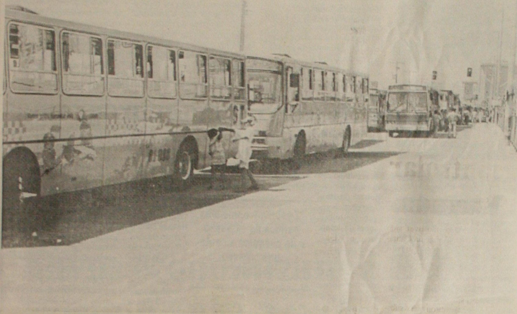
Quadrilha assalta ônibus da Progresso que fazia o percurso Santa Luzia ao centro da cidade