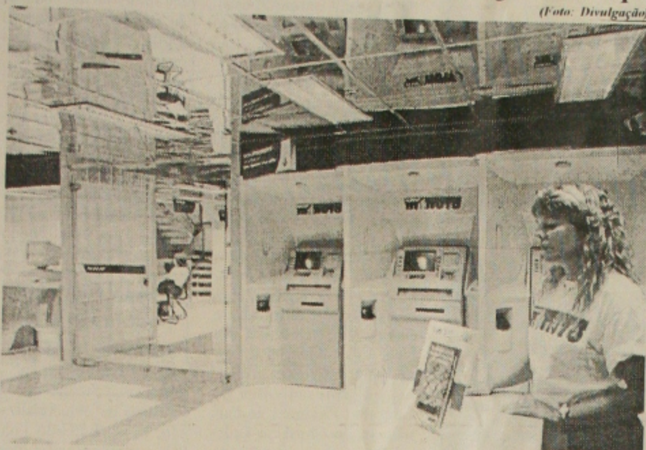
Atendimento do Banese a partir de hoje só poderá ser feito por funcionários do próprio banco