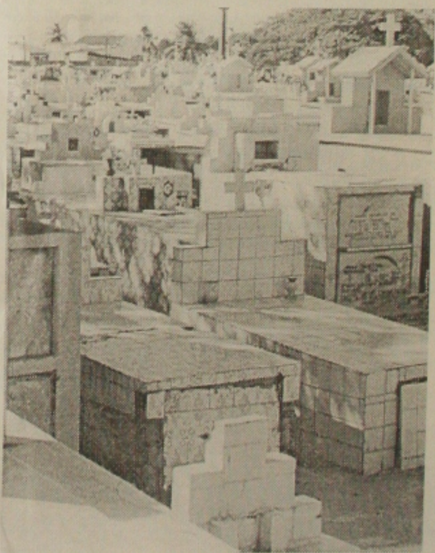
Gangues de rua se enfrentam no Cemitério São João Batista

Assim que a polícia chegou conseguiu efetuar a prisão dos bandidos que foram conduzidos a 12ª Delegacia. Os objetos roubados foram devolvidos a seus donos, apesar de ter havido reclamações de outras pessoas que outros marginais estavam agindo no local. A gangue conseguiu fugir e apesar do cerco da polícia na área, ninguém foi preso. Segundo moradores das redondezas, é normal ocorrerem assaltos e tiroteios na região, que está infestada de bandidos. Eles reclamaram que o policiamento na área hoje é inexistente. As pessoas atingidas foram socorridas e alguns policiais permaneceram no local até o fechamento.