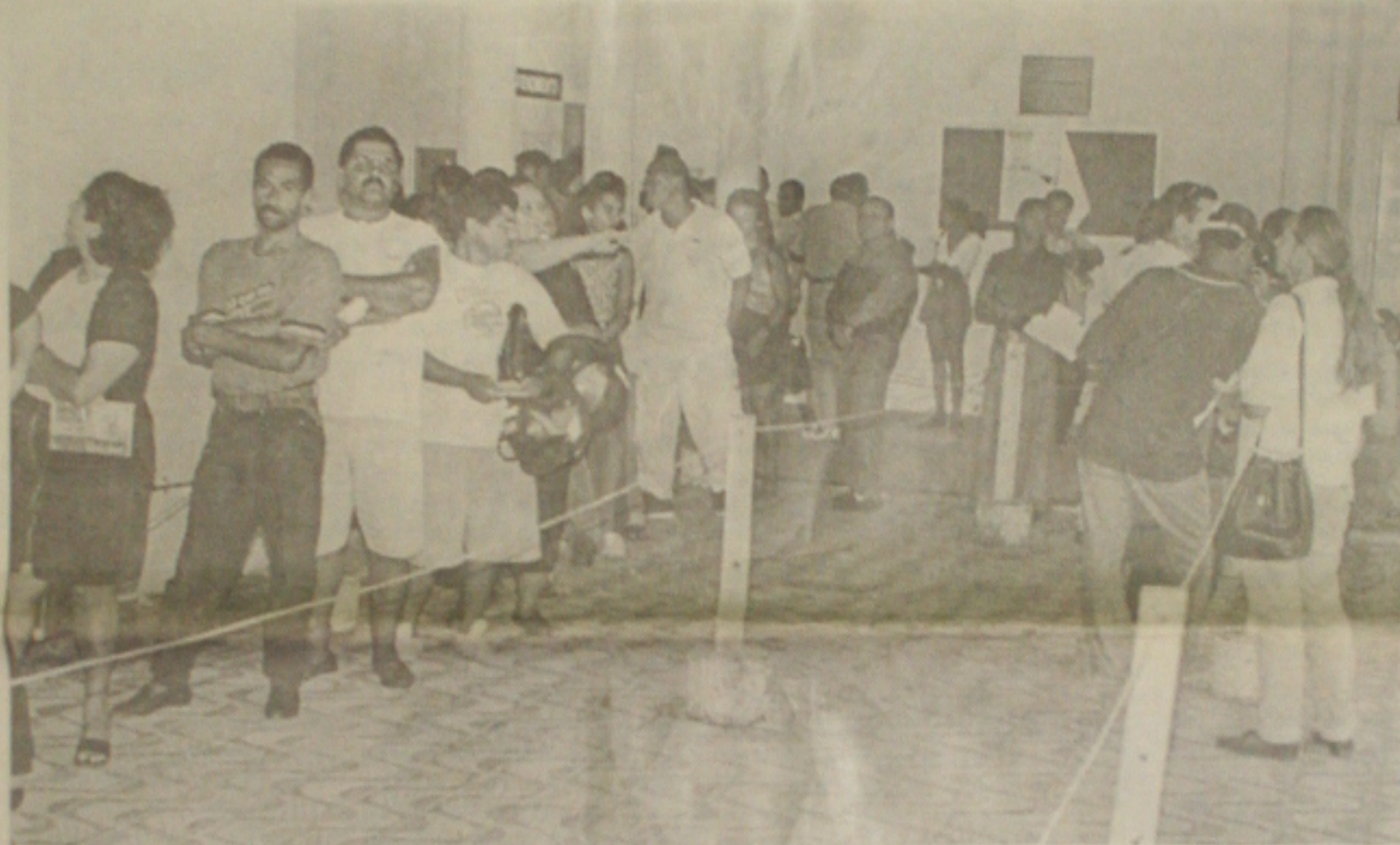
Apesar das filas, poucos eleitores atenderam ao chamado do TRE para o recadastramento dos títulos, cujo prazo foi encerrado ontem. (Página 3A)

A interrupção de várias obras no Estado e o não pagamento pela execução de tantas outras vêm provocando uma das piores crises na construção civil de Sergipe. Nos últimos seis meses, muitas pequenas empreiteiras ficaram completamente descapitalizadas porque não recebem pelos serviços prestados ao governo, sendo obrigadas a efetivar demissões em massa, segundo denúncia do líder do PDT na Assembleia Legislativa, deputado estadual Luiz Garibaldi Mendonça. (Página 7A)