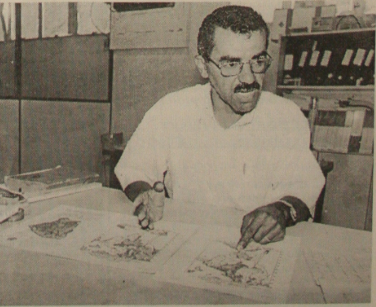
Inajá, mostra mapa que aponta outras frentes frias para o Nordeste