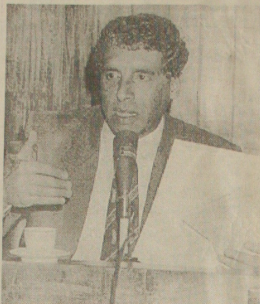
CCJ aprova substitutivo do senador José Fogaça