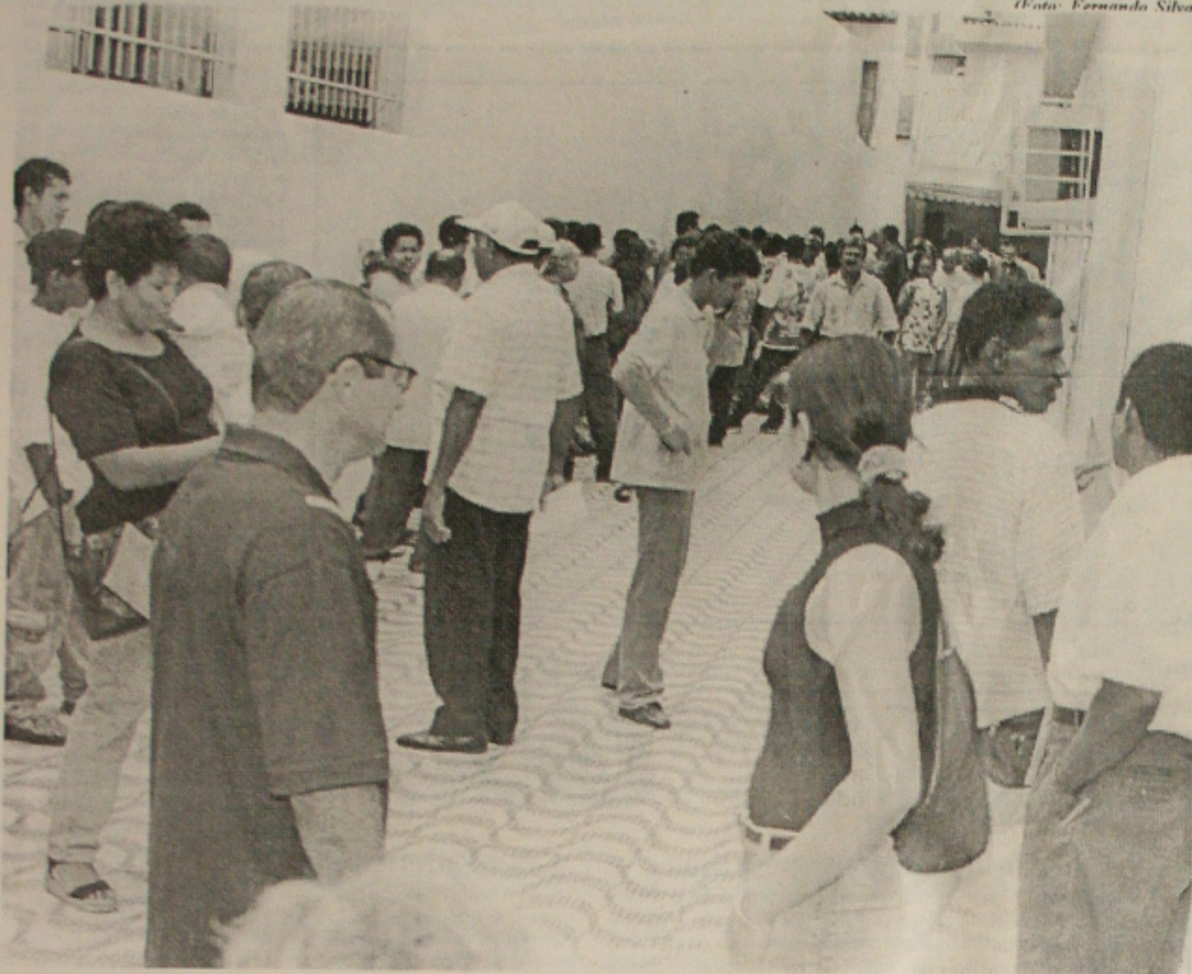
Eleitores fazem filas nos cartórios no último dia da depuração, mas apenas 12% foram regularizar o cadastro