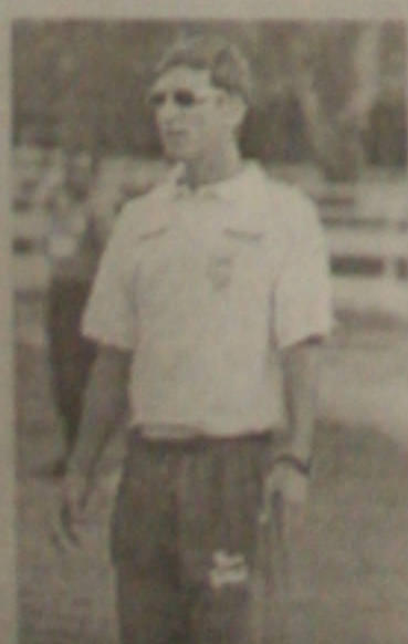
Cruz gostou da definição do adversário

O Ministério Público de Sergipe determinou, através de termo de compromisso assinado ontem, a suspensão do contrato pelo qual a Projel viajava executando alguns serviços nas agências do Banes e Detran. Com isso, os serviços de autenticação de documentos e recebimento de valores do Detran e da SMTT (Superintendência Municipal de Transporte e Trânsito) voltam a ser executados pelos próprios funcionários do banco. (Página 5A)