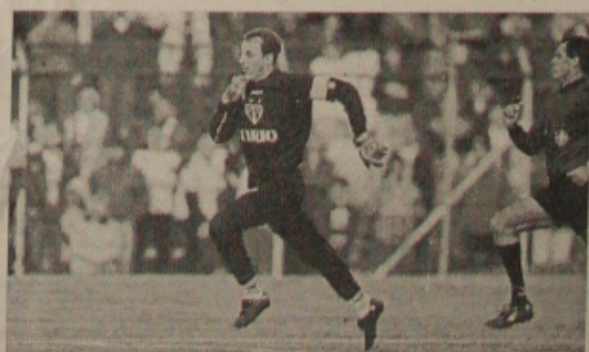
Rogério Ceni, capitão da equipe, fez a diferença na partida