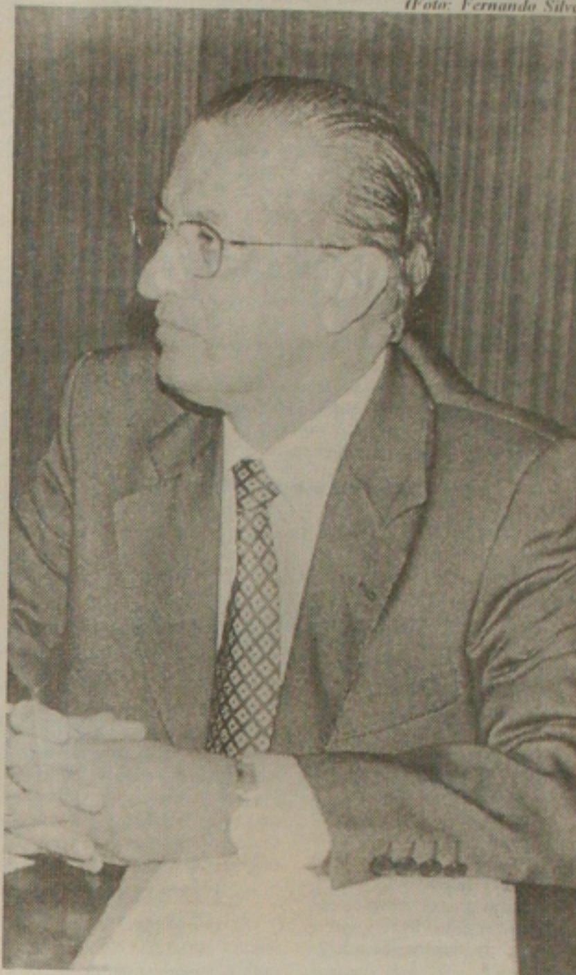
Valadares: PSB/PFL querem acabar com feudo do PMDB

Valadares enfatiza que ainda está avaliando se será ou não candidato a prefeito de Aracaju, cuja candidatura está sendo cobrada pelos socialistas para fortalecer a legenda do partido para a eleição de vereador. "Encomendarei uma pesquisa para saber da aceitação do povo à minha candidatura. Se ela for favorável poderei ser candidato em 2000", finaliza.