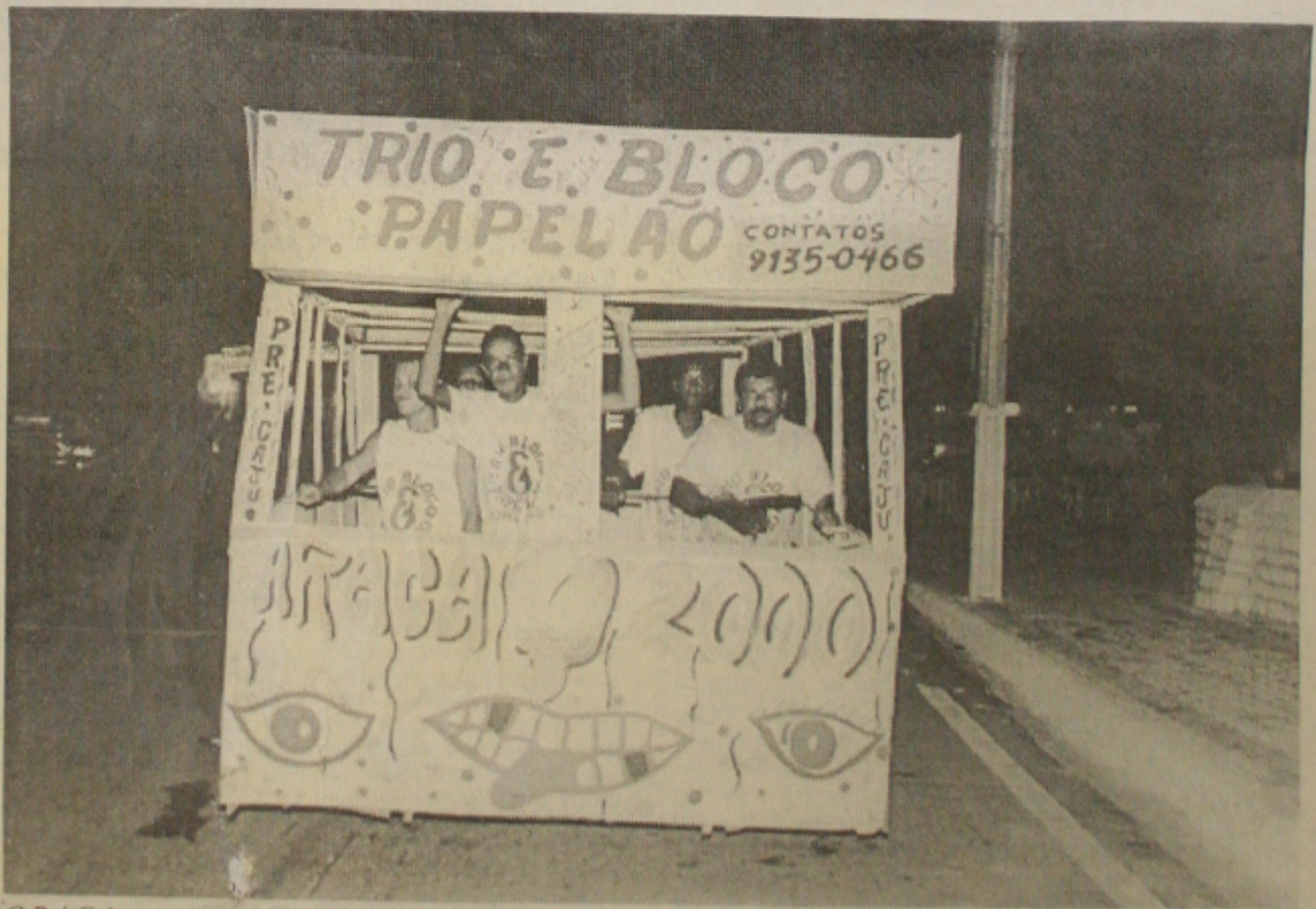
O Pré-Caju permite também atrações curiosas, como o trio e bloco Papelão, que está desfilando todas as noites