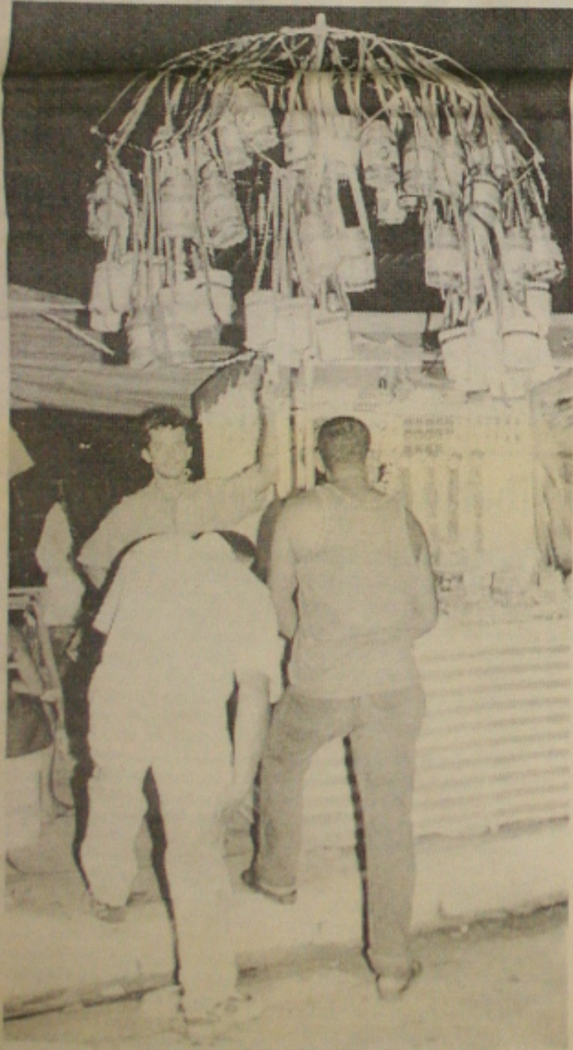
Vendedor usa a criatividade para vender isopor para lata de cerveja