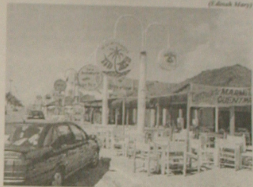
Pelo projeto, a pista de acesso à Sarney será duplicada