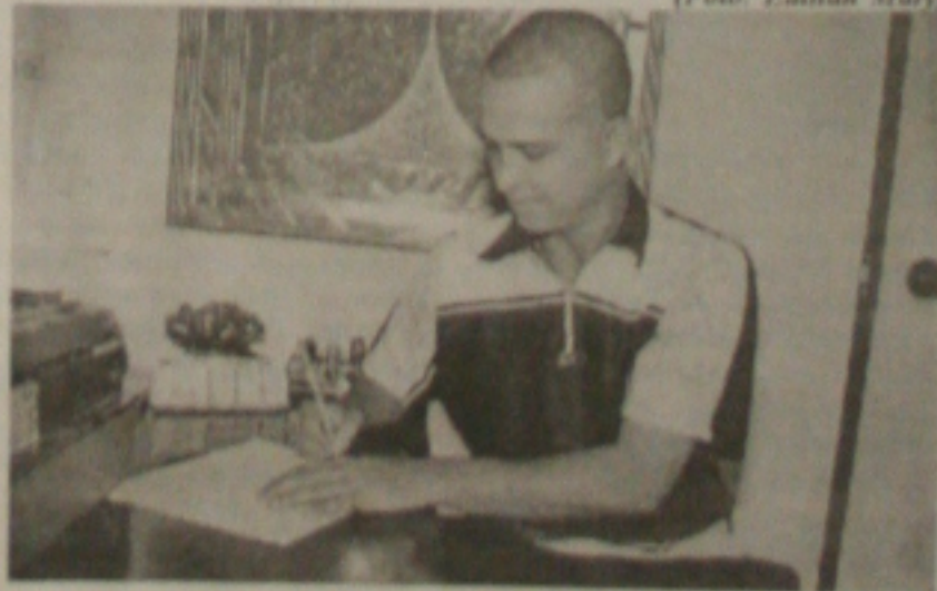
Ramiro diz que a documentação já está na CBF. Na próxima semana ele deve ser liberado

As ações da Lazio na Bolsa de Valores de Milão cresceram nesta quinta-feira com a notícia de uma possível transferência de Rivaldo (foto) para o clube de Roma. Apesar dos desmentidos, as ações da Lazio cresceram com a notícia publicada na manhã desta quinta-feira pelo diário "La Gazzetta dello Sport" registram um aumento médio de 3,01% no seu valor. Na quarta-feira, as ações do clube tiveram uma queda de 4,35%, após a eliminação na Copa dos Campeões da Europa.