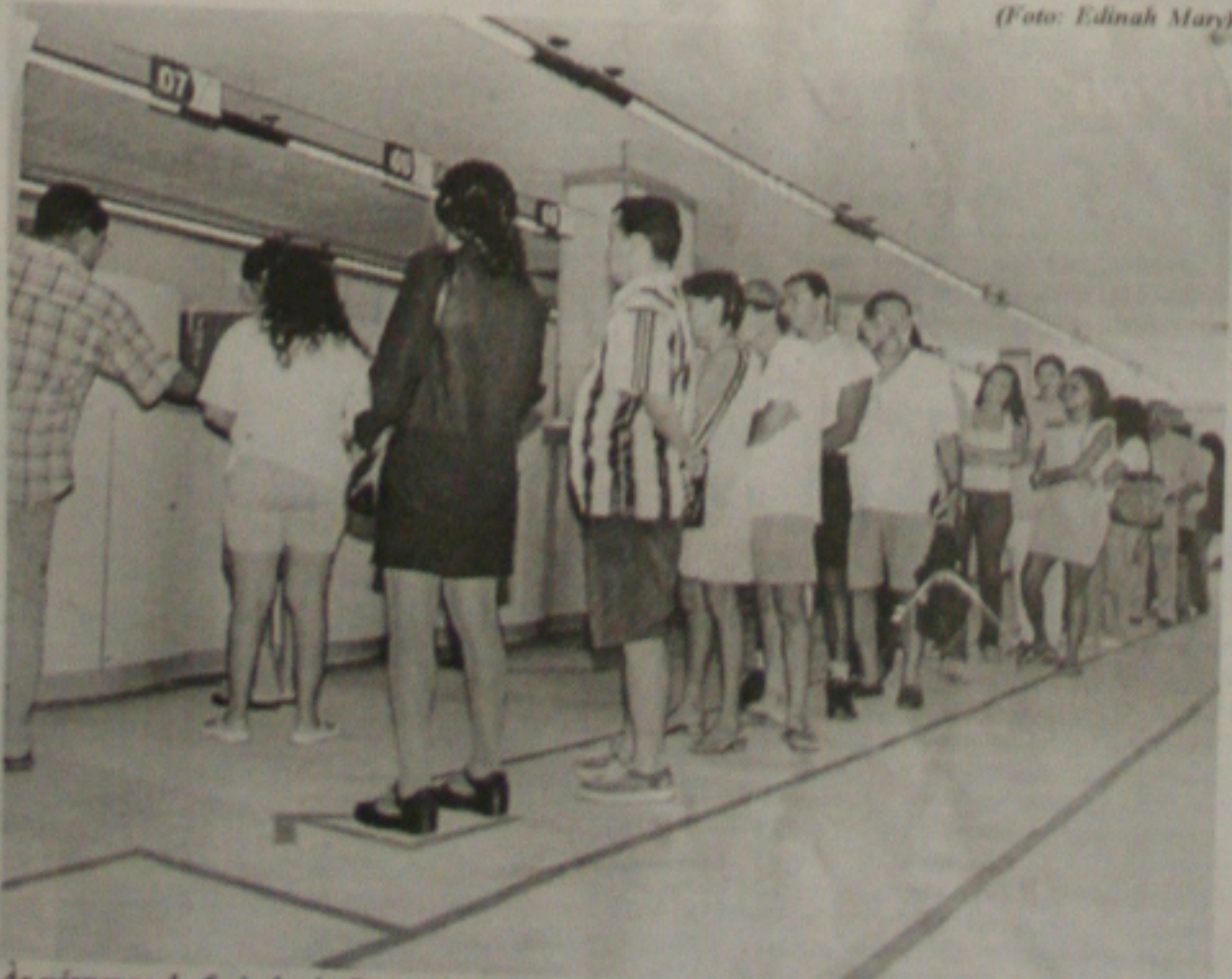
As vésperas do feriado da Sexta-feira Santa, as agências bancárias têm pouco movimento