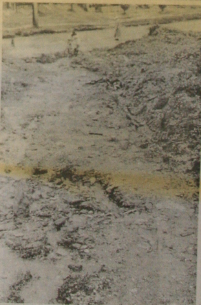
Na Rua 16, um deslizamento de terra a deixou totalmente intransitável