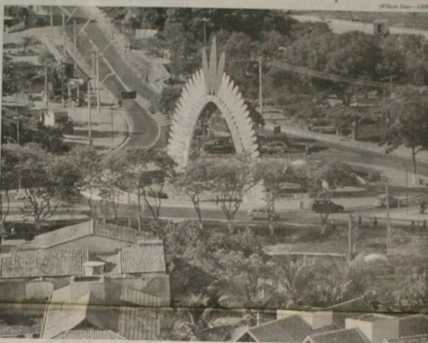
Em Porto Seguro, o clima ontem era tranquilo, apesar da decisão do MST de realizar os protestos sábado

no HPM. Até o final da tarde de ontem a Delegacia Especial de Homicídios (DEHOC) não havia sido informada oficialmente sobre o homicídio. Mas segundo familiares da vítima, o soldado, que estava lotado no Batalhão da PM em Itabaiana, na região Agreste do Estado, bebia no bar com o colega, quando o assassino chegou ao local num Voyage branco e iniciou os disparos, sem que o militar pudesse esboçar qualquer reação. (Página 5A)