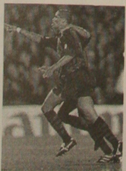
Rivaldo pretendido pelo Lazio