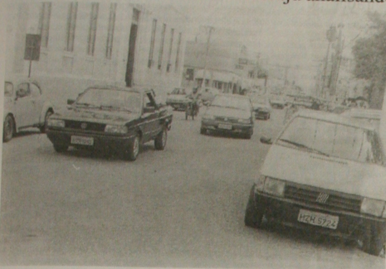
Técnicos de São Paulo estão em Aracaju realizando um estudo para acabar com os engarrafamentos no centro da cidade

Técnicos paulistas estão em Aracaju analisando o tráfego para melhorar o escoamento dos carros