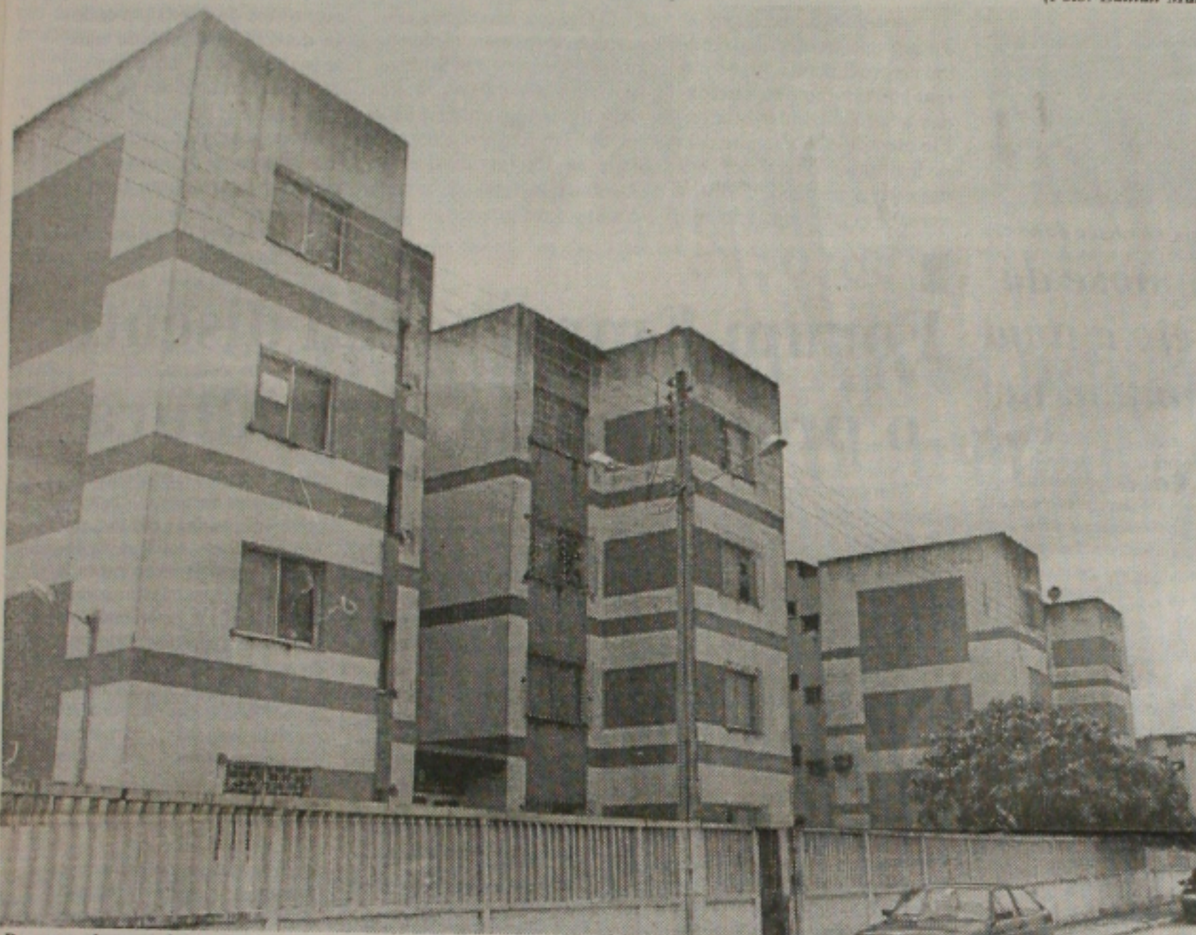
Dezenas de mutuários da Caixa Econômica Federal moveram ações contestando os valores das prestações dos imóveis

Cerca de 215 ações continuam tramitando na Justiça através da ANM (Associação Nacional dos Mutuários) em sua seccional em Sergipe. Segundo informações dos advogados da entidade, todos os processos que encontram-se em andamento, fazem parte do grupo de mutuários da Caixa Econômica Federal que ficaram inadimplentes, muitas vezes por conta dos altos valores que vêm sendo cobrados pela instituição bancária, um dos principais motivos alegados pela clientela atualmente.