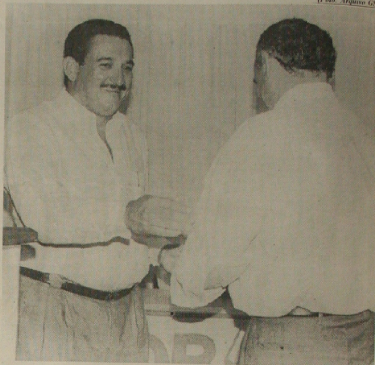
Walker diz que empresários sergipanos contribuem com desenvolvimento

Ele está apostando que comerciantes e patrões irão conduzir o processo de negociação salarial e outros benefícios dentro da democracia, com cada um mostrando o que quer receber e o que pode pagar, diante da realidade econômica do País, mas sem perder o otimismo de tempo melhor. (Cláudio Messias)