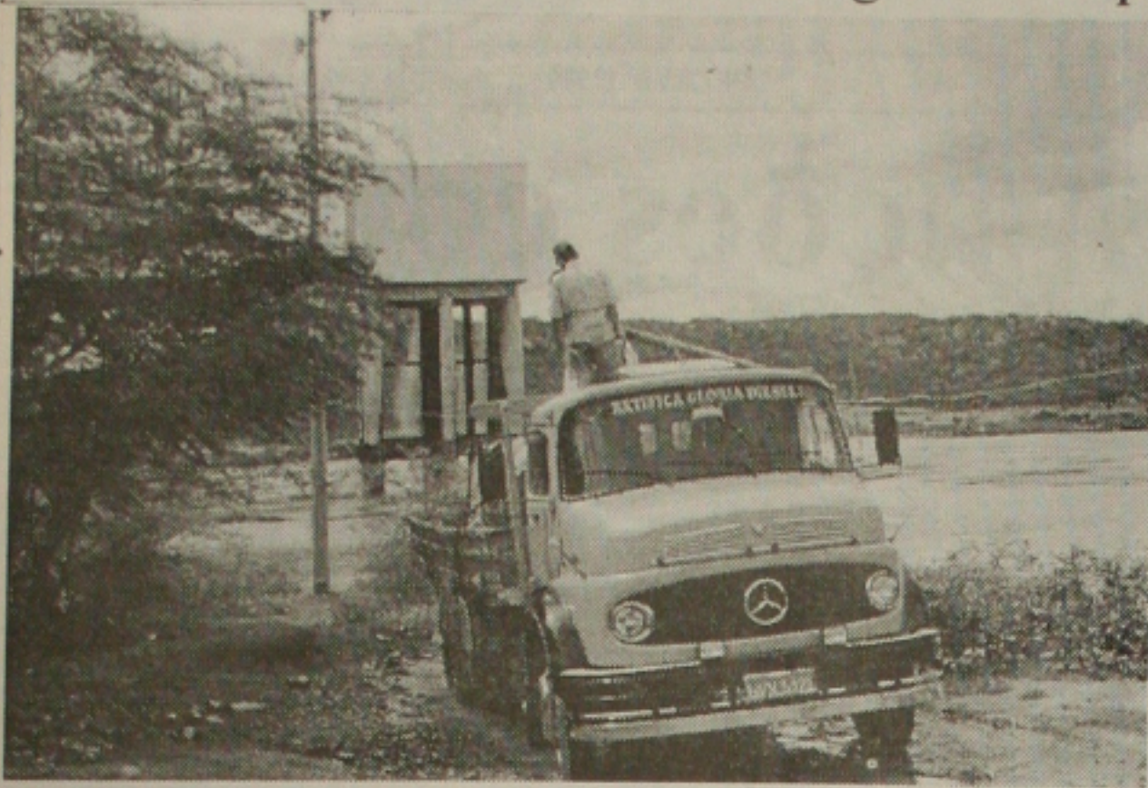
Convênio entre Exército e Sudene está garantindo o abastecimento de água na região do sertão

Federação dos Trabalhadores na Agricultura quer a continuidade das ações do Exército e Sudene