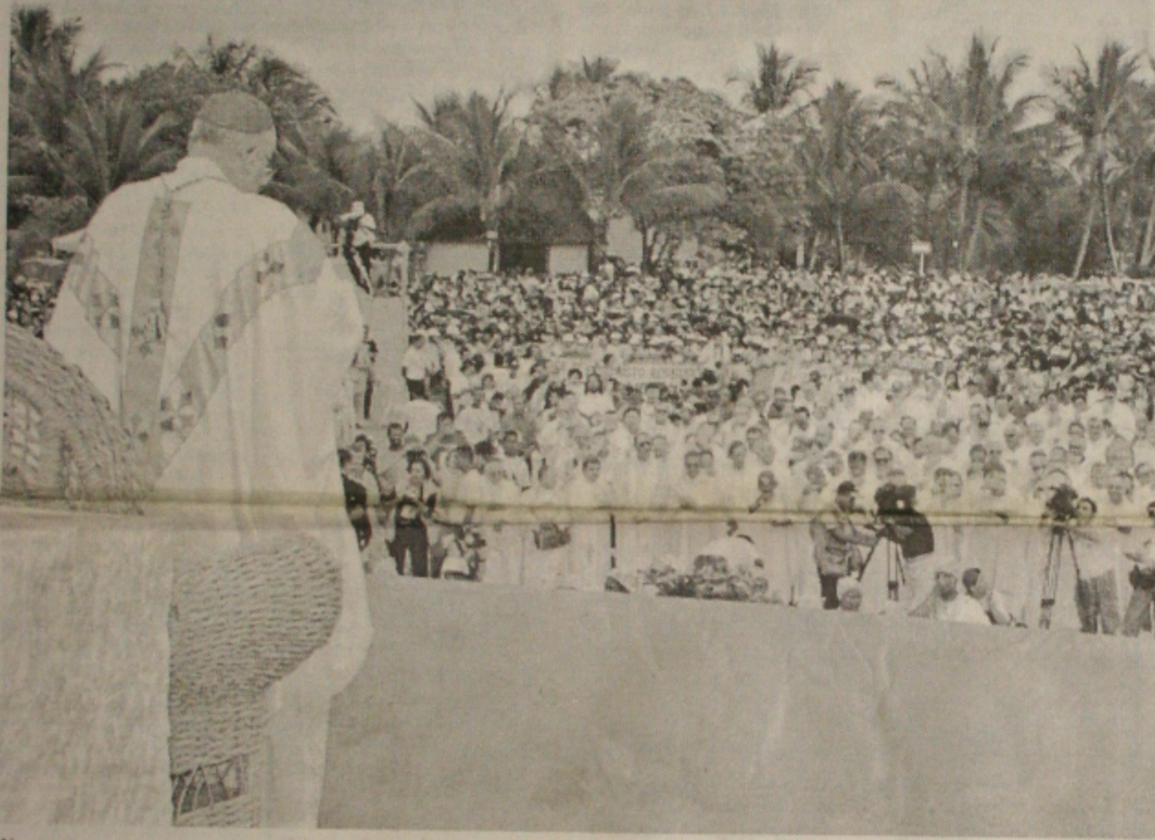
Num protesto inesperado, um jovem índio pataxó roubou a cena na missa que marcou os 500 anos de civilização cristã no Brasil

R$ 4.317,00 mensais. Ontem o governador encaminhado seis projetos à Assembleia Legislativa, que foram votados e aprovados nas comissões técnicas antes mesmo da distribuição de cópias aos deputados. Um dos projetos estabelece o teto salarial de R$ 11.475,00 para desembargadores, procuradores de justiça e conselheiros do Tribunal de Contas. Os projetos serão votados ainda hoje pelos deputados. (Página 3-A)