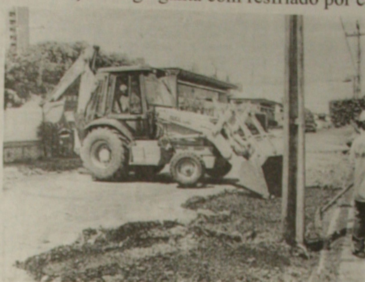
A Prefeitura de Aracaju realiza obras de melhoramento no Loteamento Garcia, na zona sul