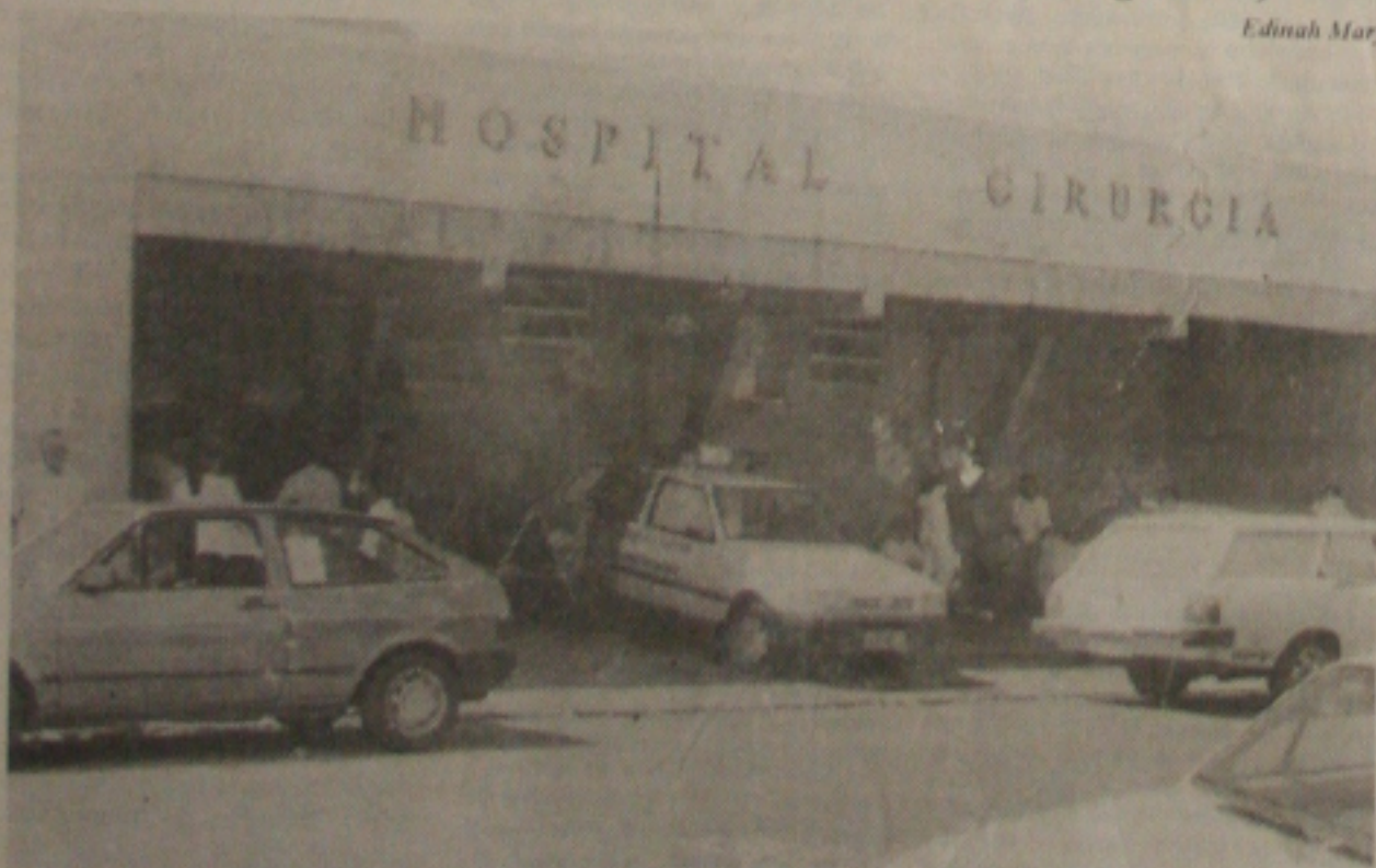
O pronto-socorro do Cirurgia volta a ter seu funcionamento ameaçado