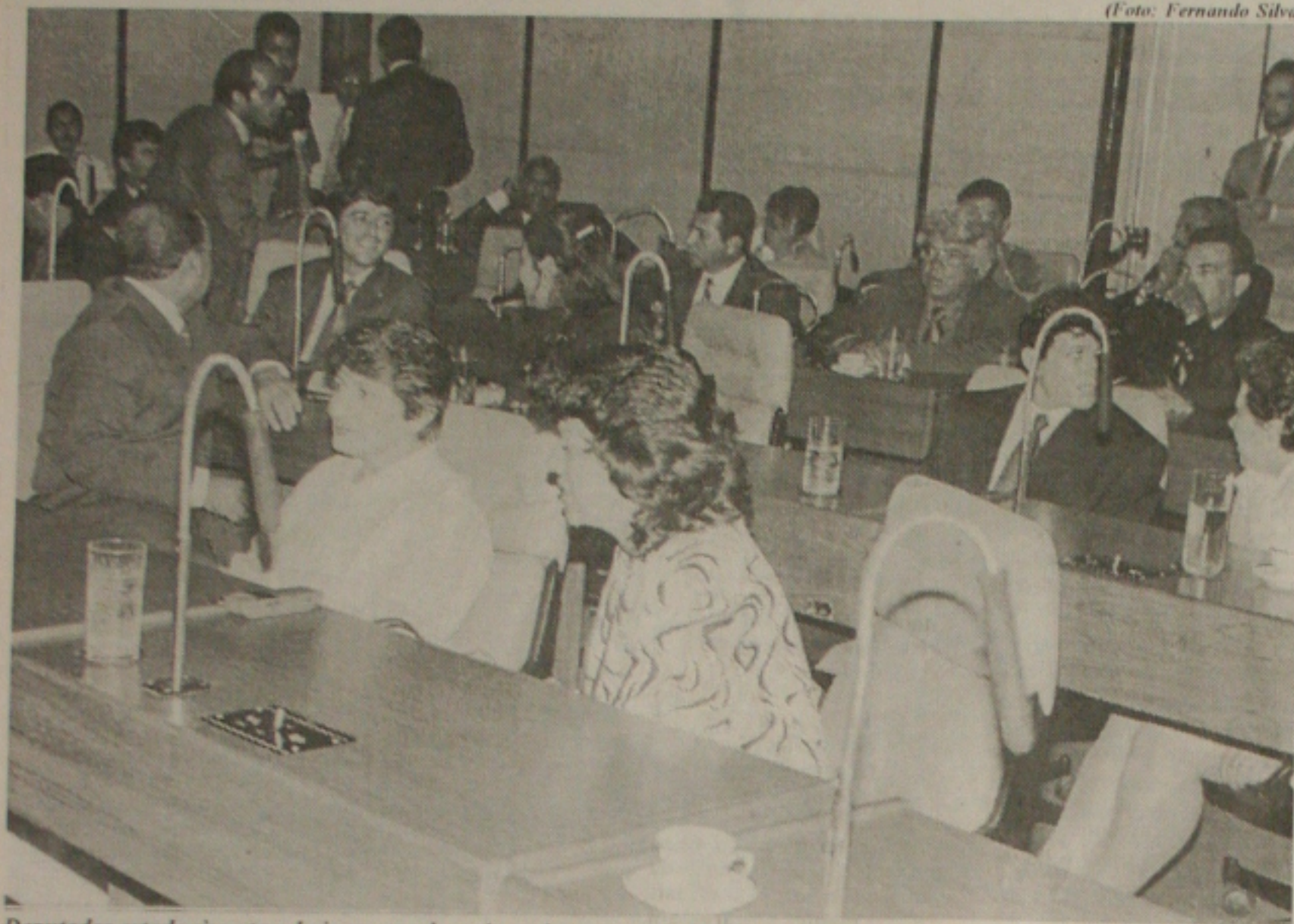
Deputados estaduais votam hoje quatro dos seis projetos encaminhados ontem pelo governo do Estado à Casa