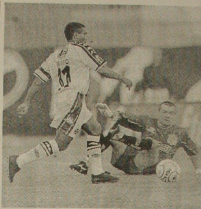
Romário pode ser lembrado na próxima