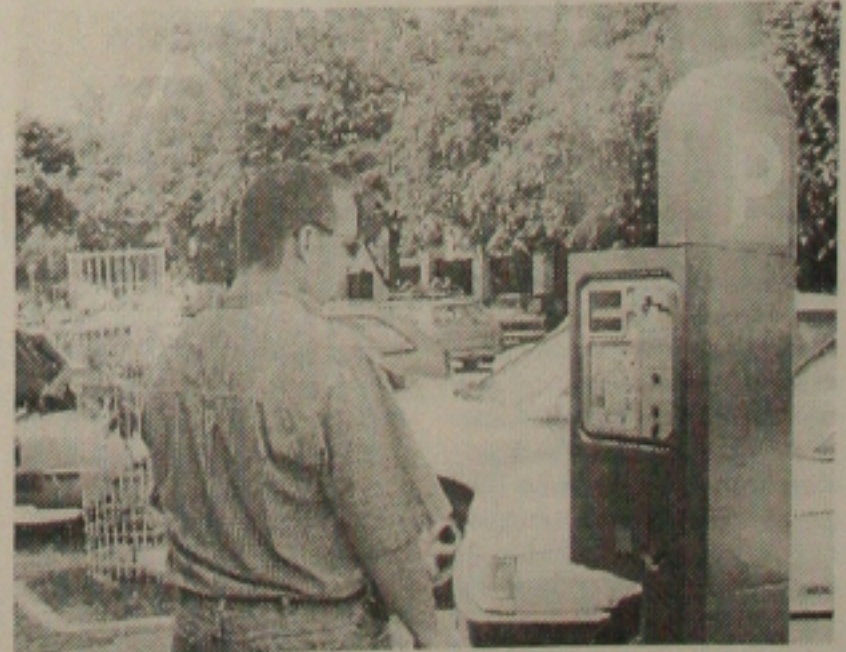
Estacionamento rotativo funciona na terça-feira

Conforme Sérgio Melo, superintendente da SMTT, essa área de estacionamento contemplará um total de 600 vagas, devendo aumentar à medida que as ruas adjacentes do centro forem sinalizadas, reservando os espaços necessários ao estacionamento rotativo.