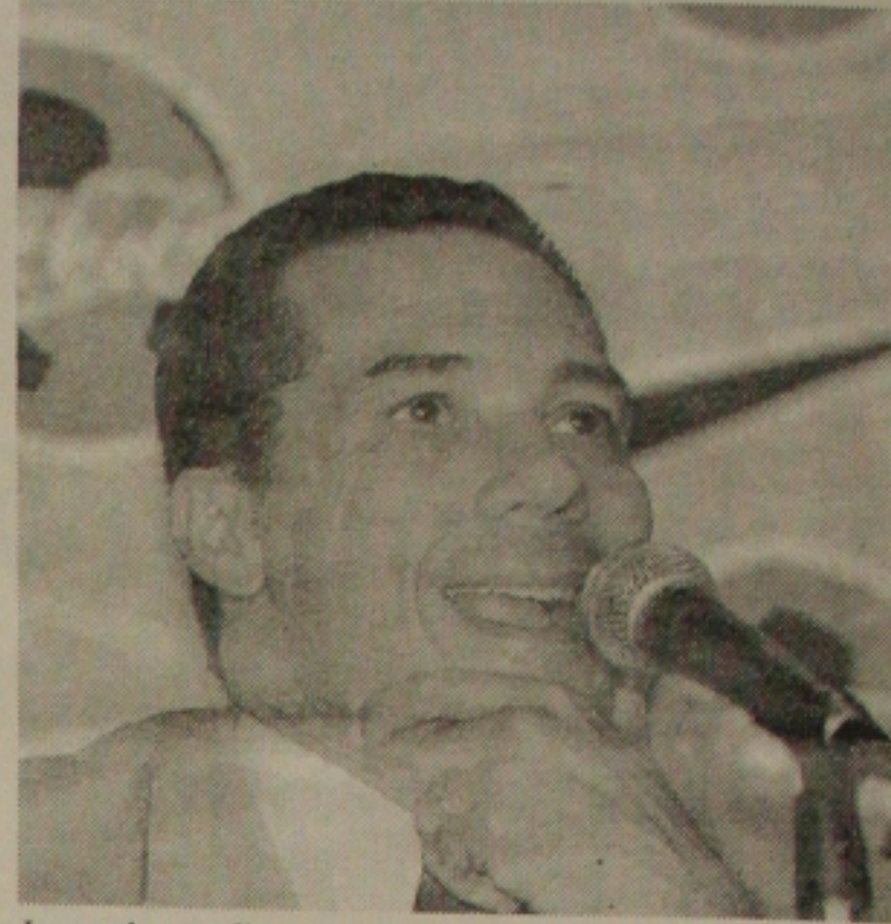
Luxemburgo disse que Romário está na lista