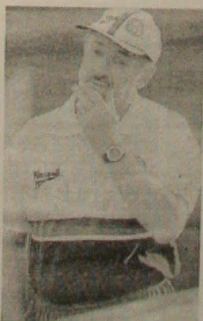
Scolari está preocupado

esquecer, por enquanto, o time de Wanderley Luxemburgo para pensar exclusivamente na Ponte Preta. "Será um adversário muito perigoso", declarou Vampeta. Oswaldo pressionado pela Federação Paulista de Futebol (FPF), vai escalar, em Campinas, o time titular.