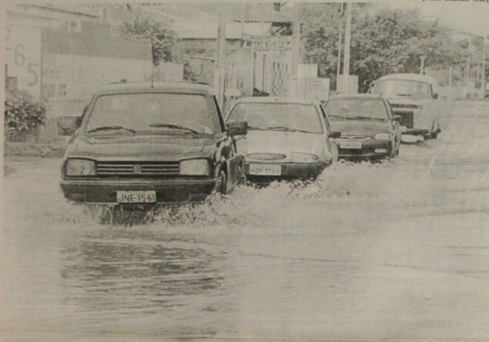
O temporal que caiu durante a madrugada de ontem foi o suficiente para deixar várias ruas alagadas na Coroa do Meio