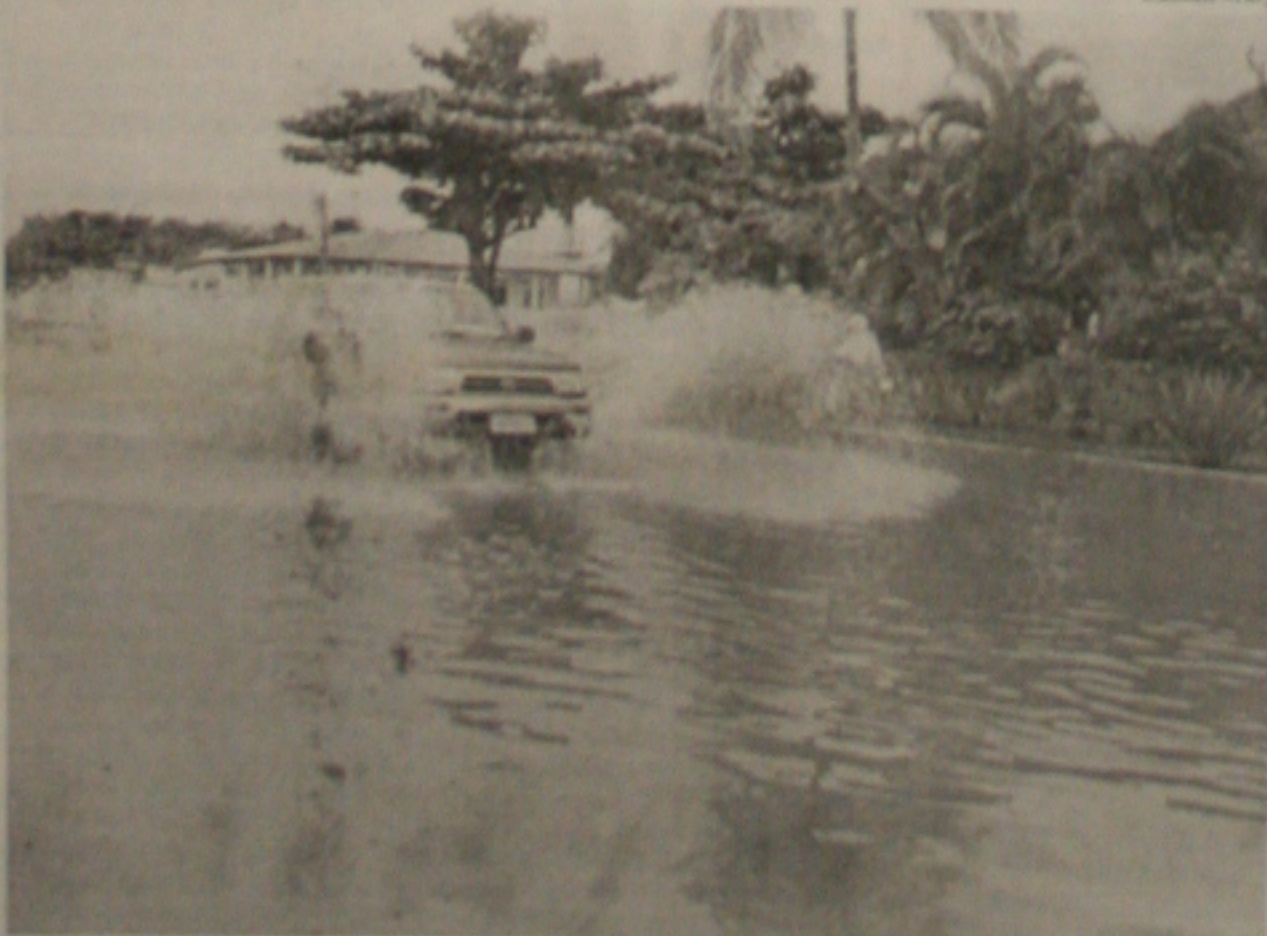
Na Coroa do Meio nem mesmo a avenida principal - a Mário Jorge Vieira - escapou da inundação

As chuvas que caíram nos últimos dias em Aracaju alagaram completamente as ruas da Coroa do Meio, o bairro possui o maior número de ruas sem pavimentação e drenagem. Até a Mário Jorge Vieira, a principal via de escoamento do trânsito, está alagada. (Página 1-B)