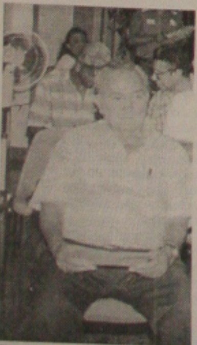
Resende espera soluções

Segundo as informações vindas de Itabaiana, os atletas estão com salários atrasados desde janeiro. Somente os jogadores da Catuense que levaram o time de volta a Primeira Divisão, receberam e tiveram os seus contratos rescindidos, retornando a origem. Os outros passam necessidades, inclusive no que se refere ao fator alimentação.