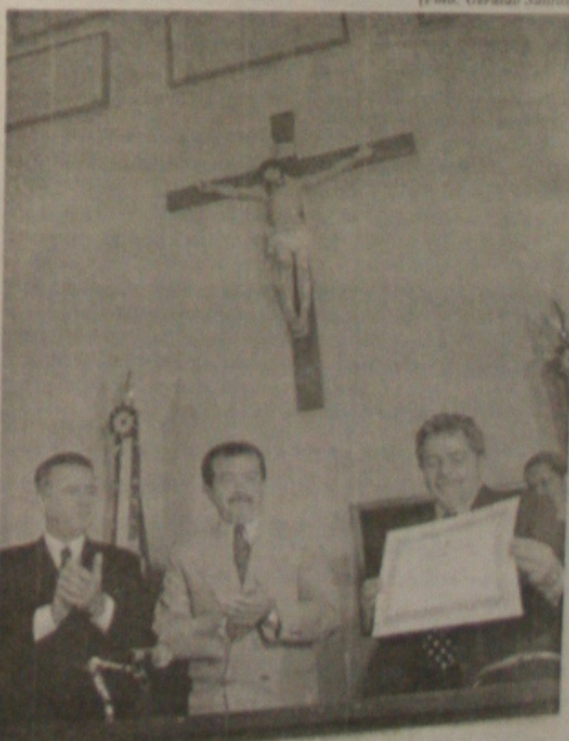
Ao lado do presidente da Assembleia, Reinaldo Moura (C), Lula expõe o título de Cidadania que lhe foi concedido ontem.

O pão deve ficar mais caro nos próximos dias em Sergipe. A indústria da panificação deverá repassar o aumento no preço do trigo, que na maior parte vem sendo importado da Argentina, Canadá e Estados Unidos. Atualmente, a saca de 50 quilos está sendo adquirida pelos moínhos por R$ 34,00, mas deve passar para R$ 36 ou R$ 37 nos próximos dias. (Página 4A)