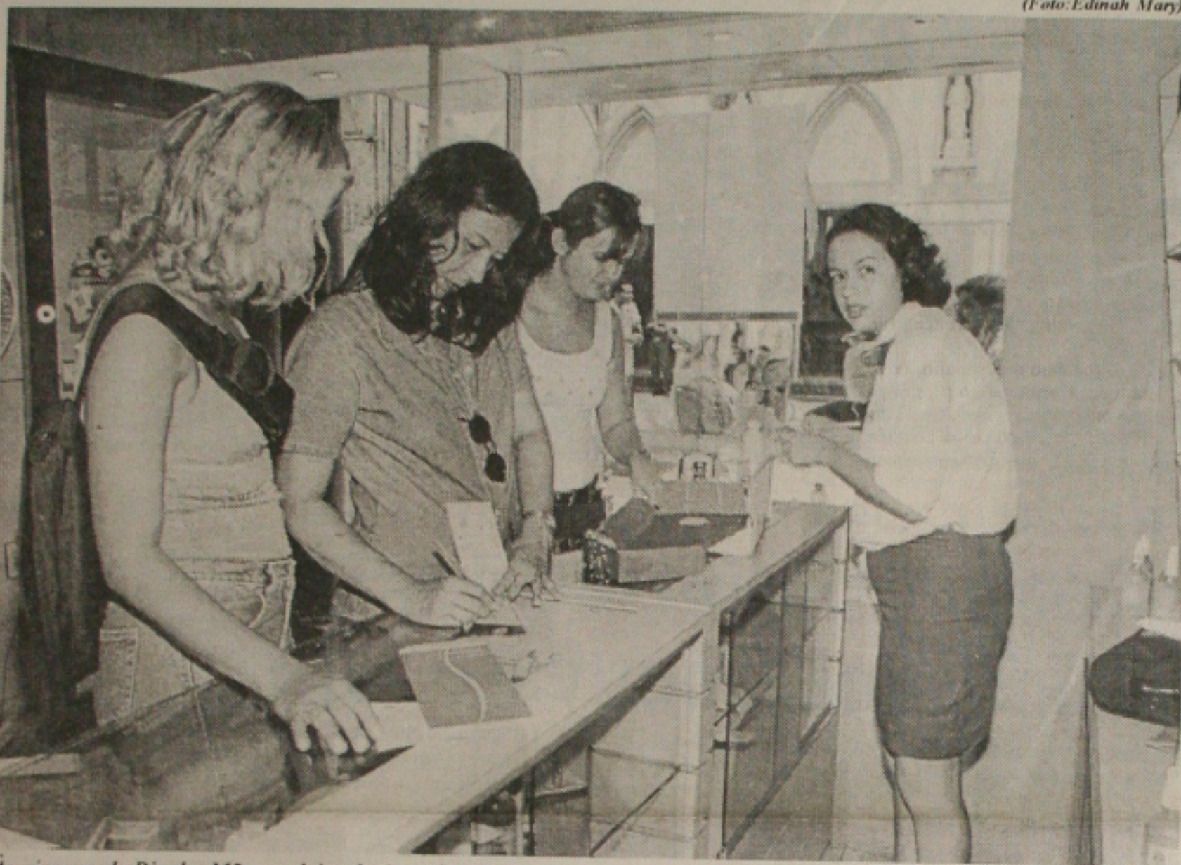
Às vésperas do Dia das Mães, as lojas de Aracaju registram o corre-corre para a compra de presentes