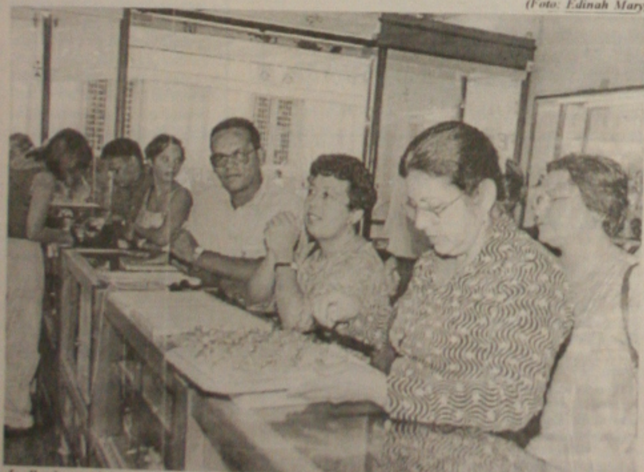
Joualherias e relojarias receberam ontem um número maior de clientes por causa do Dia das Mães.