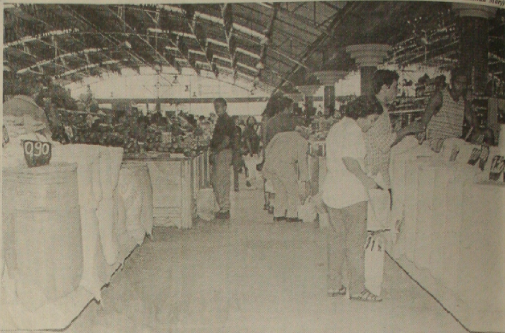
Os feirantes do Mercado Albano Franco são acusados pelo Zoonoses de não ajudar no combate aos roedores

"Uma empresa especializada que assuma as responsabilidades técnicas"