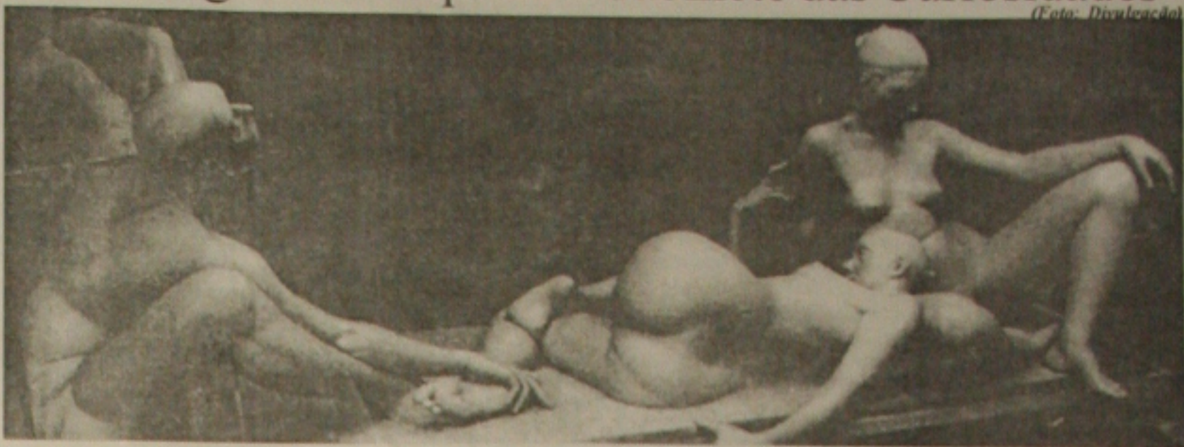
Obra do escultor Israel Kislansky, que estará hoje, em Aracaju

SERVIÇOS — O "Gabinete de Curiosidades" funciona na rua Riachão, 494, no bairro Getúlio Vargas. O curso de Modelagem do Corpo Humano acontece somente hoje, com duração de seis horas. A inscrição custa R$ 50 (incluindo material) e poderá ser feita na hora. O curso será realizado das 9h às 12h e das 14h30 às 17h30. Maiores informações pelo telefone: 211-2935. (Luciana Chaves)