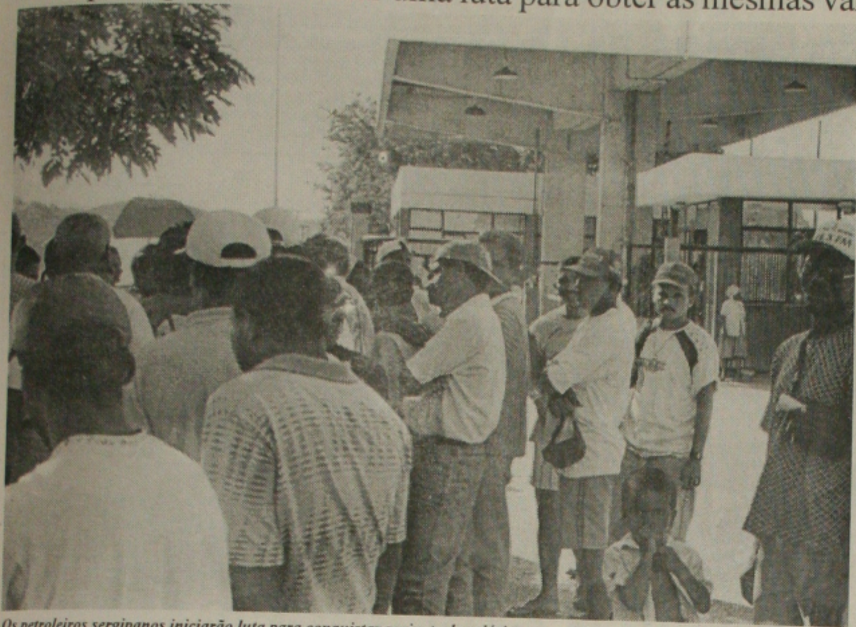
Os petroleiros sergipanos iniciarão luta para conquistar reajuste de salários concedido a diretores da estatal

Sindipetro pretende iniciar uma luta para obter as mesmas vantagens da diretoria da empresa