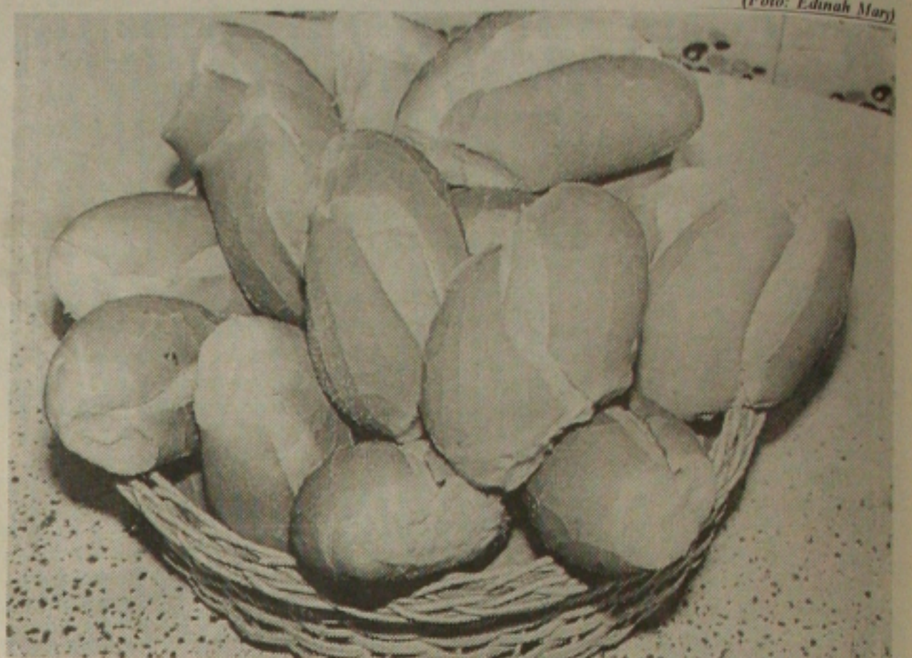
Repertir o pão com a família vai custar mais ao trabalhador

Tradicional na mesa do brasileiro, o pão vai ficar mais caro para o consumidor sergipano, por conta do aumento do trigo, que é importado da Argentina, Canadá e Estados Unidos. O Brasil já produziu 80% do trigo consumido e hoje importa 80%, invertendo o quadro, com graves prejuízos para a balança comercial e, principalmente o trabalhador de baixa renda, maior consumidor de pão. Atualmente, a saca de 50 quilos está sendo comercializada pelos moinhos por R$ 34,00, mas poderá passar, nos próximos dias para R$ 36,00, R$ 37,00, ou mais, o que assusta os empresários do setor de panificação, porque terão que repassar o aumento para o consumidor.