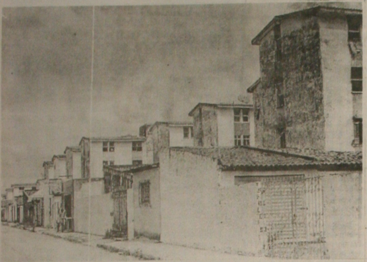
No Augusto Franco, as garagens que impedem o livre acesso dos pedestres podem ser demolidas

TEMPO Nublado a parcialmente nublado com possibilidade de chuva em áreas isoladas. Ventos fracos, temperatura estável. No litoral, máxima de 29°C e mínima de 19°C. Nas demais regiões, máxima de 31°C e mínima de 19°C. Fonte: INMET