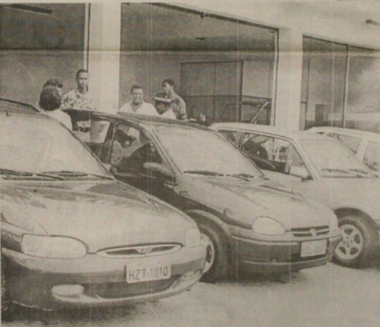
O mercado de carros usados apresenta sinais de recuperação, com vendas em alta na capital. (Página 1B)