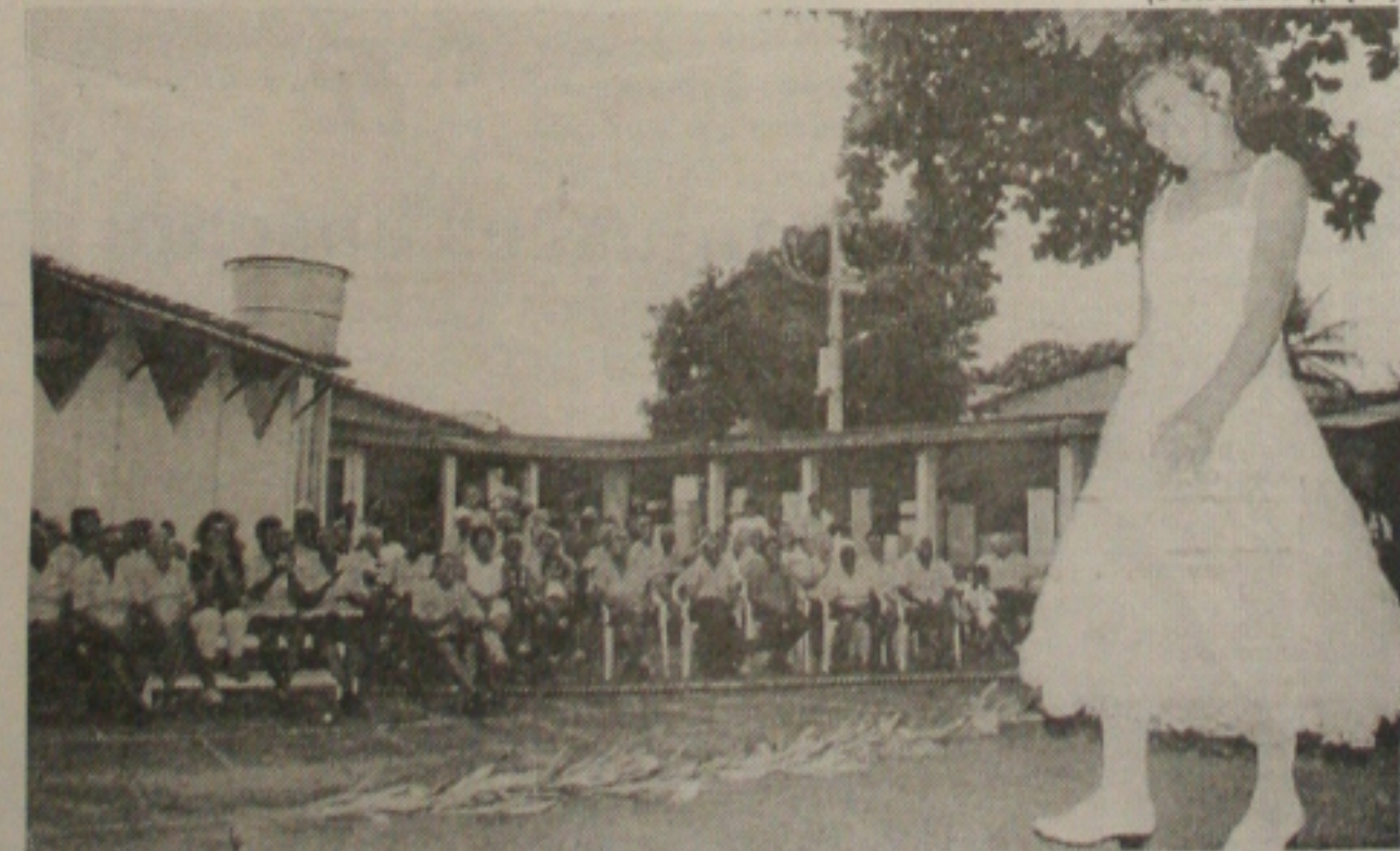
Desfiles fazem parte das comemorações do grupo do idoso que recebeu o apoio da prefeitura