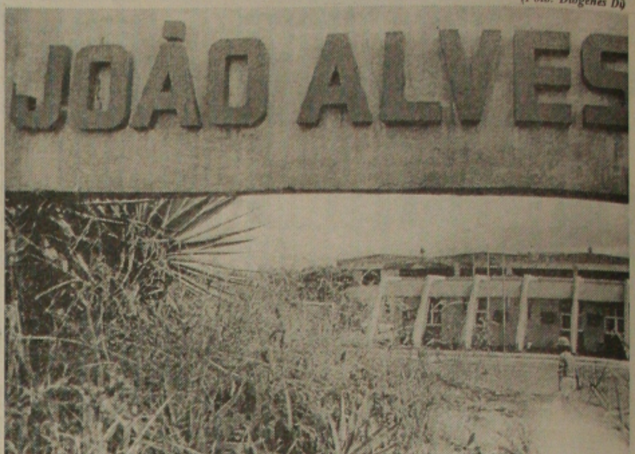
Ministério da Saúde reconhece o Hospital João Alves como referência no tratamento da Aids