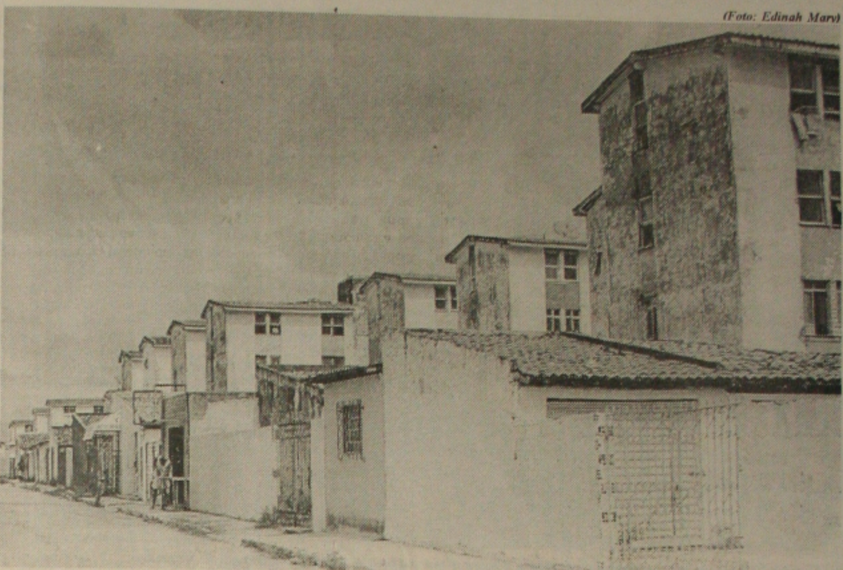
A construção irregular de garagens nos edifícios do Conjunto Augusto Franco termina no Ministério Público

O canal de negociação continua aberto. Ontem a tarde, a comissão da Assembléia Legislativa esteve reunida para intermediar as negociações entre governo e sindicato.