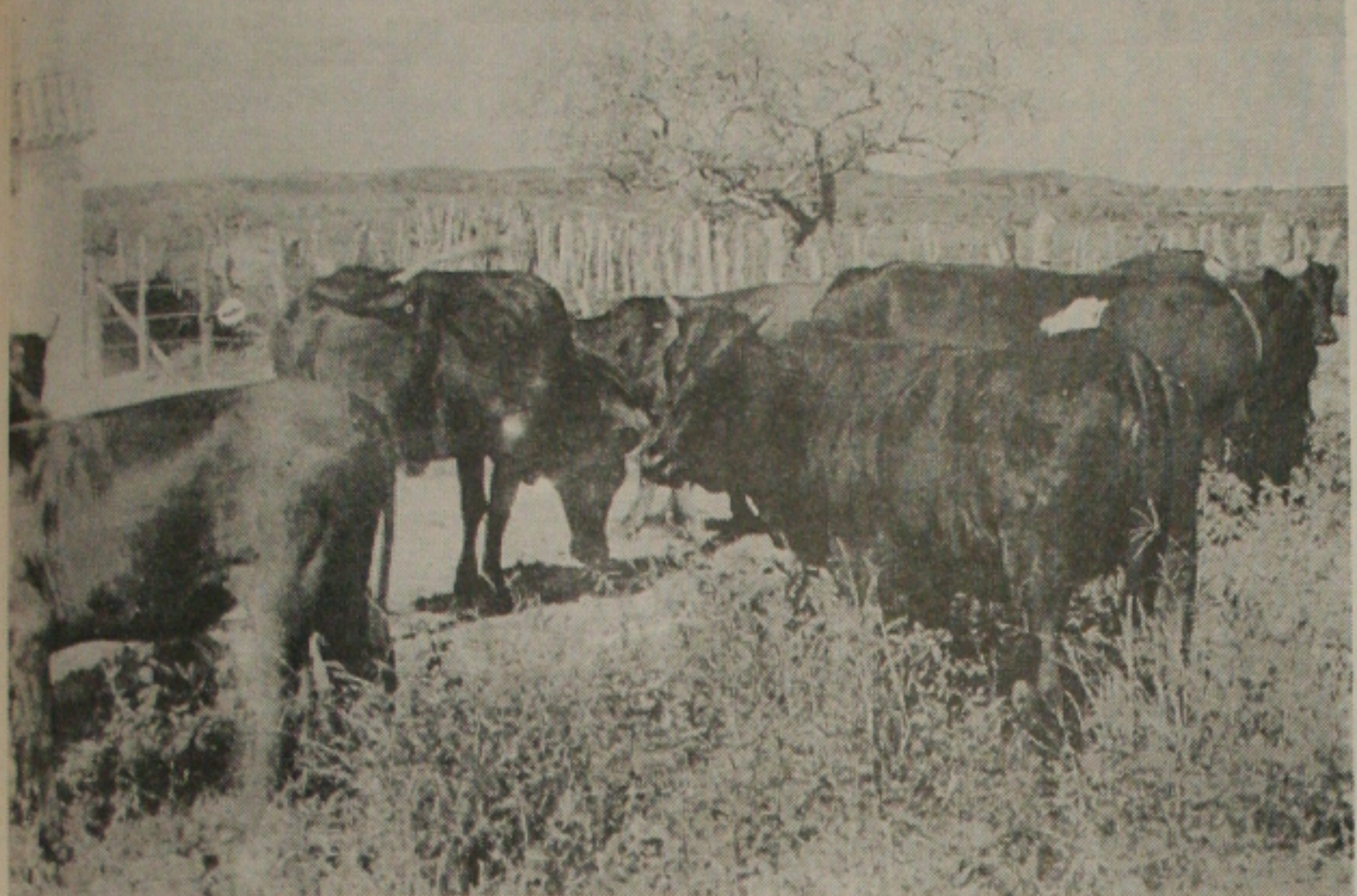
A Emdagro inicia mais uma campanha de combate à febre aftosa para conseguir o certificado de zona livre

Empresa de Desenvolvimento Agropecuário define data para a vacinação do rebanho bovino