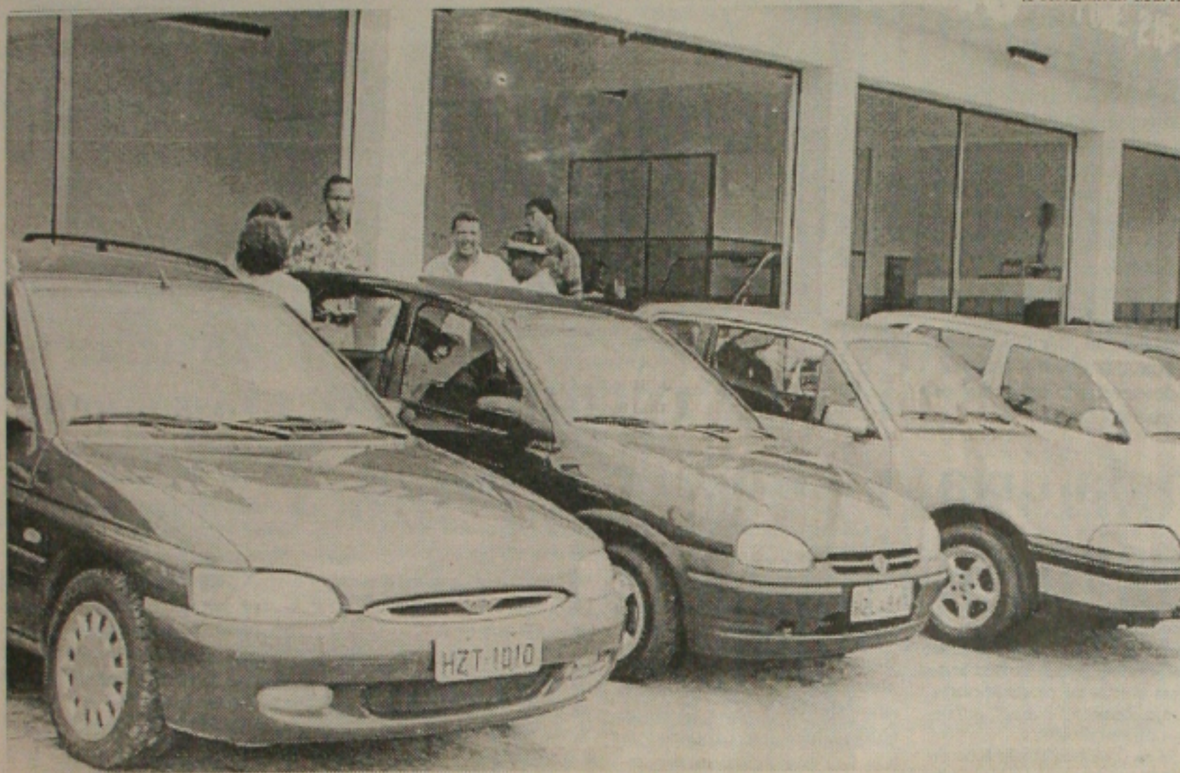
As vendas de carros usados crescem a cada mês o que deixam os comerciantes do setor satisfeitos