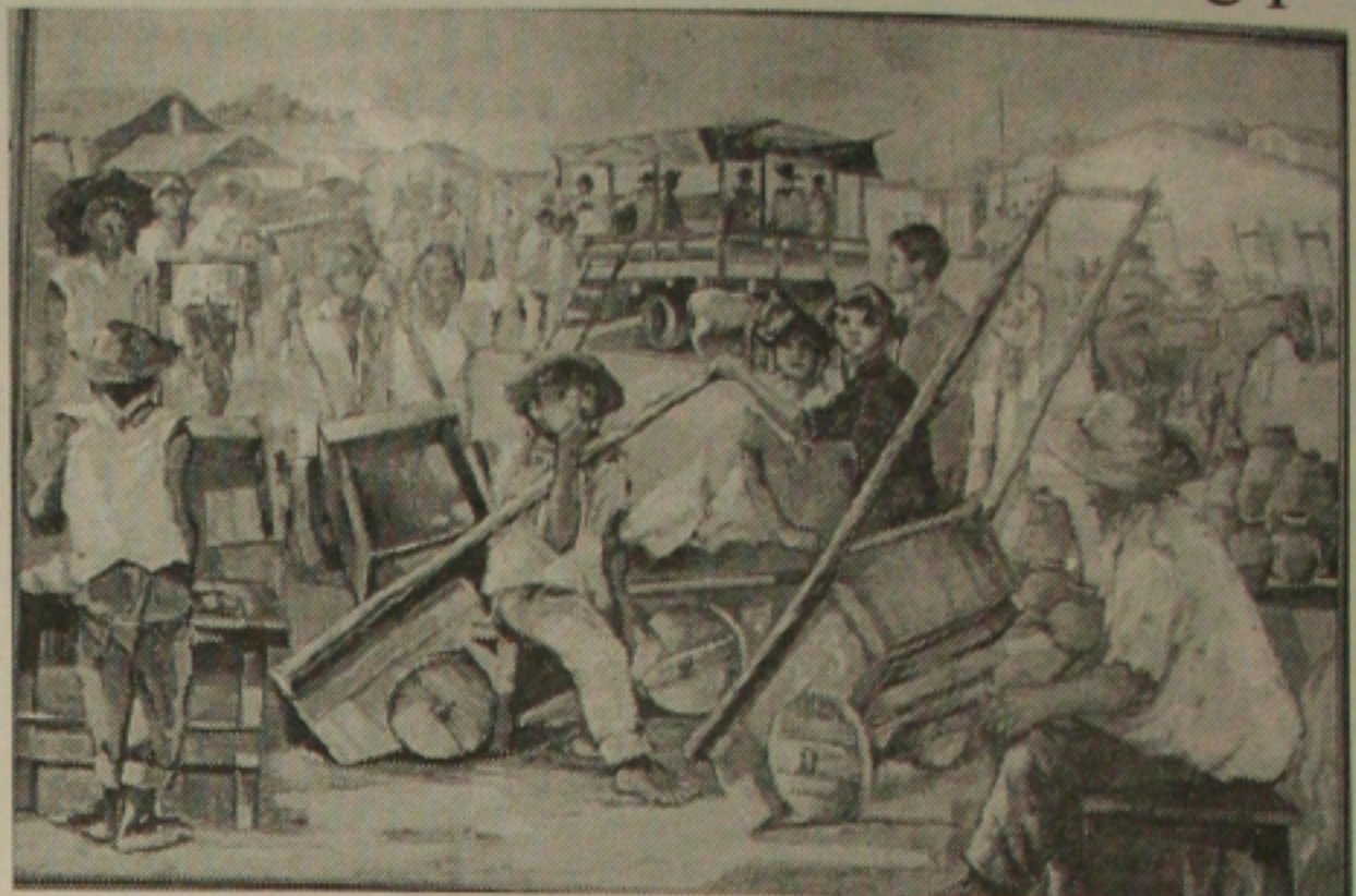
"Feira de Lagarto", de 1986, em exposição na Energipe

A exposição de Jenner Augusto na Galeria Bonino foi um sucesso, não só de vendagem, mas também de críticas. De volta a Bahia, o artista sergipano teve que trabalhar dia e noite para dar conta dos convites, inclusive, os internacionais. Apesar de tantos convites, suas obras foram todas vendidas na França e Bruxelas, o que impossibilitou continuar a turnê. Mais tarde, fez expo-