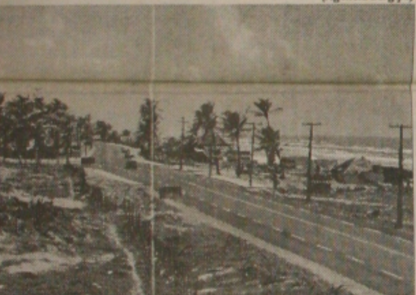
Na próxima semana, o DER começa a instalar as placas

Polícia ainda não atendeu determinação da Justiça sobre assassinato de radialista