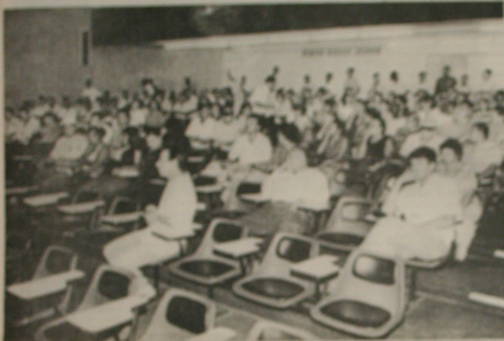
Um encontro da Universidade Federal de Sergipe discute, em assembleia, educação e movimento nacional.

Entre 80% a 90% das instituições educacionais... greve de funcionários públicos federais... impacto na educação e no movimento nacional.