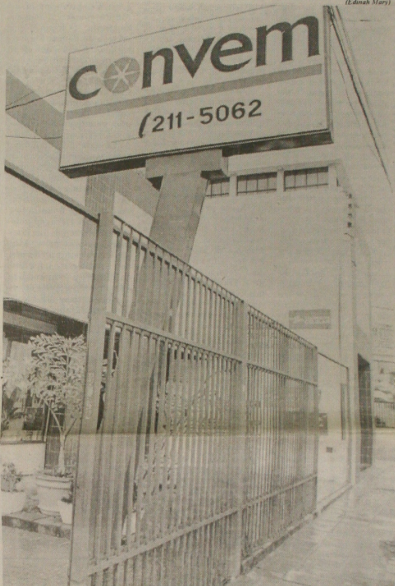
Dois homens assaltaram na manhã de ontem a loja de telefonia celular Convem. (Página 5A)