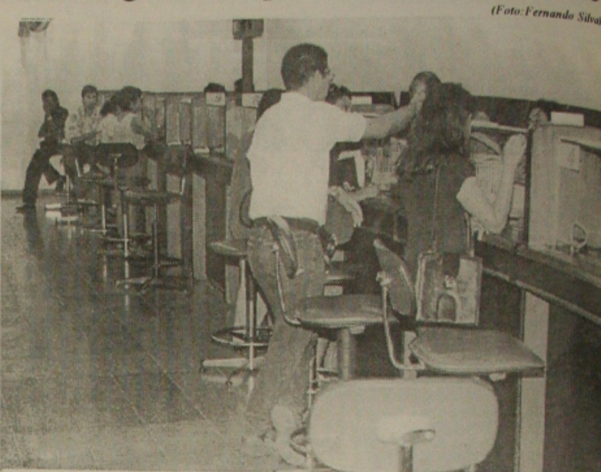
Sindicato dos Bancários de Sergipe desaprova o novo horário de funcionamento das agências