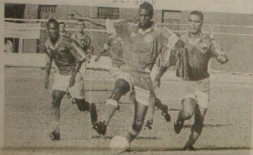
Confiança fez uma partida difícil, mas ao final conseguiu empatar

adiamento da recontagem dos votos. Para tomar a decisão de entrar com o recurso, o deputado disse que foi até Boquim se reunir com seu grupo político. Ele disse que não poderia tomar uma decisão importante sem antes ouvir o grupo que o apóia. (Página 3A)