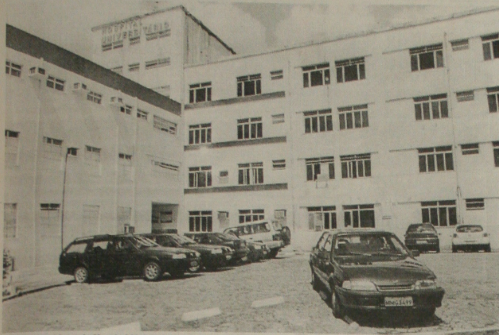
Greve dos servidores do Hospital Universitário tem prejudicado a população carente que depende de atendimento

Unidade de saúde da Universidade Federal de Sergipe paralisa atividades prejudicando os carentes