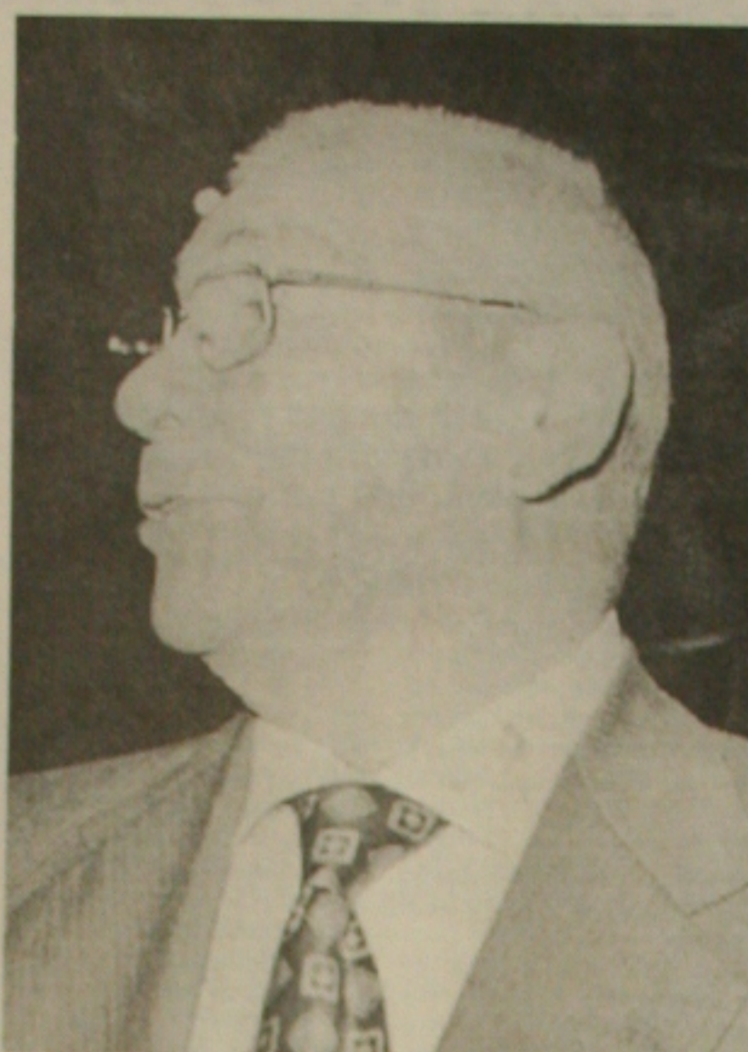
Covas foi agredido durante protesto de funcionários públicos