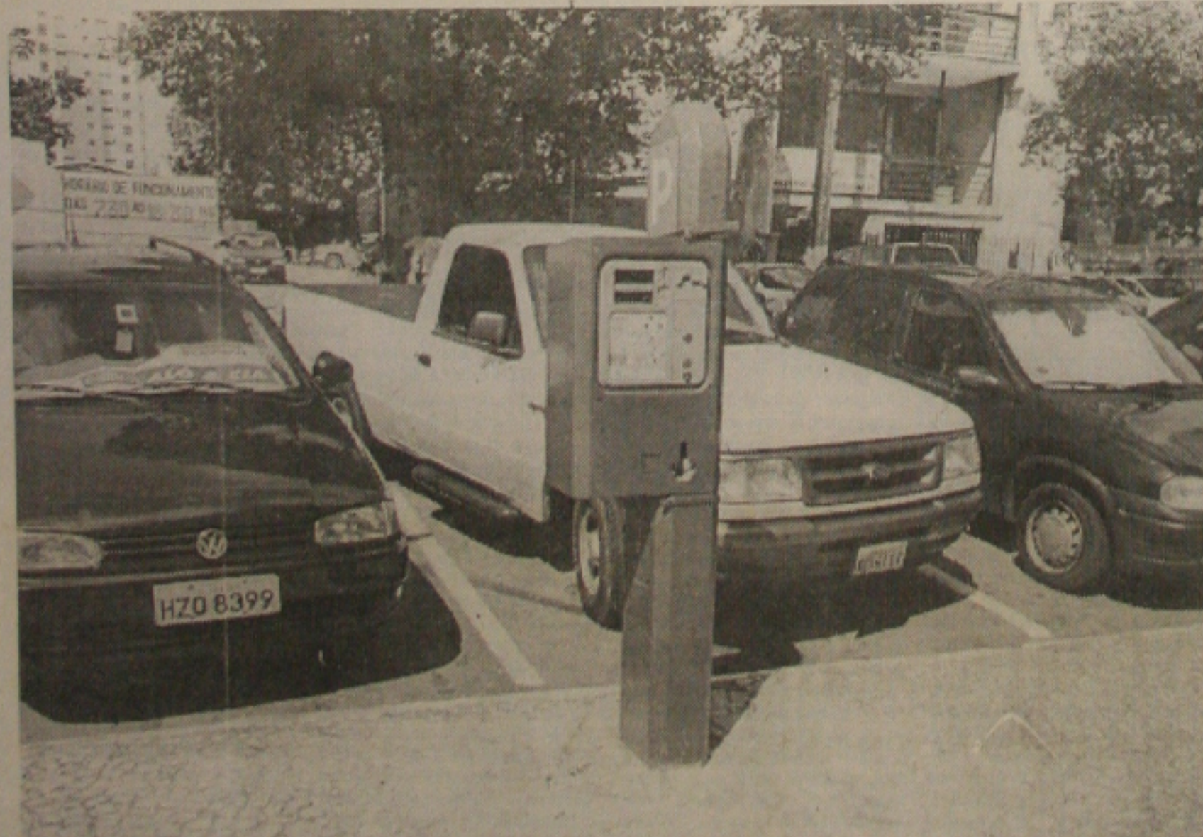
O custo elevado da tarifa na Zona Azul com os parquímetros vem beneficiando os estacionamentos particulares

tava contra a atuação da Tropa de Choque da Polícia Militar na manifestação de ontem na Avenida Paulista. Covas começou a discutir com os manifestantes e trocar empurrões. Instantes depois, mesmo rodeado de seguranças, foi atingido no lado direito da cabeça por um pedaço de madeira, provavelmente o cabo de um cartaz. O agressor, não identificado, escapou ileso da confusão. Ninguém foi preso. (Página 8A)