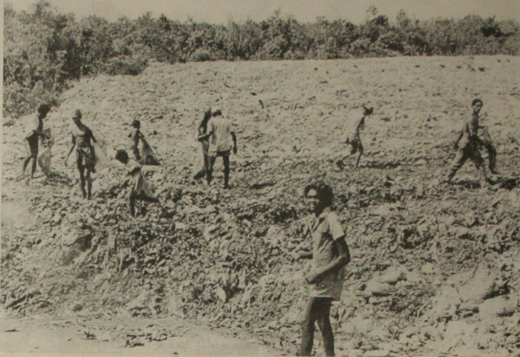
O prazo da transferência da lixeira da Terra Dura terminou ontem, para evitar acidentes com aeronaves

"Com o novo sistema não teremos mais a permanência do urubu"