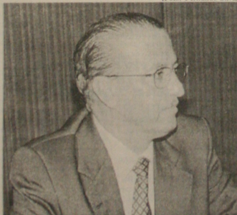
Senador Valadares: candidatura irreversível