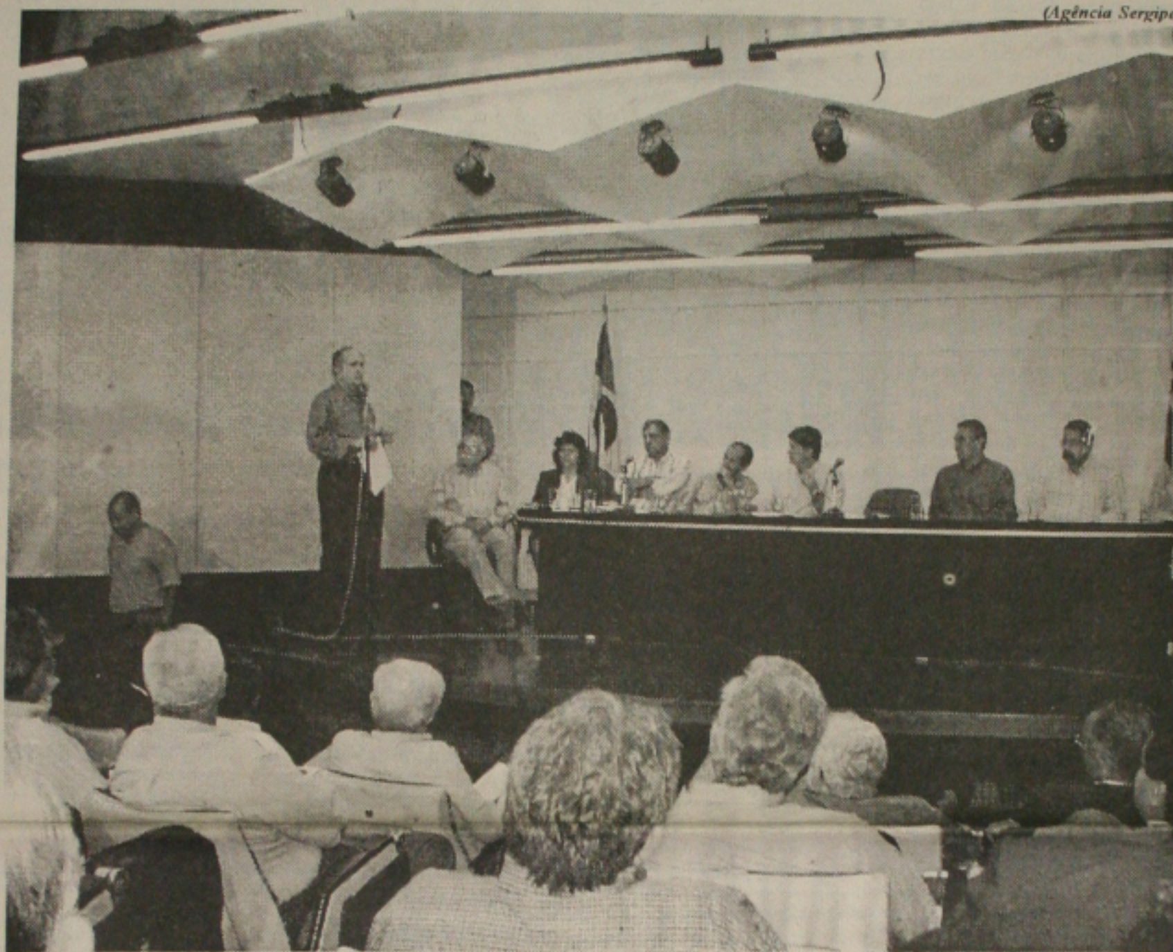
O governador Albano Franco fala para os prefeitos da região citrícola mostrando a sua preocupação com o setor

O governador Albano Franco afirmou que pretende com esta iniciativa, fortalecer e revitalizar a citricultura. No seu entender para que se tenha sucesso é preciso incrementar a parceria com os citricultores, prefeitos, bancos, enfim, todos os segmentos envolvidos com a produção de frutas no Estado. Ele reconhece, inclusive, que a mentalidade dos políticos e dos empresários brasileiro está mudando, ao verificar que para esta solenidade, esses grupos de pes-