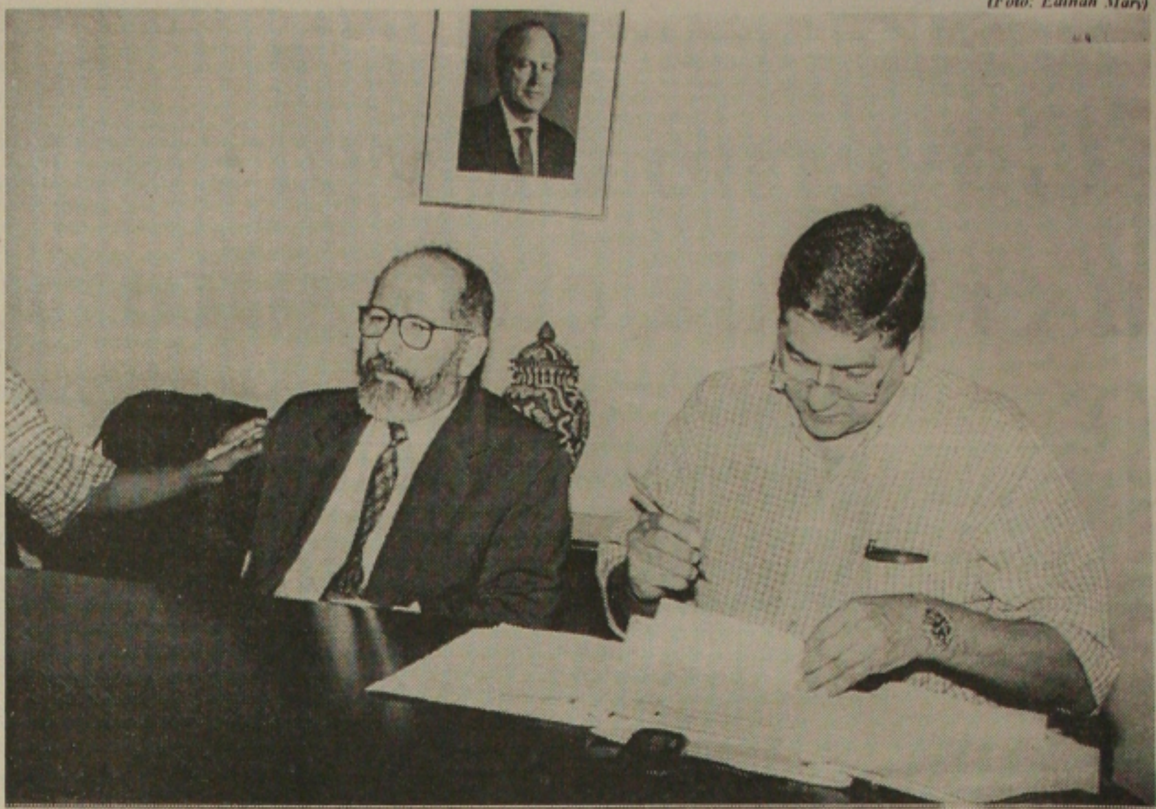
Paixão assina o convênio com a UFS para o reinício das aulas dos Programas de Qualidade Docente I e II

"Alguns estados estão se espelhando no programa daqui de Sergipe"