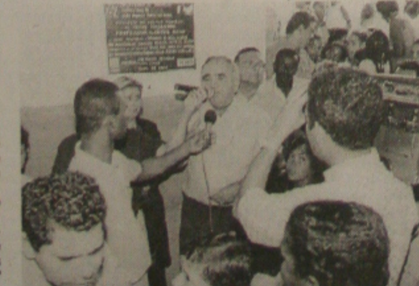
Solenidade de inauguração de mais uma escola na Terra Dura

Gama, a ampliação da escola Laonte Gama é mais uma demonstração de carinho da administração com a comunidade da Terra Dura. "Foi a Prefeitura que fez as duas estradas de acesso ao conjunto além de implantar há mais de um ano o Programa Saúde da Família, responsável pela melhoria da qualidade de vida dos moradores", relata.