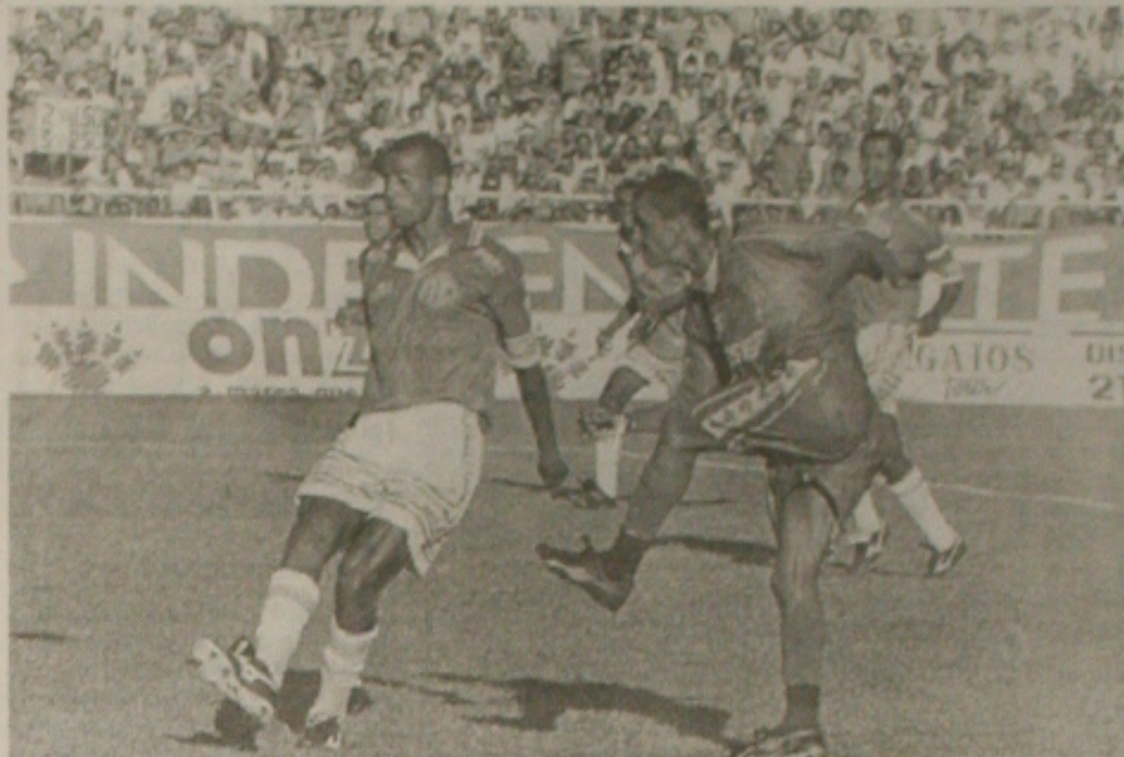
Sergipe e Confiância se enfrentam pela terceira vez este ano. O Sergipe venceu a primeira por 1x0 e empatou em 0 x 0, o segundo jogo

Mesmo sendo uma equipe melhor estruturada, o Sergipe passa por dificuldades de ordem técnica, nota-se uma certa acomodação nos jogadores e o fato de ainda poder decidir o título em mais duas partidas com a vantagem de dois resultados iguais, deixa os rubros mais tranquilos. O Confiância é que tem que correr atrás do prejuízo, já a partir do jogo desta tarde