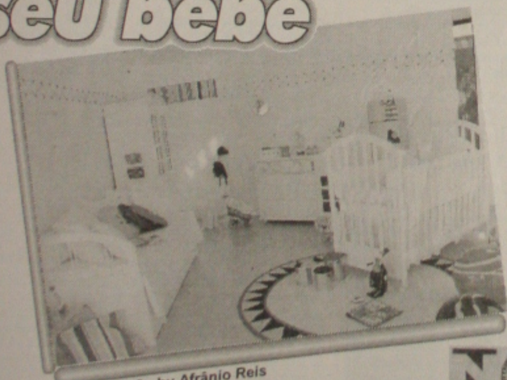
Ambientação by Afrânio Reis

Tem mãe combinando o quarto com a beleza do seu bebê