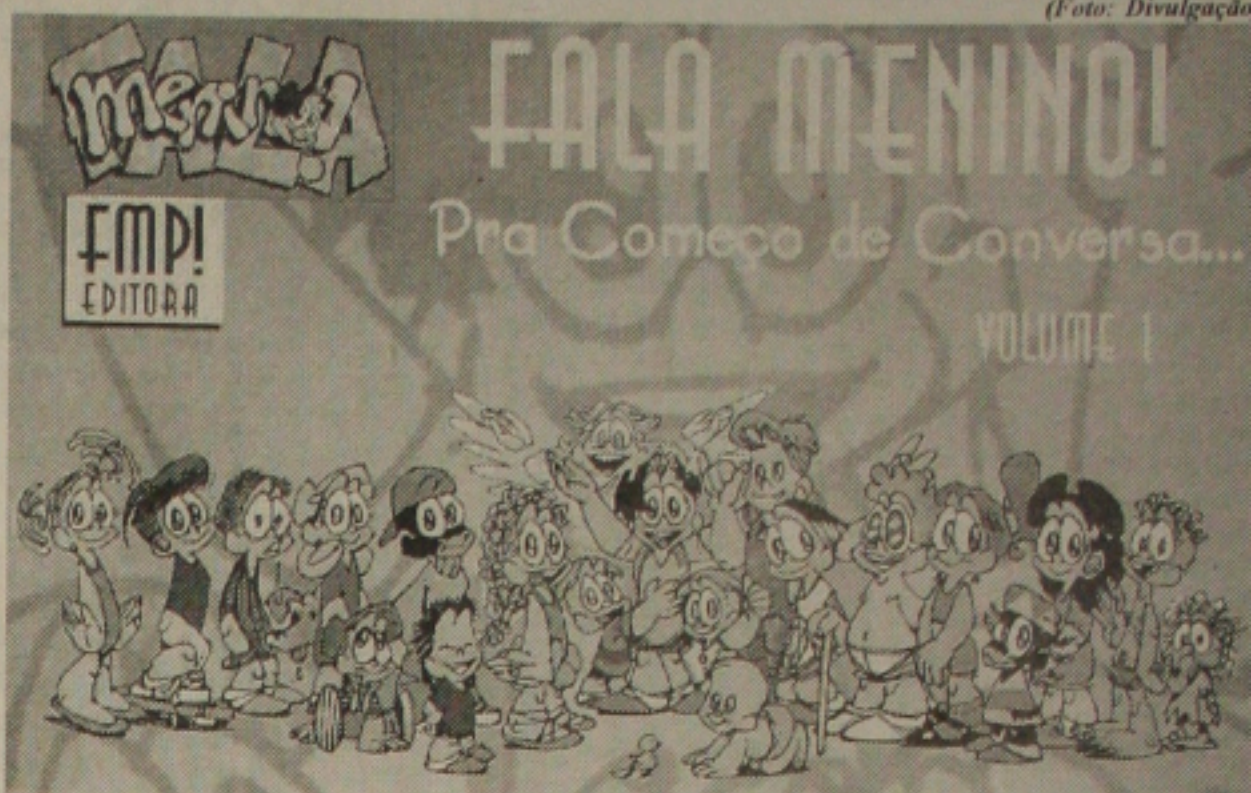
O livro "Fala Menino!..." já recebeu prêmio internacional

O LIVRO - "Fala Menino!" é uma série de quadrinhos pioneira, no Brasil e no Mundo, que apresenta a diversidade do universo infantil. Reconhecido internacionalmente, foi agraciado com o Prêmio Ibero-Americano de Comunicação pela Defesa dos Direitos das Crianças, promovido pelo UNICEF em 1999. Mas este não foi o único prêmio con-