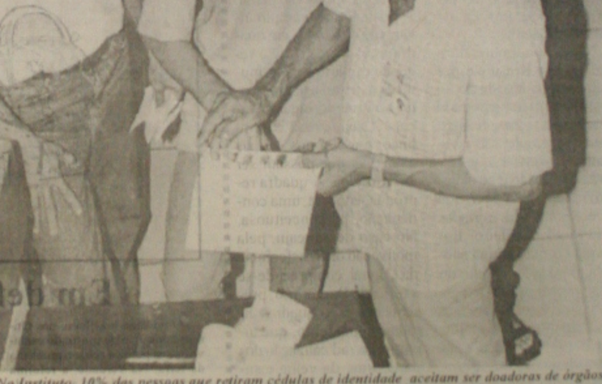
No Instituto, 10% das pessoas que retiram cédulas de identidade aceitam ser doadoras de órgãos

do, uma infinidade de bolos, arroz-doce e mungunza. O objetivo é atrair o consumidor e divulgar a manifestação popular e cultural do Estado. Quem passa, diante das barracas, dificilmente consegue resistir às pedras. (Página 2B)