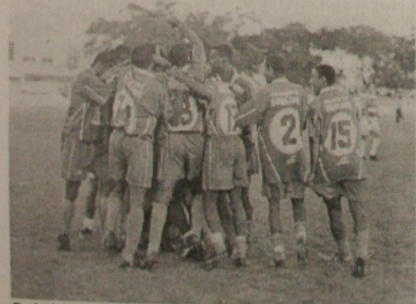
Proletários podem repetir a festa de 99 no João Hora, quando conquistaram o segundo turno

A demolição de Wembley passa a figurar numa página chamada Página da Saudade. Ponto final de um templo, palco dos mais seletos espetáculos.