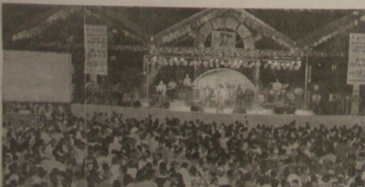
Mesmo só com atrações locais, Areia Branca espera atrair um bom público hoje ao forró-dromo

Com poucos recursos para a contratação de bandas e artistas, Areia Branca, na região Agreste do Estado, e Estância, no Centro-Sul, abrem hoje oficialmente os festejos juninos deste ano. Em Areia Branca, as atrações serão o cantor Antônio Carlos Du Aracaju e as Bandas Calcinha Preta, Rabo de Mel e Pé de Serra. Em Estância, a partir da meia-noite apresentam-se Forró Brasil e Mastruz com Leite. (Página 4C)