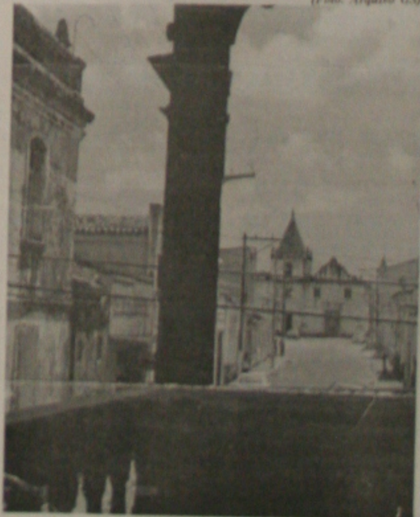
As potencialidades turísticas serão mostradas em shopping