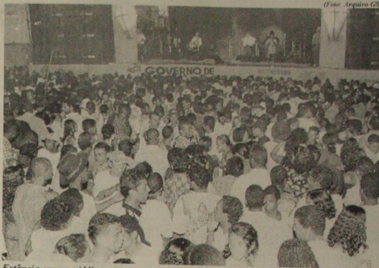
Estância espera público superior a 40 mil pessoas por noite