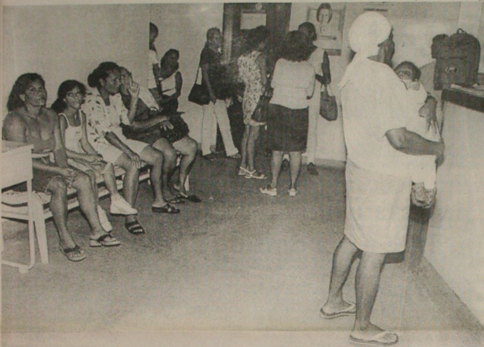
As pessoas carentes que necessitam de atendimento no Hospital Universitário ficam prejudicadas com greve dos servidores