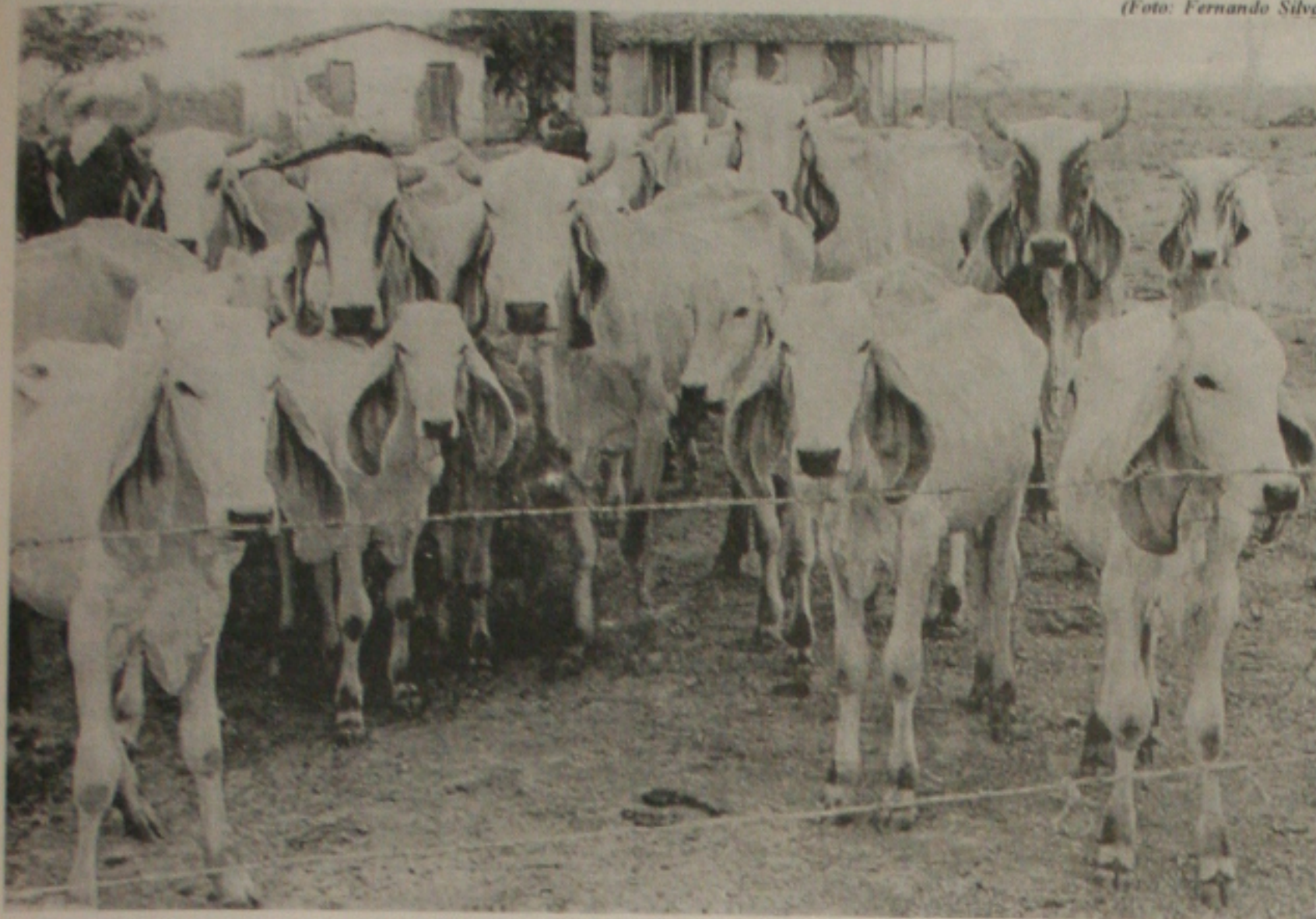
Os técnicos da Emdagro realizam até hoje em todos os municípios a vacinação no rebanho bovino contra febre aftosa