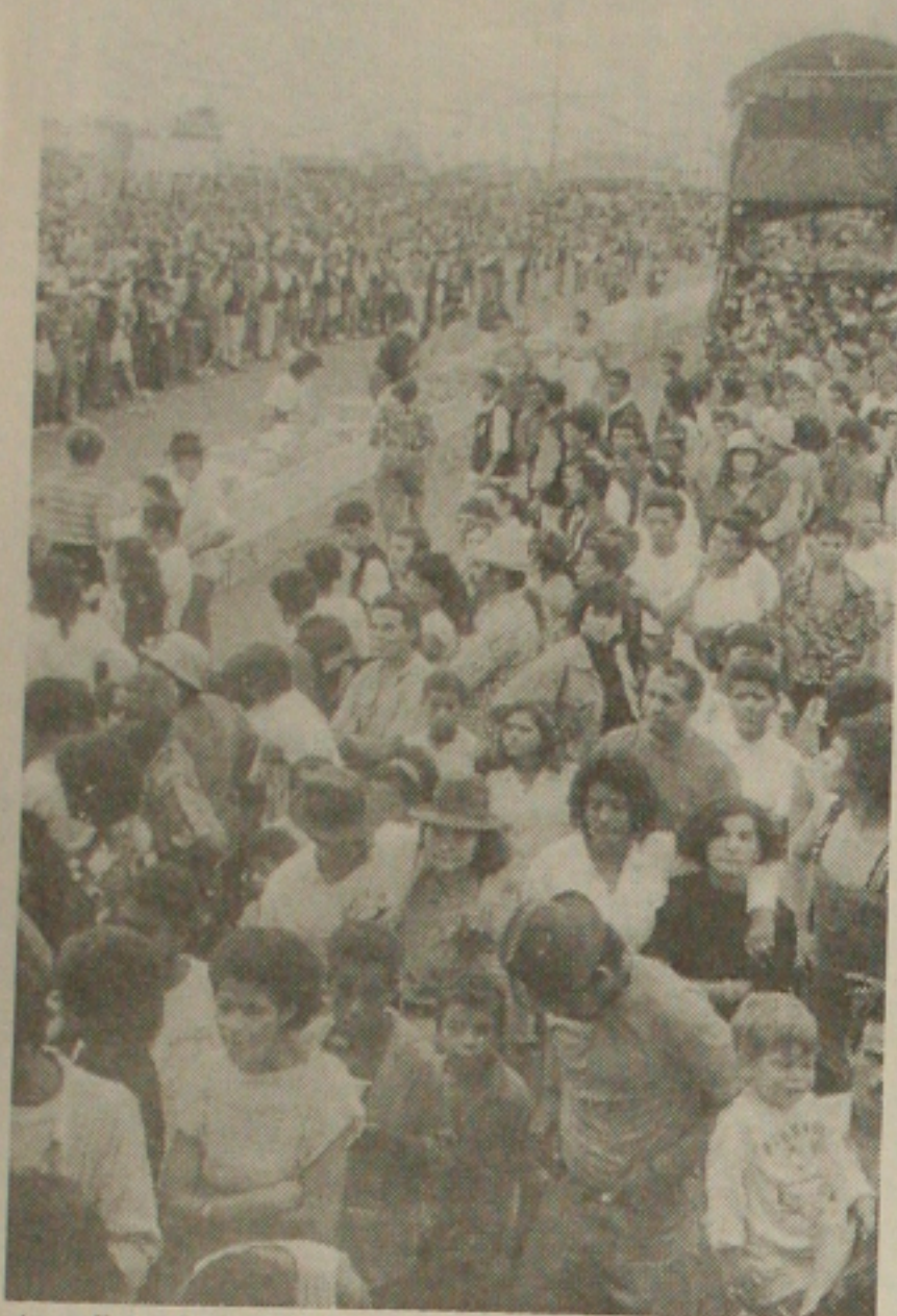
A tradição do café da manhã será mantida em Areia Branca

Quem tanto esperou pelos festejos juninos este ano, pode ficar tranquilo. Sergipe vai ter forró sim, e muito. Acontece hoje a abertura dos mais tradicionais forrós do Estado. Os forrozeiros que quiserem dançar até o raiar do sol, já têm destino certo, basta escolher entre Estância, Areia Branca e a Rua São João, em Aracaju.