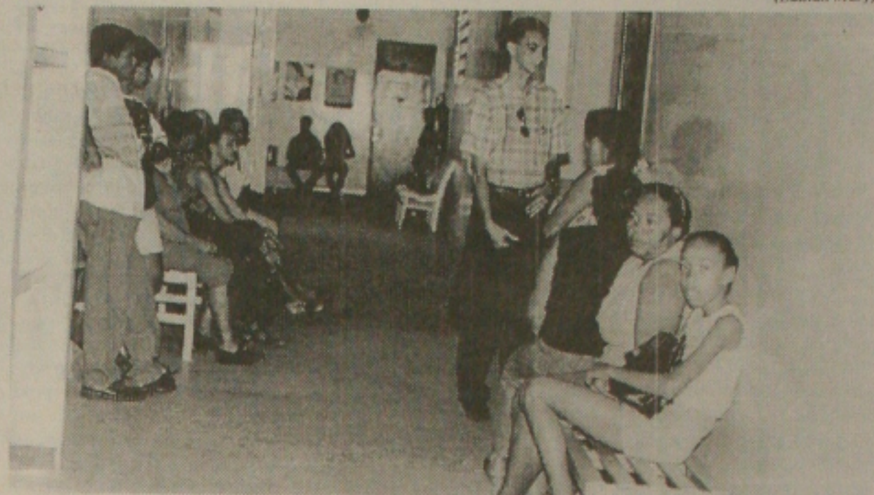
Apesar da greve, pacientes vão ao HU, na tentativa de receberem assistência médica

A greve dos funcionários do Hospital Universitário (HU), no Bairro Sanatório, zona norte de Aracaju entrou na segunda semana consecutiva. A paralisação, em apoio à greve nacional dos servidores federais, vem penalizando centenas de pessoas carentes da capital e do interior. Desde que o movimento grevista começou, o atendimento vem sendo mantido apenas para os casos de pacientes que se submetem a tratamento médico controlado. (Página 1B)