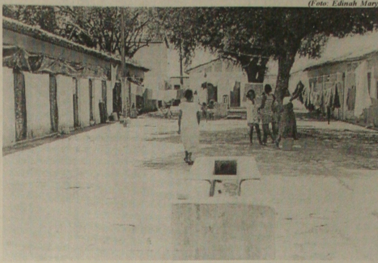
Desabrigadas pelas chuvas, famílias alojadas em parque de exposição passam fome

Para o sindicalista, na mudança de cálculos nos índices de produtividade, qualquer ganho adicional para o Fisco estaria subordinado a um aumento de produtividade. "Assim, consequentemente, o Estado teria um aumento imediato na arrecadação, o que também ficaria diluído qualquer impacto na folha".