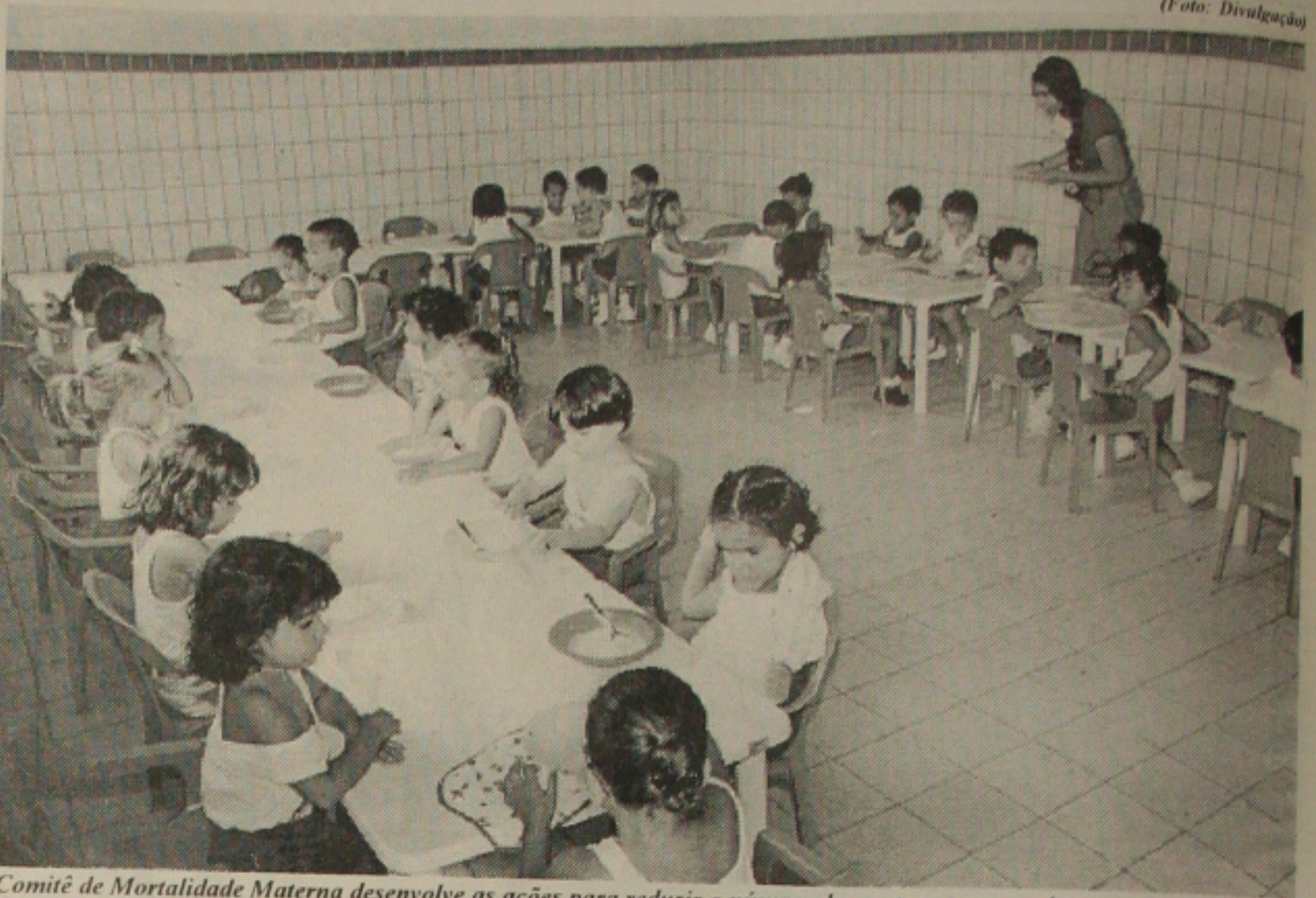
Comitê de Mortalidade Materna desenvolve as ações para reduzir o número de morte entre os recém-nascidos

"O nosso objetivo é reduzir esses óbitos já que 90% deles são previsíveis"