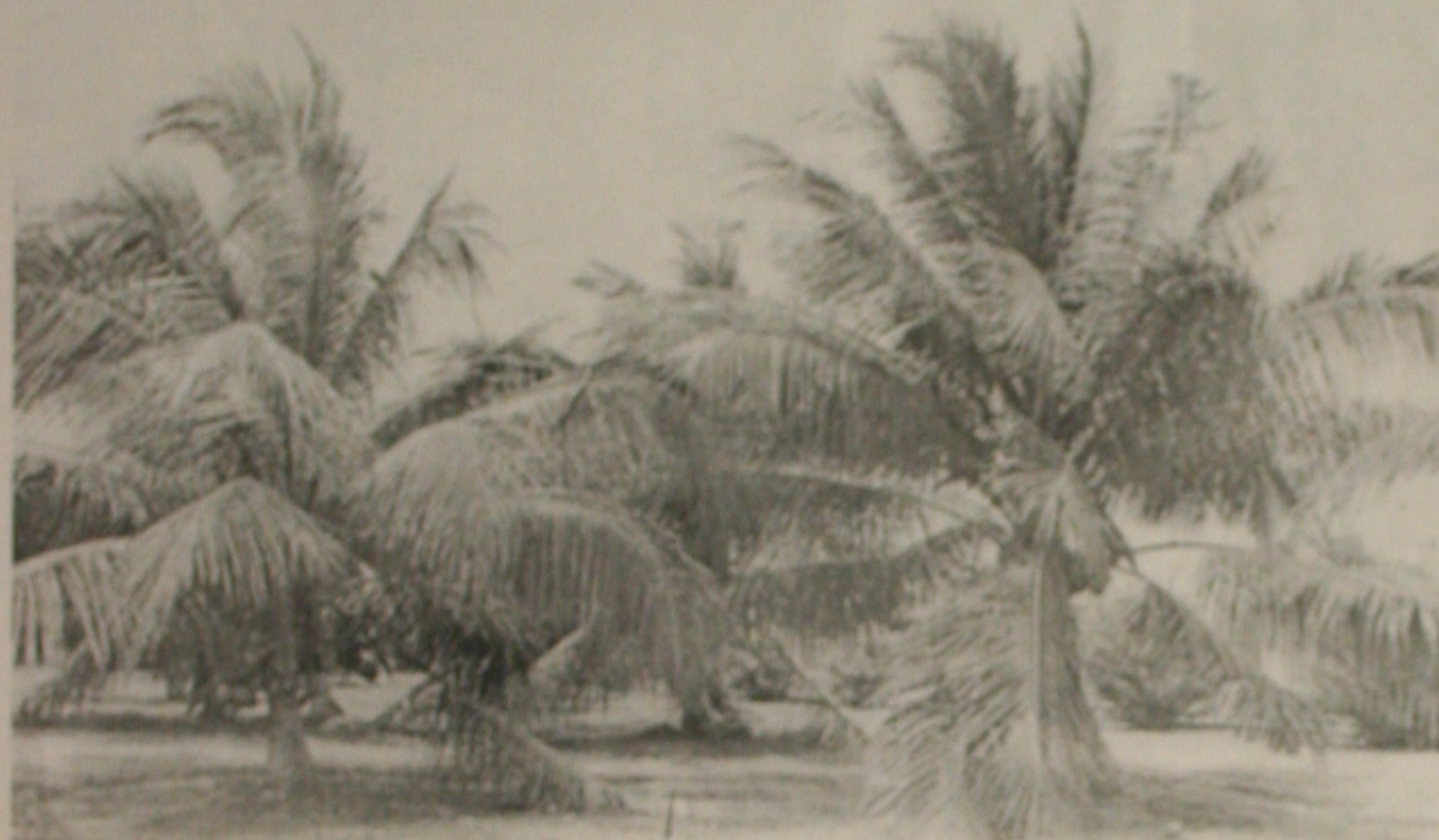
Sergipe é considerado hoje um dos maiores produtores de coco do País, mas a cultura precisa de mais incentivo

Com a presença do governador de Sergipe, Albano do Prado Franco, o ministro de Minas e Energia, Rodolpho Tourinho Neto, esteve ontem em Aracaju para lançar o Programa Nacional de Eletrificação Rural, Luz no Campo. A solenidade de assinatura do Atto de Autorização para a implantação do Luz no Campo em Sergipe e dos Contratos de Financiamentos entre a Eletrobrás e as concessionárias de energia responsáveis pela sua execução, aconteceu no Centro de Interesse Comunitário Ministro José Hugo Castelo Branco, Distrito Industrial de Aracaju (CIC). O programa do Governo Federal, coordenado pelo Ministério de Minas e Energia e pela Eletrobrás, prevê, neste Estado, a eletrificação de 17.817 propriedades e domicílios rurais, beneficiando 89.085 habitantes.