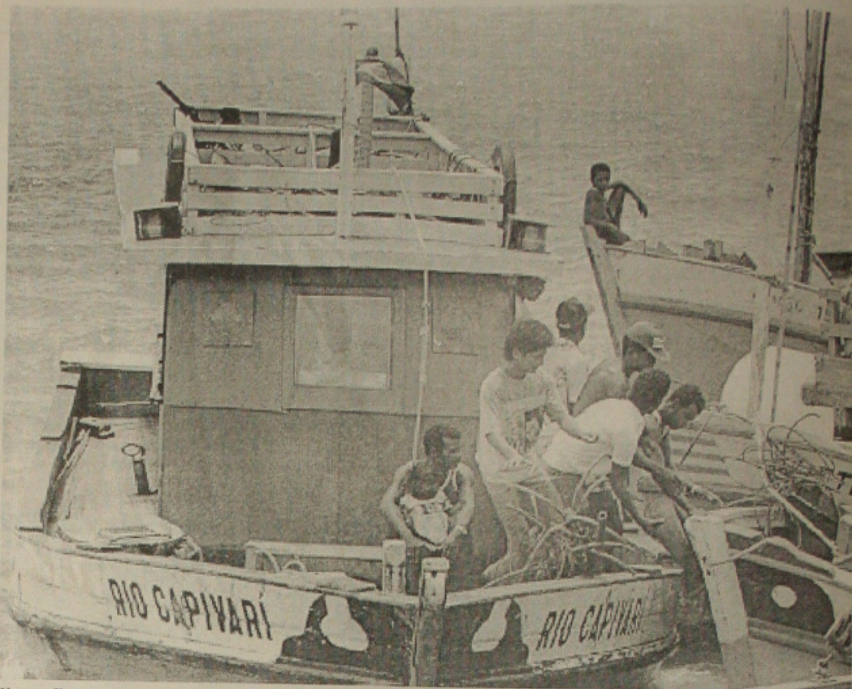
Ibama diz que os pescadores têm respeitado a legislação que proíbe a pesca do camarão no litoral de Sergipe