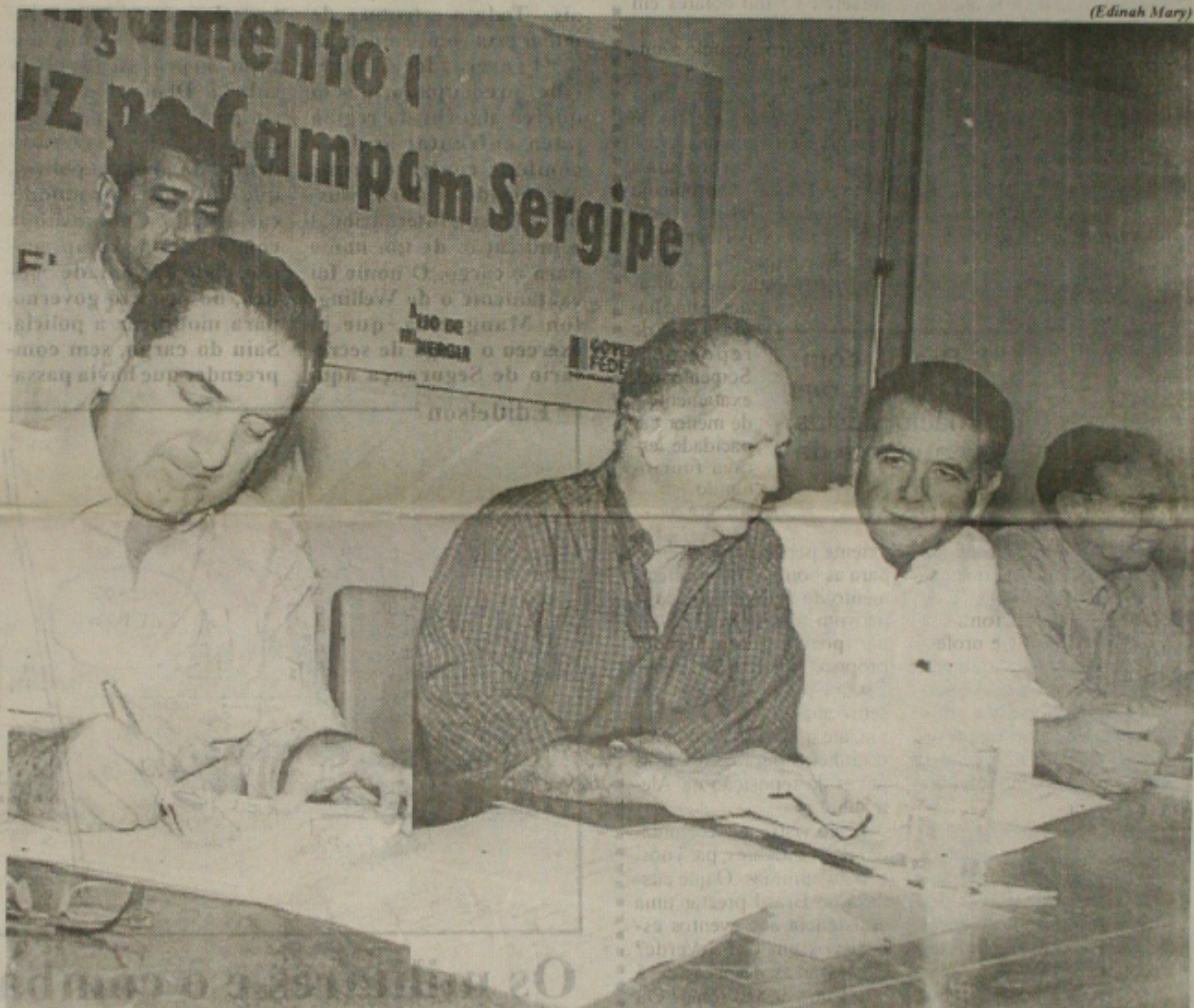
O ministro Rodolpho Tourinho (E) assina o termo, ao lado do governador, do vice e do prefeito da capital

Franco, do vice-governador Benedito Figueiredo, do prefeito da capital, João Augusto Gama e outras autoridades locais. O programa, que representará investimentos da ordem R$ 39,6 milhões, prevê a eletrificação de 17.817 propriedades e domicílios rurais em todo Estado, beneficiando 89.085 habitantes. (Página 1B)