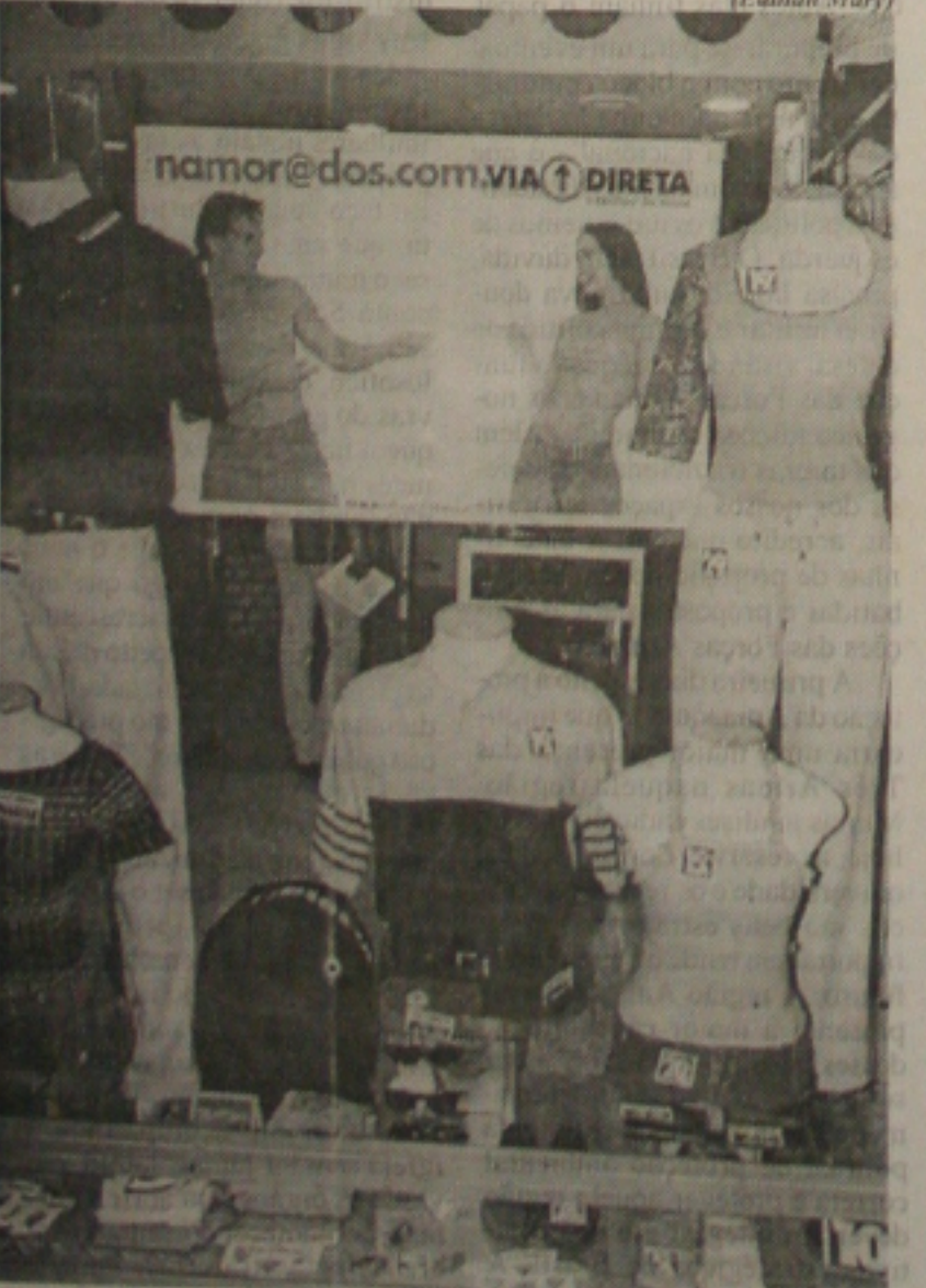
Depois do Dia das Mães, o comércio agora espera que o Dia dos Namorados aqueça as vendas no setor. (Página 6A)

o crime. Eles admitiram, no entanto, vir recebendo telefonemas anônimos e ameaçadores nos últimos 15 dias, denunciados pela própria vítima em seu programa de rádio na FM Ouro Negro, em Carmópolis. (Página 5A)