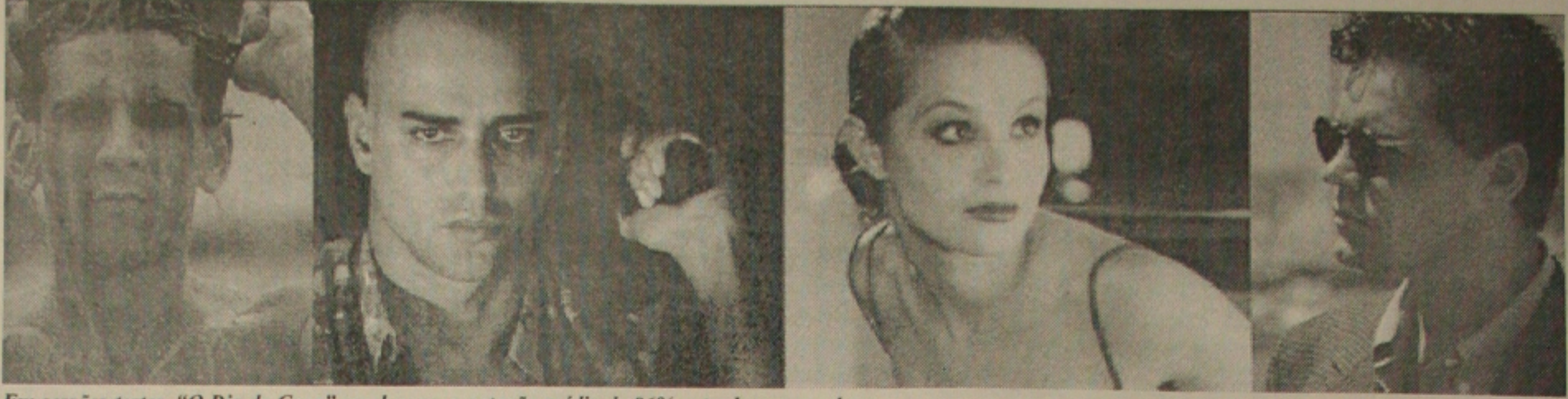
Em sessões-testes, "O Dia da Caça" recebeu uma cotação média de 86% entre bom e excelente