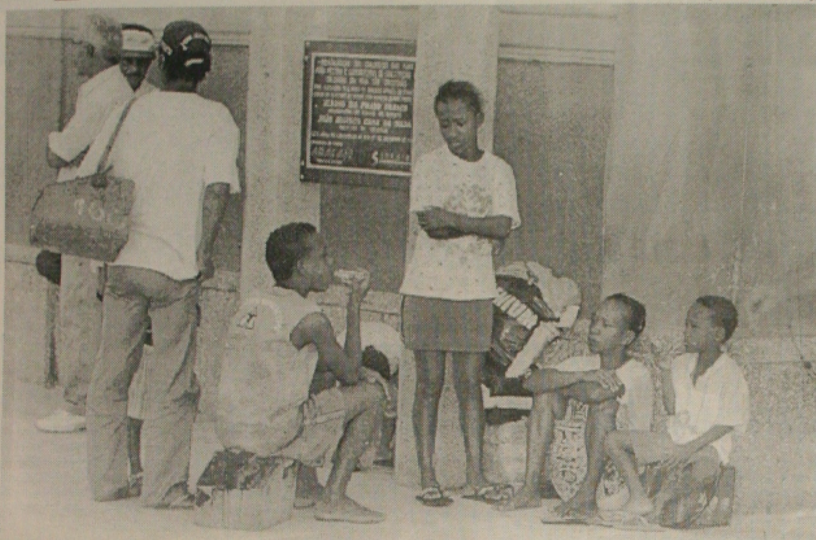
Frente pela Criança e Adolescente é lançada na Assembleia Legislativa para proteger os menores da marginalidade em Sergipe