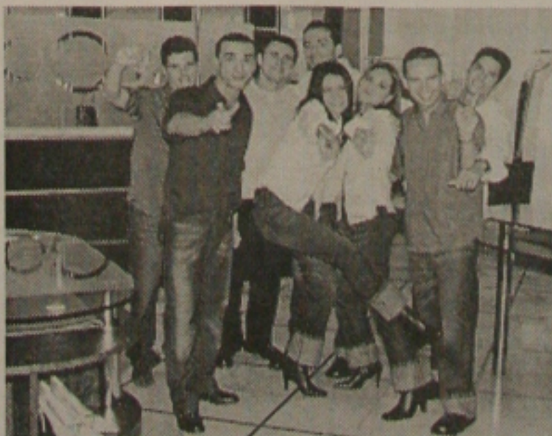
Equipe dinâmica de vendedores que agita a Zoomp.