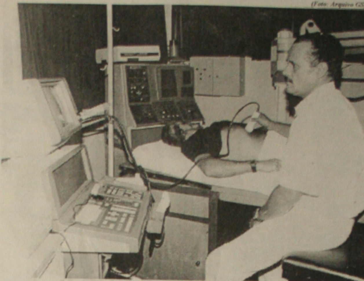
Submeter-se a exame de ultra-sonografia o paciente terá que esperar pelo menos dois meses

— Temos 200 credenciais com a rede particular e temos postos de atendimento até fora do Estado. São 280 médicos profissionais e 90 odontólogos. Temos um atendimento de 250 pessoas por dia. Agora mesmo estamos autorizando a compra de material para fazer o exame de ultra-sonografia”, disse o presidente do Ipes acrescentando que acabou com os atendimentos de pessoas não seguradas.