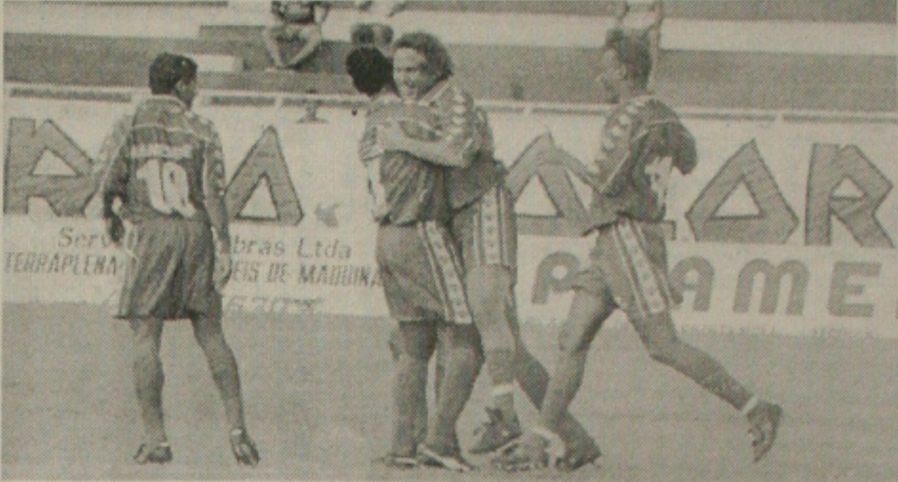
... E foi festejado pelos companheiros de equipe