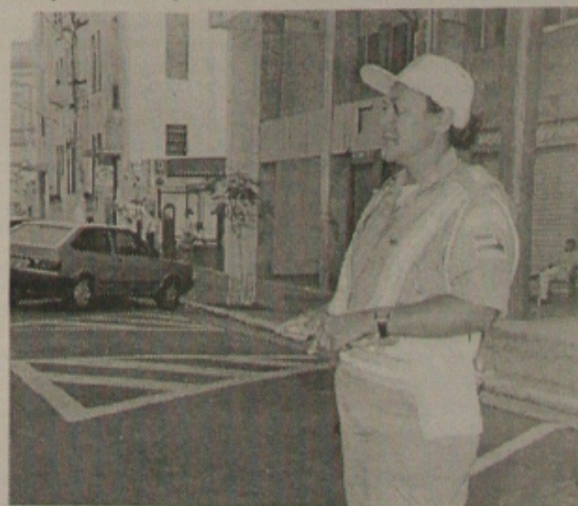
Agentes são orientados para auxiliar os motoristas

Exemplo - O tenente disse que em Campinas (São Paulo), o tráfego é igual ao de Aracaju e, lá, são 9 infrações por dia por cada agente. Aqui, são 2,5 por cada agente que multa os infratores. "Isso é um sinal de que em Sergipe os motoristas são educados", elogia