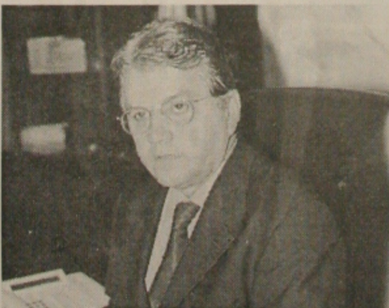
Charmeando em nossa página o presidente do Tribunal de Contas Antônio Manoel de Carvalho Dantas.

Para o big jantar em homenagem aos namorados que aconteceu na última segunda-feira, no restaurante Cactu's. O salão decorado pelo Paraíso das Flores, deu o que falar pela pompa dos arranjos. O buffet repleto de iguarias finas deixou todos com uns quilinhos a mais, mas que podem ser derretidos numa boa academia de ginástica.