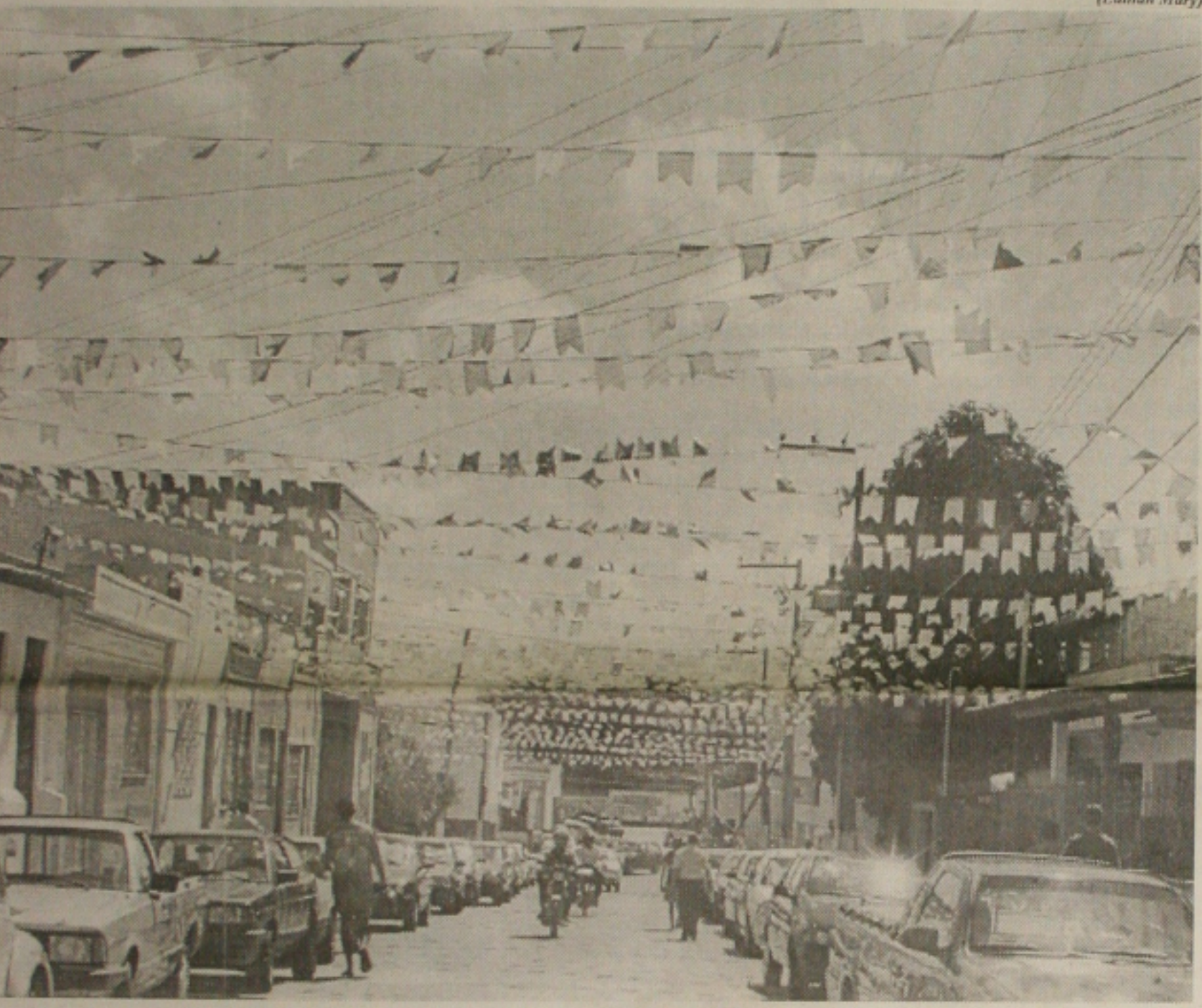
Na tentativa de manter viva a tradição dos festejos juninos, o aracajuano já vem enfeitando com bandeirinhas as ruas da cidade. (Página 5A)