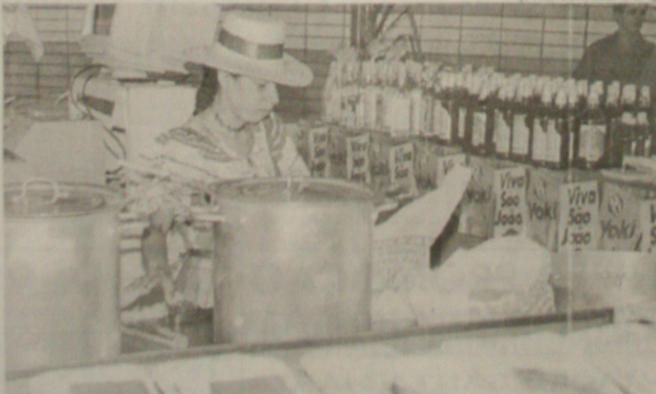
Produtos industrializados substituem "comidinha" caseira