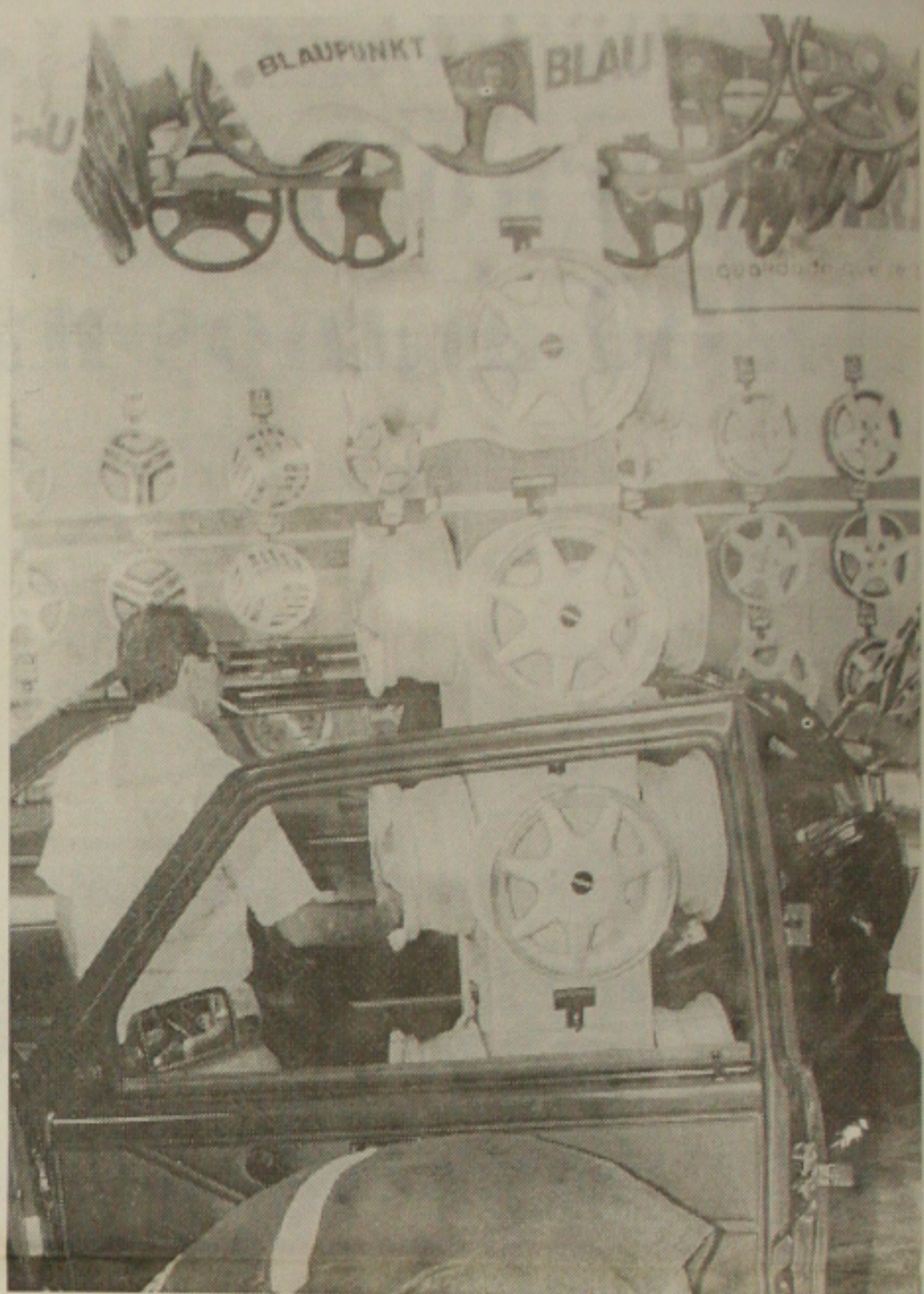
Vendas fracas representam desemprego

Leite lembrou que as autopeças maiores estão se mantendo com muita dificuldade. Enquanto isso, as de pequeno porte, estão se ven-