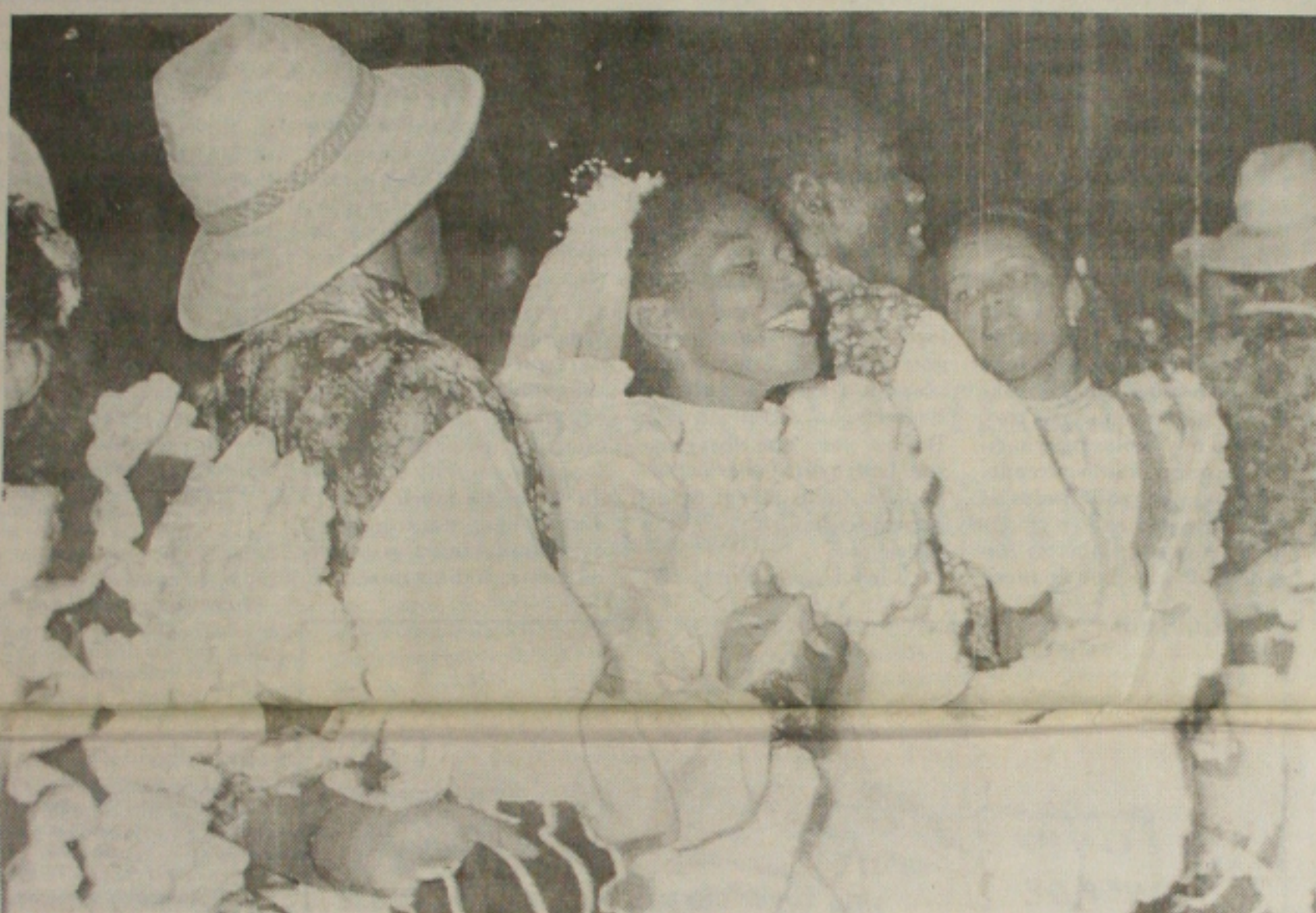
A apresentação de quadrilhas juninas é uma das mais tradicionais atrações da festa em Sergipe

Lavrador tentou assassinar vizinha, mas acabou matando criança a golpes de foice