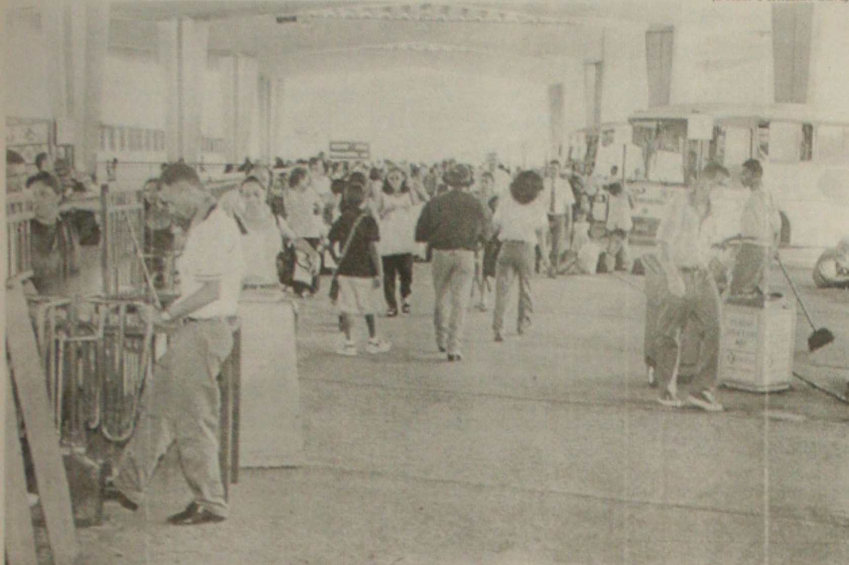
Rodoviária fica lotada e empresas faturam alto

Desde ontem, o Terminal Rodoviário José Rollemberg Leite, vem registrando um fluxo maior de passageiros, com filas para compra de passagens e para o embarque. A maioria das pessoas está se dirigindo para municípios sergipanos onde acentua-se um São João animado ou, ainda, cidades tranquilas, para aqueles que não gostam de folia. O momento também é propício para visitar os familiares.