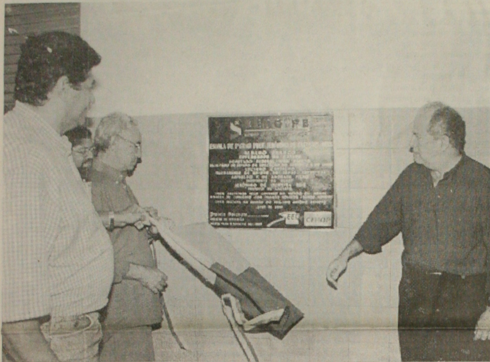
Albano cumpre mais um compromisso com lagartense

Uma escola com oito salas de aula e capacidade para 1.260 alunos nos três turnos foi inaugurada pelo governador Albano Franco na Colônia Treze, em Lagarto. O colégio, denominado de prefeito Jerônimo Reis, custou R$ 537 mil, mas, computados os móveis e equipamentos, o preço final alcança R$ 800 mil.