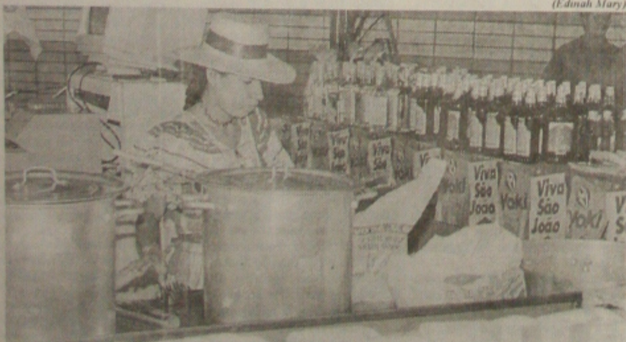
O período de festejos juninos provoca incremento em alguns setores da economia local, como o da fabricação de bolos, licores e outras iguarias. (Página 3B)