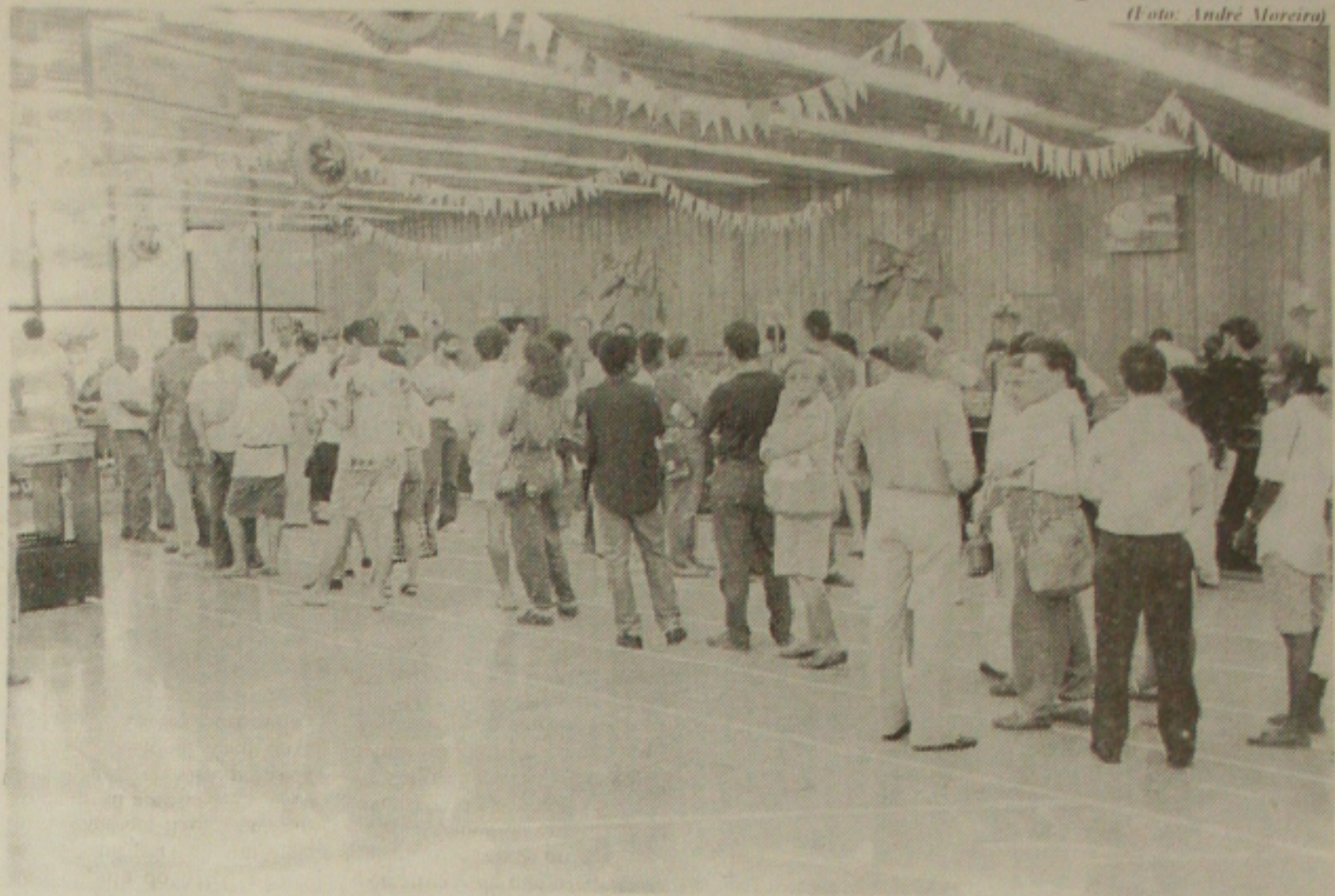
Maioria das agências entrou no clima de São João

Na quarta-feira (21) foram entregues os contratos dos professores da DR-6 com sede em