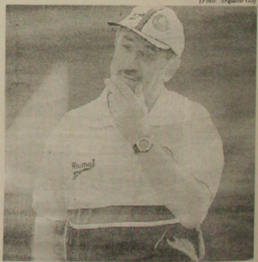
Scolari pode deixar o Palmeiras

Continuam as especulações de que o técnico pode trabalhar