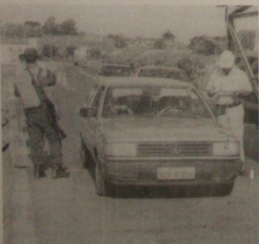
A PRF realiza até amanhã a Operação São Pedro, reforçando a fiscalização nas rodovias federais em Sergipe. (Página 1B)