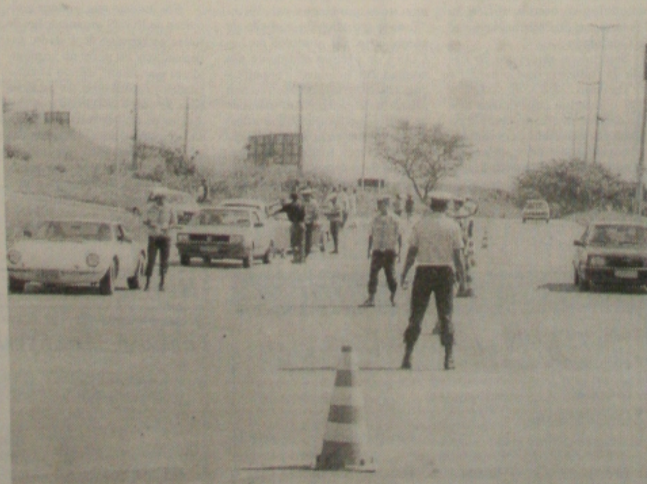
Policiais atentos para dar segurança nas rodovias