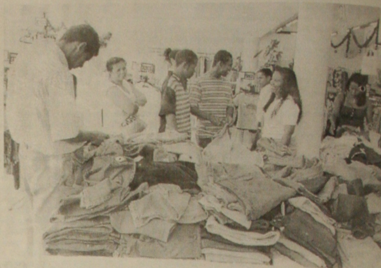
Na hora da compra, comerciante deve ter cuidado com cheque de outra pessoa

Os empresários têm reclamado dos parquímetros nos estacionamentos das ruas de Aracaju. Com um preço