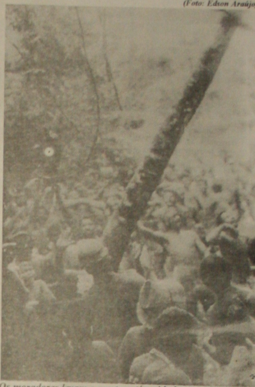
Os moradores levam o mastro até a cidade

Quem ainda não conhece a festa, vale a pena participar. A Festa do Mastro começa amanhã e só termina no domingo, dia 02 de julho. É diversão garantida! (Luciana Chaves)