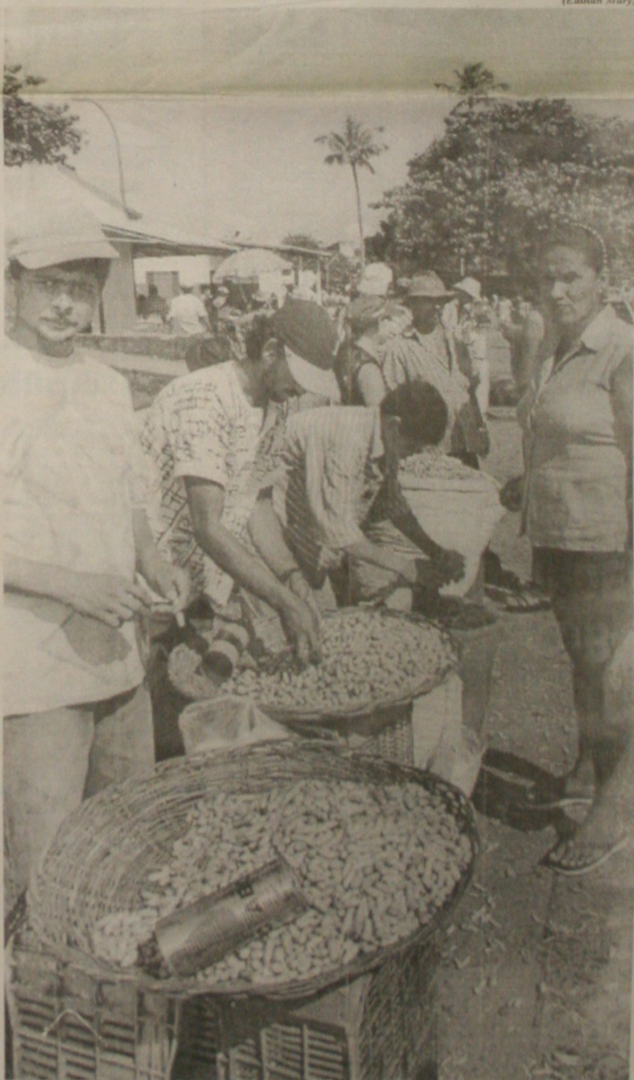
Na Ceasa, o preço do amendoim também caiu nos últimos dias, beneficiando os consumidores

Para comemorar o dia de São Pedro, a Prefeitura de Aracaju incluiu na programação do Forrocaju um dos mais importantes nomes do forró nordestino, Dominginhos, o aprendiz do velho Luiz Gonzaga. Já no interior, este ano, a tradicional Festa do Mastro de Capela será aberta oficialmente amanhã e não hoje, dia 29, como sempre acontece. Realizada há 60 anos, a festa é a principal atração dos festejos juninos no município, que detém o título de melhor São Pedro do Estado. (Página 4C)