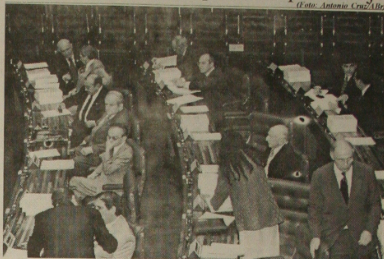
Somente os senadores e alguns funcionários tiveram acesso ao plenário do Senado, ontem

"O Senado sofreu bastante, ninguém cassa mandato com satisfação; mas escolheu certo e optou pela ética, pela decência", disse ACM, que cobrou a mesma postura do Judiciário. "O Judiciário deveria aprovei-