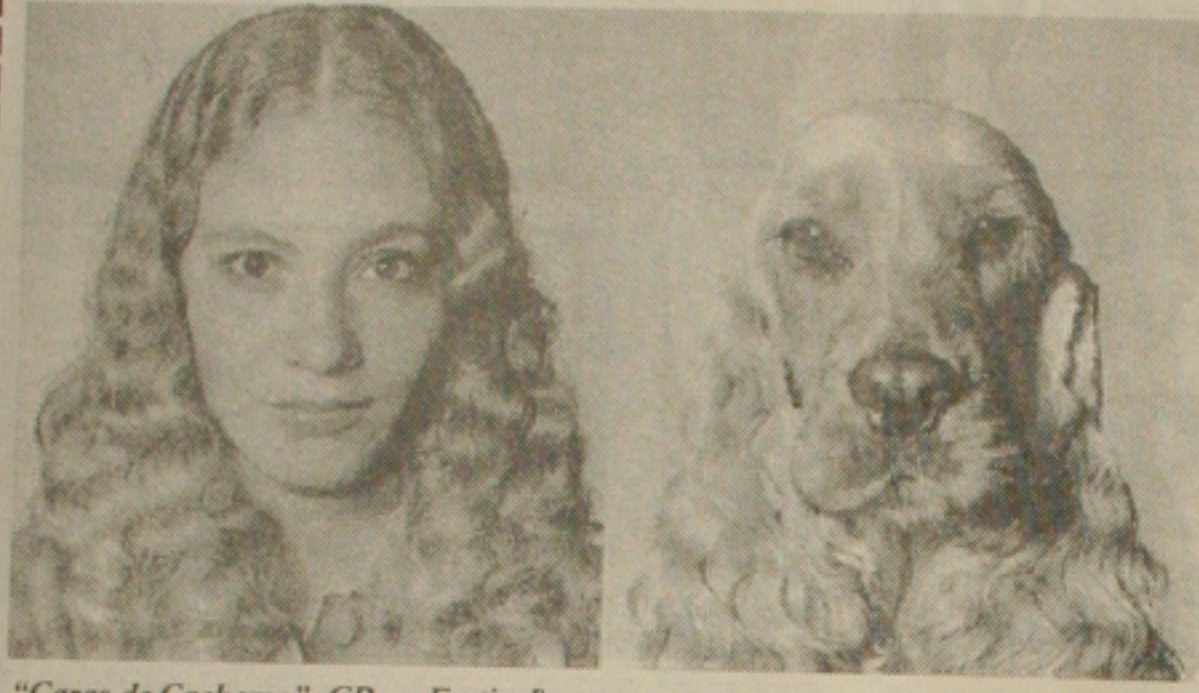
"Caras de Cachorro", GP no Festival