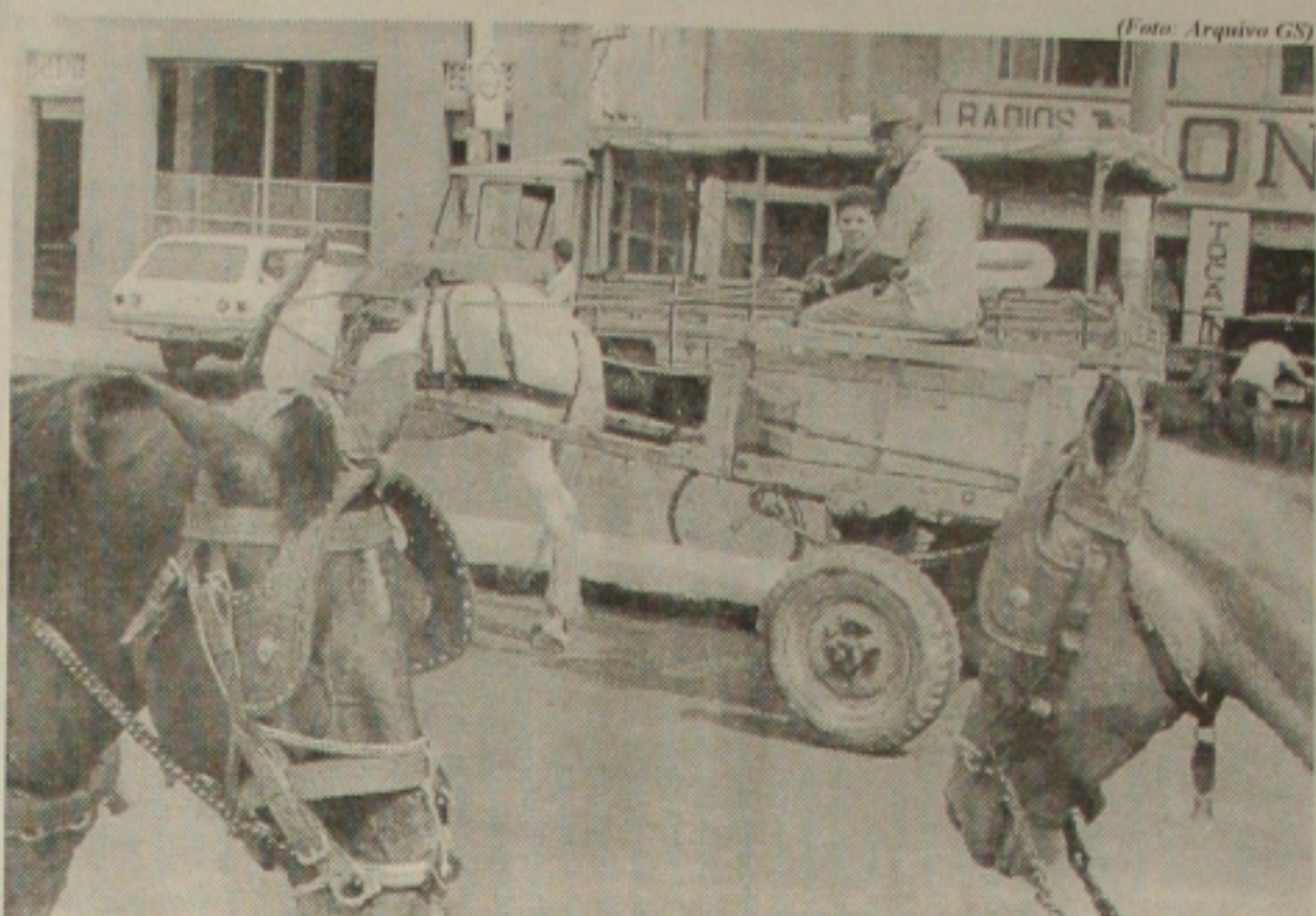
Carroceiros em situação irregular passará por fiscalização permanente do sindicato da categoria