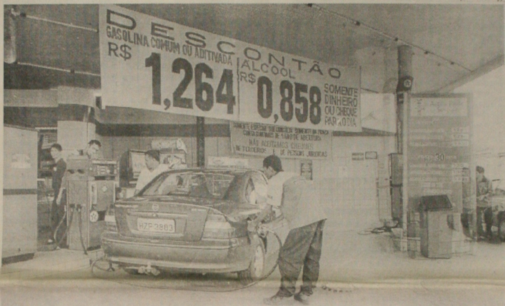
Nos postos de Aracaju, os donos prevêem demissões por causa do novo reajuste em preços dos combustíveis

o segundo reajuste concedido pelo governo neste ano. Em março, o preço da gasolina e do óleo diesel subiu nas refinarias 7% e o impacto para os consumidores foi de 5%. Dados do Ministério da Fazenda mostram que, desde 1998, o aumento médio na refinaria da gasolina, óleo diesel e GLP já chega a 95,7%. Em Aracaju, donos de postos de revenda de combustíveis prevêem queda nas vendas e demissões no setor como reflexos do novo reajuste. (Páginas 8A e 2B)