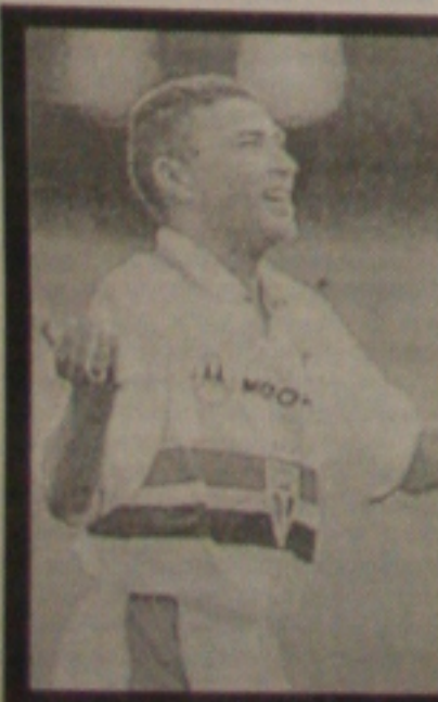
Na estréia na Copa dos Campeões, o São Paulo (foto) empatou por 0 a 0 ontem com o Vitória, em Maceió. Agora precisa vencer o jogo de volta, sábado, para se classificar e seguir com chances de chegar à Libertadores da América, seu principal objetivo. Novo empate, a decisão saiu para os pênaltis. Com o Rei Pelé superlotado e mais de 5 mil torcedores do lado de fora, os dois clubes fizeram uma partida monótona, com muita marcação e pouca objetividade.