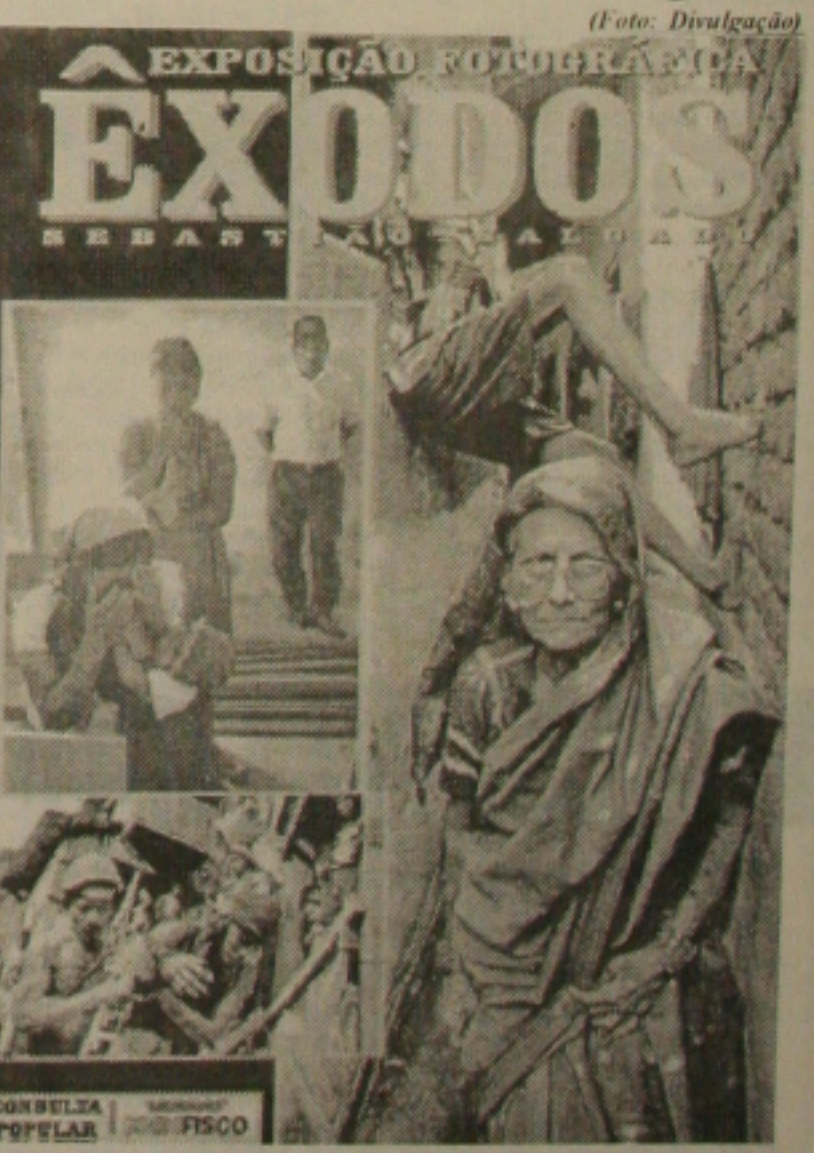
Exposição ficará até o dia 20 de julho

A exposição está percorrendo vários países e já tem 16 exposições agendadas que serão encerradas no início de 2001. As fotografias passarão ainda por outros estados do Brasil, Estados Unidos, Nova York, Itália, além de outros países. "Êxodo" está dividida em cinco temas: "Migrantes e Refugiados - O Instituto de Sobrevivência", "A Trágica Africana - Um Continente à Deriva", "A América Latina -