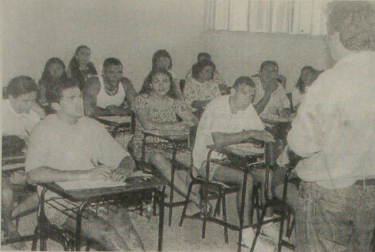
Universidade Federal de Sergipe cria mais seis cursos para o próximo vestibular unificado

O plano também prevê ações para facilitar o acesso à escola, reduzir a repetência e a evasão escolar e proporcionar a melhoria da qualidade de ensino. As propostas são destinadas a construção, ampliação e recuperação de unidades escolares, expansão do programa de alfabetização com multimídia na escola, implantação de Proformação em escola, de oficina pedagógica, capacitação de recursos humanos, expansão da alimentação escolar, aquisição de equipamentos para laboratório de informática, etc.