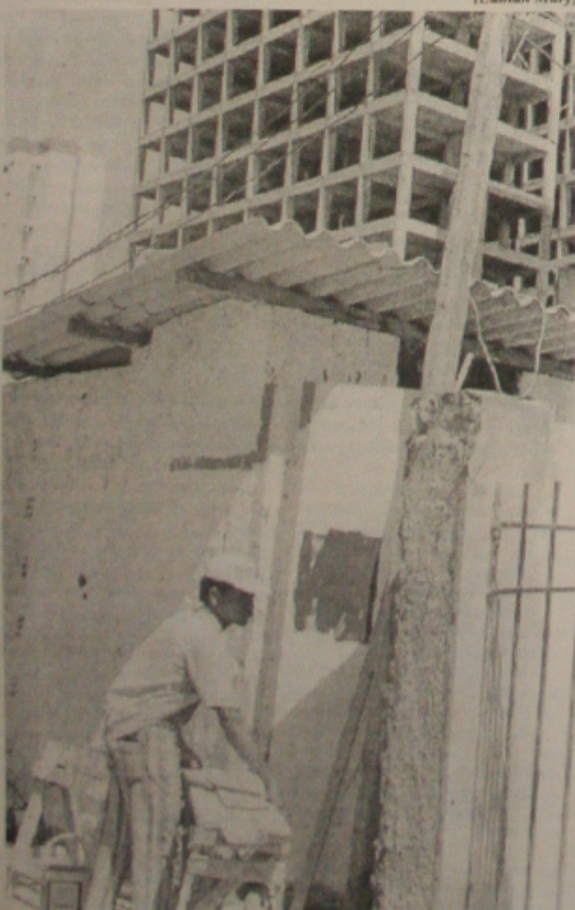
Hoje, 200 mil trabalham sem carteira, muitos deles na construção civil