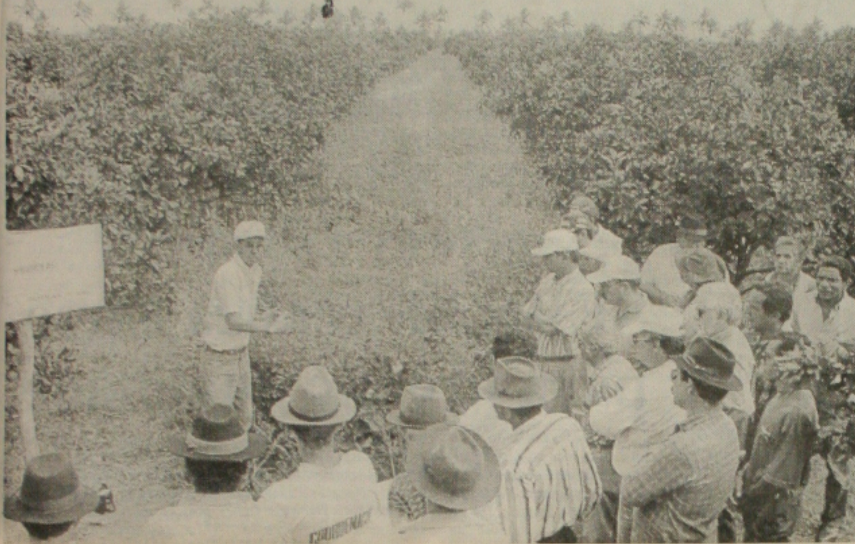
Empresa de Desenvolvimento Agropecuário realiza trabalho com objetivo de revitalizar a citricultura em Sergipe

Preocupada com a atual situação da citricultura no Estado, a Empresa de Desenvolvimento Agropecuário de Sergipe (Emdagro), frente a profunda crise que se vem abatendo sobre a citricultura estadual, motivada pela irregularidade climática, problemas estruturais e de conjuntura, a exemplo da oscilação de preços por falta de mercado regulador, vem desenvolvendo em parceria com o Banco do Nordeste, Banco do Brasil e outras instituições, esforços no sentido de promover a revitalização da citricultura, enfatizando a utilização de tecnologias de baixo custo que possam favorecer o aumento de produtividade.