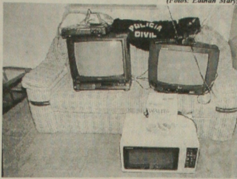
Produtos furtados na residência do povoado Ponto Grande