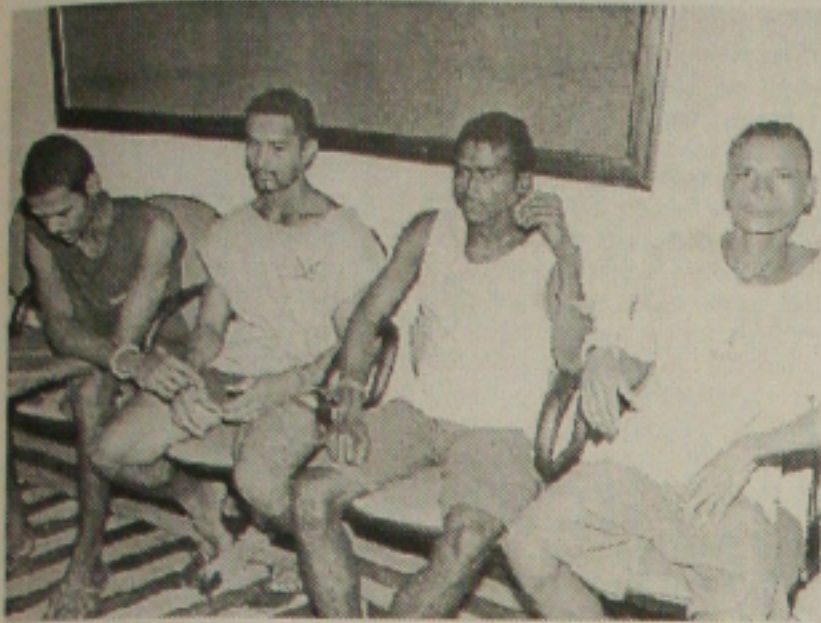
Presos por arrombamento foram apresentados a imprensa

O roubo ocorreu em Nossa Senhora do Socorro, quando a vítima transportava R$ 13 mil