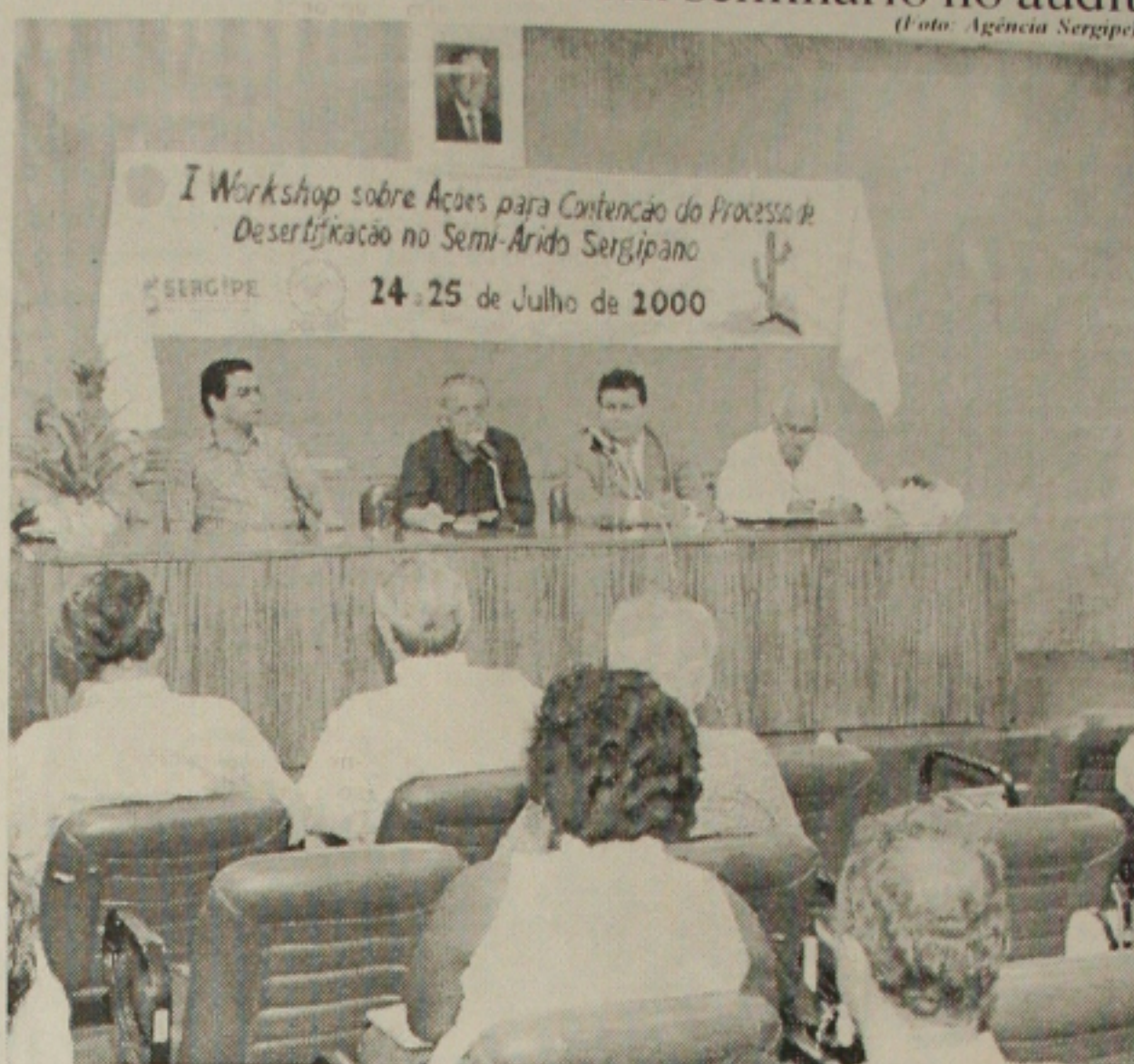
Problema da desertificação no semi-árido é tema de seminário no auditório do Projeto Nordeste

O Banco Postal será o "correspondente bancário" do Banco do Brasil e "Trata-se de um serviço de enorme dimensão social". São os Correios cada vez mais perto dos cidadãos brasileiros, mesmo aqueles que residem em localidades pequenas e distantes, tudo isto sem precisar criar novas estruturas, mas aproveitando os pontos já existentes. A meta é abrir 500 agências até o final deste ano.