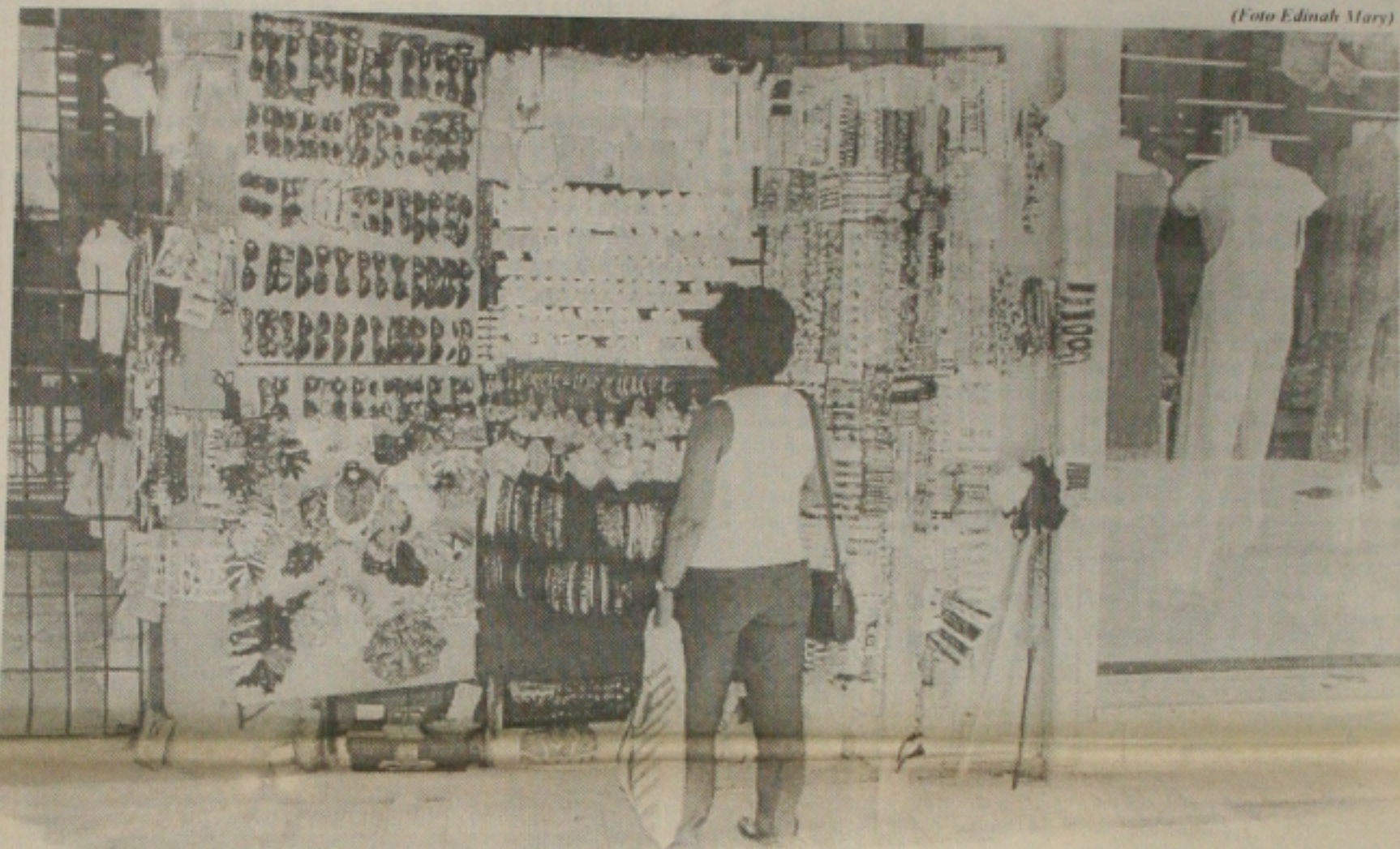
Até a quinta-feira, a PMA espera ver os calçadões livres das barracas dos camelôs