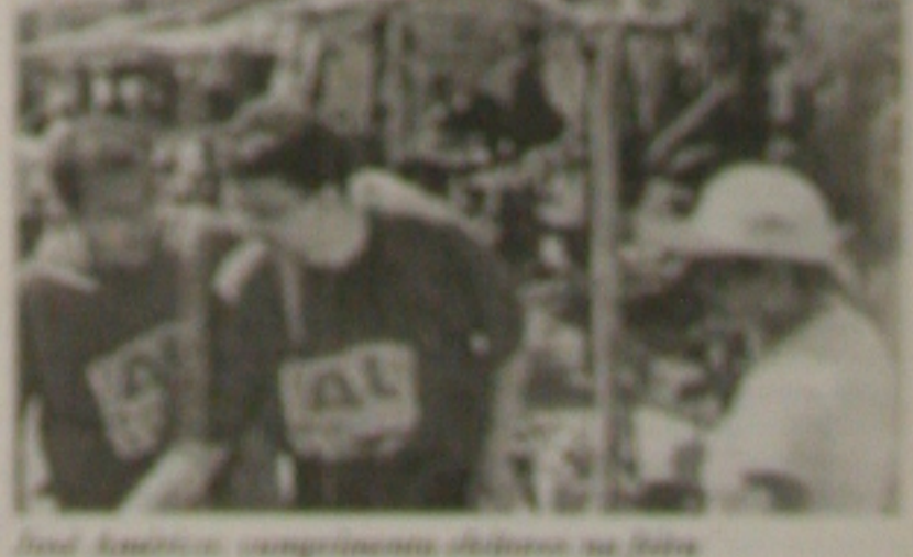
... (caption text)