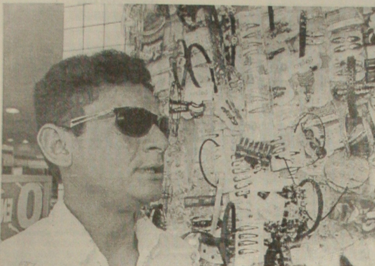
Os camelôs querem um maior prazo da Prefeitura de Aracaju para sair do centro da cidade

Prefeitura de Aracaju determina a saída dos ambulantes das áreas do centro da cidade