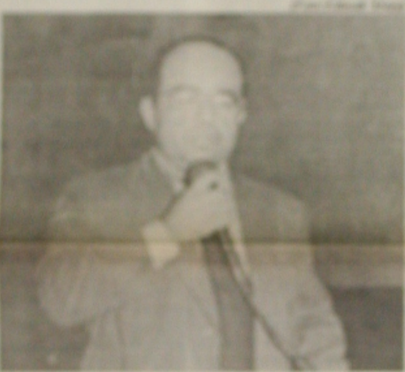
... (caption text)