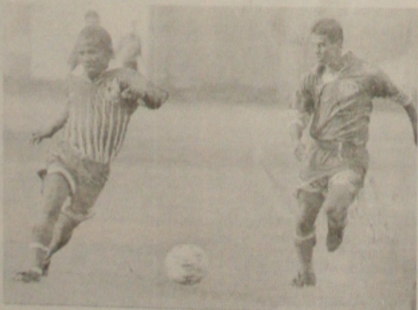
O Confiança volta a enfrentar o Gararu no Sabino Ribeiro