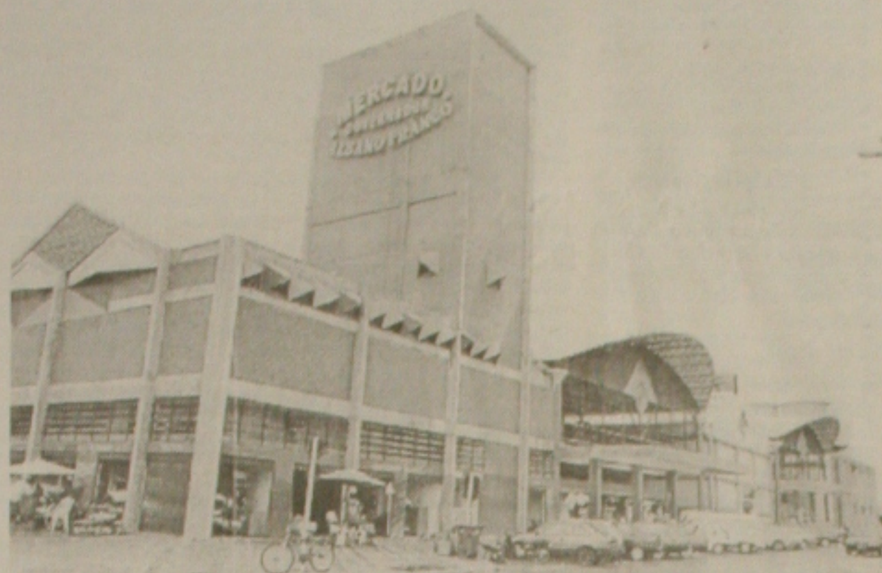
Piso do Mercado Albano Franco será concluído pela Celi