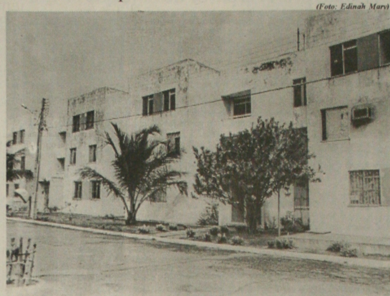
Os moradores do Condomínio Mar Mediterrâneo estão preocupados com futuros despejos