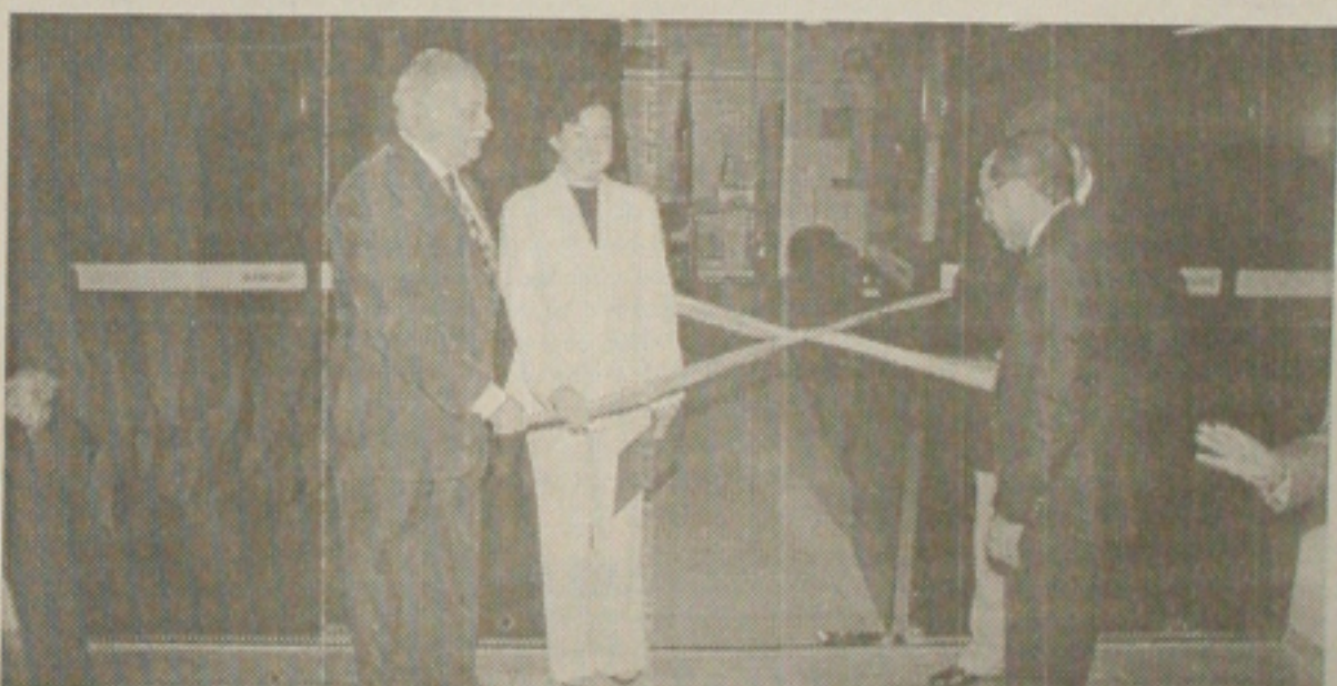
Abertura da fita simbólica de inauguração.