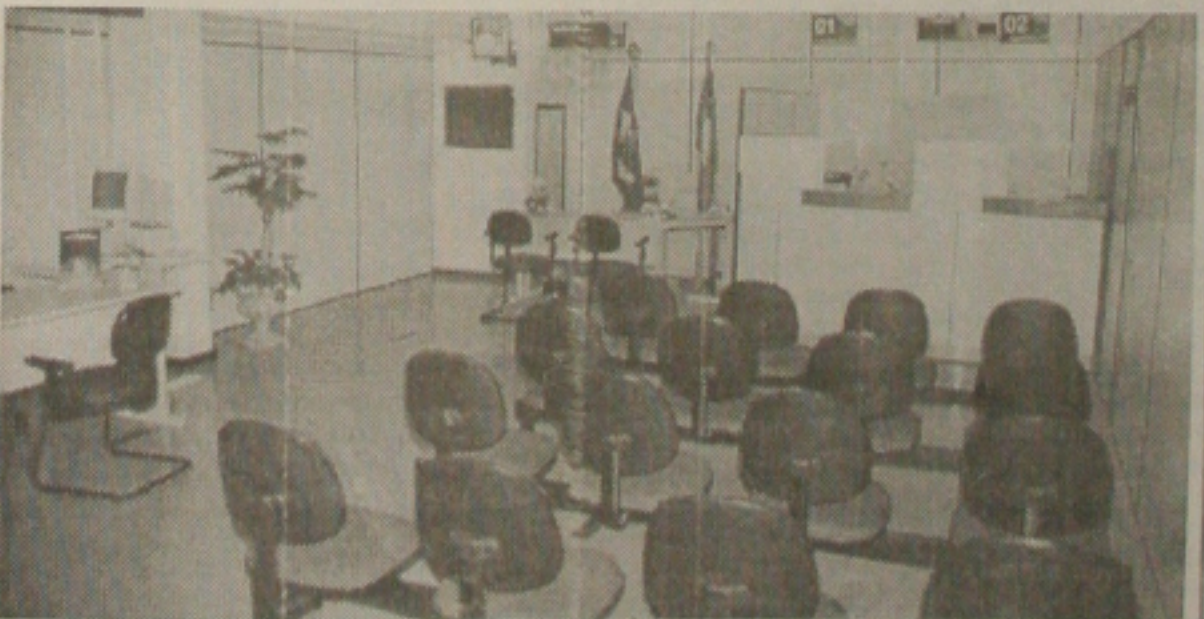
Primeira sala do Posto de Atendimento do Banese no TCE-SE.