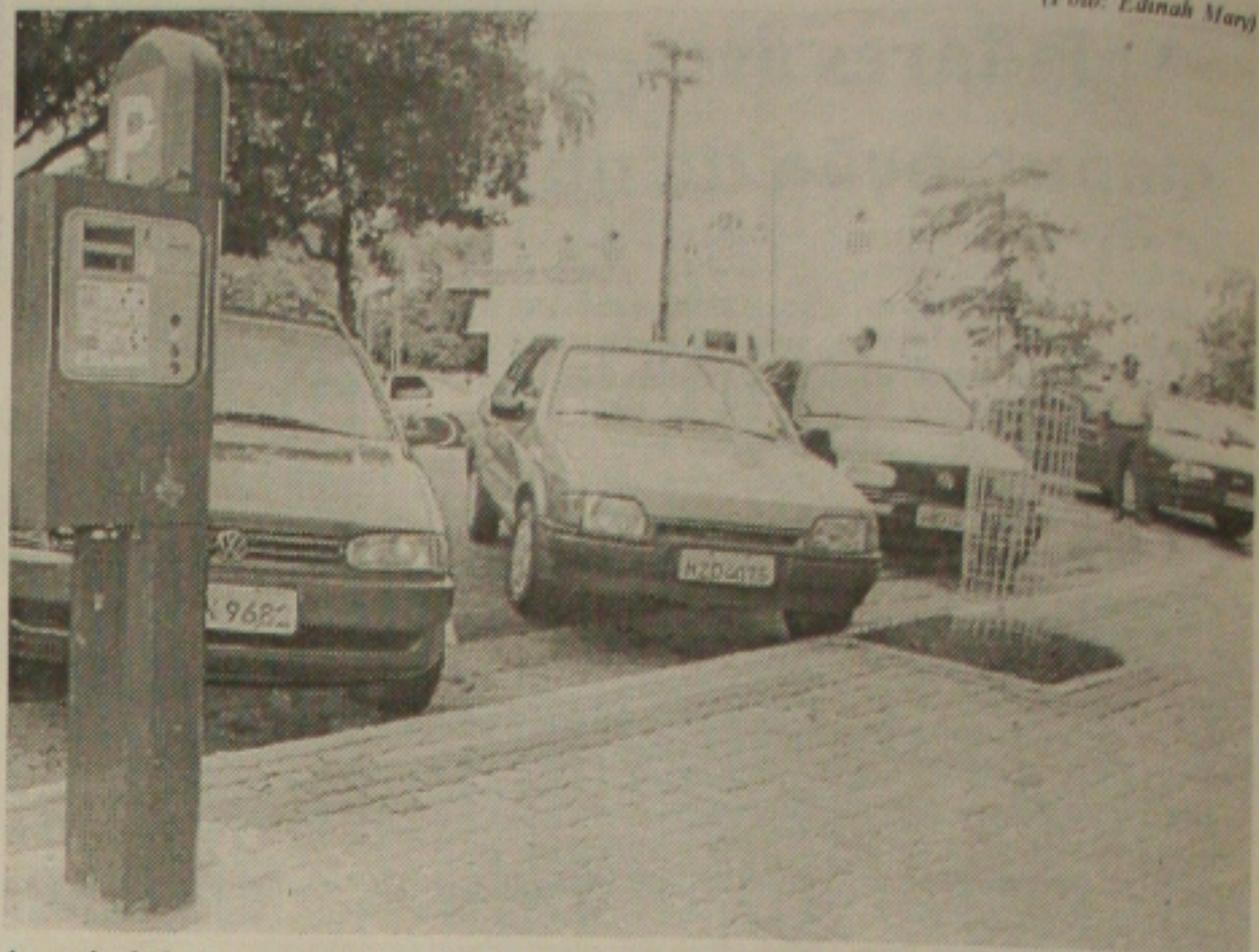
A partir de hoje, sergipanos podem estacionar nas praças públicas

A informática é um segmento que se moderniza com