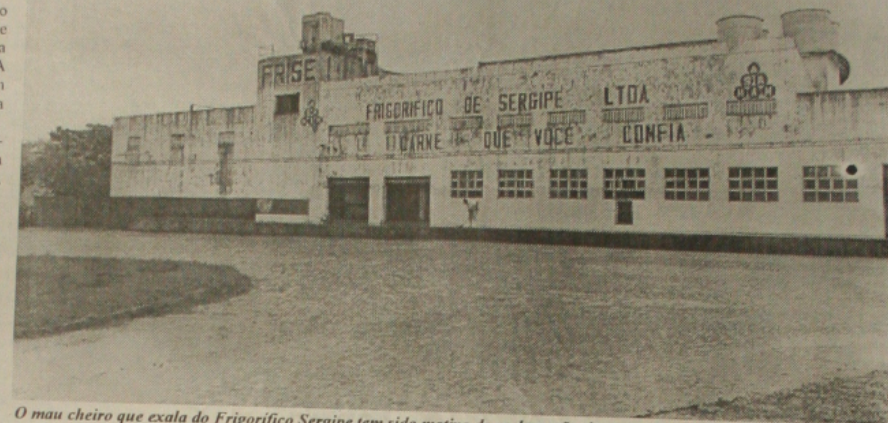
O mau cheiro que exala do Frigorífico Sergipe tem sido motivo de reclamação dos moradores da área

tre as comunidades atingidas estão Sobrado, Parque São José, Loteamento N.S. de Fátima, Conjunto Jardim, Pai André, Santa Cecília, Parque dos Faróis, Guajará, Femandó Collor, Calumby e outras áreas de Socorro que sofrem com o Frigorífico Sergipe.