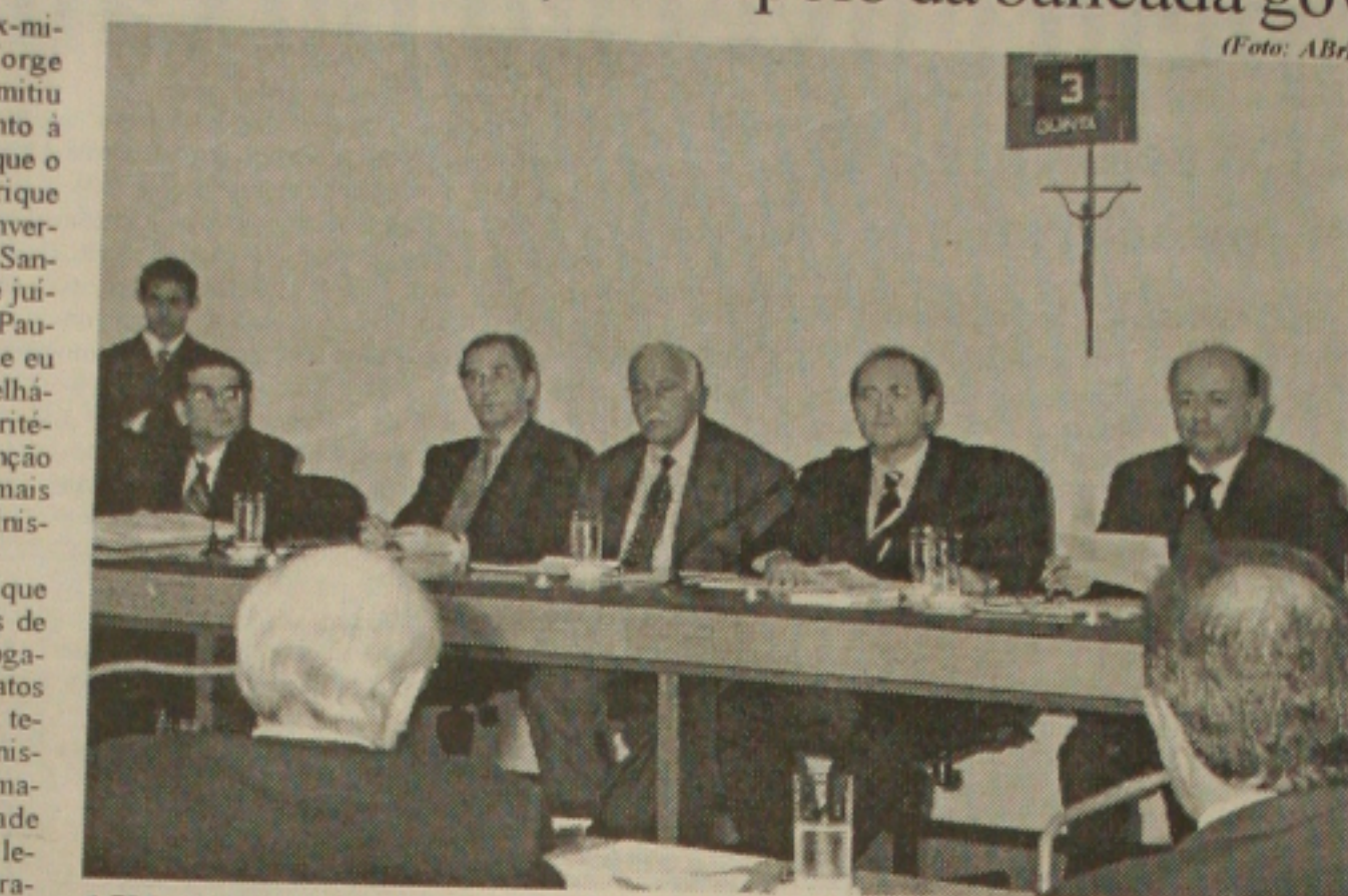
ACM acompanhou todo o depoimento, mas não se posicionou

Brasília (AE) - O comportamento da base aliada no depoimento do ex-secretário-geral da Presidência da República Eduardo Jorge Caldas à subcomissão do Senado, agradou ao Palácio do Planalto. Depois de uma manhã nervosa, por conta das notícias do desequilíbrio emocional e da depressão de Caldas em função das denúncias, a avaliação do governo no início da noite era positiva. Ministros, líderes governistas e assessores do presidente Fernando Henrique Cardo-