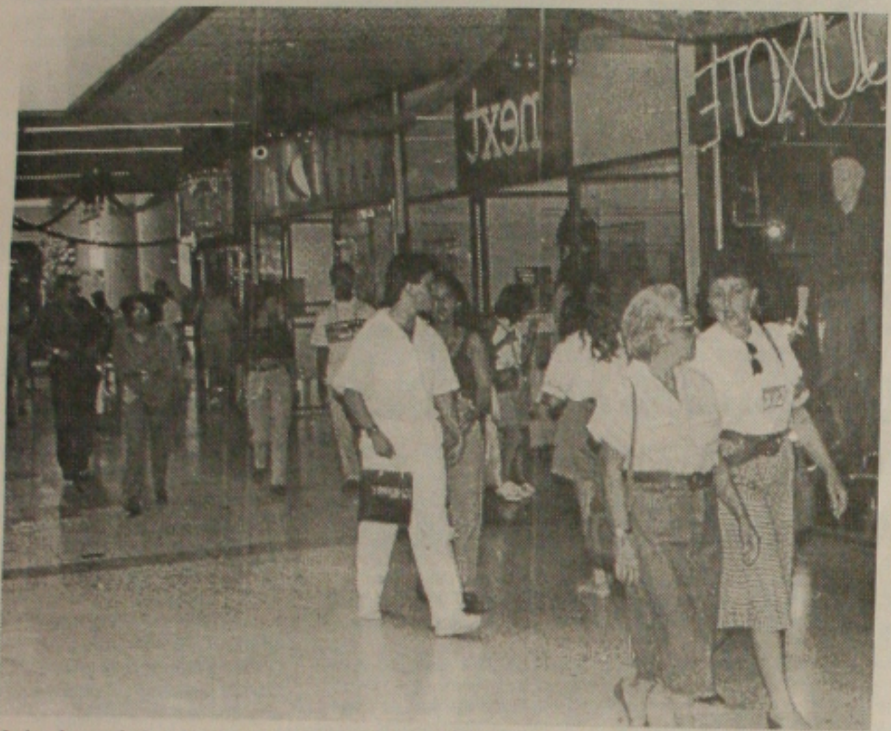
Lojas do comércio e dos shoppings centers foram monitoradas pelos fiscais da Secretaria da Fazenda