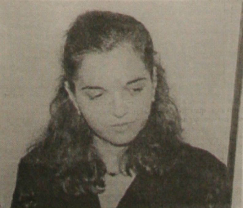
Conceição: "TRE tem até setembro para julgar recursos"